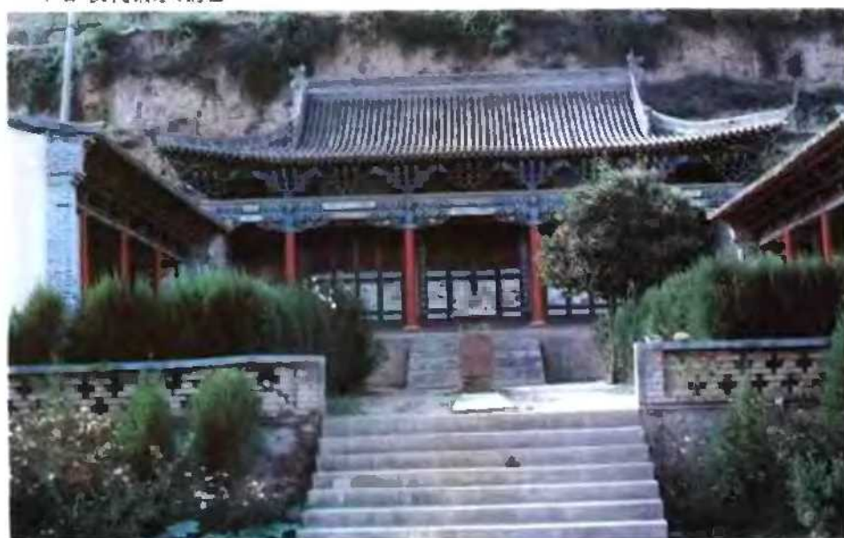
高庙山公园泰山庙