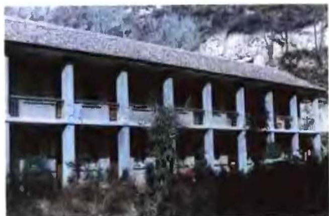
1972年—1983年间的县委常委办公楼