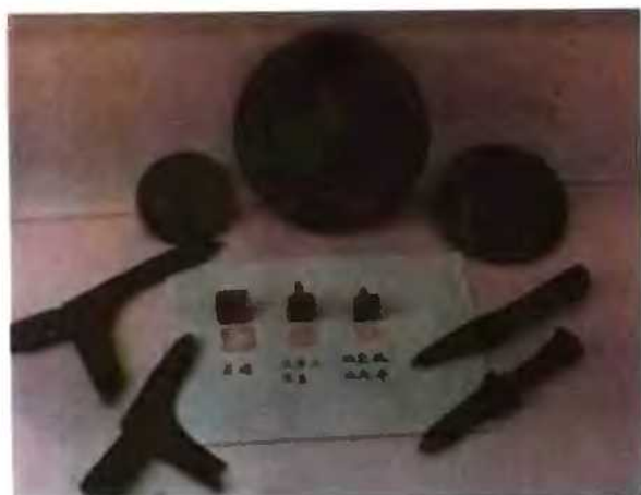
宕昌县文化馆收藏的本县出土文物