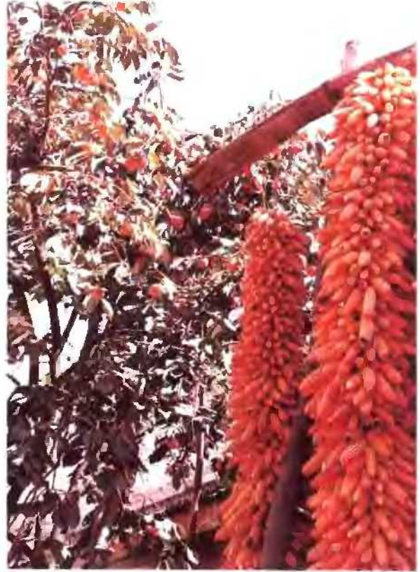
陇南大寨 包谷