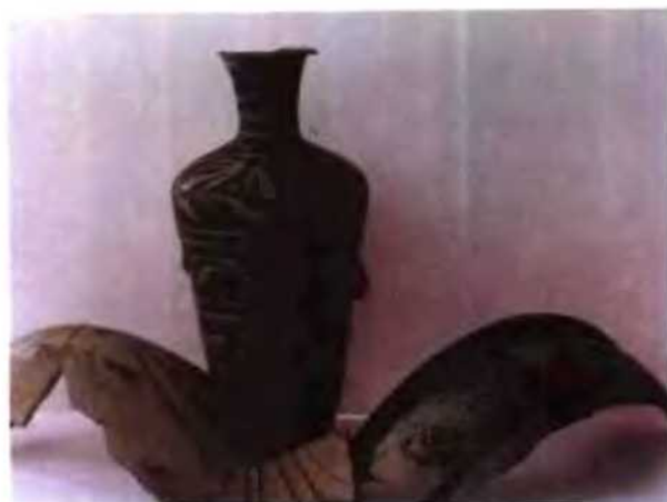
宕昌县文化馆收藏的本县出土文物