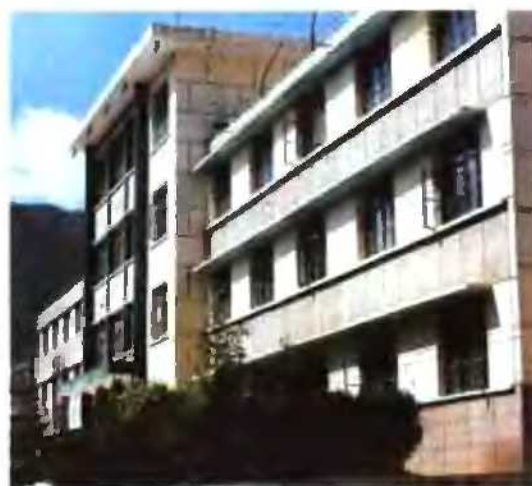
宕昌县人民政府招待所