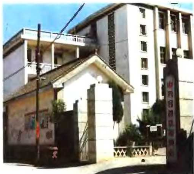
1984年后的县委办公楼