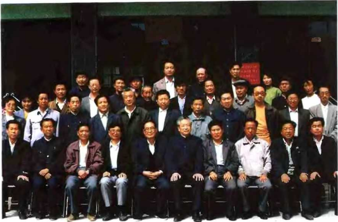
省地县领导和史志学专家、学者、陇南地区各县县志办代表、社会贤达复审《宕昌县志》时合影