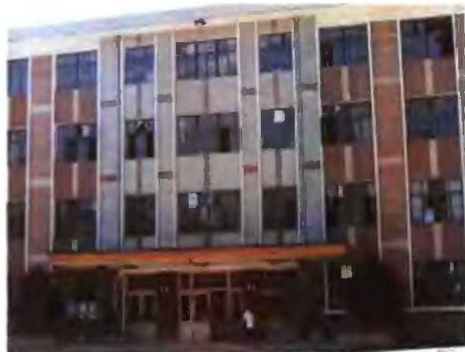
宕昌县人民代表大会常务委员会、中国人民政治协商会议宕昌县委员会办公楼