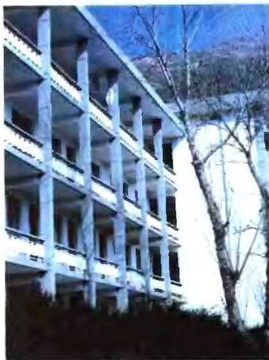
1986年后的县人民政府办公楼