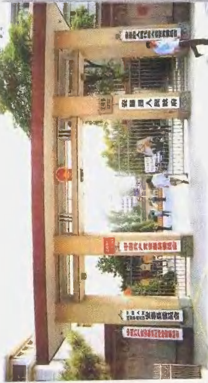
安基县委县政府办公所在地