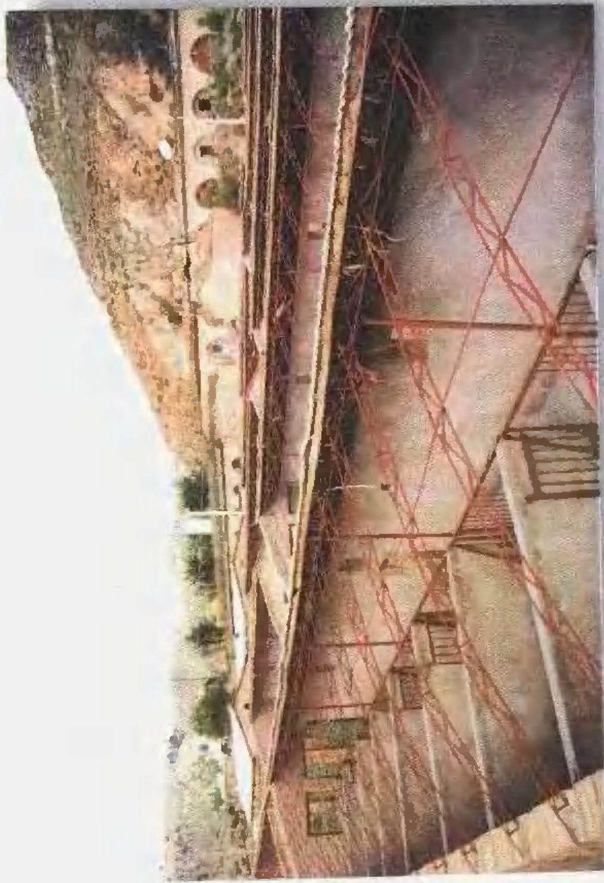
安塞新兴起的养殖场