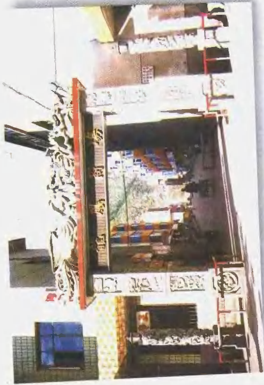
位于安陆县城的龙凤商场