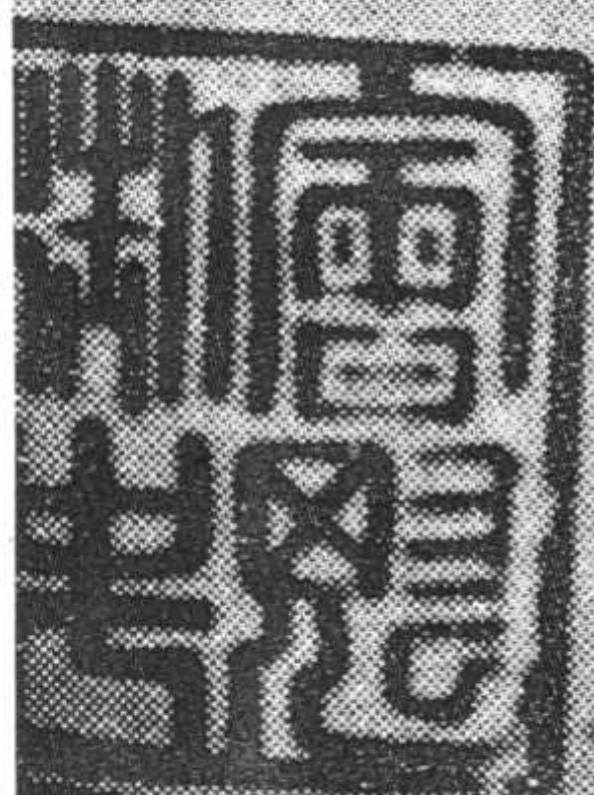
〔万历〕《山西通志》明刻本