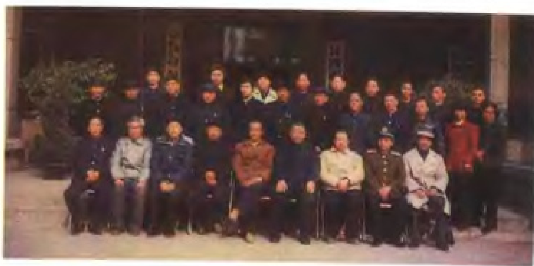
《江西省气象志》首次编 纂委员会会议人员合影