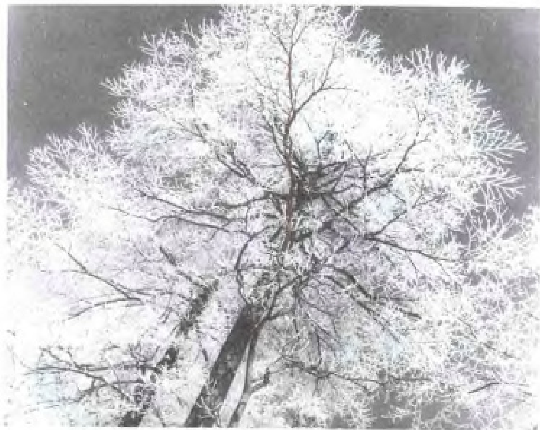
1972年庐山雾凇 “古树银花”情景