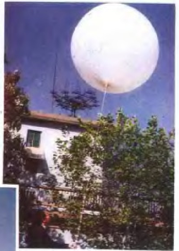
江西省气象台 701 测 风雷达和测风气球