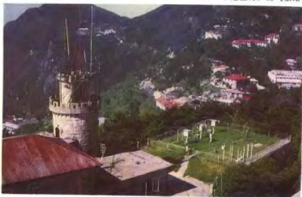
1954年建立的庐山气象站