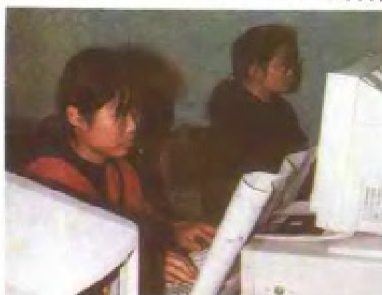
江西省气候中心利用计 算机处理气象报表资料