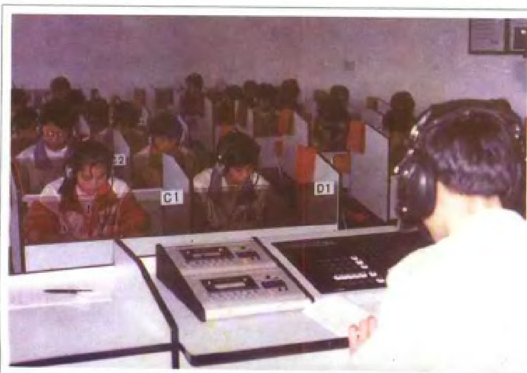
南昌气象学 校电化教学