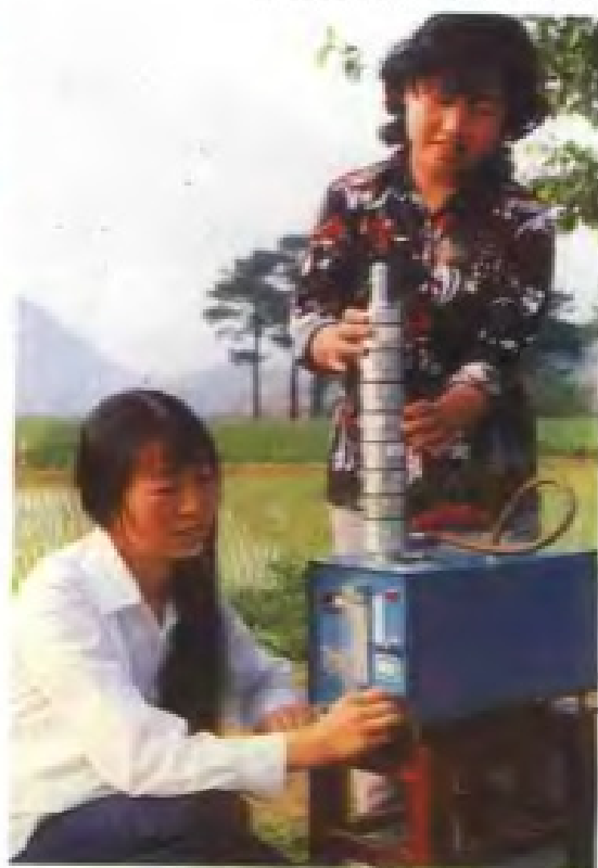
1987年庐山云雾所在 观音桥采取大气化学样品