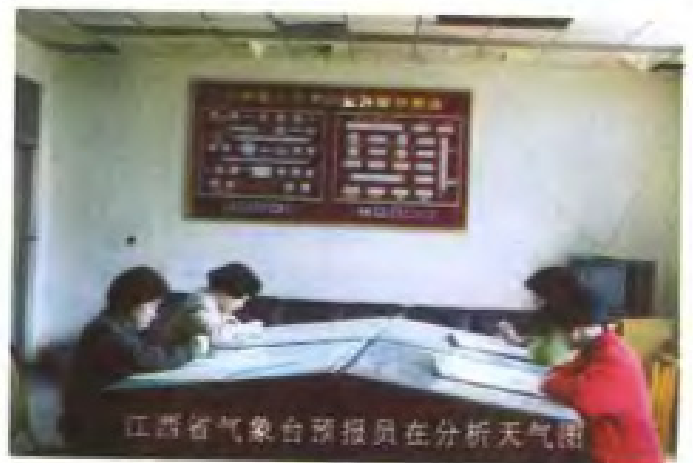
江西省气象台预报员在分析天气图