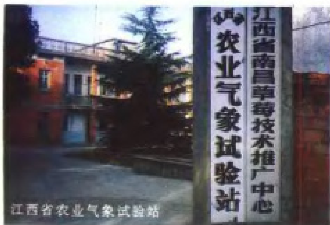
江西省农业气象试验站