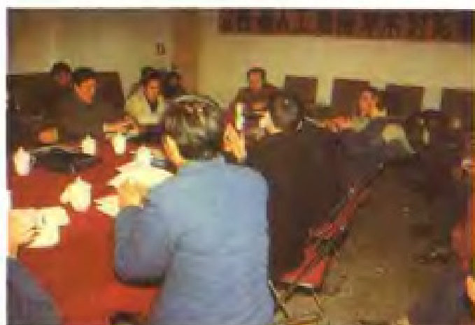
江西省气象局召开人工增雨学术讨论会