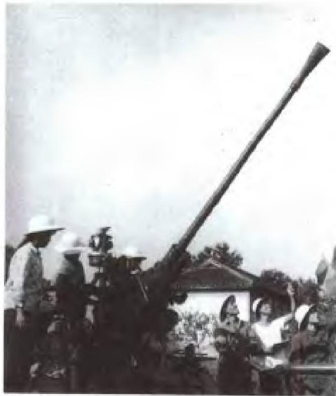
1976年庐山云雾所采用高炮进行人工增雨