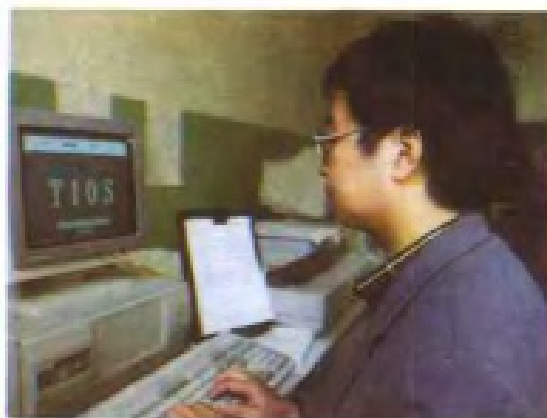
江西省气象台报务员进行 自动输入输出系统操作