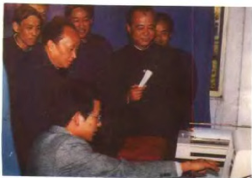
1985年4月国家气象局副局长 章基嘉等领导来江西视察工作