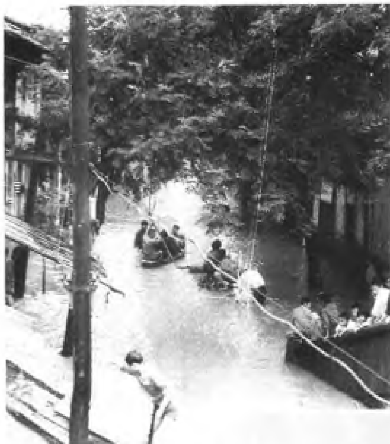
1982年6月17日洪水进入抚州市街道