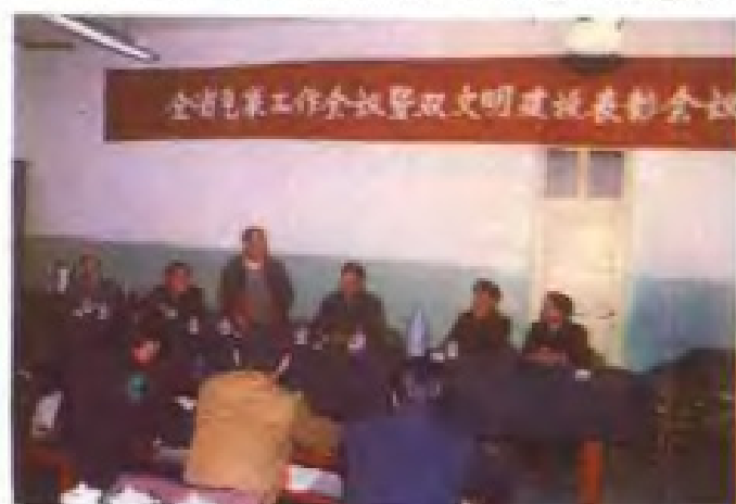
江西省省长吴官正出席省气象工作会议并讲话