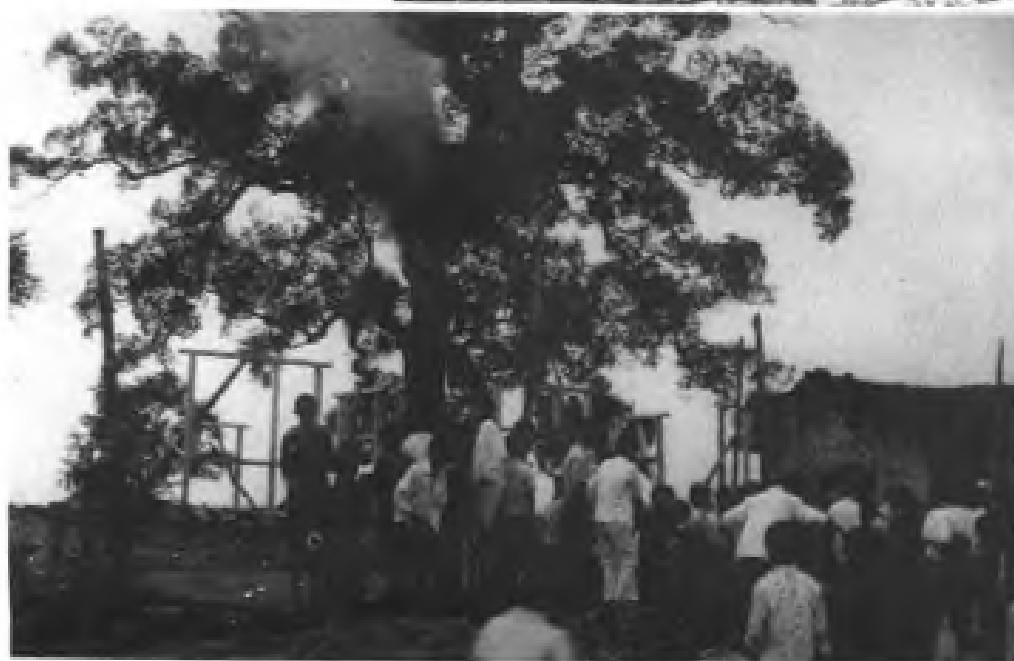
1988年7月17日南丰县洽湾乡西坪村一棵古樟树被雷击燃烧，顶部冒烟