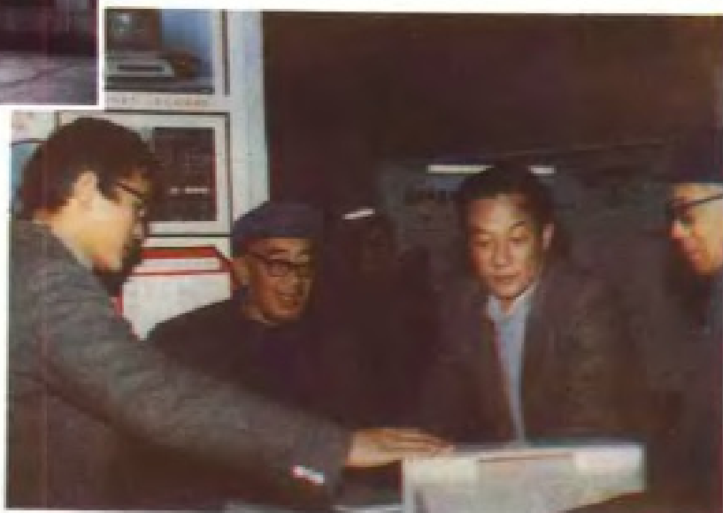
1985年国家气象局局长邹竞蒙 等领导参观江西气象微机展厅