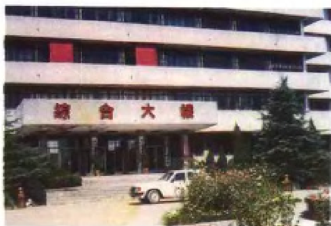
南昌气象学校综合大楼