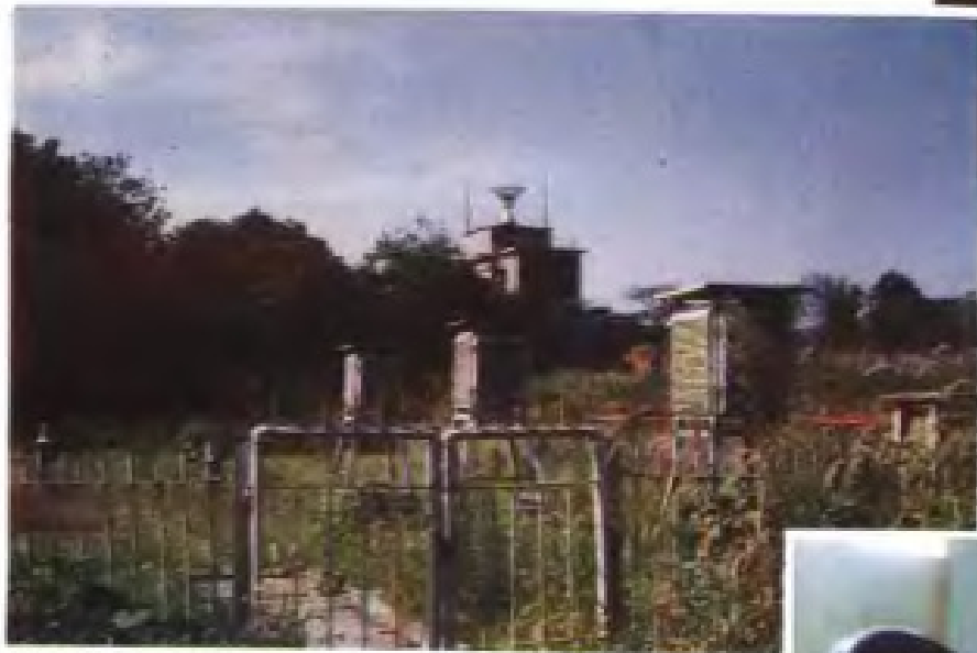
江西省气象台 713 测雨雷达及地面观测场