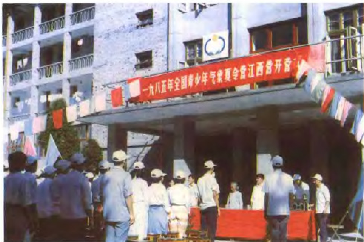
1985年全国青少年气象夏令营在井冈山开营