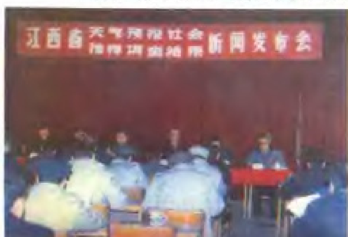
1989年3月9日江西省气象局召开新闻发布会