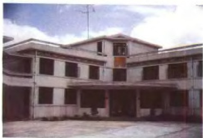
井冈山气象培训中心主楼