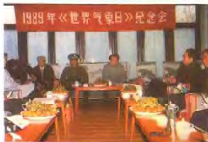
1989年《世界气象日》纪念会在向塘空军驻地召开