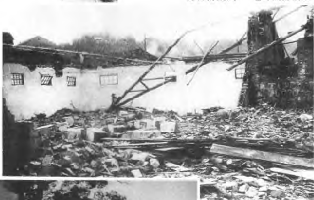
1983年4月9日资溪县城遭受雷雨大风——仓库成为废墟