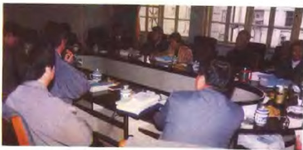
1995年4月20日召开 《江西省气象志》评审工 作会议