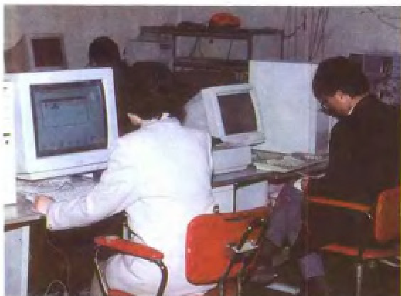
江西省气象局计算机网络 中心工作人员操作情景