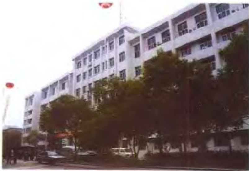
江西省气象局办公楼