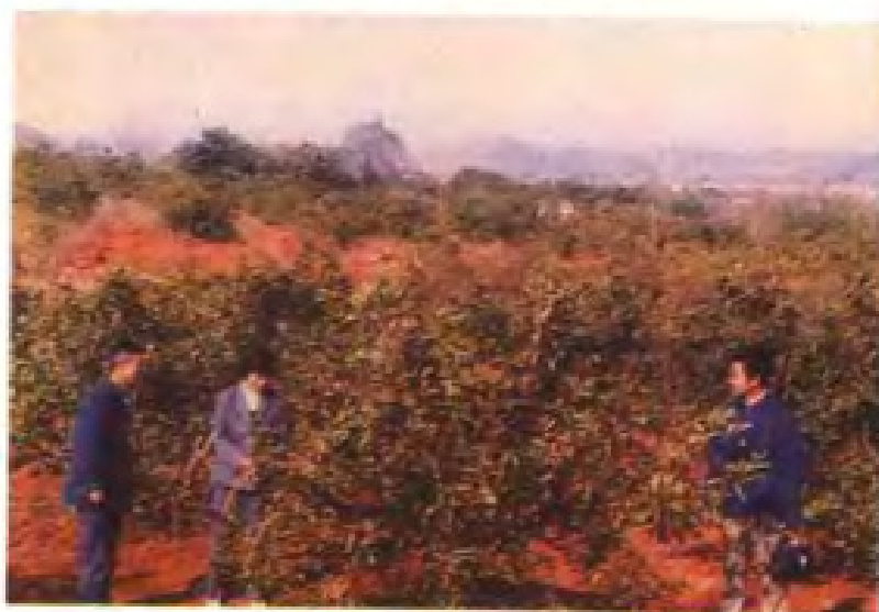
万载县气象局1986年3月18日开展气象咨询服务活动