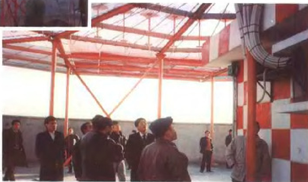
民航专家验收向塘机场全 向信标台(DVOR/DME)