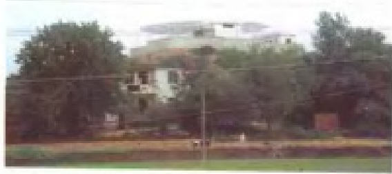
上饶茅家岭导航台新台