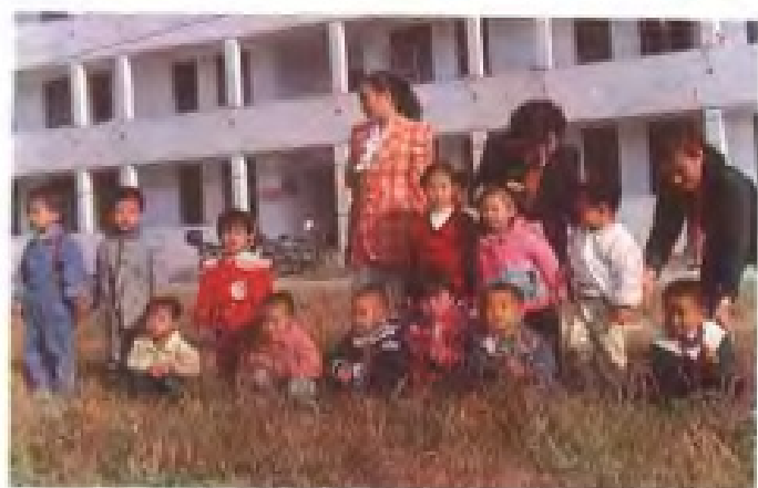
幼儿园的老 师和孩子们