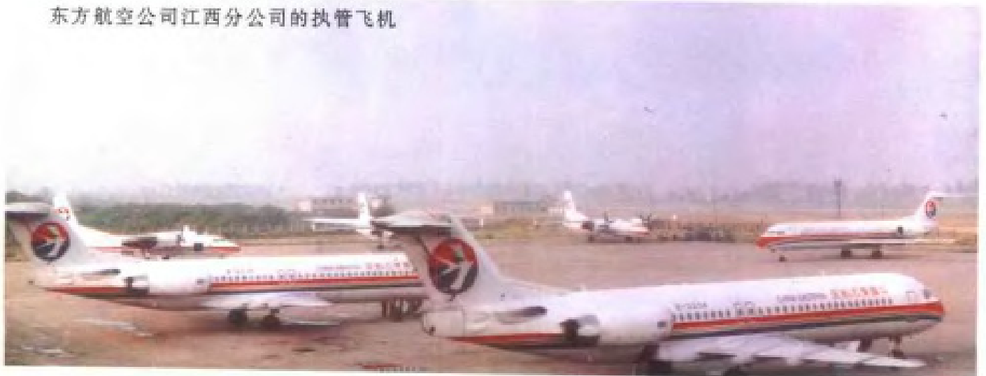
东方航空公司江西分公司的执管飞机