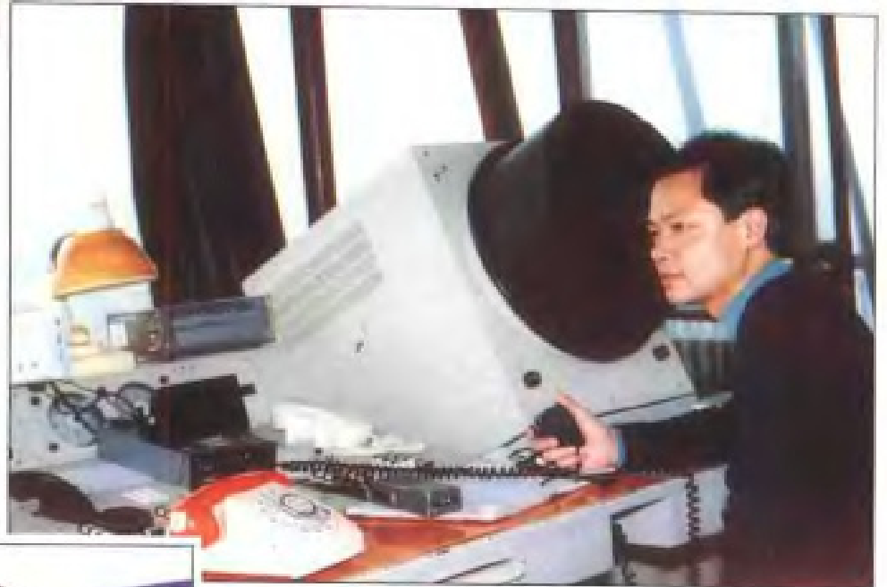
调度人员实施塔台指挥