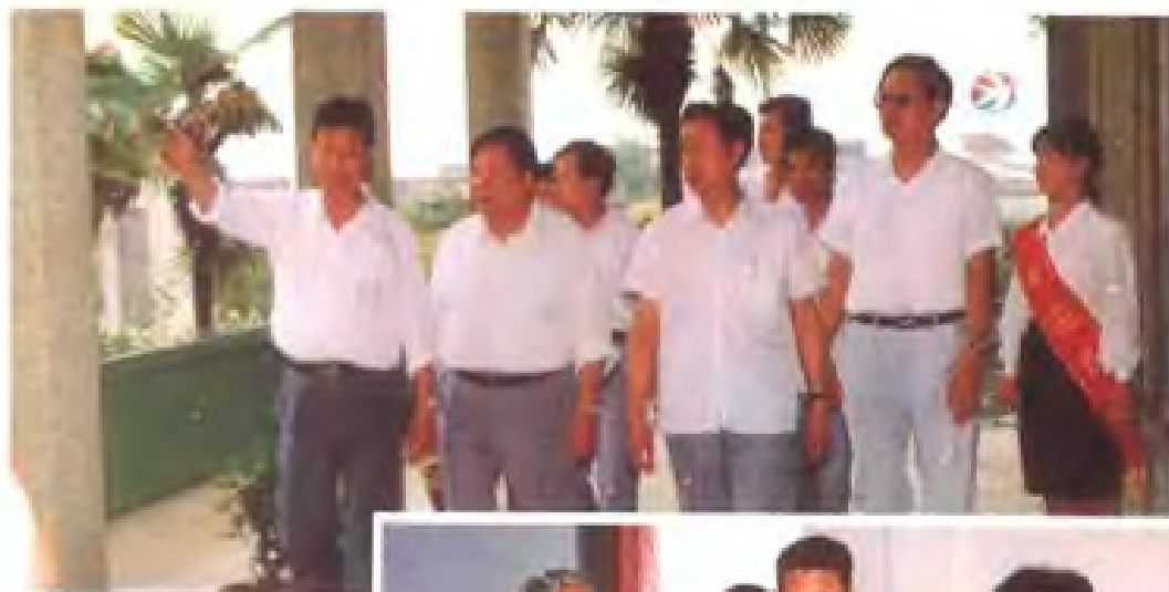
副省长周越平(左二)陪同国家口岸办领导(左三)视察向塘机场