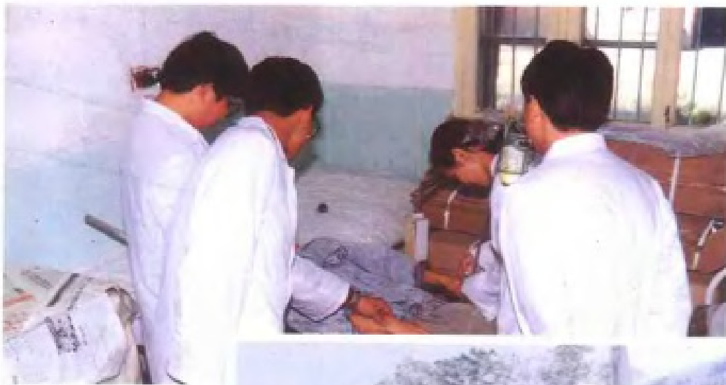
向塘机场抢救中心抢救患病旅客