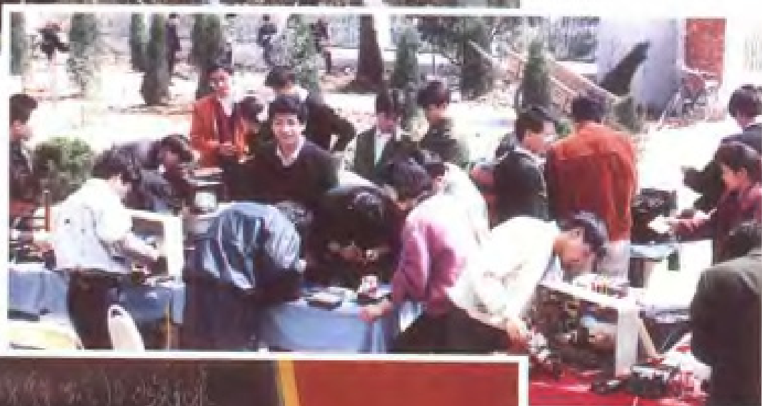
共青团员开展 学雷锋活动