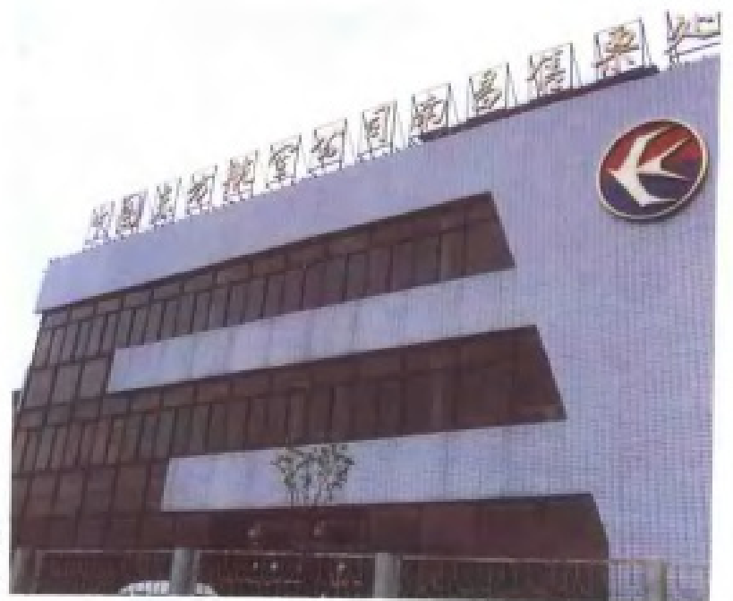
东方航空公司江西分公司南昌售票处