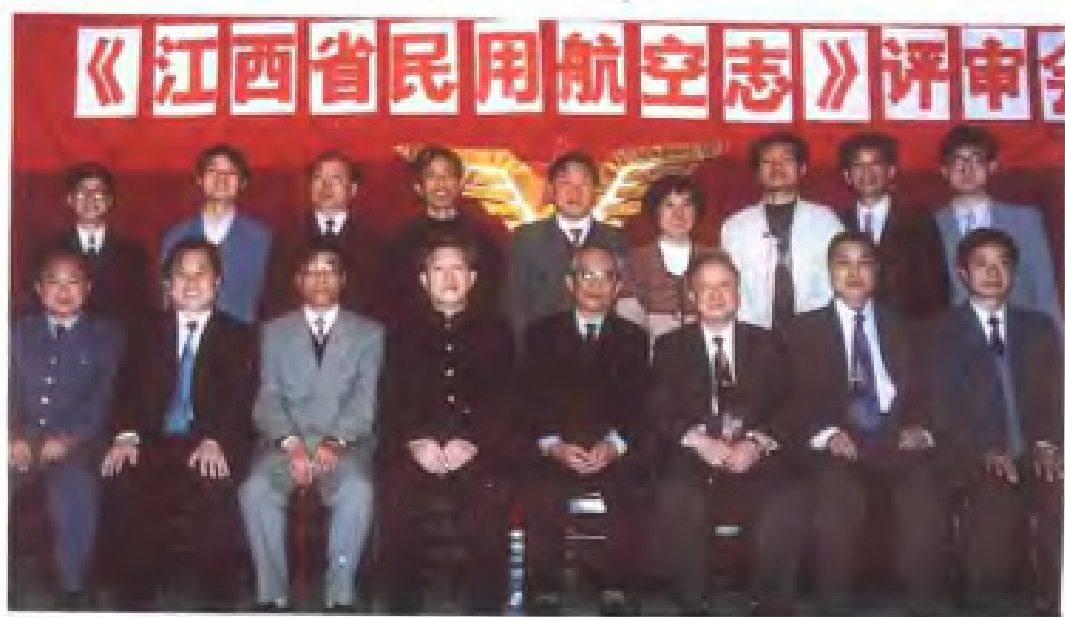
参加志稿评审 会的人员合影