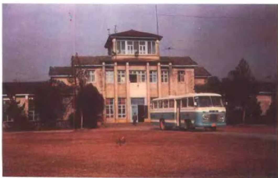
赣州黄金机场候机楼