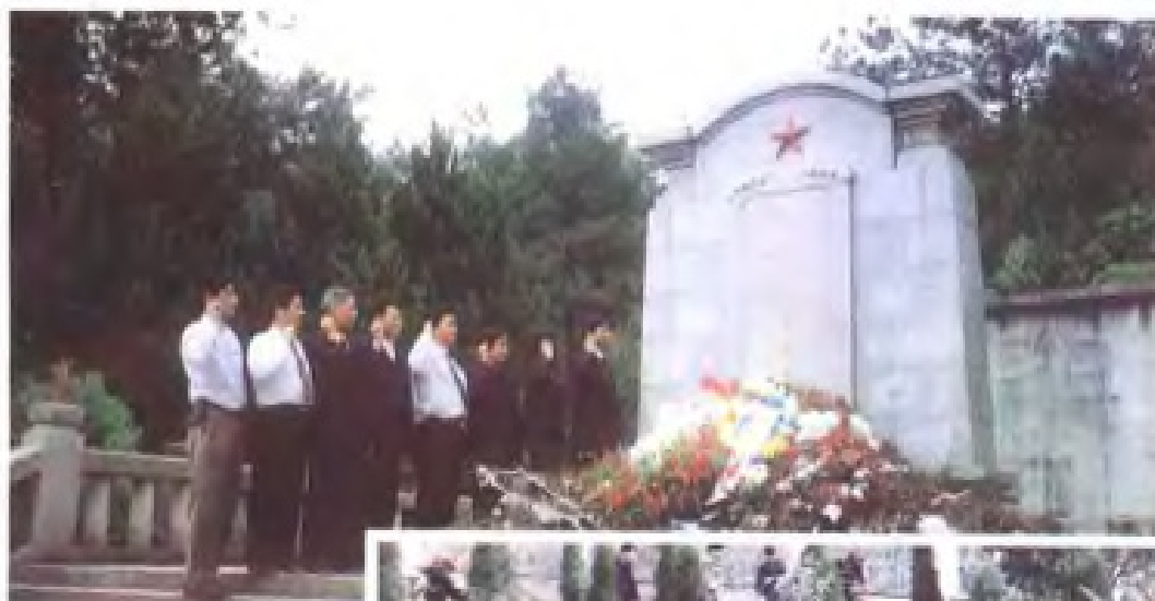
在方志敏烈士墓前 进行革命传统教育