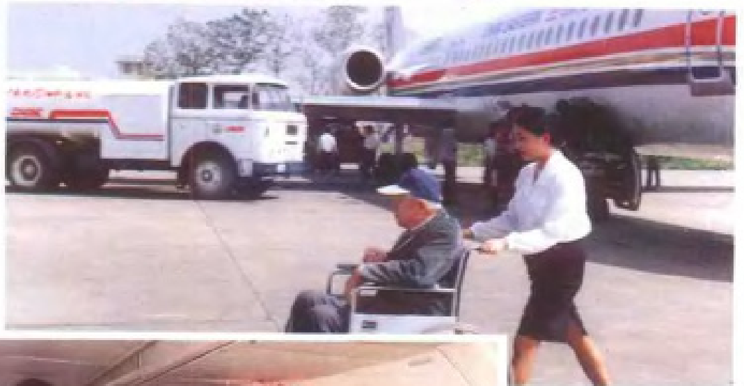
乘务员为老年旅客提供轮椅服务