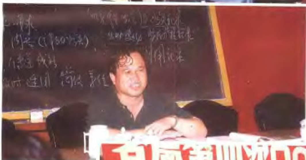
民航江西省局领导为 基层干部讲授运输生 产现场管理知识