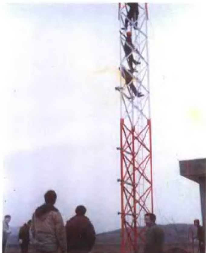
安装九江机场仪表着陆系统