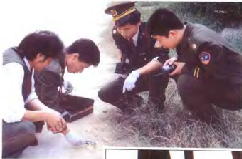
公安干警勘查犯罪现场