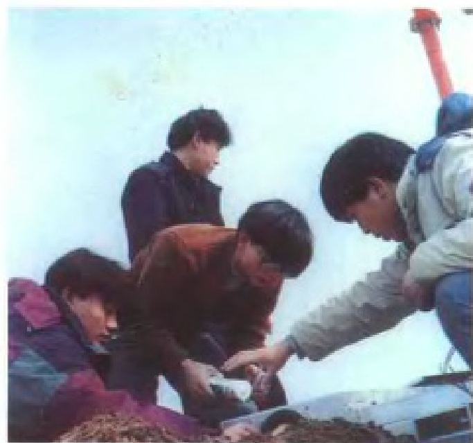
安装向塘机场盲降设备