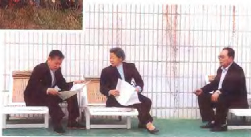
离退休干部 在看报学习