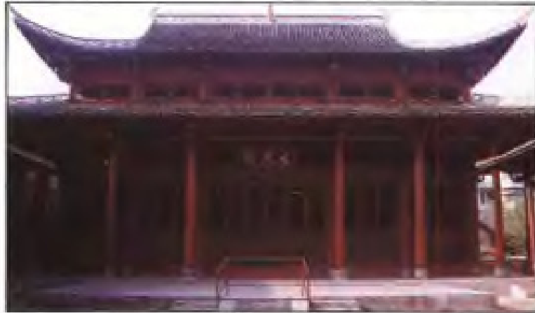
新余市文庙始建于唐大历八年(773),宋、元、明、清曾先后 25 次重修。这是 1984 年重修的新余市文庙。