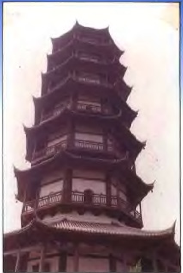
建于唐天复四年至天祐四年(904~907)的南昌市绳金塔。