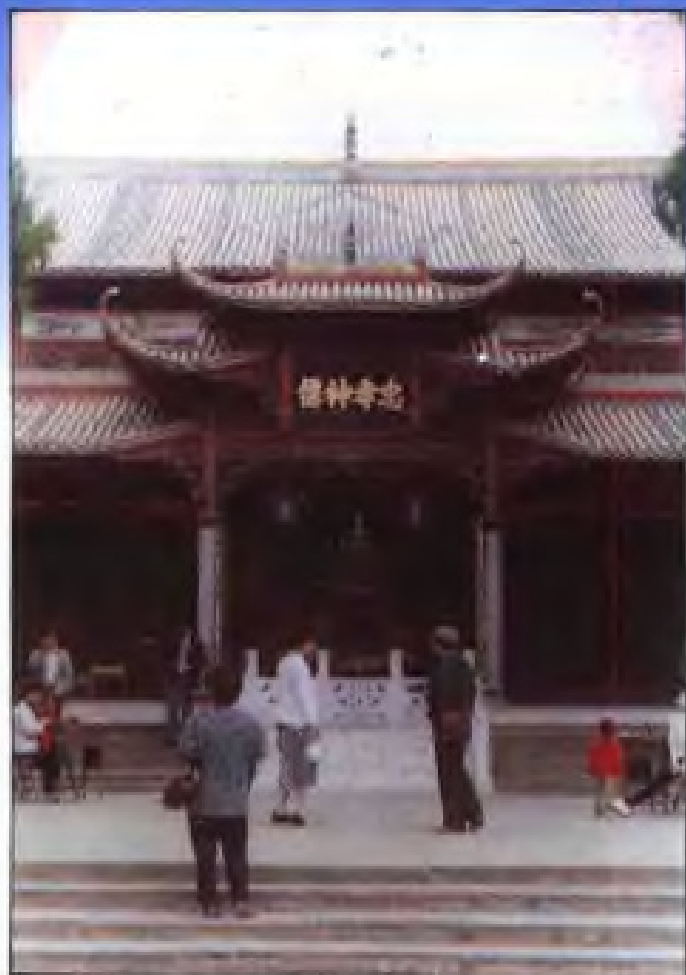
南昌西山万寿宫始建于东晋太元元年(376),称“许仙祠”,宋改名“玉隆万寿宫”,现存殿阁为明清建筑,这是1980年重新修建的高明殿。