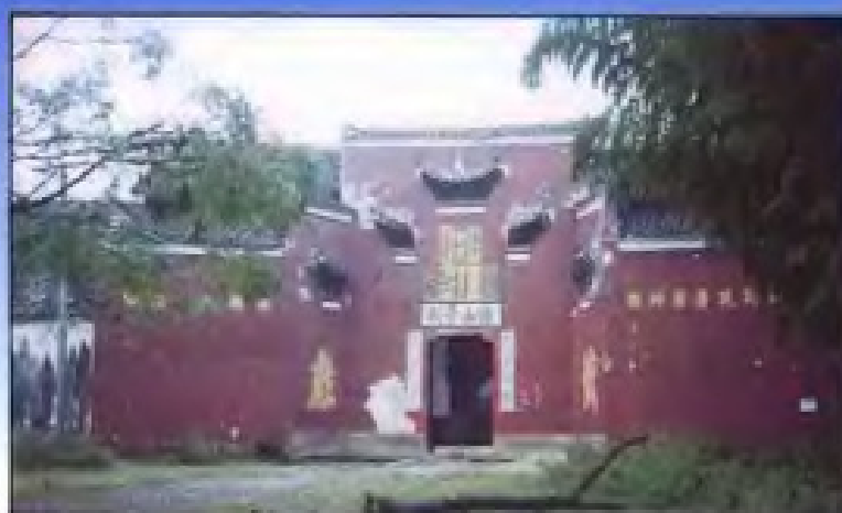
始建于唐中和三年(882)的金溪县疏山寺。