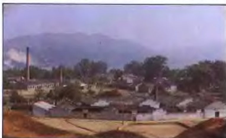
唐代在今吉安县永和镇建吉州窑,烧制黑釉瓷。这是建国后重建的吉州窑。