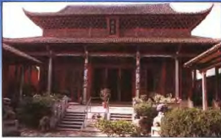
始建于唐武德年间(618~626)的萍乡市文庙大成殿。