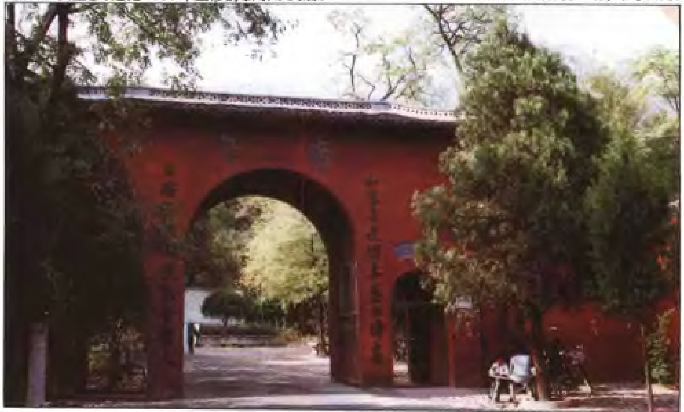
始建于南唐的庐山秀峰寺山门。