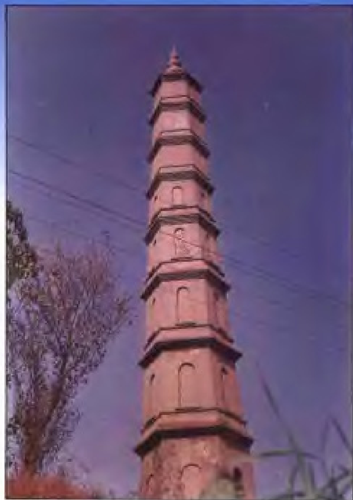
始建于三国吴赤乌二年(239),建国后进行了全面修整的吉安市古南塔。