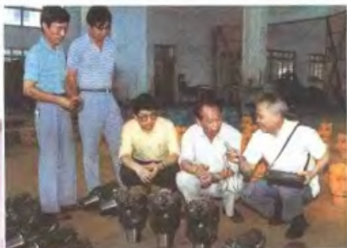
记者深入基层采访