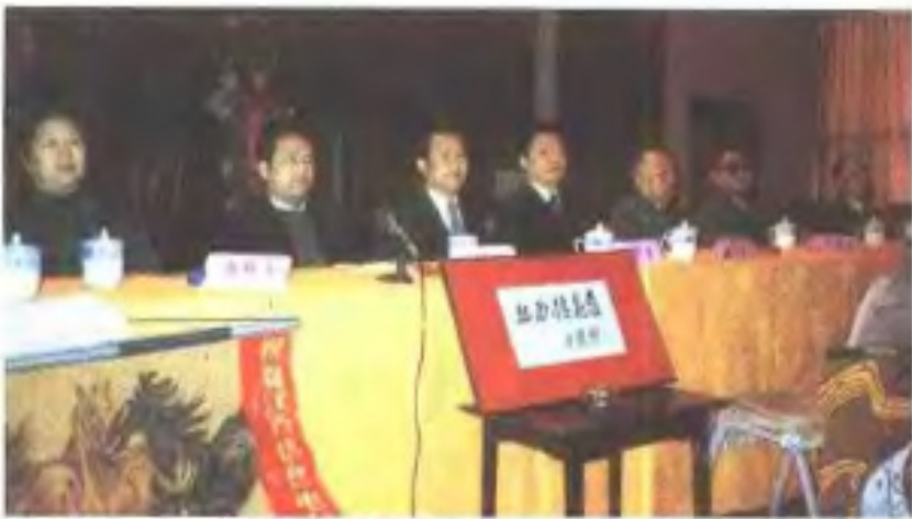
江西信息广播电台开播(1993年4月)