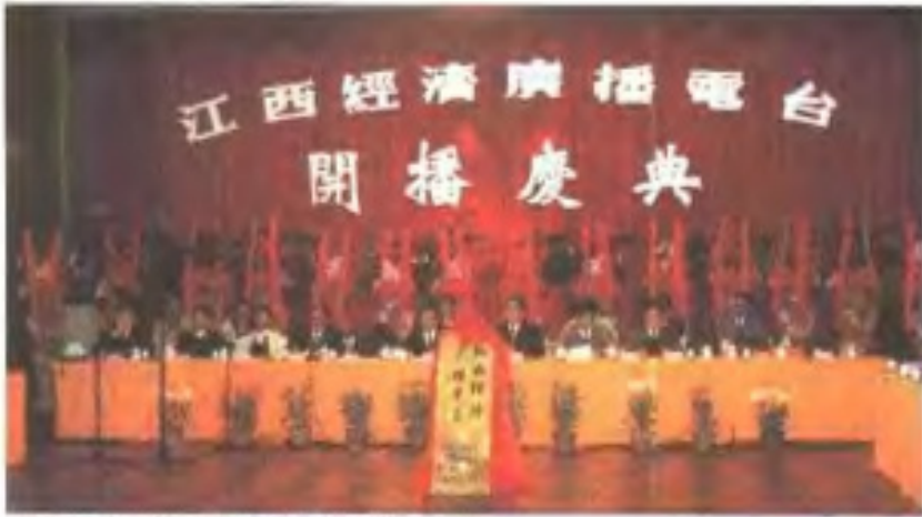
江西经济广播电台开播(1993年11月)