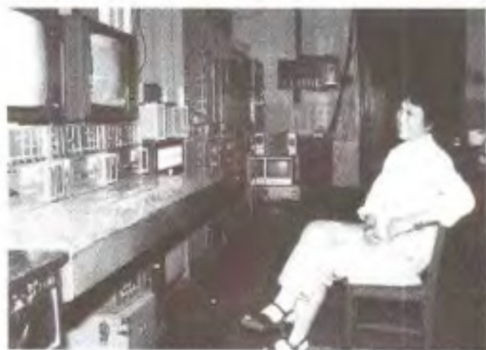
70年代的江西电视台微波机房