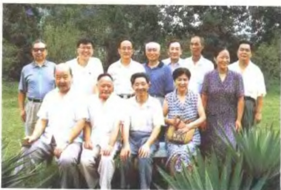
《江西省广播电视志》编纂人员合影