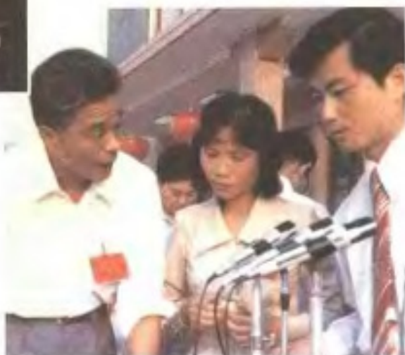
国庆 35 周年庆典现场直播