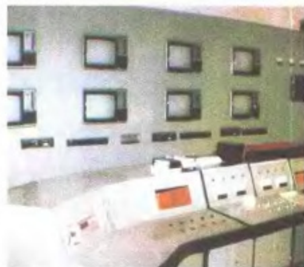
江西第一个行政区域性有线电视台—赣兴有线电视台