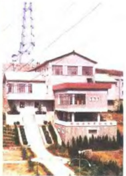
江西最大的电视调频 微波骨干台七〇二台