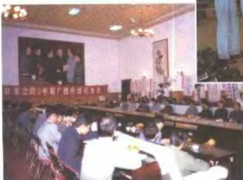
《红军之路》专题广播开播