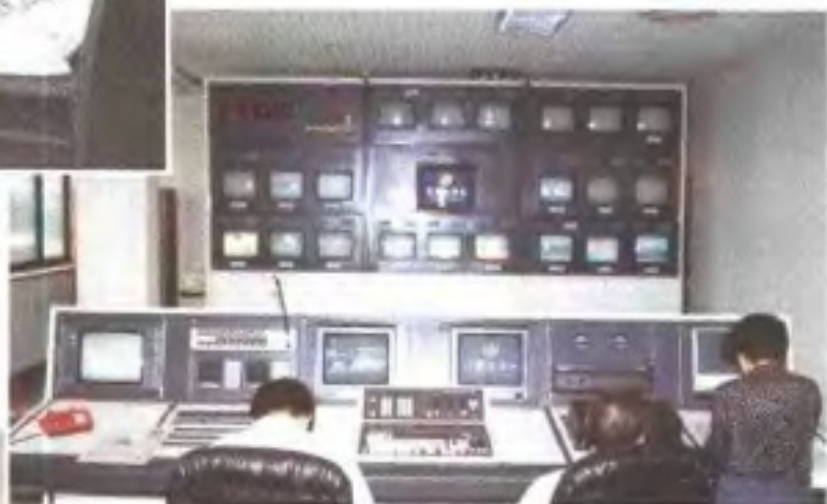
90年代的江西电视台播控机房