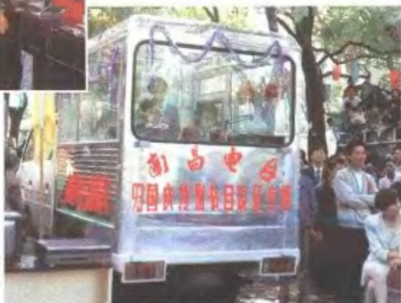
南昌人民广播电台 开出直播车现场直 播国庆特别节目