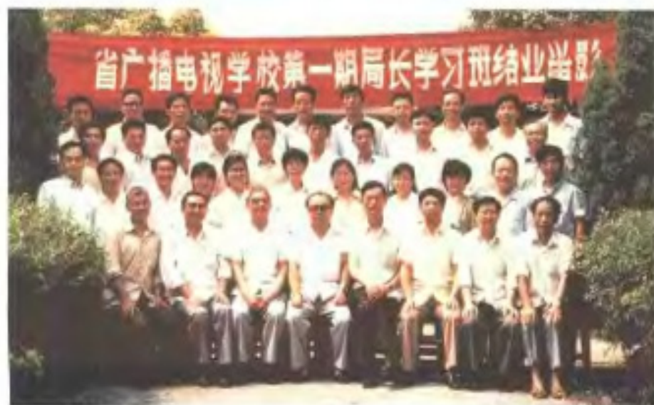
首届地、县广播电视台 局长学习班 (1987年)