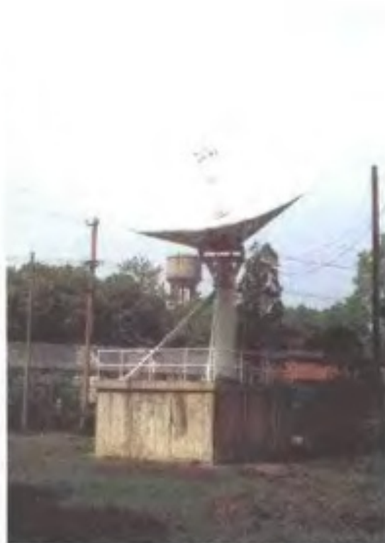
国务院赠送给老区的第一座地面卫星站在江西建成开通