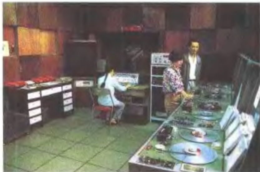
90年代的江西人民广播电台播出机房