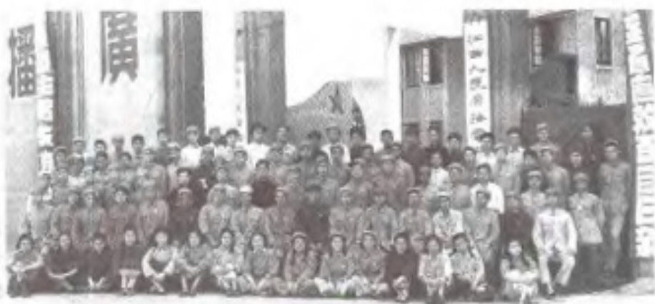
江西人民广播电台建台 2周年，南昌人民广播 电台成立纪念日全体职 工合影 (1951年8月)