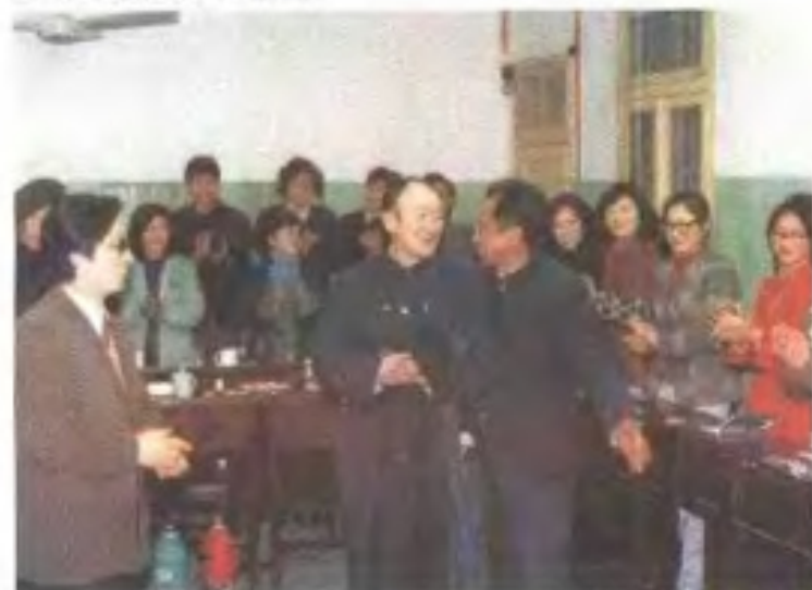
著名播音员夏青来讲课