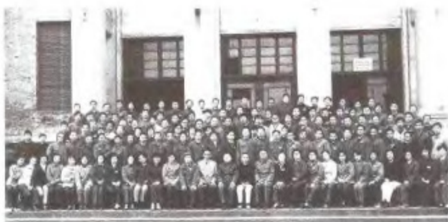
全省首届广播新闻业务 学习班 (1982年11月)