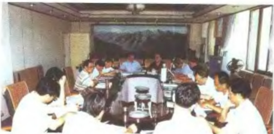
1998年6月召开的《江西省广播电视志》编委会议，确定诸多重大原则问题