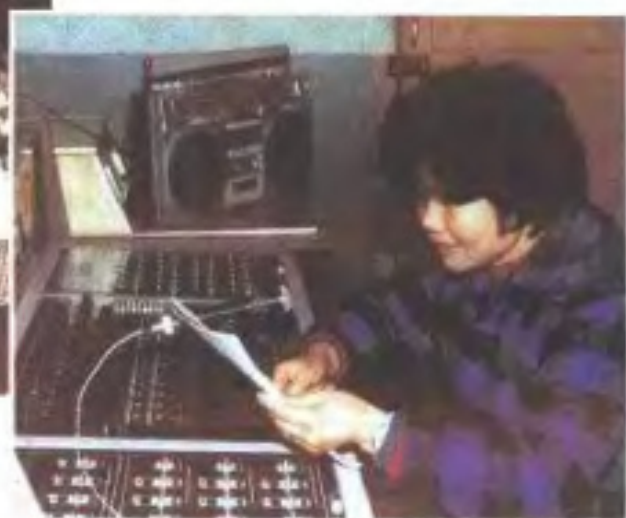
江西第一个乡镇广播站—高安县杨圩乡广播站