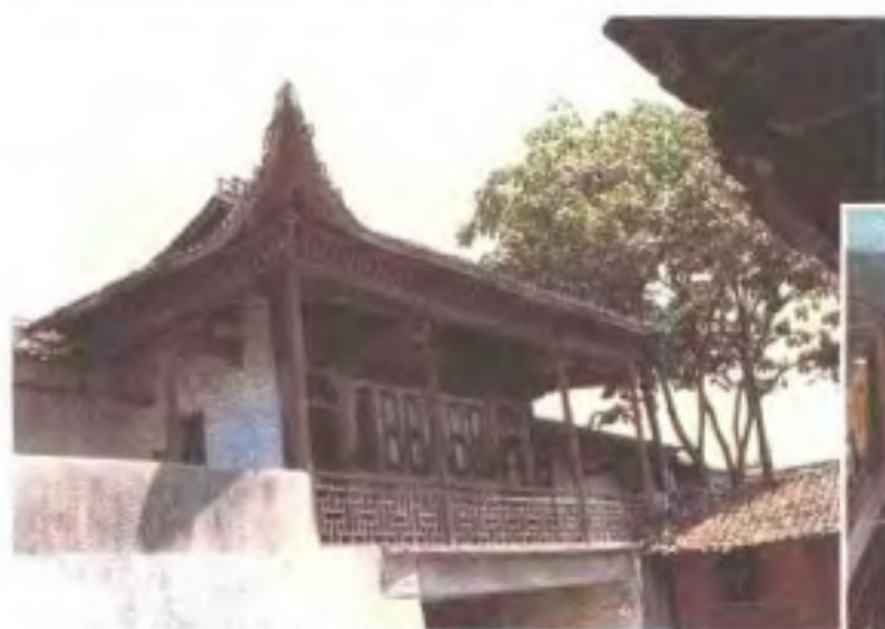
江西第一个县级广播站—高安广播站