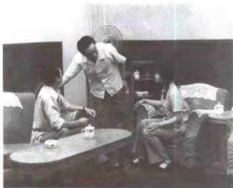
江西摄制的第一部电视剧《豆蔻花开》