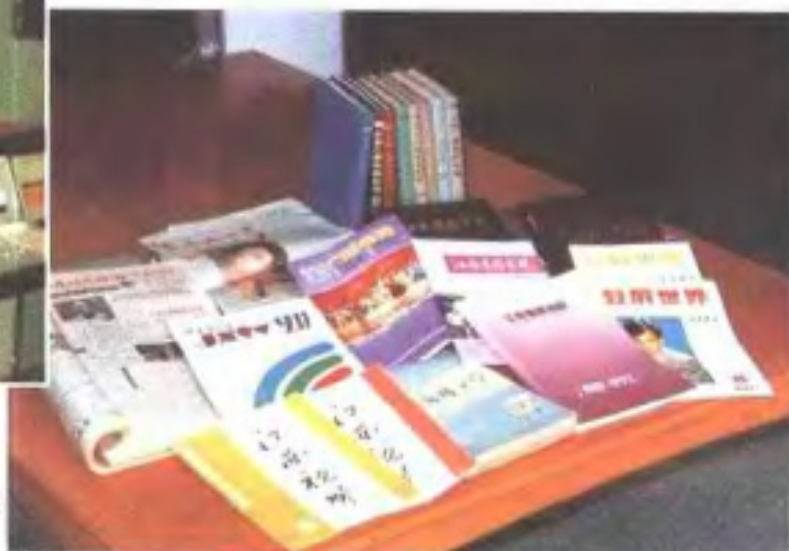
省广电厅(局)编辑出版的部分书、报、刊