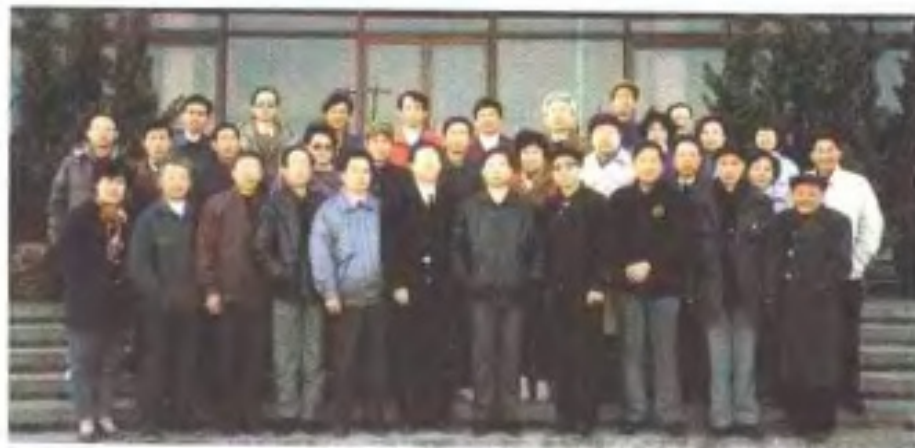
1993年12月全省广播电视史志工作会议在南昌召开