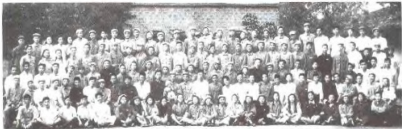
江西人民广播电台举办 首届训练班 (1950年5月)