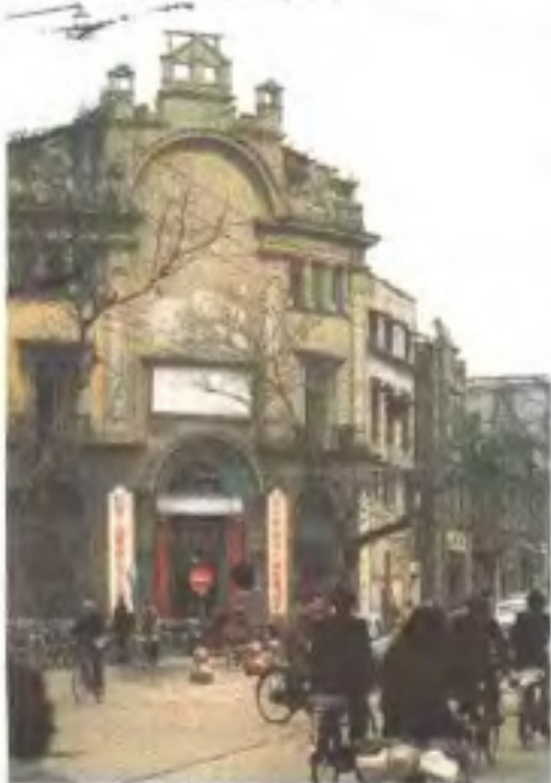
江西广播电视器材公司外景