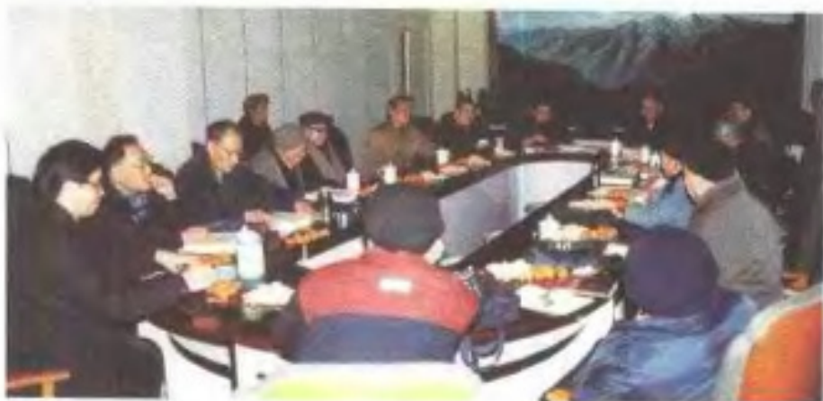
史志编辑部多次召开不同类型座谈会，广泛征集修志意见