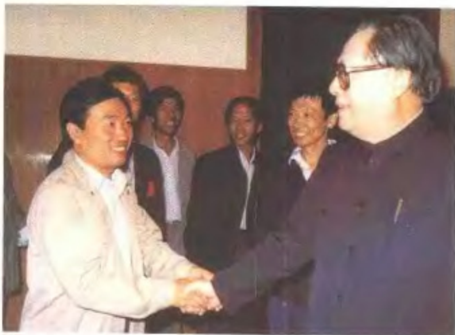
中共中央总书记江泽民视察江西时对 随同采访的江西电视台记者说：“你们 辛苦了！”（1989年10月）