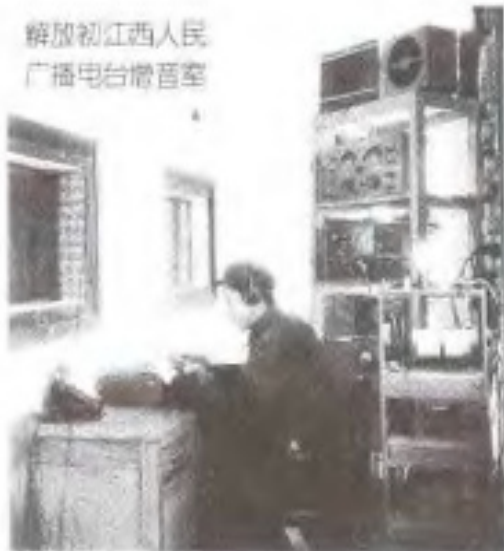
解放初江西人民 广播电台播音室