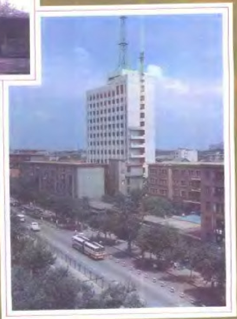
1991 年 7 月 5 日,座落在南 昌市阳明路 143 号的江西省 公安厅通讯大楼交付使用, 主楼共 12 层,高 65 米