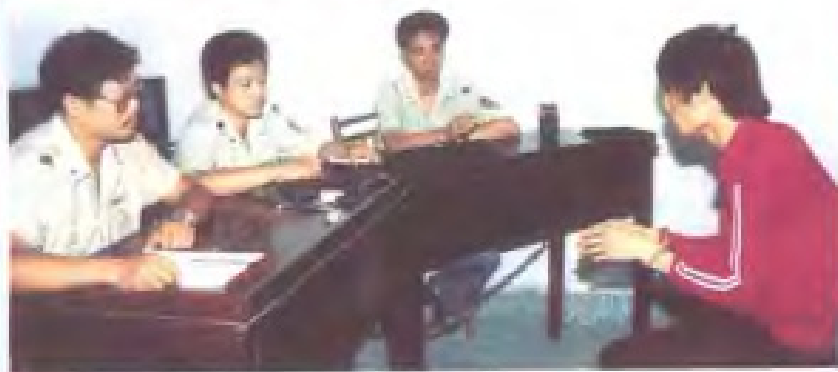
公安干警在车站抓获罪犯 (1991年)