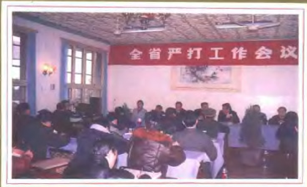
全省严厉打击严重刑事犯罪斗争工作会议