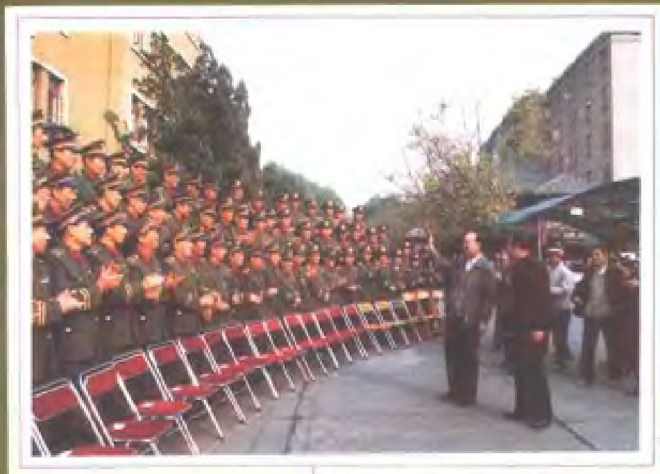
公安部部长王芳(中间挥手者)看望省公安厅副处级以上干部 (1988年11月)