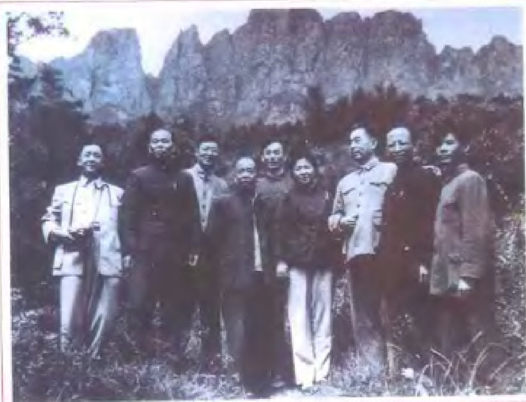
周恩来总理在庐山参加中央工作会议期间与中共江西省委领导和省公安厅领导人合影。前排右三周恩来，右五杨尚奎，右六黄庆棠 (1961年9月)