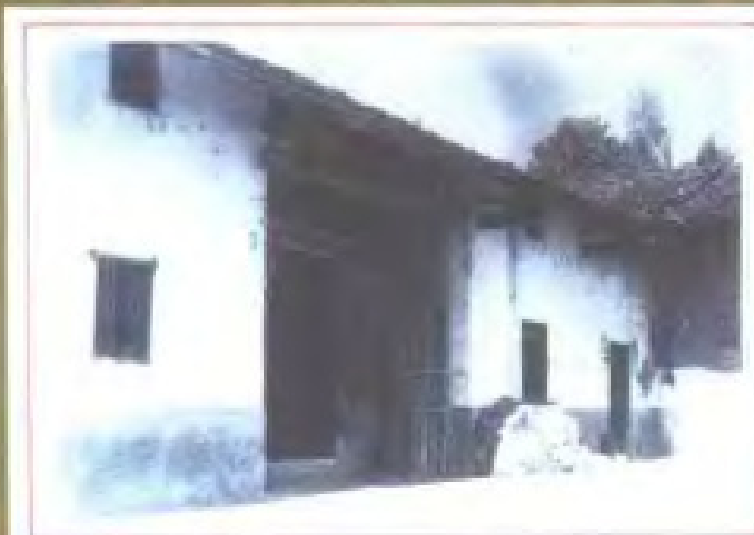
中华苏维埃共和国国家政治 保卫局旧址——瑞金县叶坪 庙背村 (1931年)