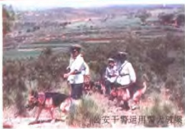
公安干警运用警犬破案