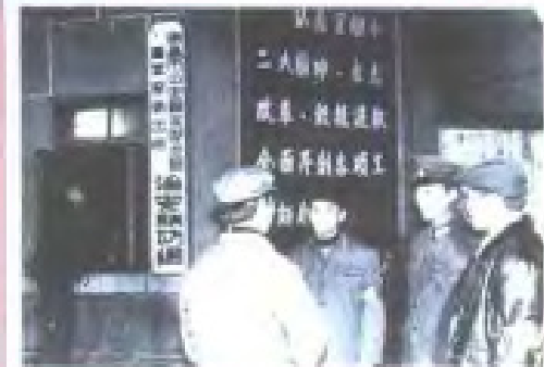
治安联防队员协助公安机关维持治安