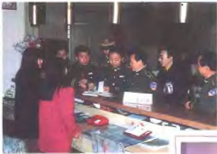
检查旅店住宿登记