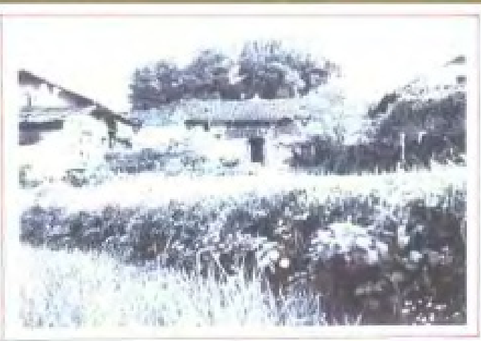
中华苏维埃共和国国家政治 保卫局湘鄂赣省分局旧址 ——万载县小源村 (1932年)