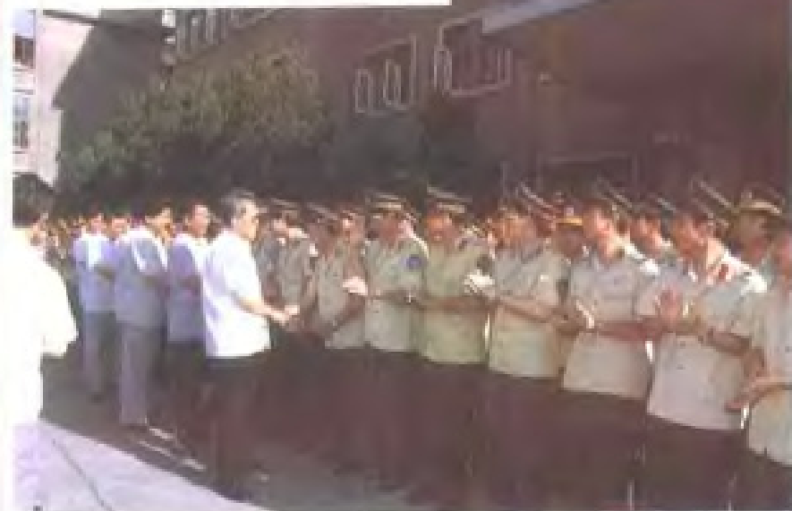
省委书记毛致用(左五)、省长吴官正(左四)、省委副书记刘方仁(左三)、省委常委政法委书记王昭荣(左二)、省委常委、省纪委书记马世昌(左一)慰问在制止动乱中做出贡献的省公安厅机关全体干警 (1989年7月)