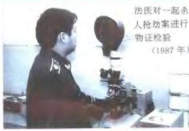
法医对一起杀人抢劫案进行物证检验 (1987年)