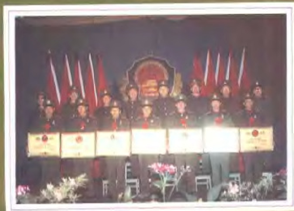
省公安厅领导(后排)与七名全省优秀公安局局长合影 (1987年12月)