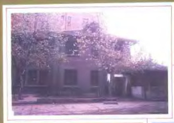
省人民政府公安厅 1949 年 6 月成立时的一幢办公用房