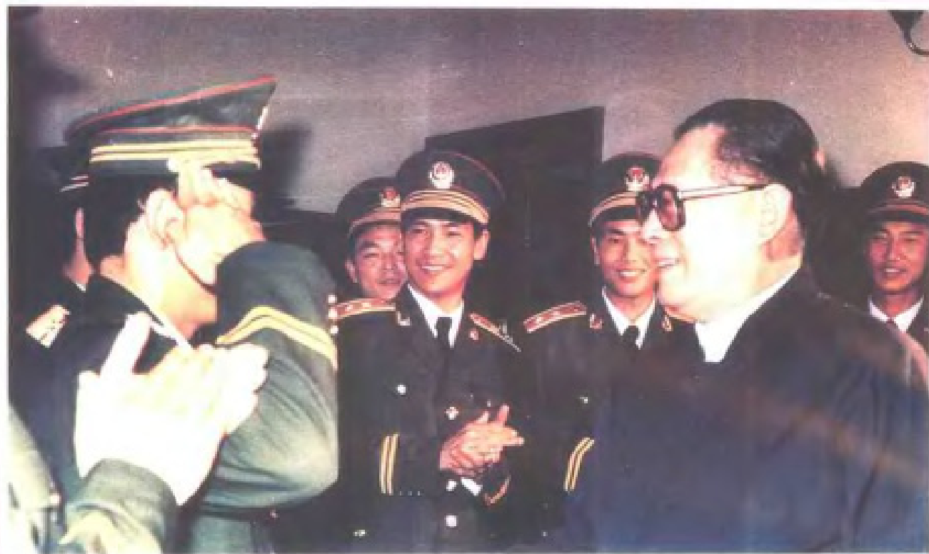
江泽民总书记在江西 视察, 接见武警官兵 (1989年10月)