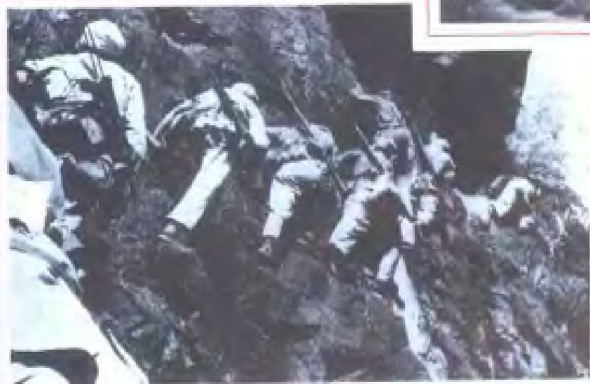
剿匪部队攀登峭壁围剿土匪 (1949年)