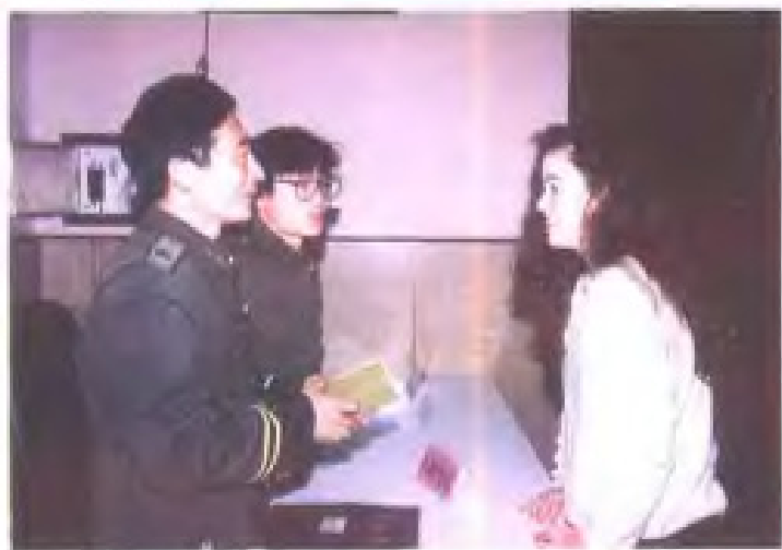
为外国人办理入境签证手续