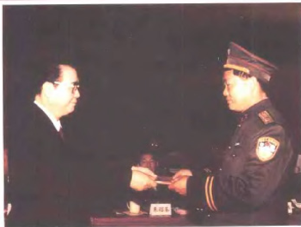
李鹏总理向省公安厅 厅长丁鑫发颁授二级 警监警衔及证书 (1992年)