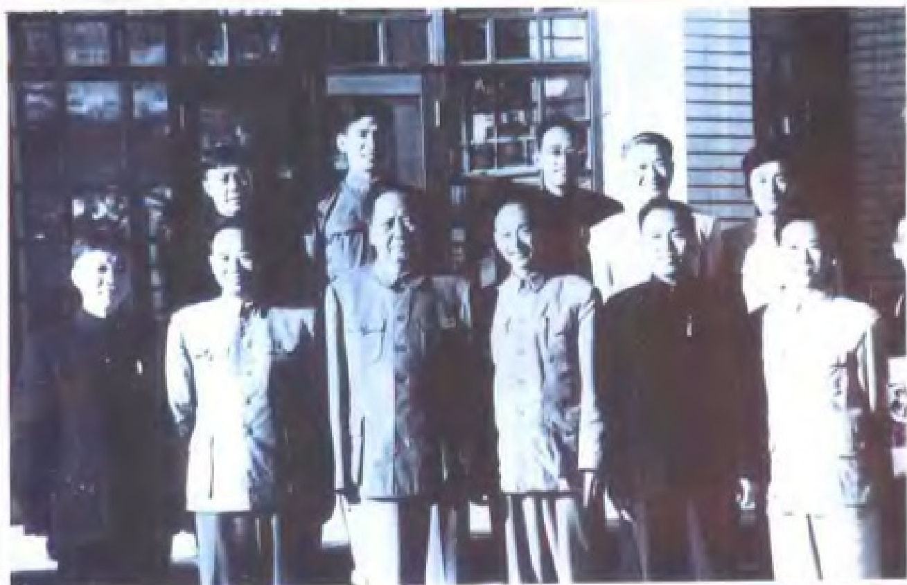
毛泽东主席在庐山中央工作会议期间与担负警卫任务的省公安厅领导人合影。前排左三毛泽东，左一牛何之，左四石慎修，左五黄庆棠 (1961年9月)