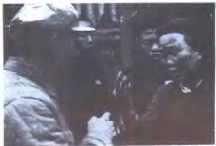
人民群众向剿匪部队控诉土匪罪行 (1949年)