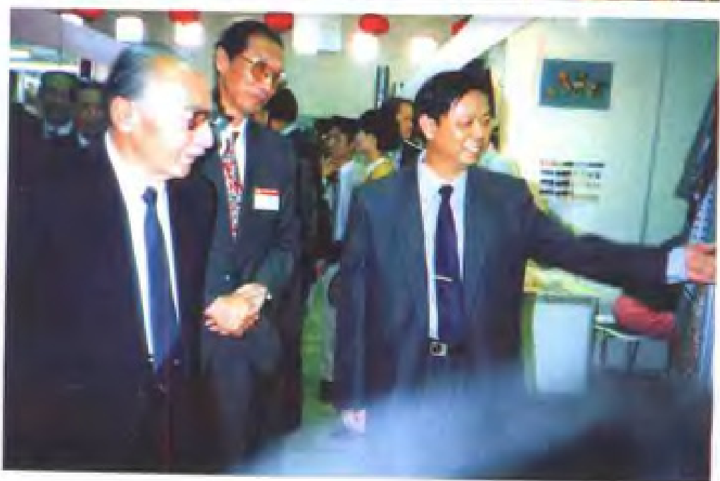
1992年在莫斯科展销会期间，省经贸厅副厅长许以国（右一）陪同全国人大常委会副委员长费福帮（左一）观看江西展品。