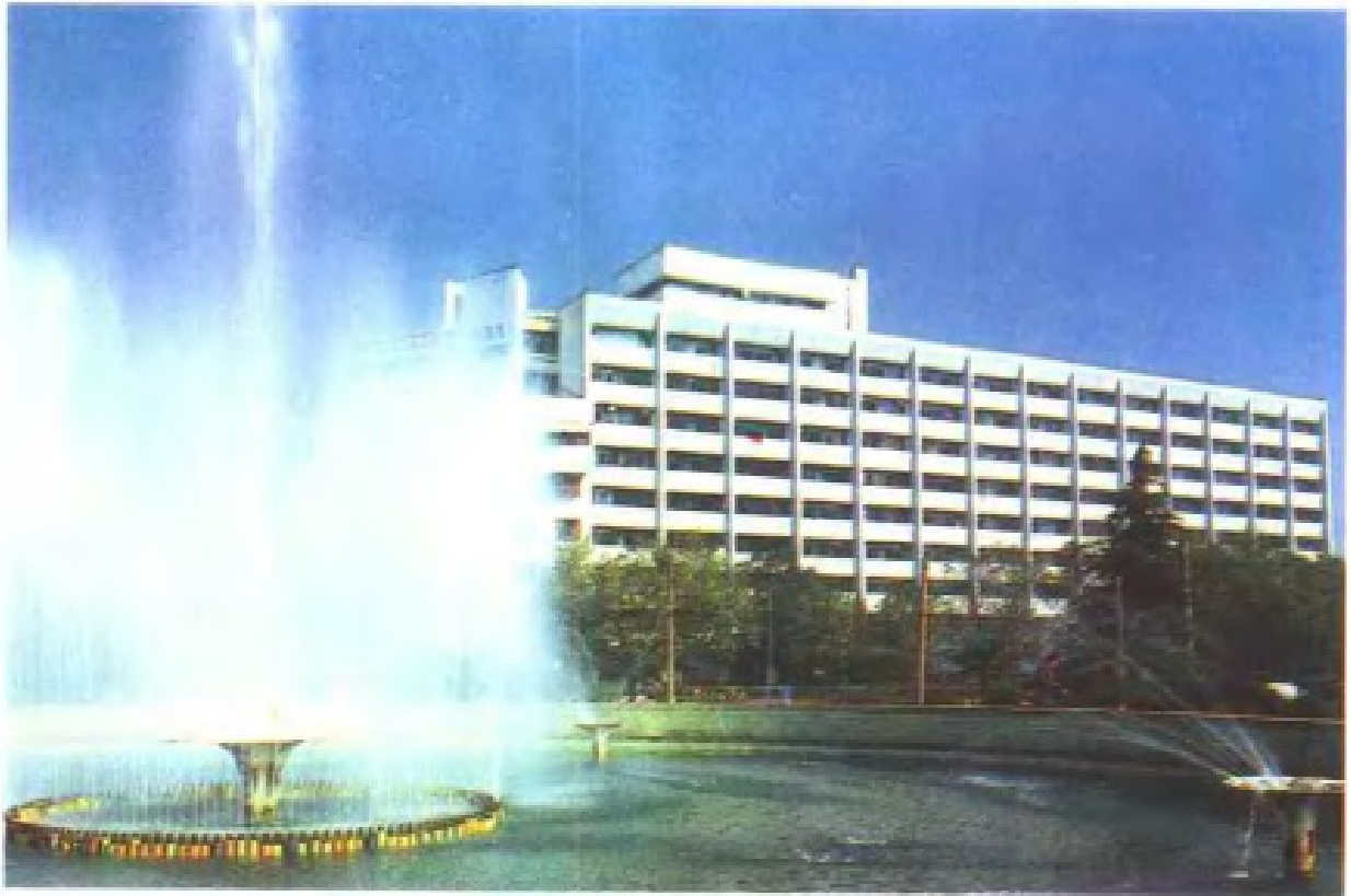
江西省外經貿大樓