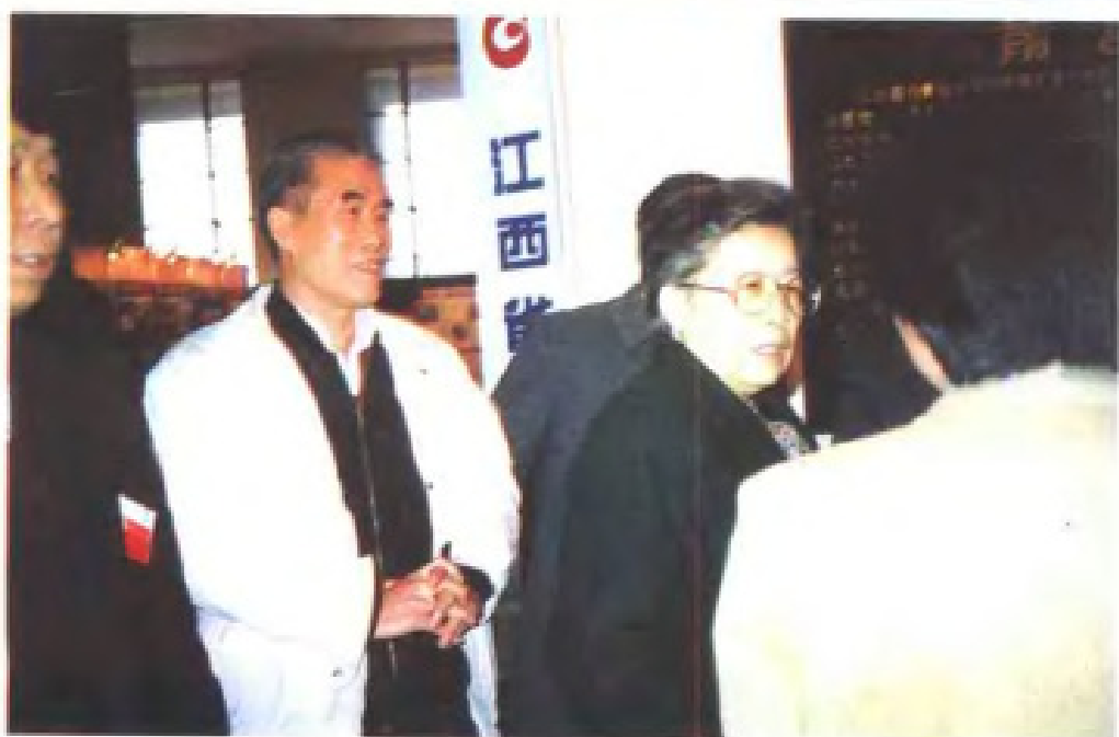
1992年3月23日，对外经济贸易部部长吴仪（中，女）视察江西展馆