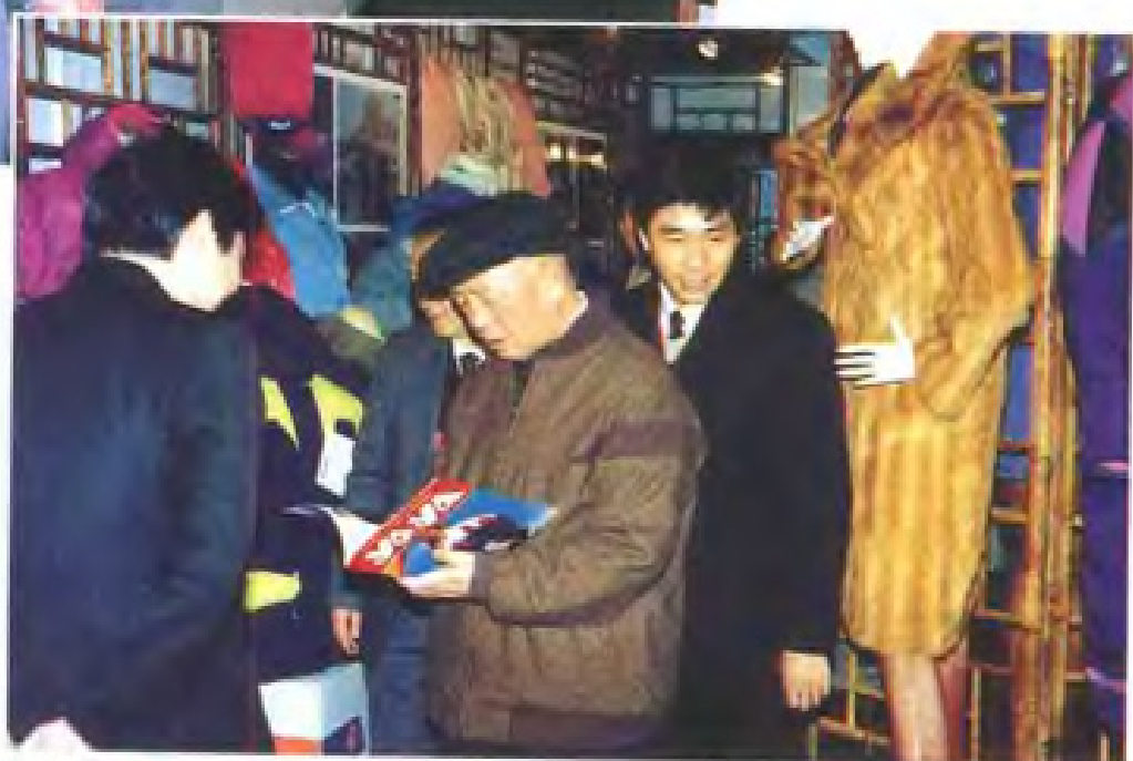
1991年12月，中央军委副主席刘华清（右二）在全国外贸出口商品生产基地成果展览会上观看江西羽绒制品。