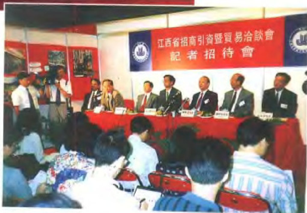
1993年，江西省副省长郑良玉（主席台右三）在香港主持举行江西省招商引资暨贸易洽谈会记者招待会