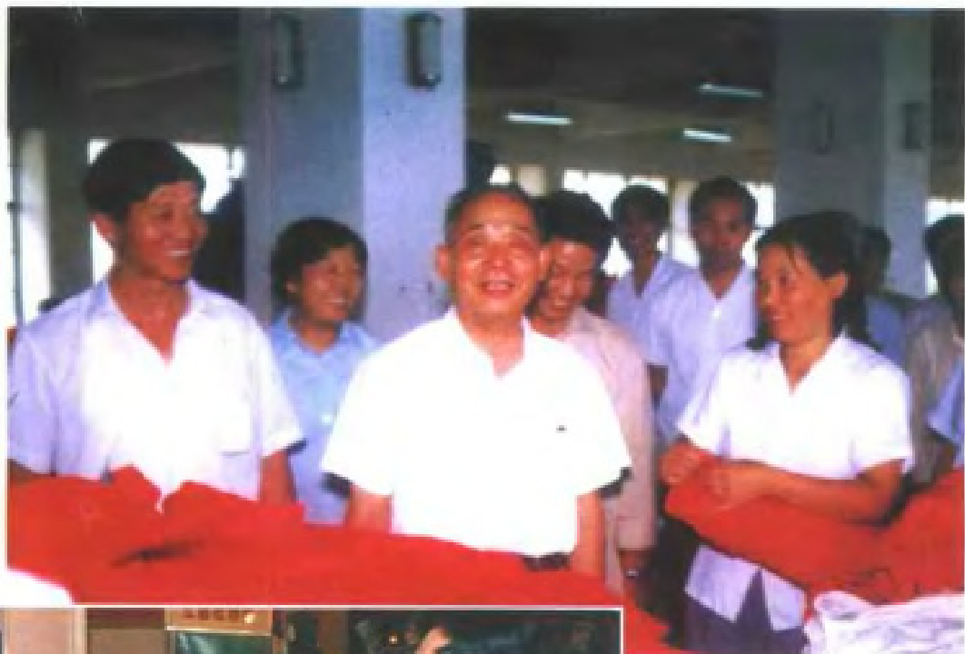
1986年8月28日，对外经济贸易部部长郑拓彬（中）视察江西共青羽绒厂