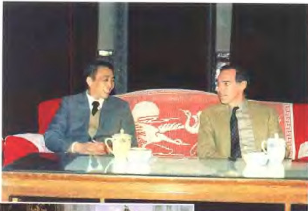
1986年，江西省副省长张道藩（左）会见世界银行评估团团长、美国高级经济专家卫士英