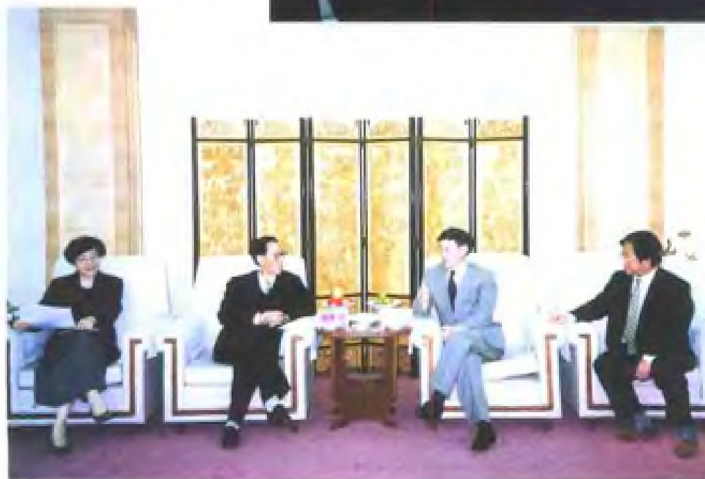
1996年5月，江西省省长舒圣佑（左二）会见外经贸部副部长孙振宇（左三）及外资司司长马秀红（左一），省外经贸厅厅长毕必胜（右一）在座