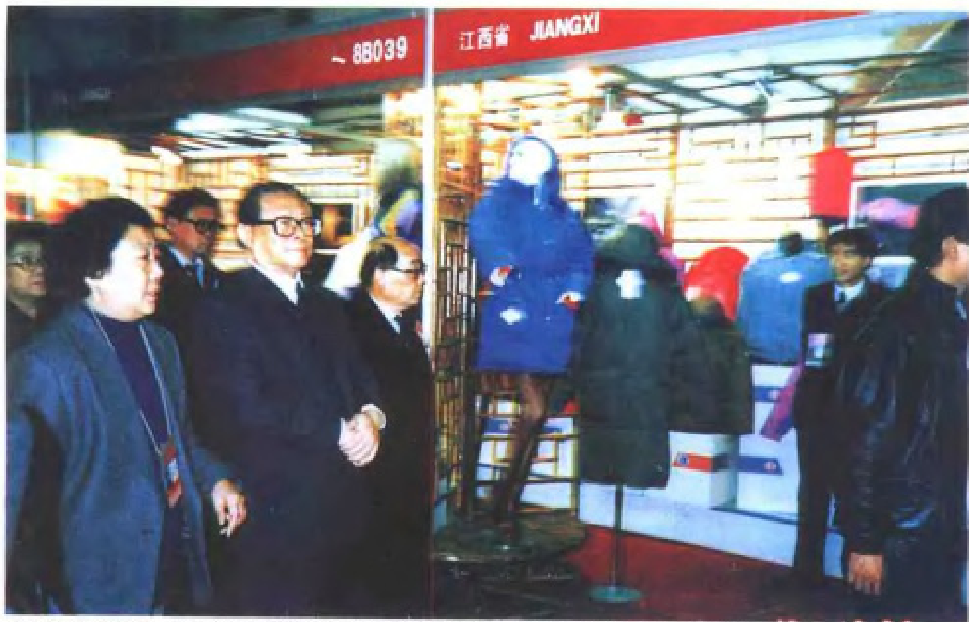
1991年12月28日，中共中央总书记江泽民在全国外贸出口商品生产基地成果展览会江西展区视察