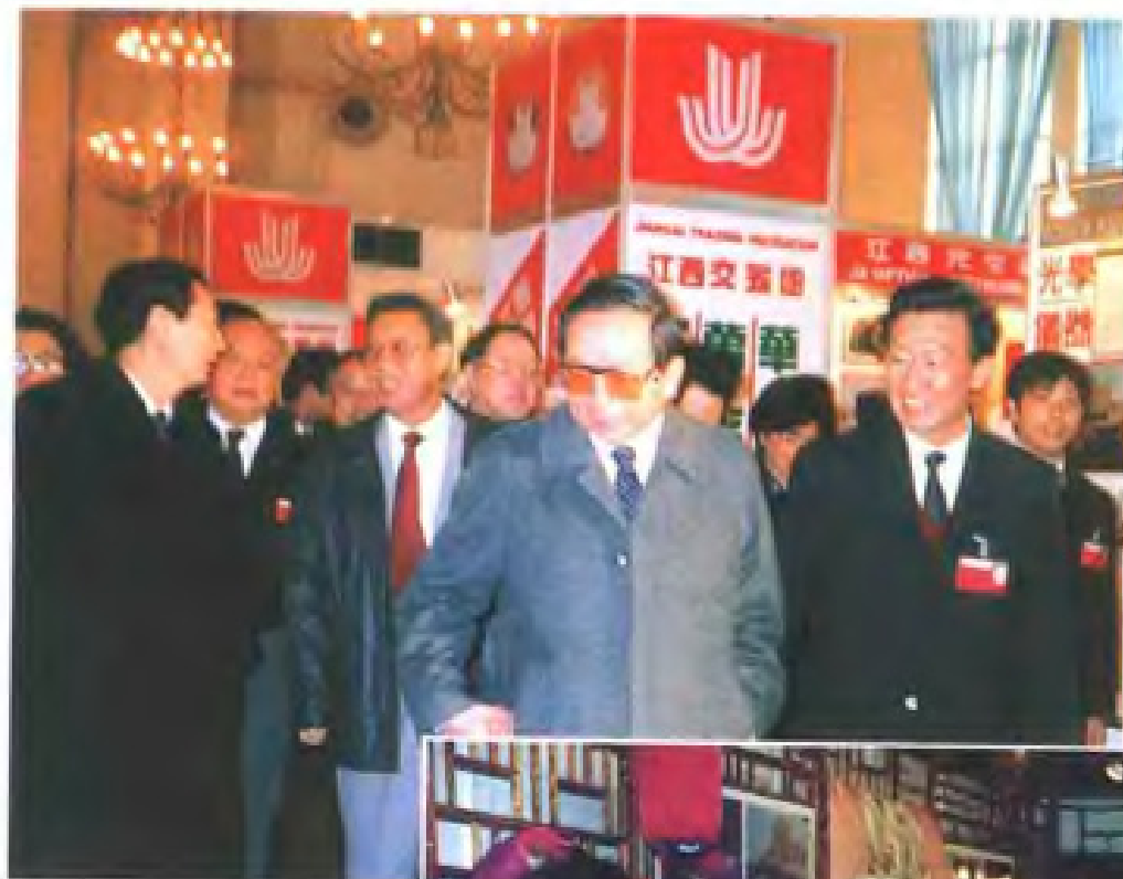
1991年3月，第一届华东出口商品交易会期间，副总理田纪云（右二）、上海市市长朱镕基（左一）、新华社香港分社副社长王品清（右三）参观江西展区。