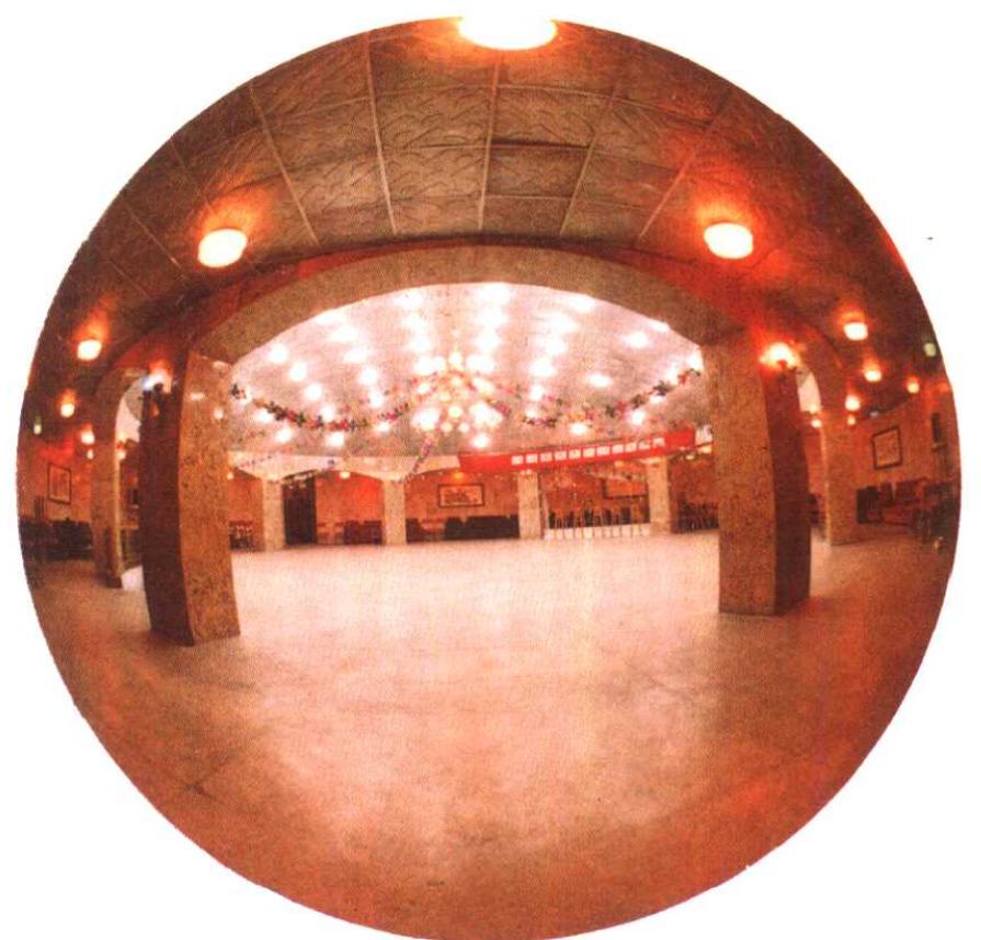
城市防空地下工程