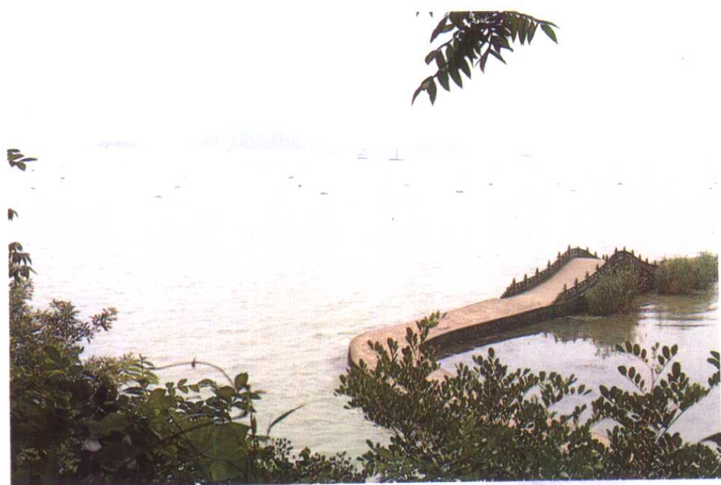
鼋头渚公园 万浪桥