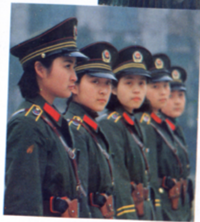
女民警参加 军事业务训练