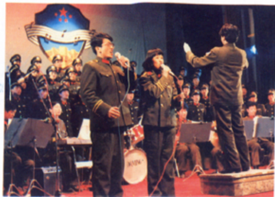
公安干警参加全省 公安系统文艺调演