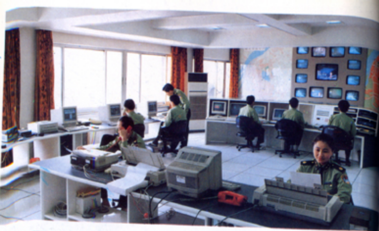
南京公安指挥中心