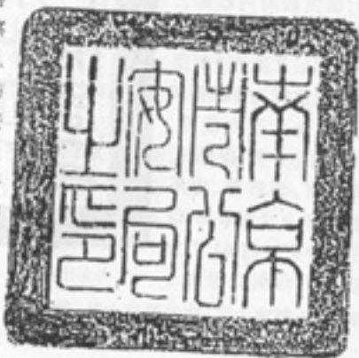
南京市公安局之印(1927)

市公安局隶属于南京特别市政府。局内设督察处、政治训练处和总务、行政、司法、侦缉、消防5课;消防、骑巡、保安警察队和警察教练所。辖6个警察署(城区分东、南、西、北、中5个警区和下关通商口岸警区)。下设21个分署、92个派出所。1928年1月,又增设手枪队、金陵海关清愿警,计有警士、公役3051人(不含