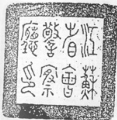
江苏省会警察厅印(1916)

1927年6月,南京被命名为南京特别市。6月27日,南京特别市市政府第10次市政会议通过《南京特别市公安局章程》。