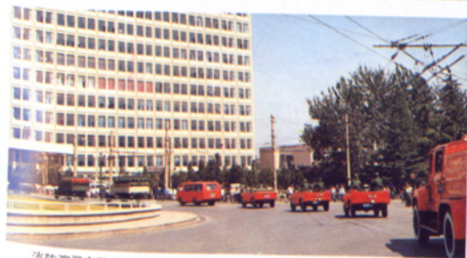
消防演习车队通过鼓楼广场