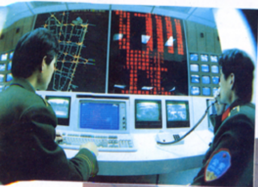
交通指挥控制中心