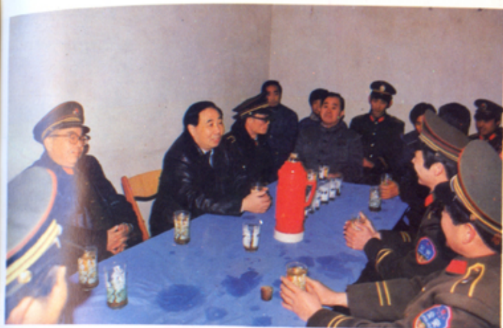
1988年,省长陈焕友、公安厅厅长陈文章由许成基局长陪同到南京火车站联防组慰问刑事民警。