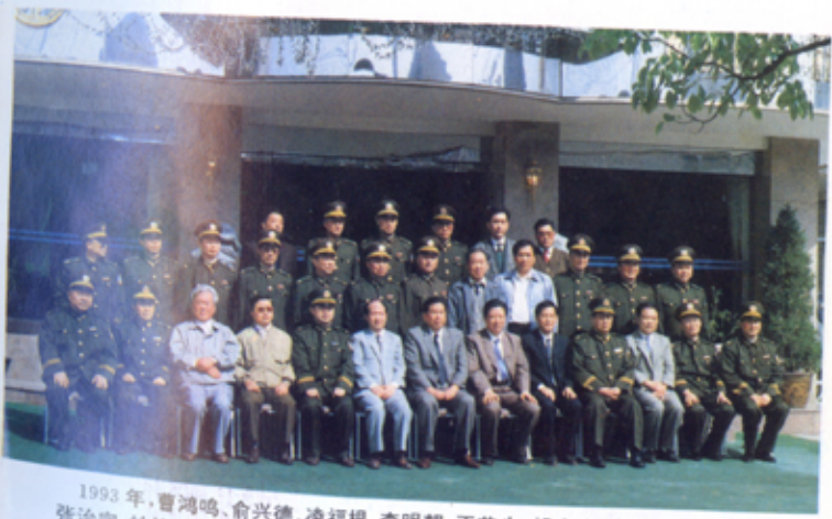
1993年，曹鸿鸣、俞兴德、凌福根、李明朝、王荣生、胡序建、张连发、汪正生、张治宗、林钧岱等省市及部门领导参加南京、无锡市局二级警监授衔时合影留念。