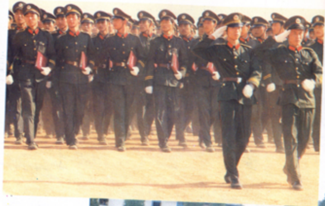
市公安局校户籍班 学员接受首长检阅