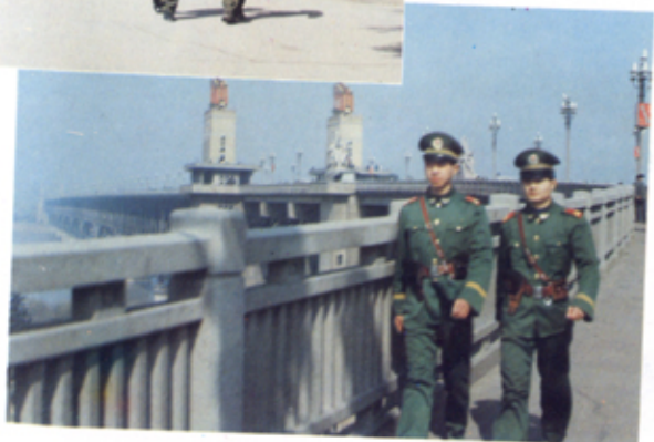
武警在长江大桥值勤