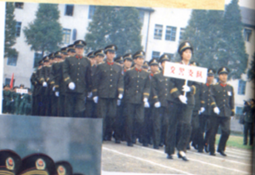
交通民警参加 公安体育运动会