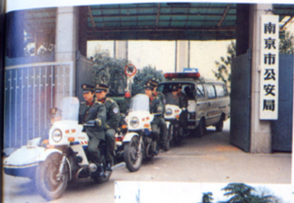
治安民警整装出发