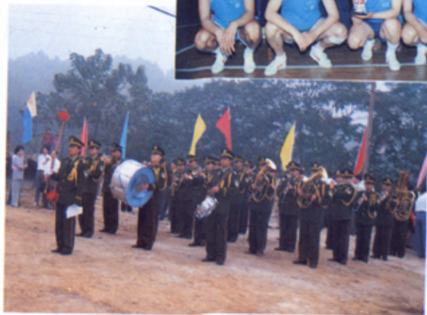
南京公安金盾 铜管乐队在演奏