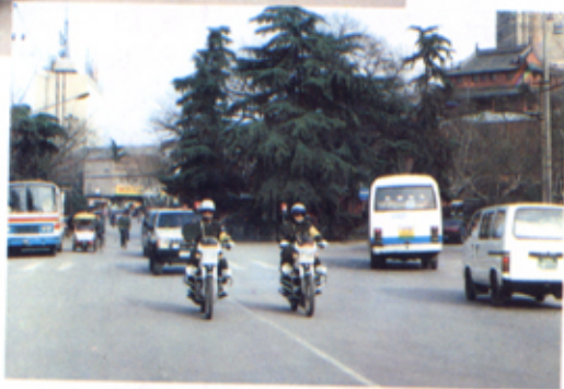
交通民警在北京西路巡查