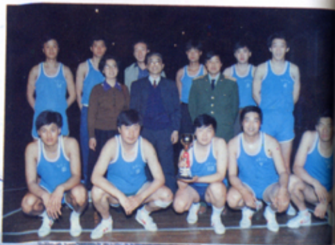
市局篮球队在市十五届 运动会获得篮球赛冠军