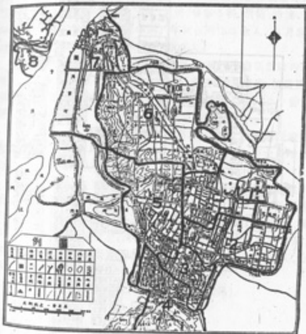
首都警察厅管辖区域图(1929)