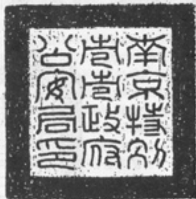
南京特别市市政府公安局印(1927)