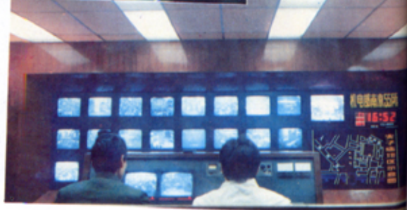
夫子庙派出所治安监控室