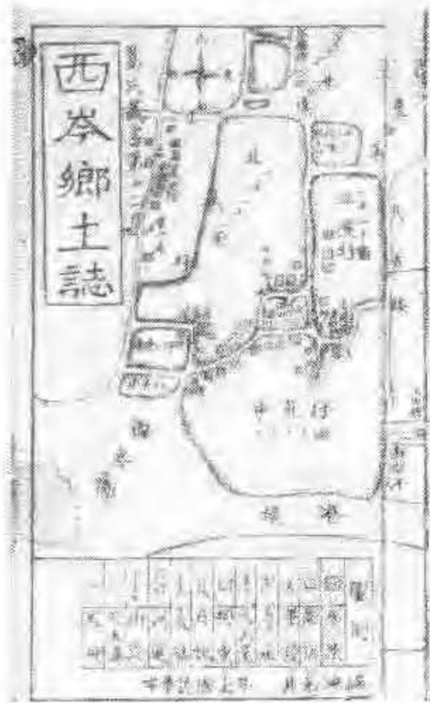
青浦县《西岑乡土志》封面