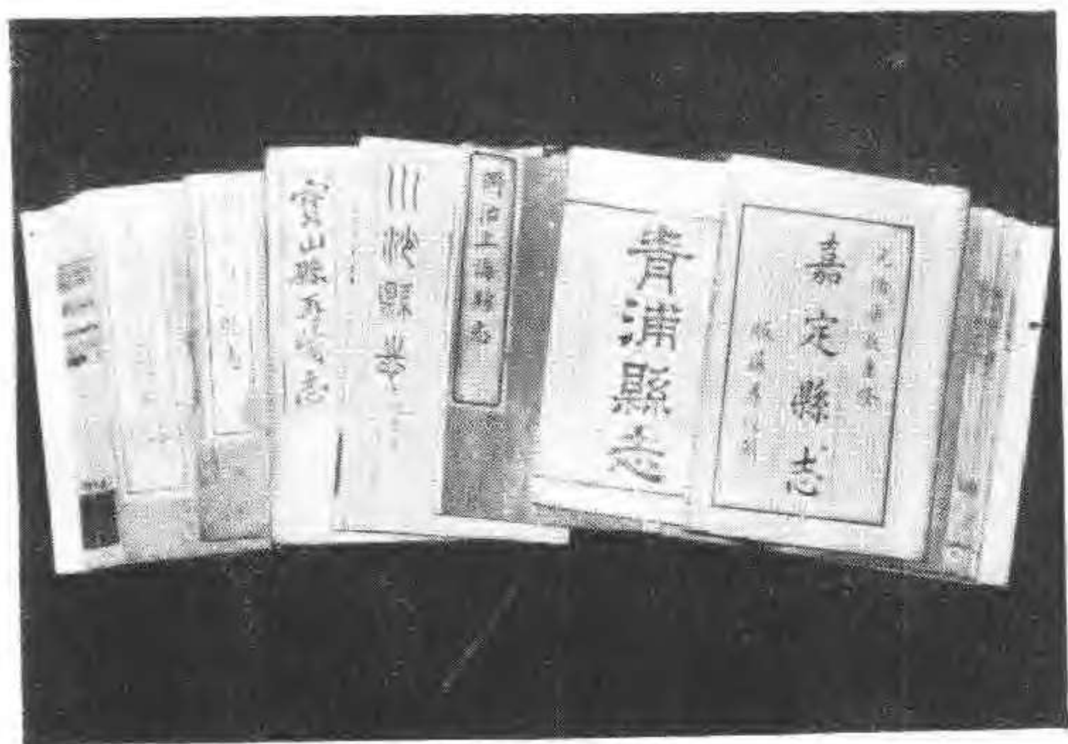
上海地区部分县志书影