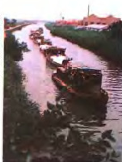
推轮运输队在运盐