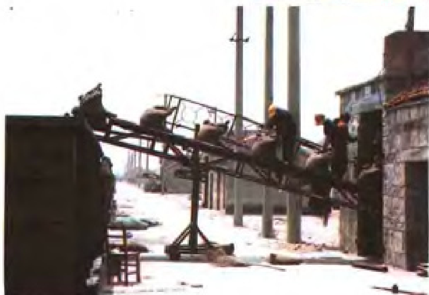
云台坨机械筑包装车