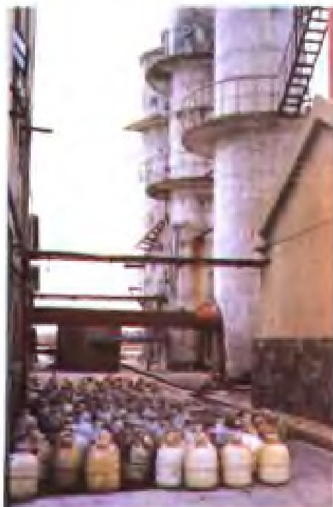
溴素生产车间及产品堆场