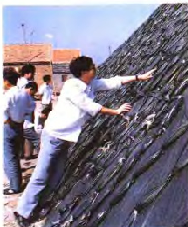
试用塑料薄膜苫盐席