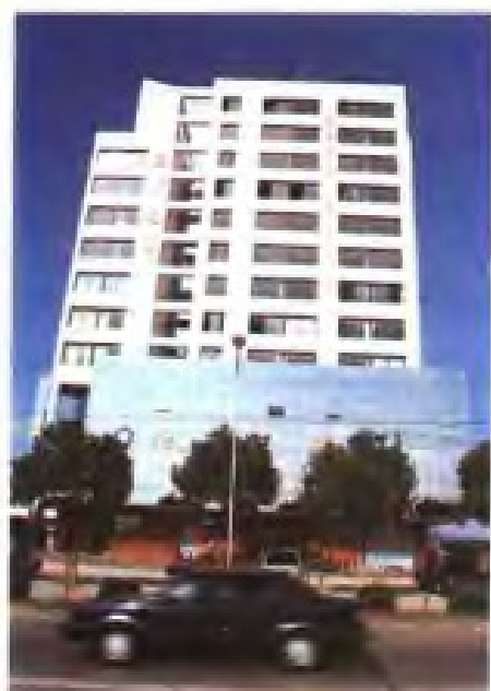
苏州市盐务管理局机关及营业大楼