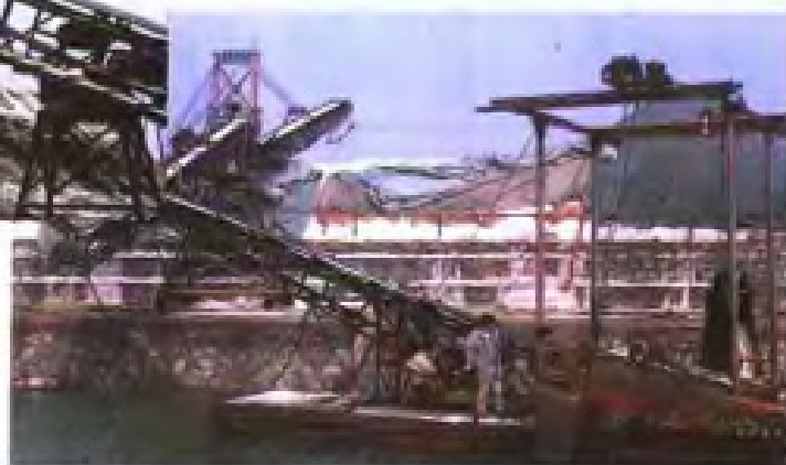
陈港坨地机械扒盐上廩