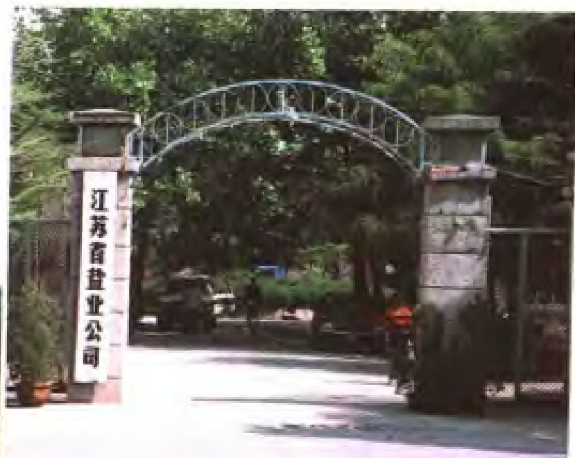
江苏省盐业公司驻地(连云港市)