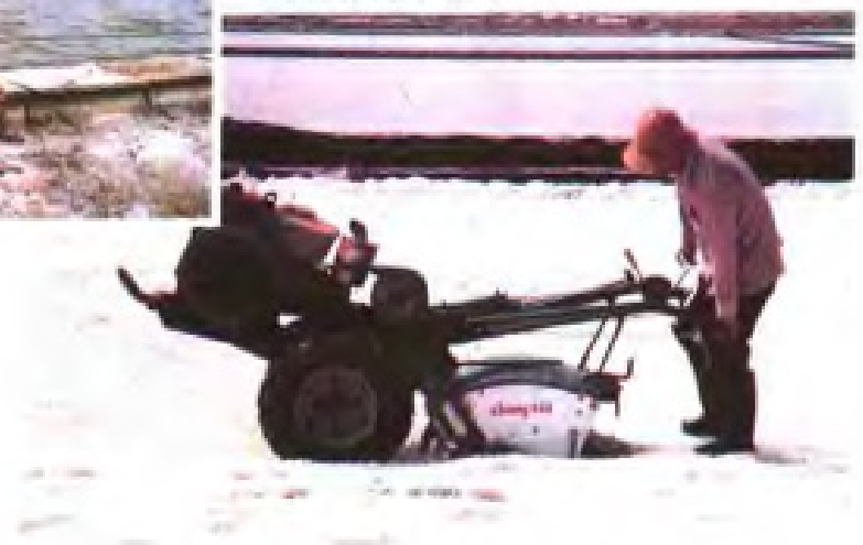
收盐前的机械活碓