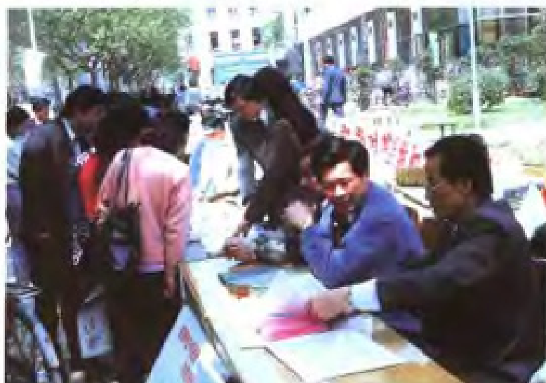
无锡市盐务局宣传推广食用加碘盐