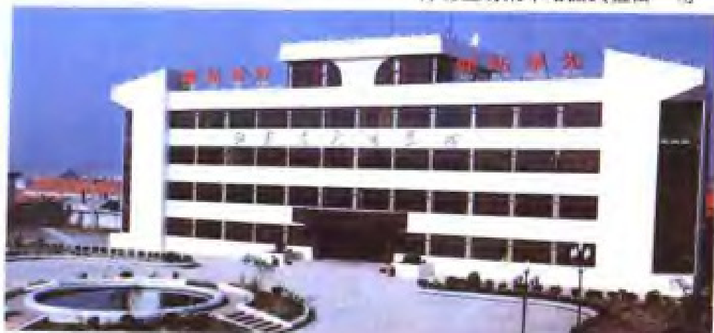
射阳盐场场部大楼