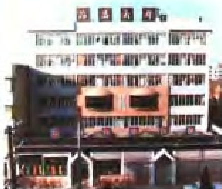
大丰县盐务管理局