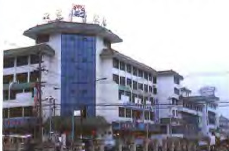
江阴市盐务管理局、盐业支公司机关及营业大楼