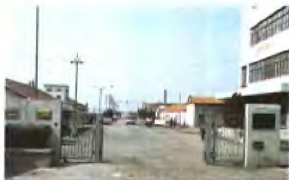
苦卤综合利用企业——黄海化工厂