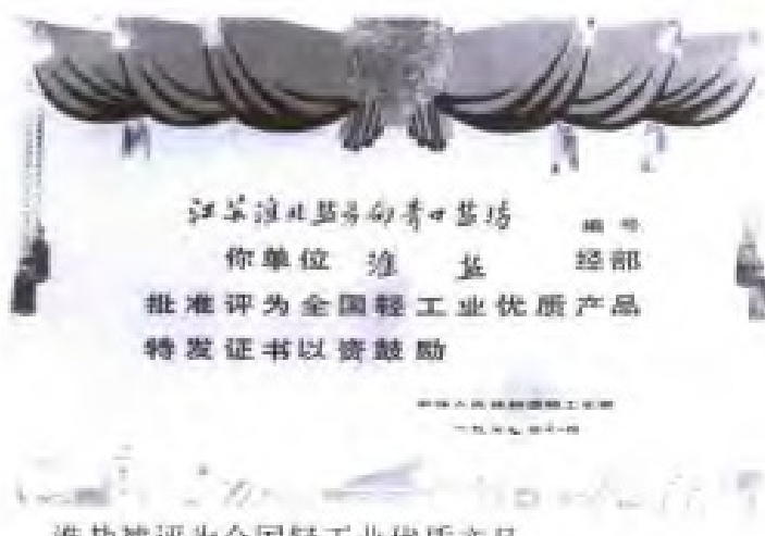
淮盐被评为全国轻工业优质产品