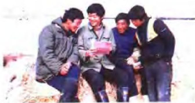
盐场工人在滩头学习