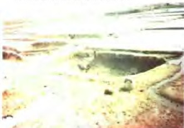
明代盐田遗址(保留在赣榆县)