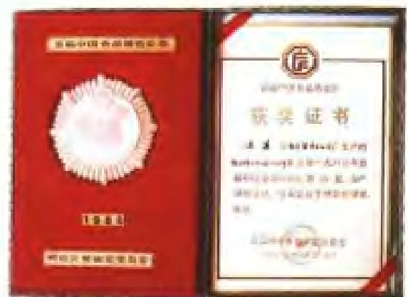
魁星牌强化加锌盐获奖证书