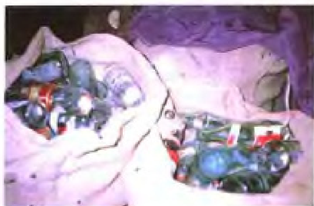
缉获的劣质盐及用劣质盐制作的酱油等