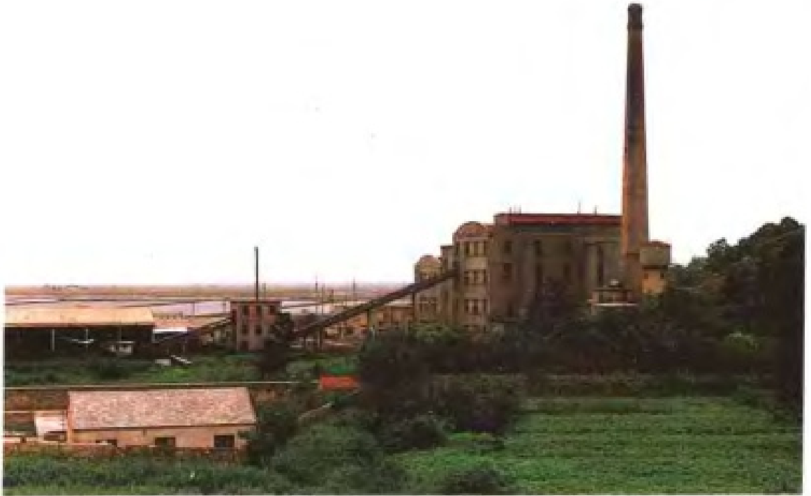
盐业自备电厂——东山电厂