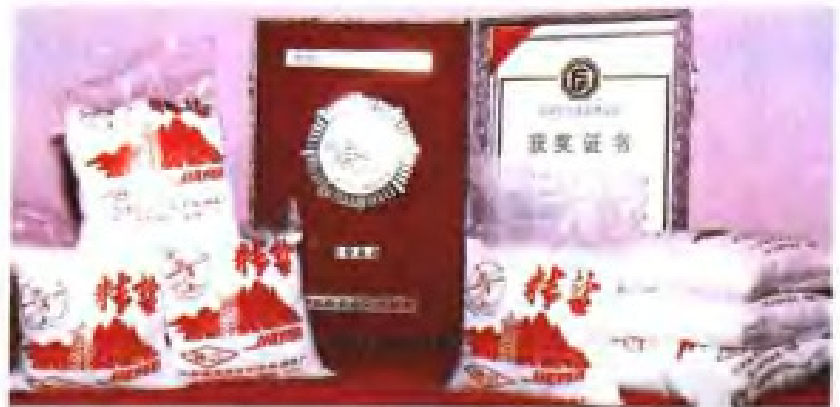
江苏首创的粉精盐 1988 年在首届中国食品博览会上获奖