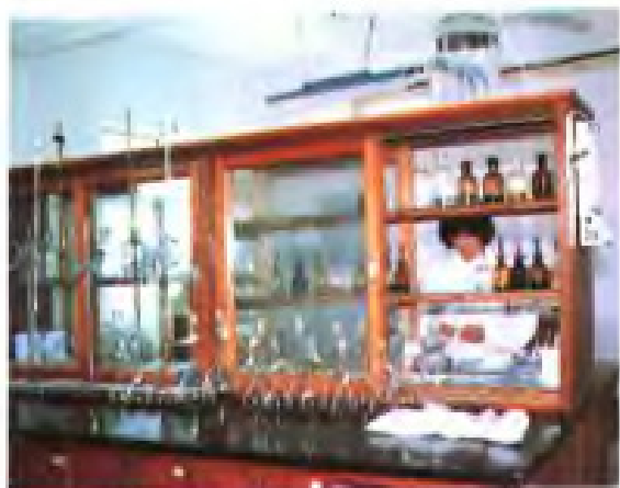
盐业产品质量检验站化验室