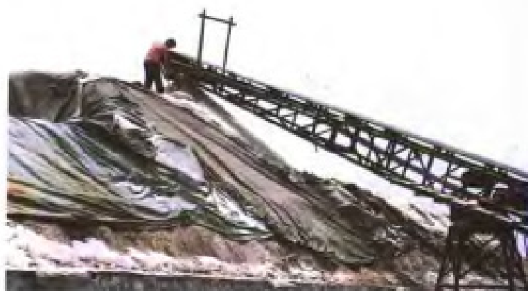
皮带运输机运盐上大廩