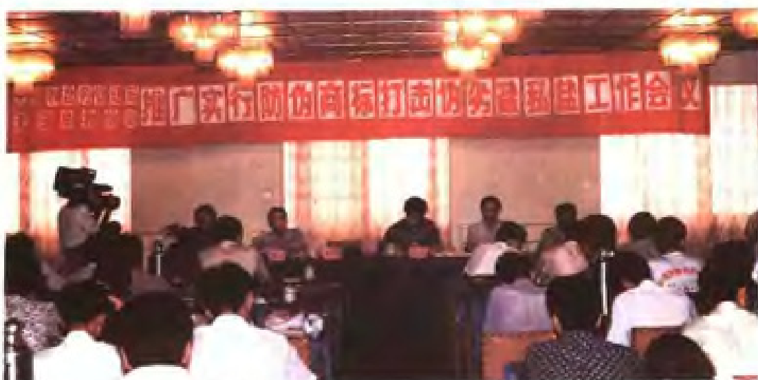
无锡市推广防伪商标打击伪劣私盐