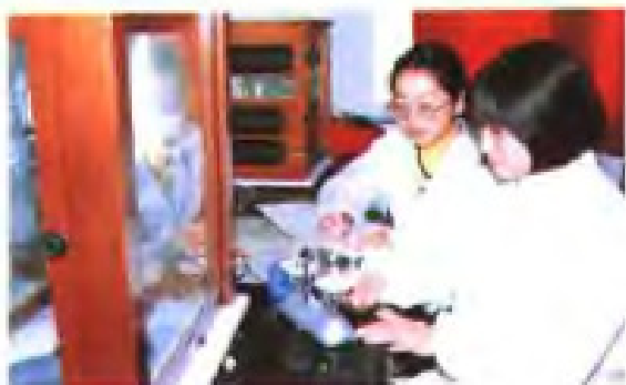
检测人员称量盐样品