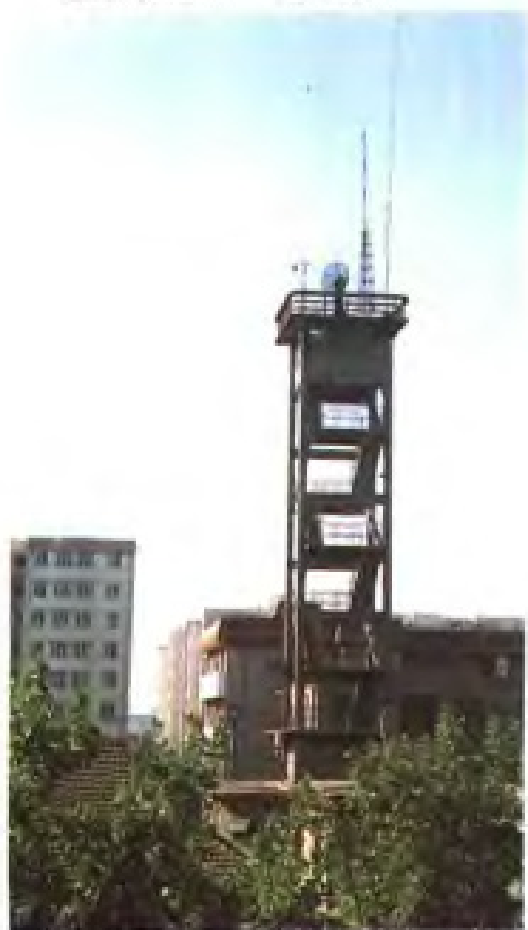
盐业气象台雷达塔