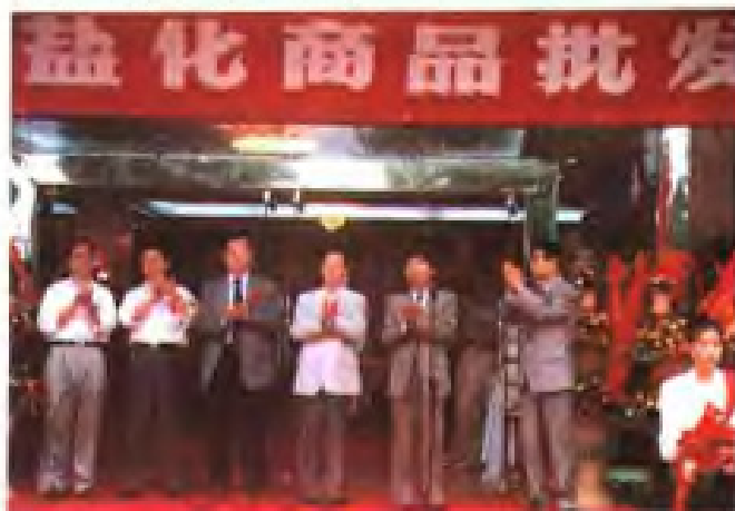
苏州市盐化商品批发交易市场开业