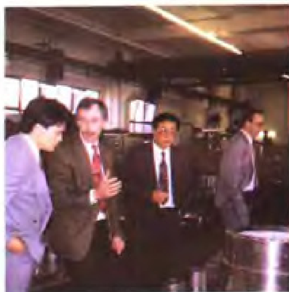
1993年省盐业公司经理带庆国在德国考察引进盐业设备