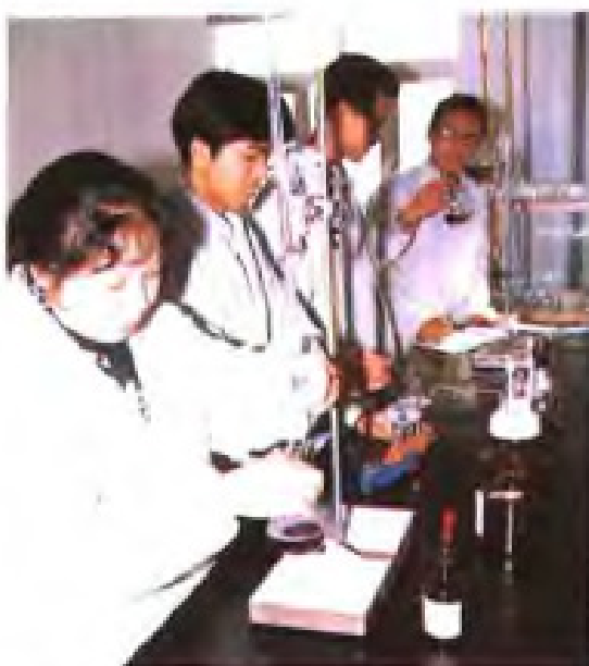
检测人员在分析盐的质量