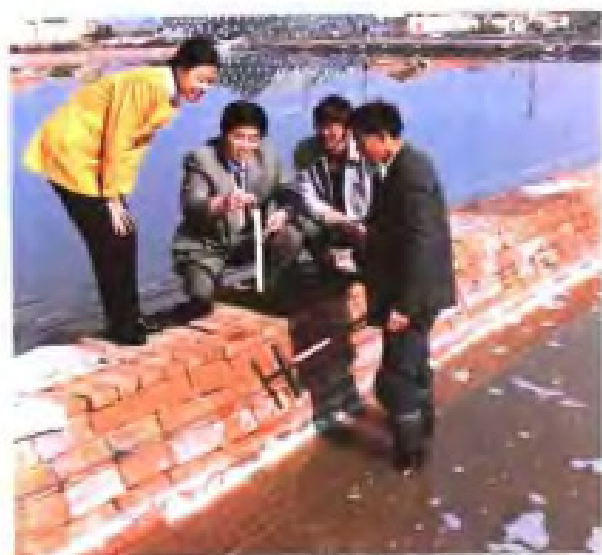
省盐业研究所科研人员深入滩头调查卤水质量