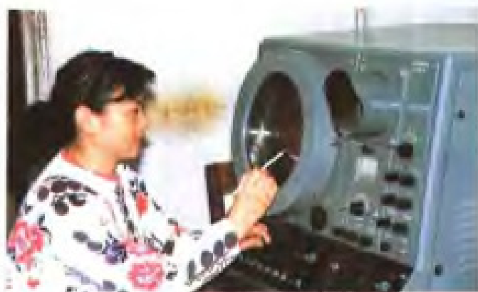
盐业气象台工作人员在操作雷达观测天气