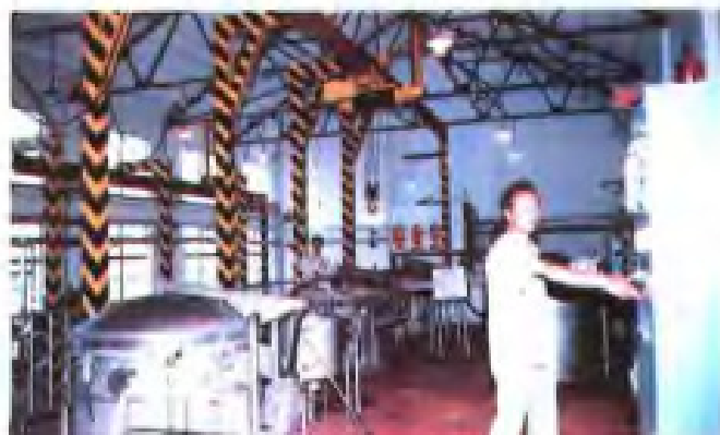
出口低钠盐生产车间