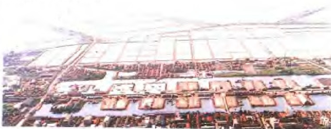
台北盐场集中结晶式盐田一角