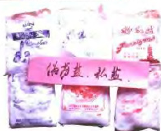
盐政部门缉获的私盐