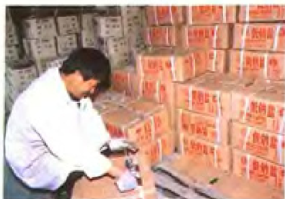
等待外销的低钠盐