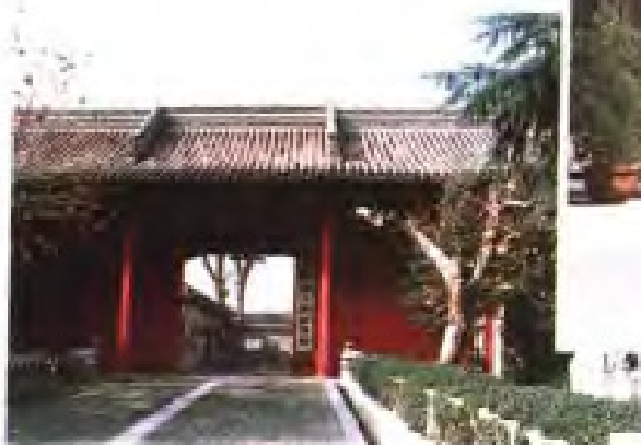
清代两淮盐运使署(今扬州市检察院驻地)