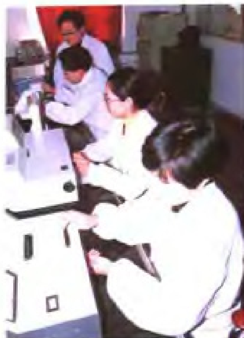
省盐业质量检测中心电子仪器设备