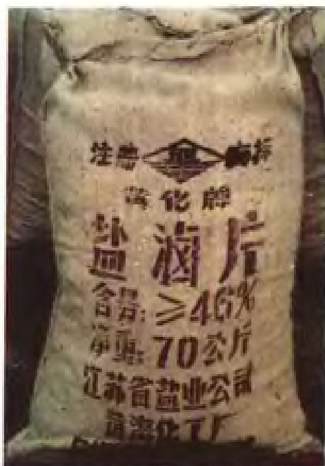
盐滴片(氯化镁成品)