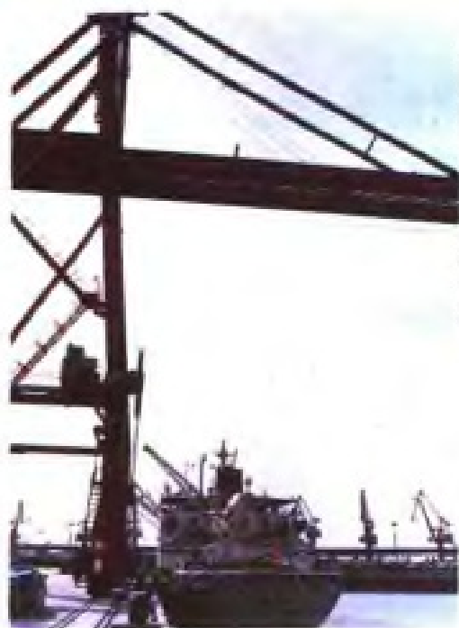
陈港码头轮船装运原盐