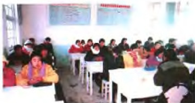
青年工人上技术课