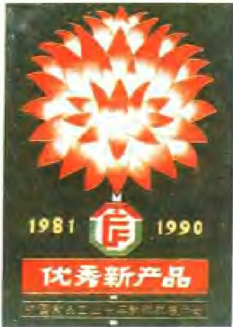
云台粉精盐获优秀新产品奖