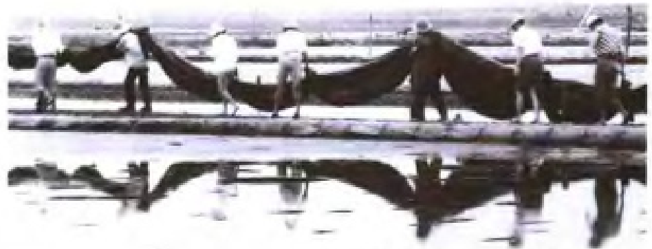
盐工在塑苫结晶池上装塑料薄膜