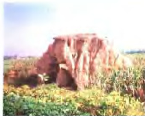
汉代盐仓城遗址(赣榆县龙河乡)