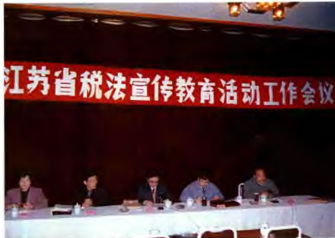
1991年4月江苏省税法宣传教育活动工作会议。