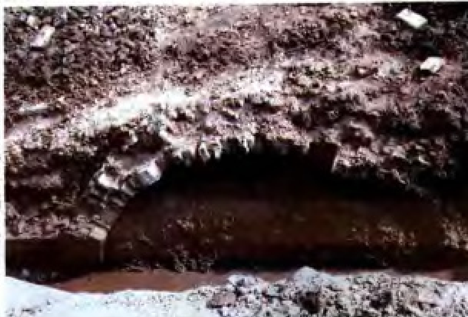
江苏泰州市发掘出土的税务古桥。据《泰州志》载,该桥始建于宋淳熙十年(1183),初名太平桥,又称崇明桥,明洪武三年(1370)重建,因傍税务衙门,而俗称税务桥。