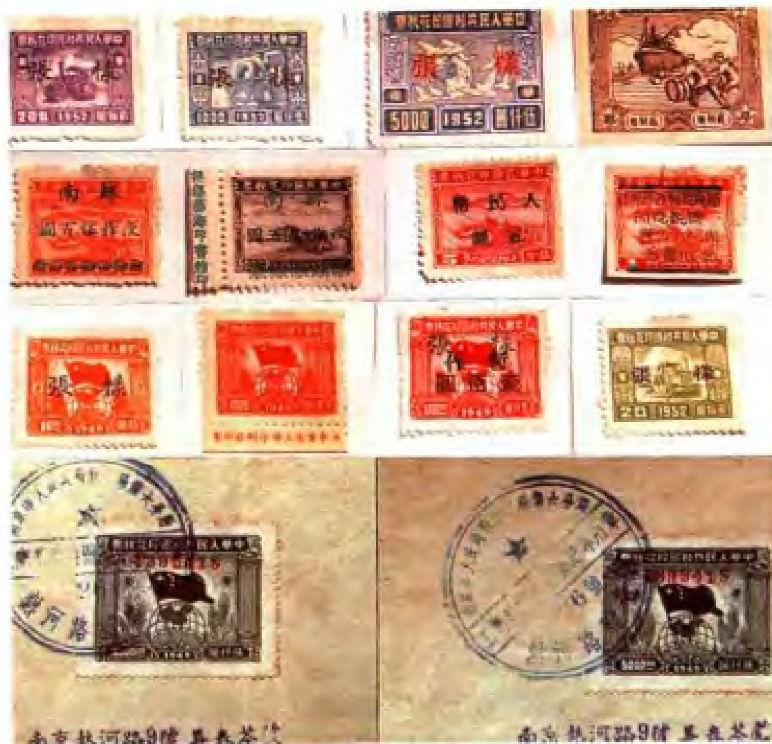
中华人民共和国成立前后苏南、苏北和南京地区使用的部分印花税税票。