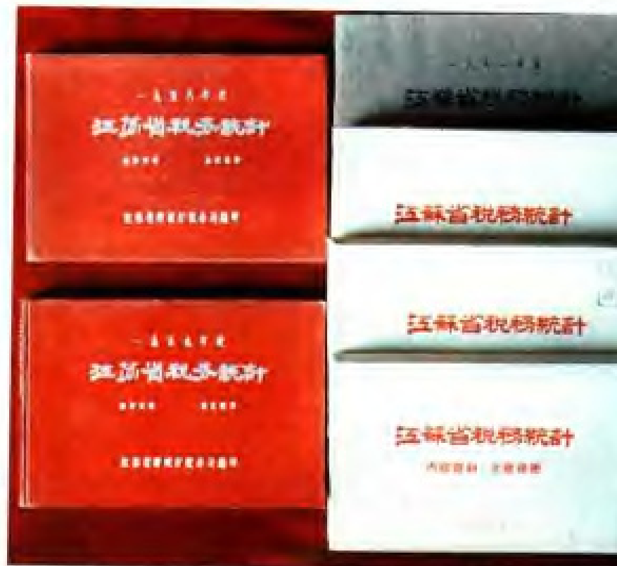
1958年至1964年的《江苏省税务统计》。