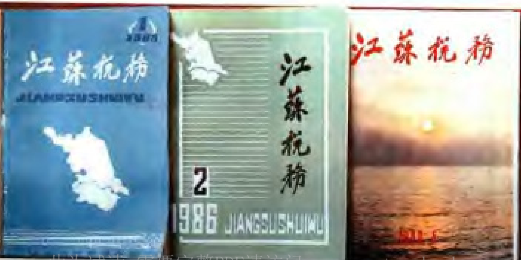
江苏省税务学会会刊《江苏税务》。