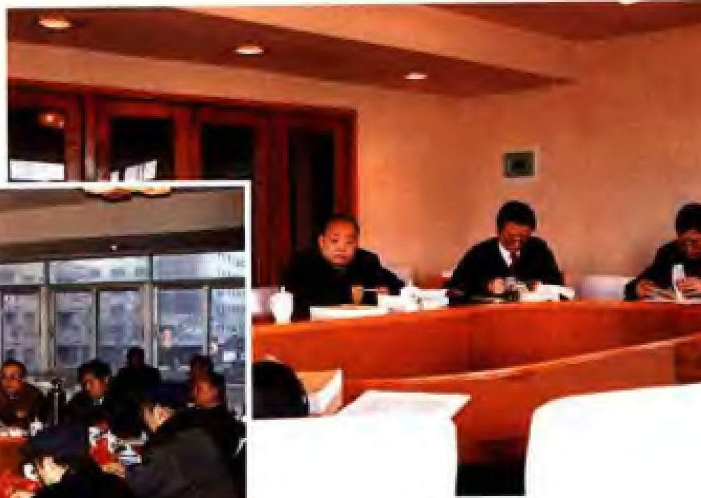
1994年3月江苏省志·税务志审稿会议。