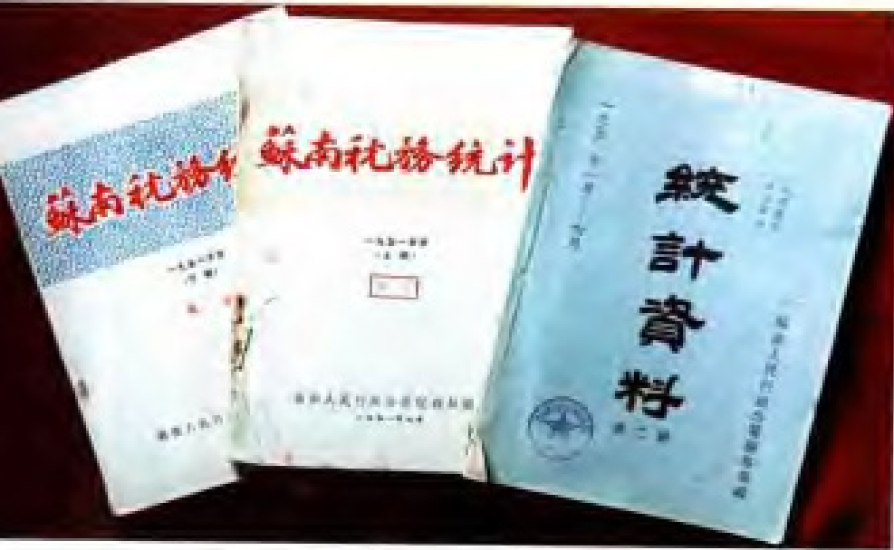
1950年至1951年苏南行署税务局的《税务统计》。