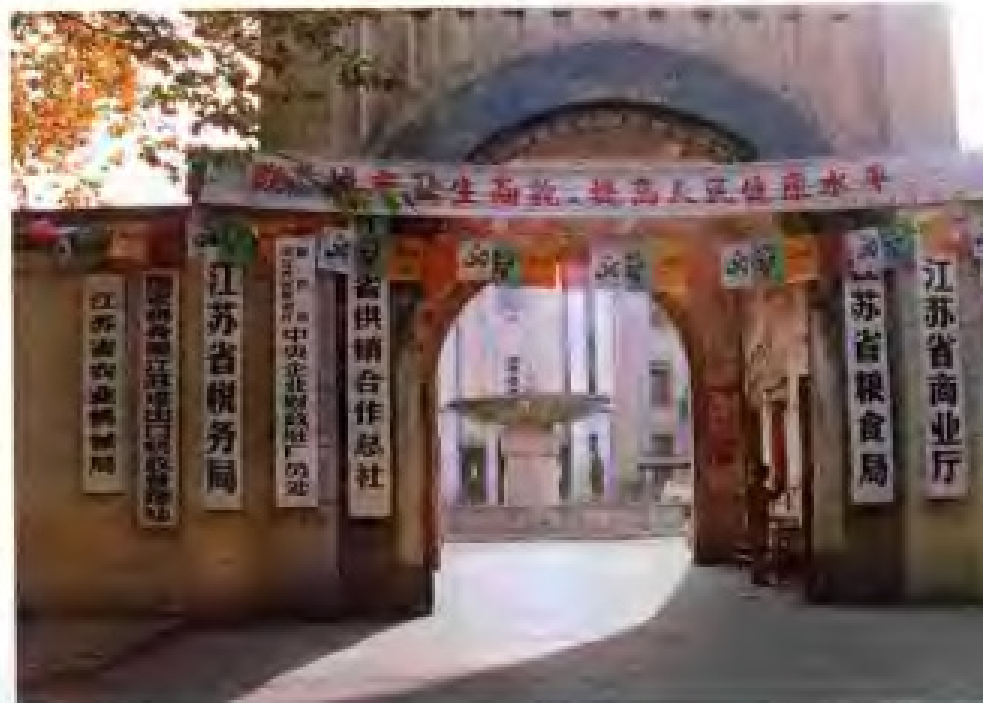
1963 年至 1983 年江苏省财政厅税务局、1984 年至 1990 年江苏省税务局在南京中山北路 101 号办公旧址。