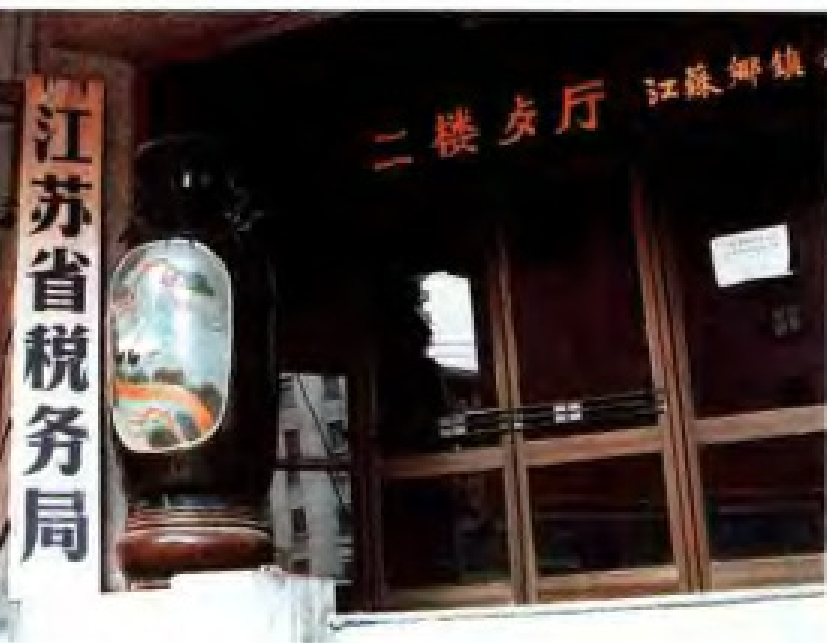
1990年1月江苏省税务局迁南京中山南路234号(乡镇企业大厦)办公处。