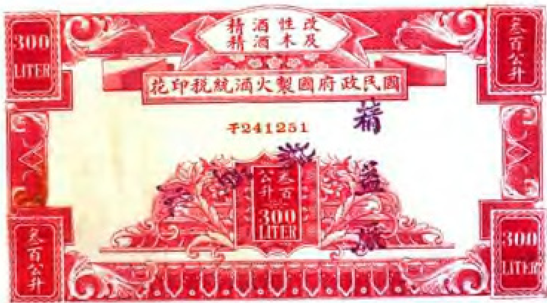
民国时期的火酒统税印花。