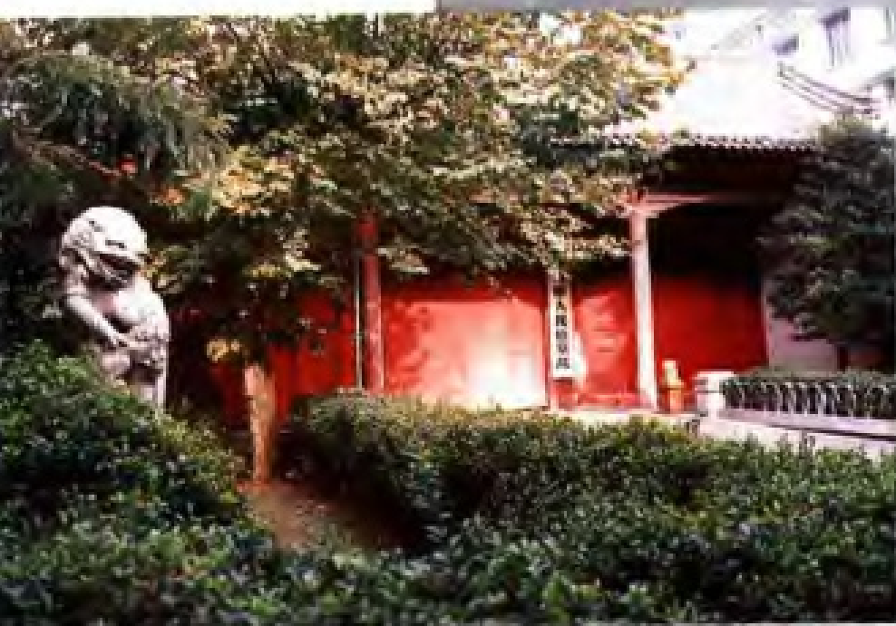
江苏扬州市古两淮都转盐运使司旧址。原为汉江都相董仲舒旧宅,清咸丰中兵毁,同治十一年(1872)重建。