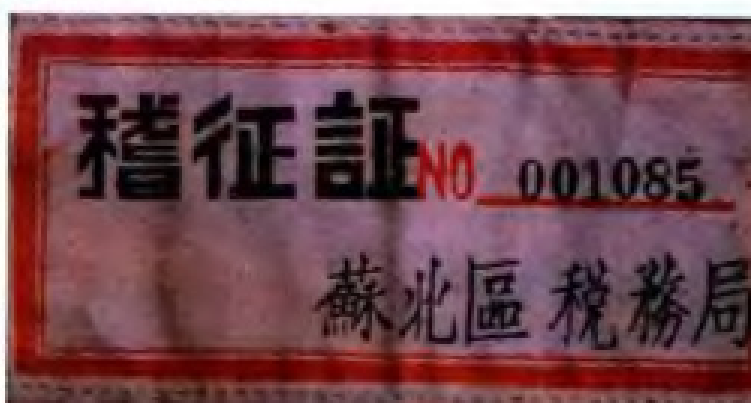
1949年苏北行政区税务局制发的税务人员稽查证。