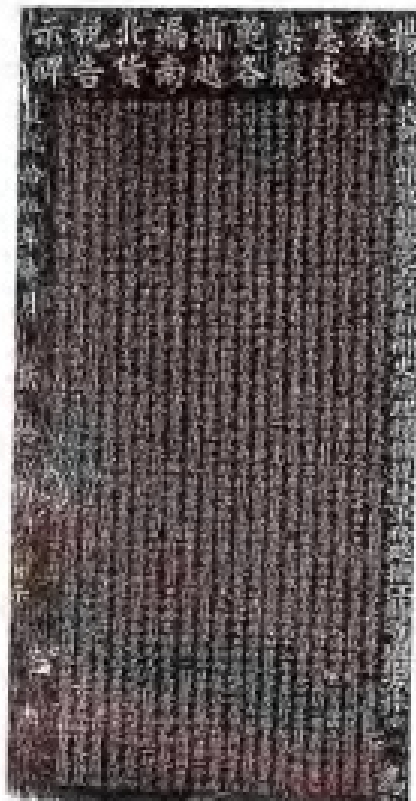
清道光十五年(1835)七月二十八日,江苏巡抚林则徐于泰州滕坝所立《永禁滕鲍各坝越漏南北货税告示碑》之碑亭及碑文。