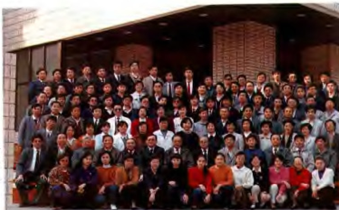
1991年国家税务总局局长金鑫与江苏省税务局全体工作人员合影。