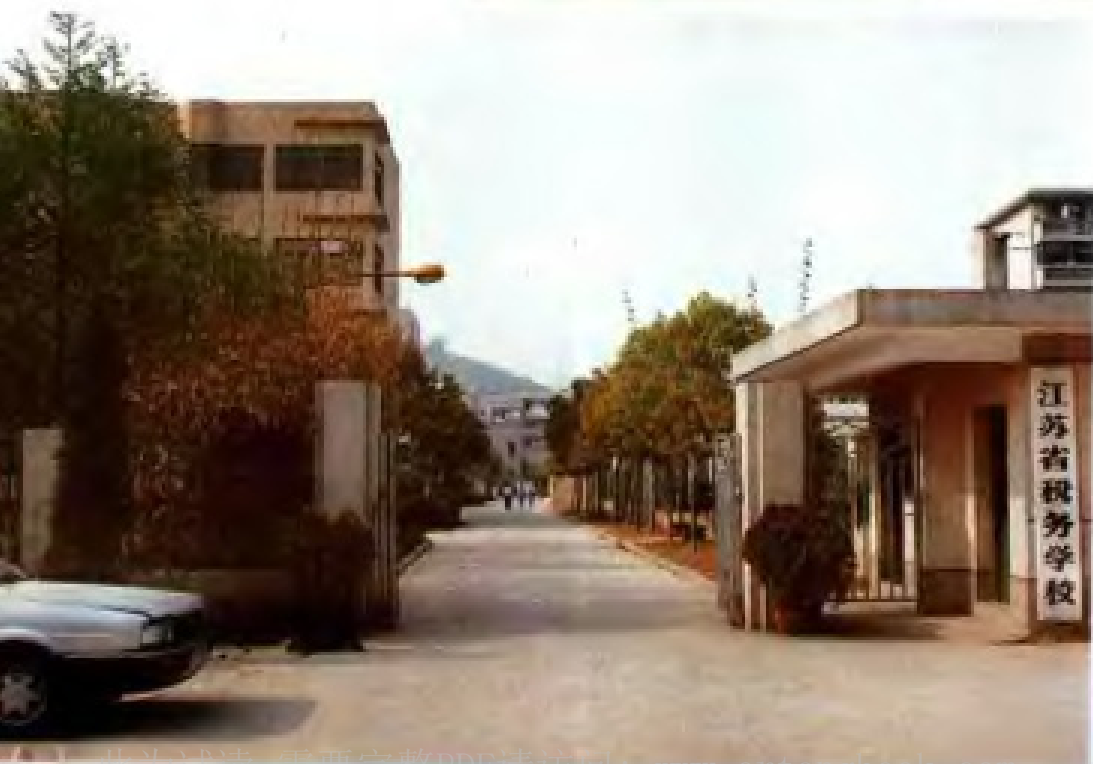
位于江苏无锡市荣巷的江苏省税务学校。