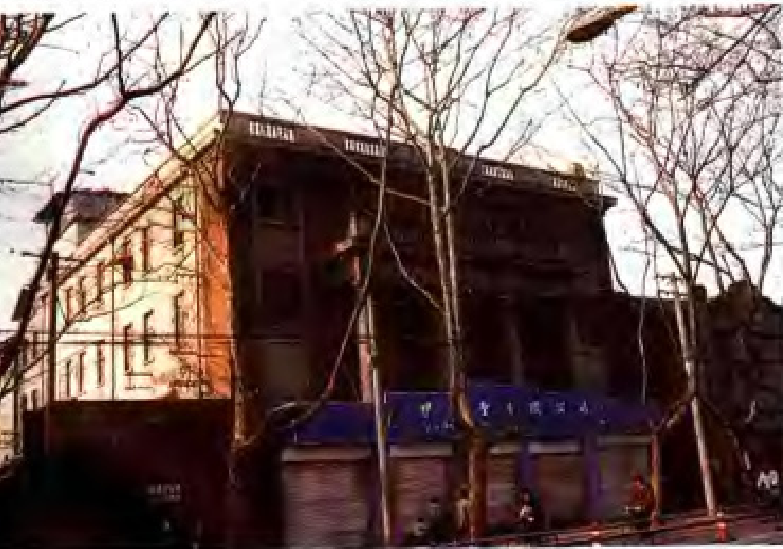
1951 年至 1956 年江苏省财政厅税务局在南京白下路 128 号办公旧址。