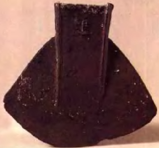
铁铲·魏晋时代· 扬州出土·现藏南京博物院