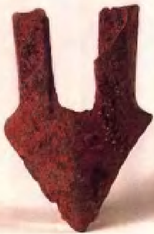
铁铲·东汉时代· 丹阳香草河出土·现藏南京博物院