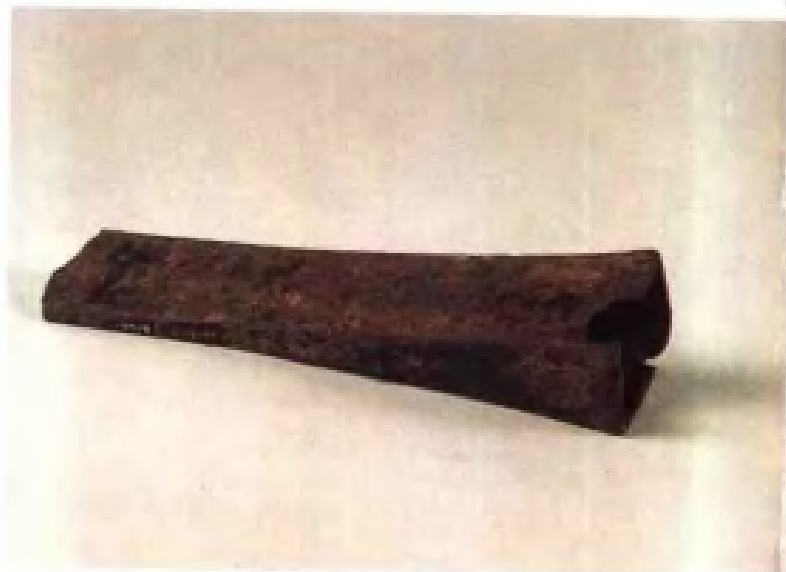
铁耒·东汉时代·丹阳出土·现藏南京博物院