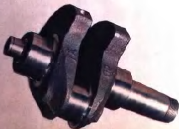
S195 曲轴·泰兴 市农机修造厂产品