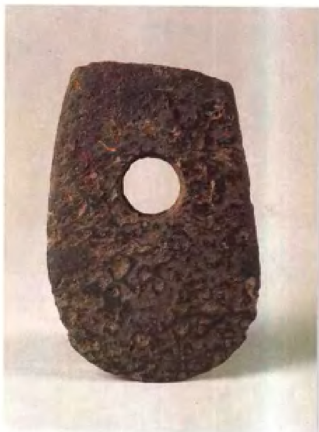
穿孔石斧·新石器时代·邳县刘 林遗址出土·现藏南京博物院