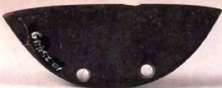
蚌镰·商周时代· 铜山出土·现藏南京博 物院