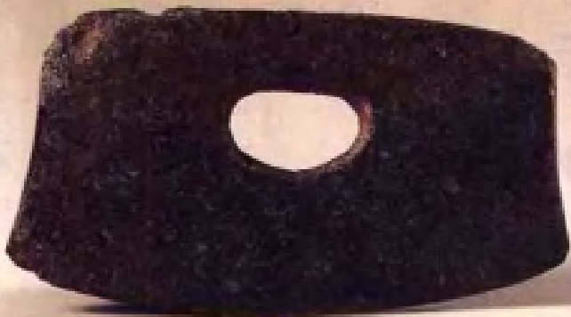
石锄·新石器青莲岗文化·南京北阴阳营出土·现藏南京博物院