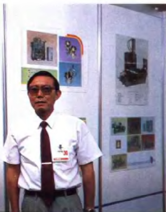
江阴硫化机维修备件中心在马来西亚兴办的公司