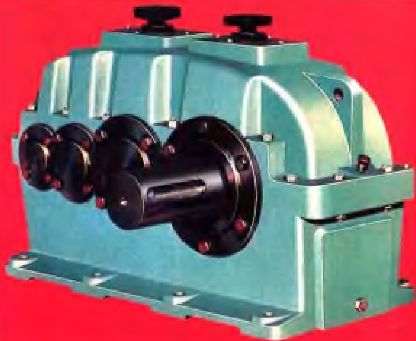
圆柱轮齿减速箱·江阴 齿轮箱厂产品