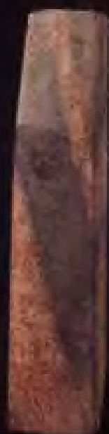
条形石铧·新石器时代· 南京北阴阳营出土·现藏南京博物院