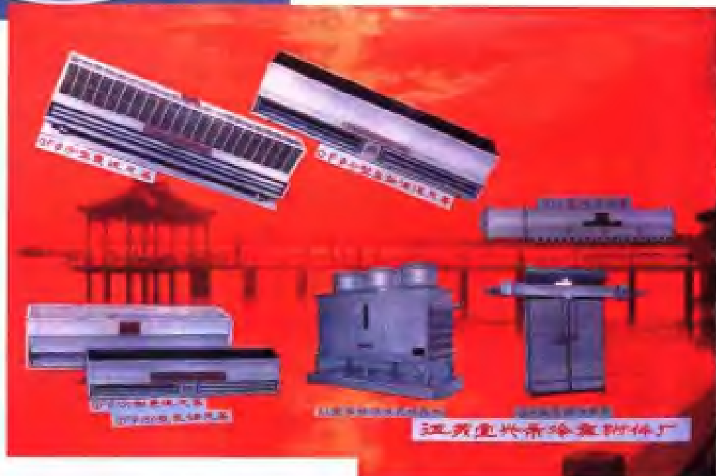
江苏宜兴市冷库附件厂