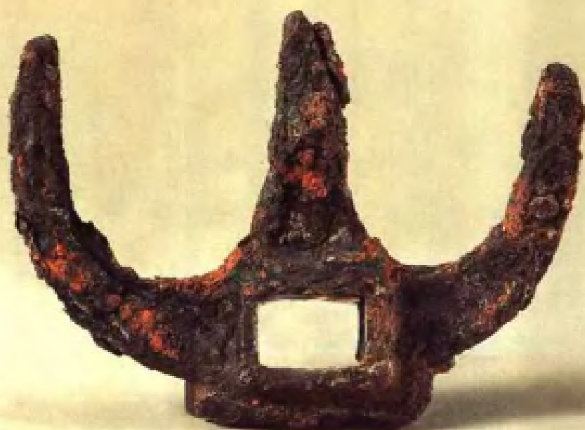
铁耒·战国 时代·徐州利国 驿出土·现藏南 京博物院