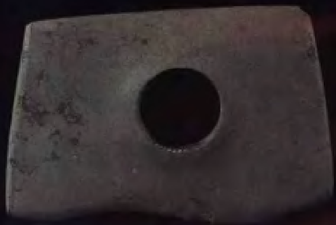
石锄·新石器良渚文化·吴江梅墟出土·现藏南京博物院