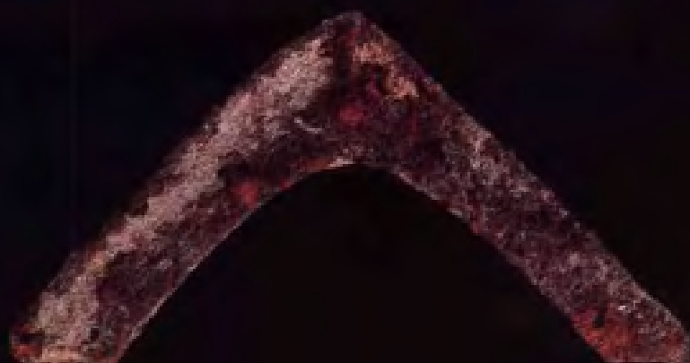
“三角形”犁铲·宋代· 扬州出土·现藏南京博物院