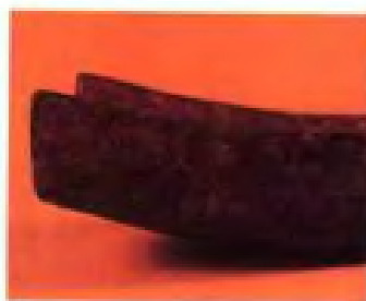
青铜箕(I、II)·西 周时代·仪征破山口出 土·现藏南京博物院