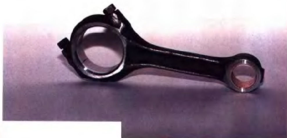
S195 连杆·泰兴 市农机修造厂产品