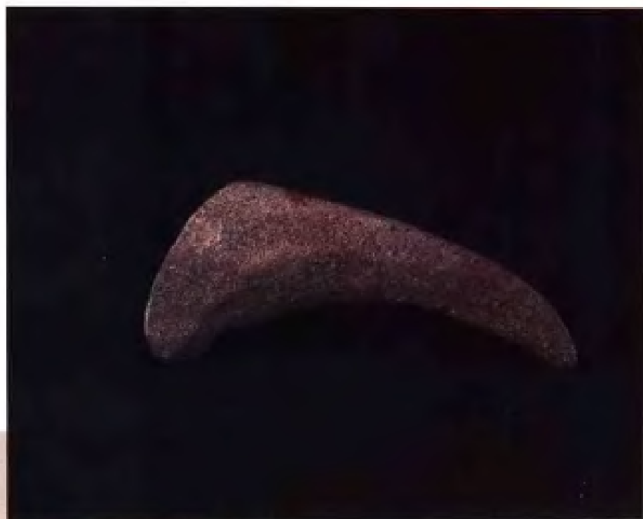
铎·新石器时代·南京锁金 村出土·现藏南京博物院