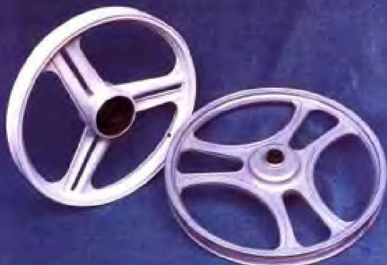
助动车车圈·无锡江潮实业总公司产品