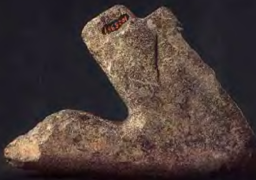
石犁·新石 器时代·昆山荣 庄出土·现藏南 京博物院