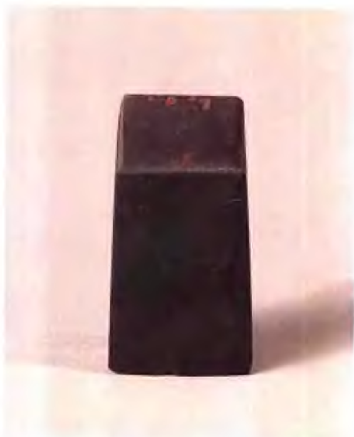
有肩石铧·新石器时代· 海安青墩出土·现藏南京博物院