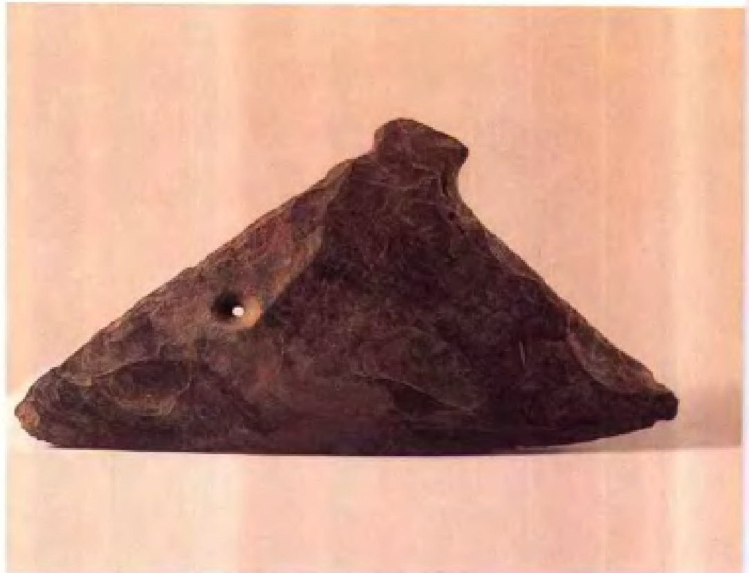
石犁·春秋 时代·吴县消夏 湾出土·现藏南 京博物院