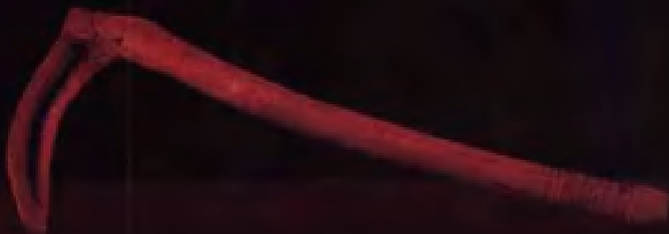
角镰·新石器青莲岗文化·邳县大墩子出土·现藏南京博物院