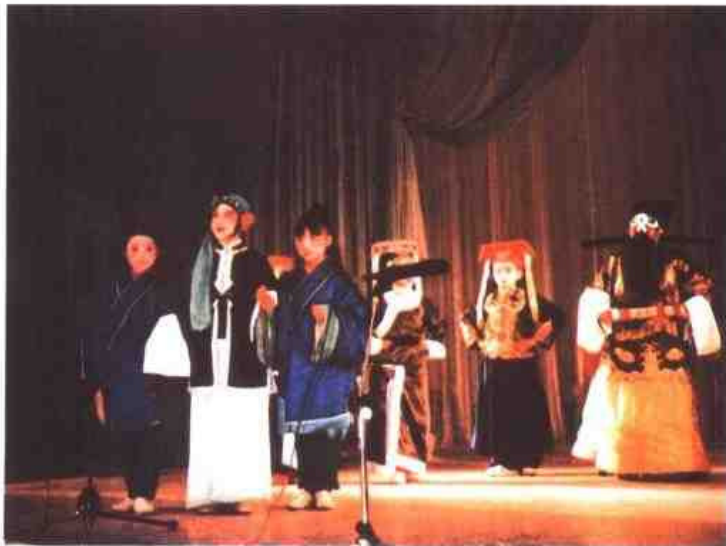
△ 镇江市京口实验小学少年儿童业余京剧班演出《秦香莲》。