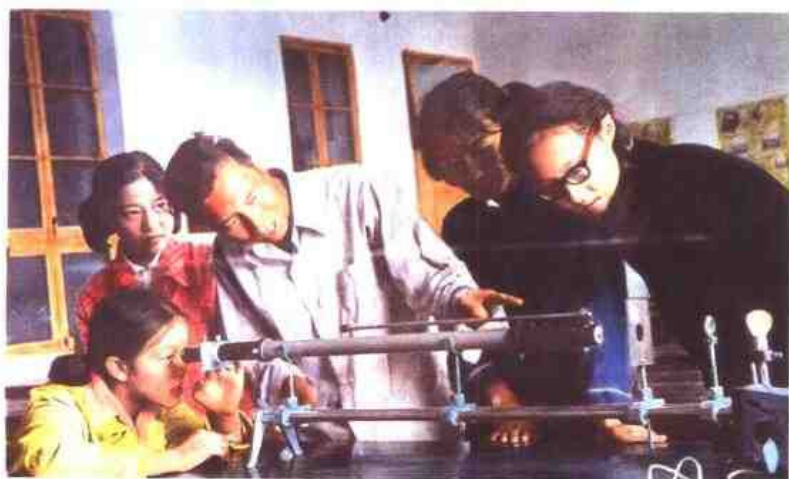
◁ 江苏省南通中学，前身是1906年创建的通海五属公立中学。图为学生在进行课外物理实验活动。