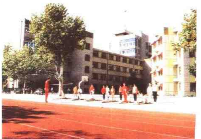
▷ 常州市局前街小学，前身是创办于1902年的武阳公立两等小学堂。图为该校学生在进行体操训练。