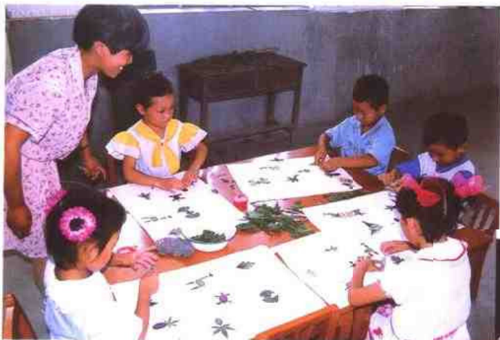
△ 昆山市千灯镇前进村幼儿园小朋友在进行美工操作。