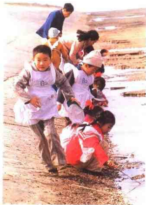
▽ 如东县实验幼儿园教师带领小朋友看大海，进行乡土教育。