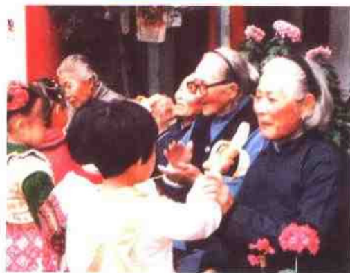
△ 连云港市海州区中心幼儿园注意从小培养尊敬老人的优良品德。图为小朋友在敬老院慰问老奶奶。