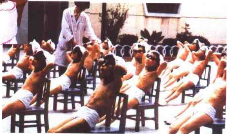
▷ 无锡市实验幼儿园是省实验示范幼儿园之一。该园的幼儿“三浴”锻炼曾在全国报道。图为小朋友在进行日光浴。