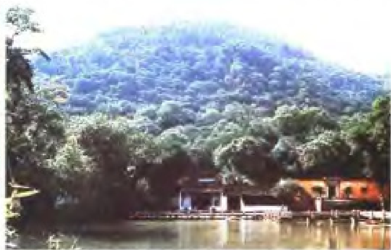
▽ 范仲淹纪念馆，于今江苏省苏州市西郊天平山麓。