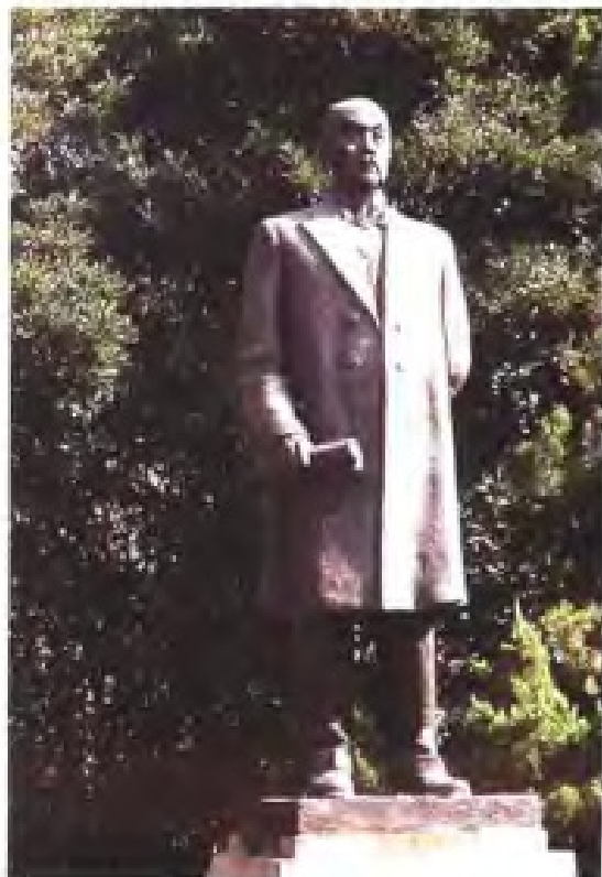
▷ 啬公(张謇)墓，于今江苏省南通市南郊。