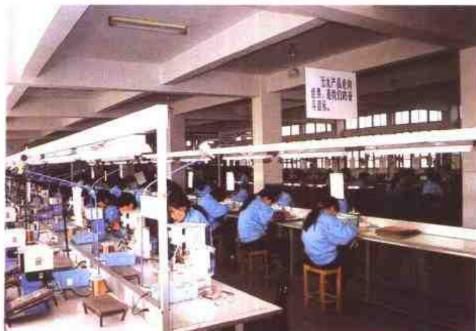
△ 苏州市第三十八中学实施勤工俭学，“育人”、“创收”效益显著。图为校办企业久利工贸实业总公司车间一角。