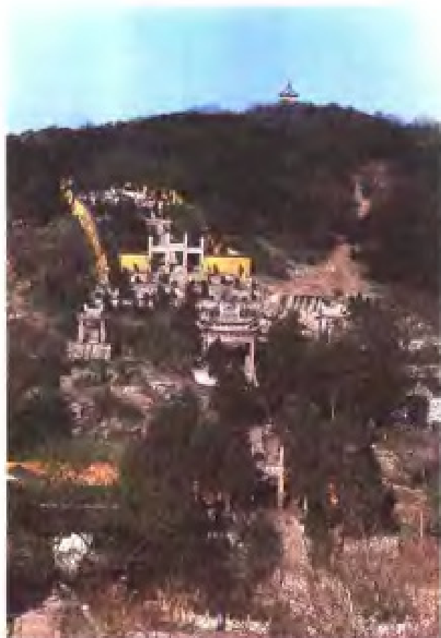
◁ 言子(言偃)墓，于今江苏省常熟市北郊。