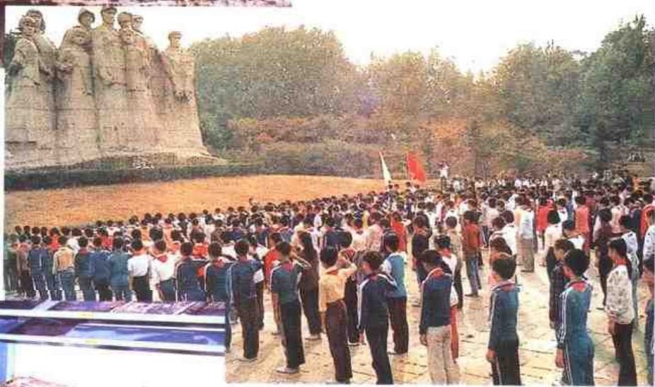
▷ 南京市第一中学，前身是1927年创办的“首都中区实验学校”。图为该校师生凭吊雨花台革命烈士。