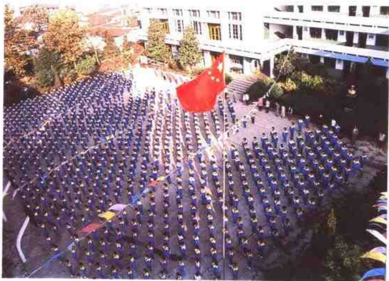
△ 无锡市连元街小学、前身是本省最早由国人于1897年自办的赅实学堂。图为学生高唱“五星红旗迎风飘扬……”。