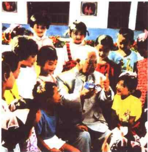
◁ 南京市鼓楼幼儿园。图为幼教专家陈鹤琴(1892~1982)为该园小朋友讲飞船的故事。