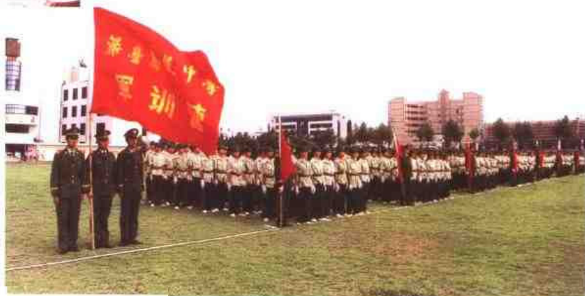
▷ 张家港市江苏省梁丰中学，前身是1894年创办的梁卡书院。该校十分重视开展军训等多种形式的“淬砺教育”。