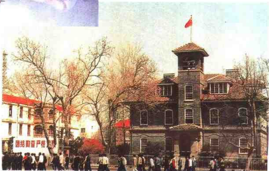
▷ 南京金陵中学，前身是美国美以美会1888年创办的汇文书院。图为校园内至今犹存的当年钟楼。