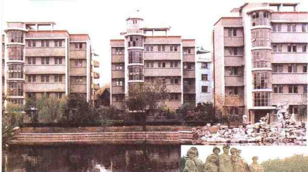
◁ 南京师范大学附属中学，前身是1902年创办的三江师范学堂附属学校。图为该校学生宿舍。