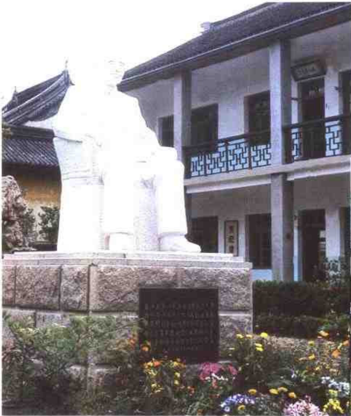
▽ 吴县角直中心小学，原址为元代甫里书院。二十年代前后，教育家叶圣陶（1894～1988）曾在此执教。图为学生在叶先生墓前整理花草。