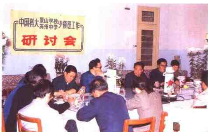
◁ 1985年，苏州中学与中国科技大学创办了中国科大苏州中学少年预备班。