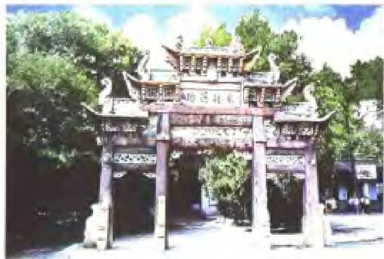
△ 东林书院旧迹，于今江苏省无锡市东城。