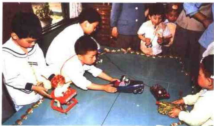
◁ 南京市实验幼儿园是国家教委实施《幼儿园工作规程》试点园及省教委实验园。图为该园小朋友在操作电动玩具。