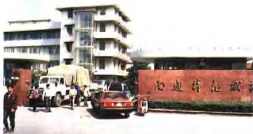
(48) 南通市棉花机械厂