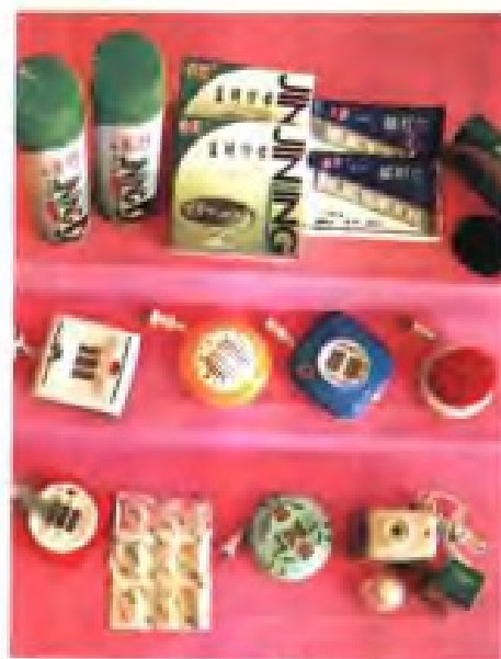
(49) 南京市供销社与港商合资的宁港蚊香开发有限公司生产的系列产品