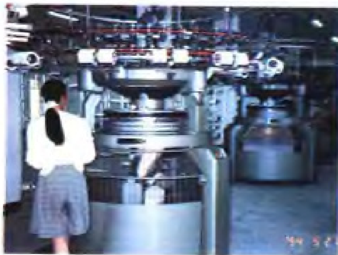
(47) 省棉麻集团总公司、张家港市农资公司与美商合资兴办的兴华针织有限公司针织面料生产线