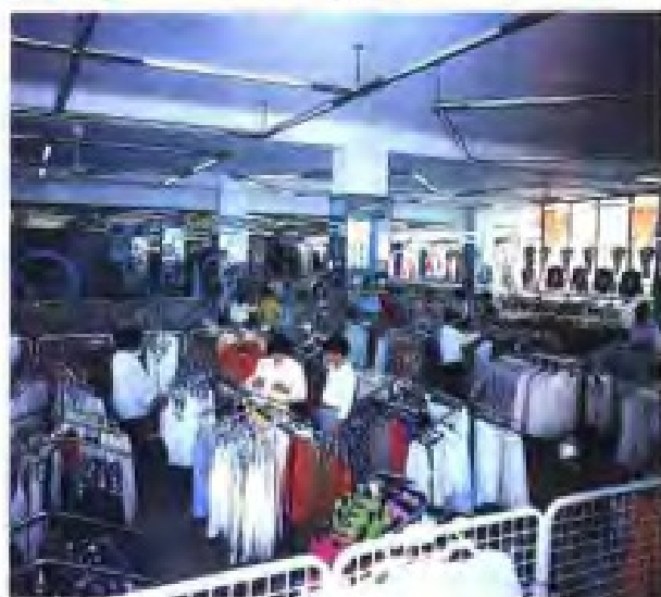
(25) 盐城商场的服装营业厅