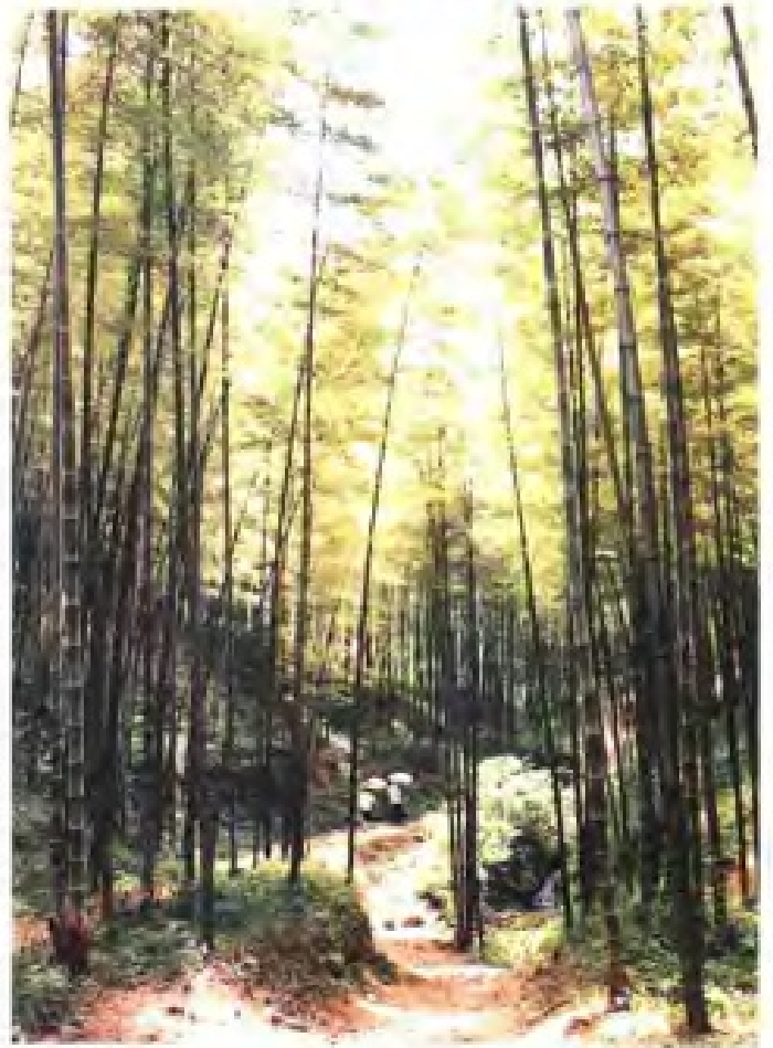
(41) 溧阳市供销社扶持发展的刚竹基地