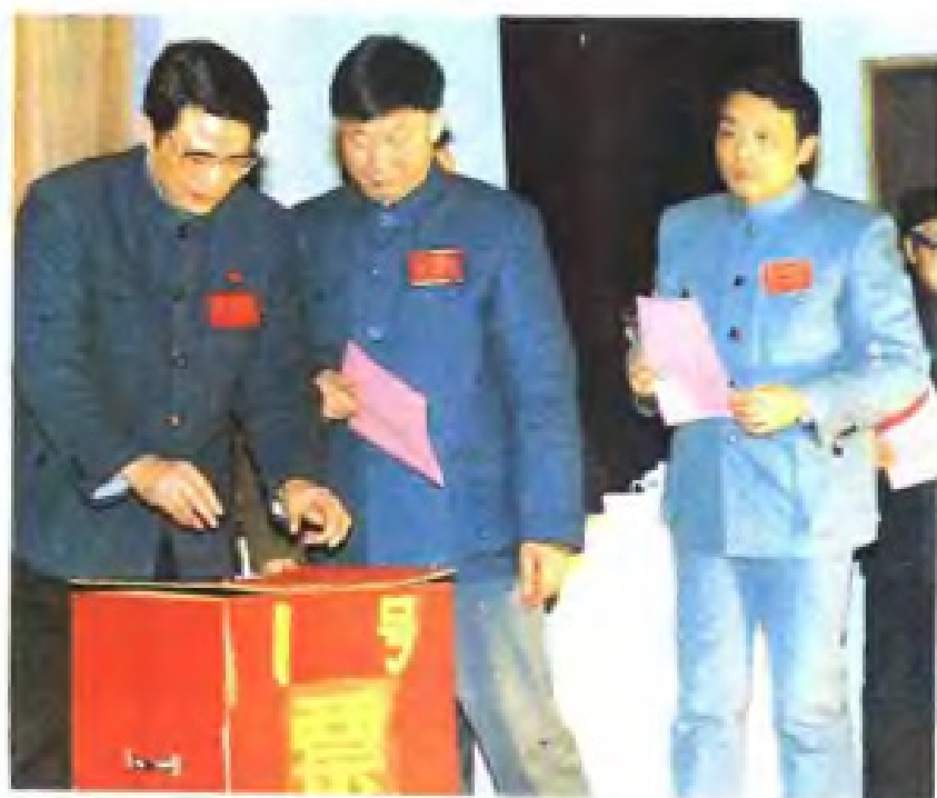
(3) 省供销社四届社员代表投票选举省供销合作总社领导成员