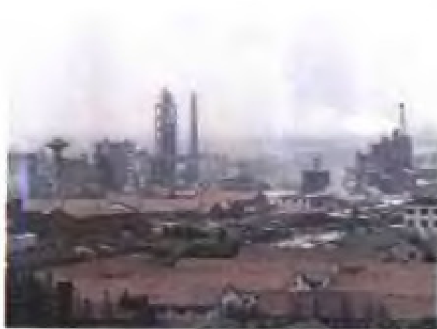
(44) 省棉麻集团总公司、张家港第三水泥厂与美商合资兴办的格林顿特种水泥有限公司