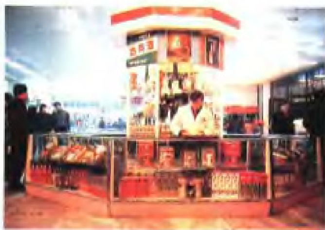
(13) 淮安供销大厦商场