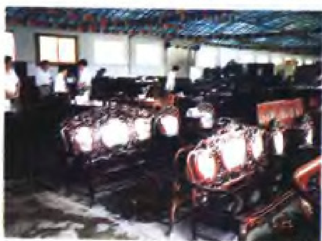
(17) 无锡县洛社供销社锡西家具城