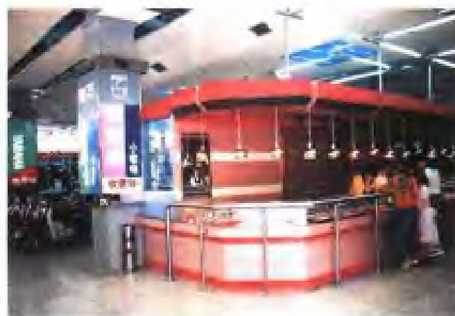
(22) 常熟市虞城商场首饰专柜