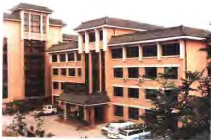
(7) 镇江市供销社集团总公司大厦