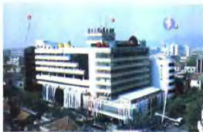
(12) 连云港市供销社建立的东方大厦