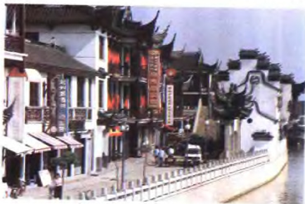
(18) 武进县 供销社 商业街