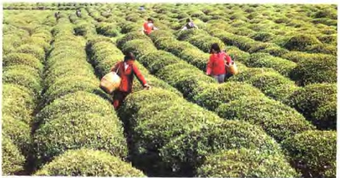
(43) 吴县供销社扶持发展的茶叶基地