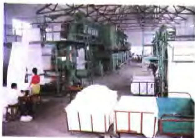
(50) 启东市供销社与港商合资的欣捷服装辅料有限公司生产车间