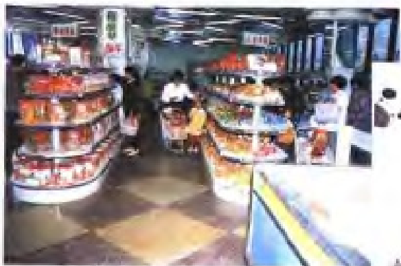
(6) 南通市果品公司跃龙商场二楼自选商品部