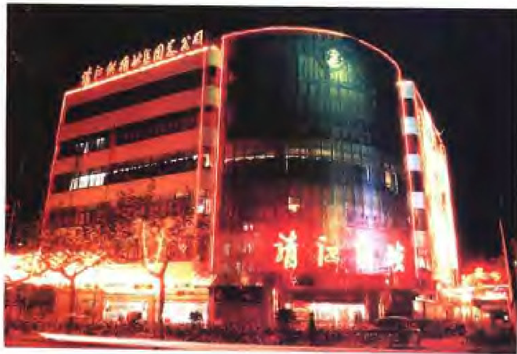
(27) 靖江市供销社的靖江商城