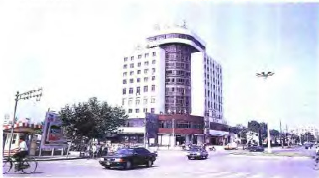
(4) 扬州市供销社建立的扬州大厦