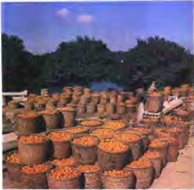
(40) 吴县供销社扶持发展的东山桔林