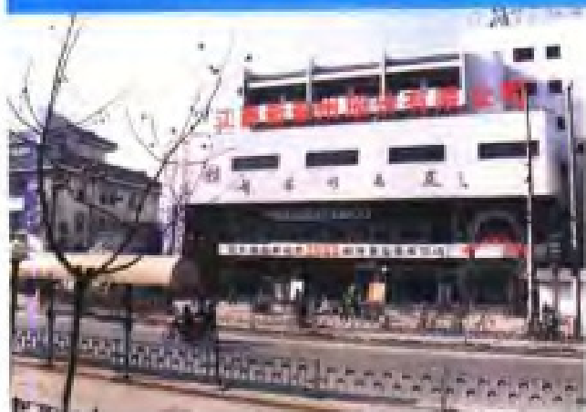
(19) 苏州市供销社建立的新苏州商厦