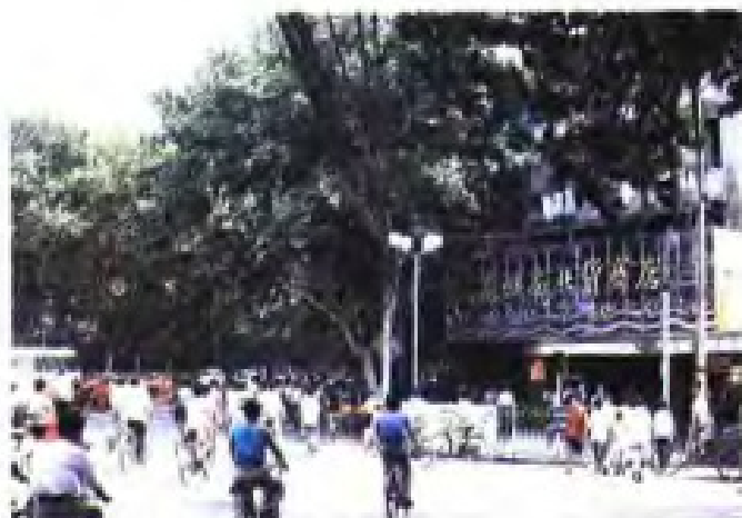
(11) 南京长江南北货商店