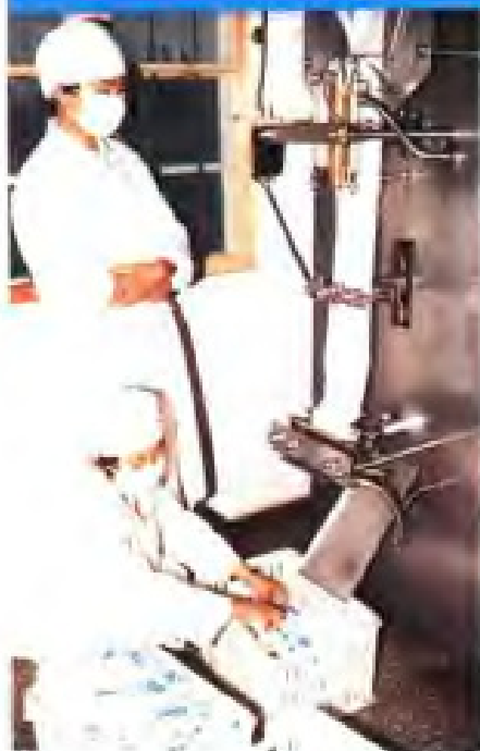
(36) 盐城市郊区供销社奶牛场