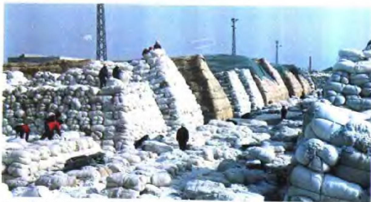
(35) 射阳县新桥供销社棉花收购站棉花整装待运