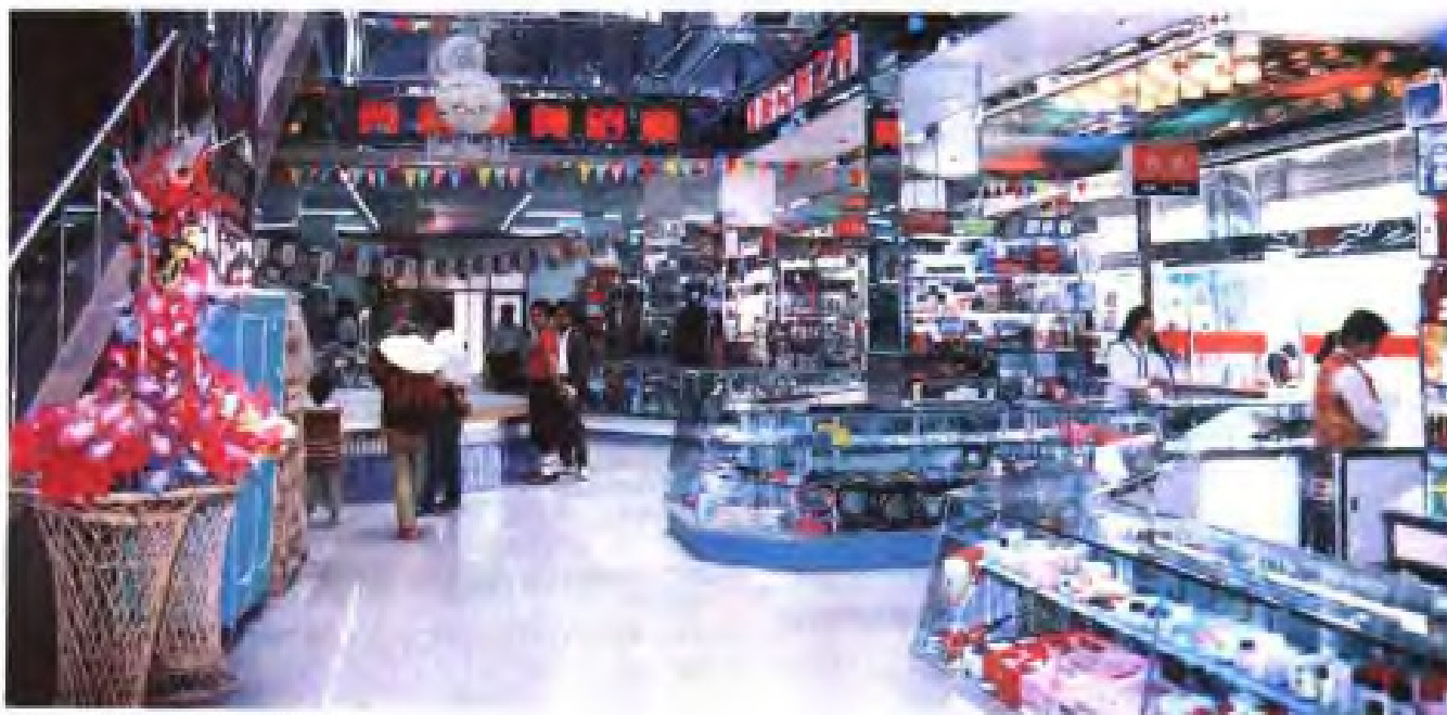
(23) 张家港市锦丰商场