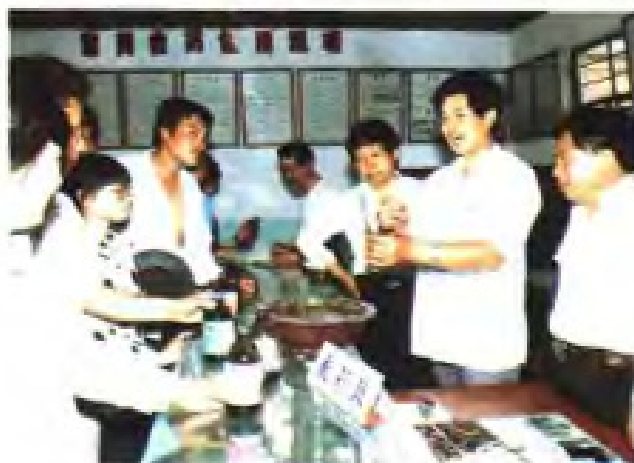
(30) 大丰县大龙供销社专门设立“庄稼医院”为农服务