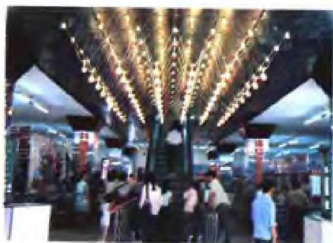
(16) 宜兴市供销社苏南商厦营业厅