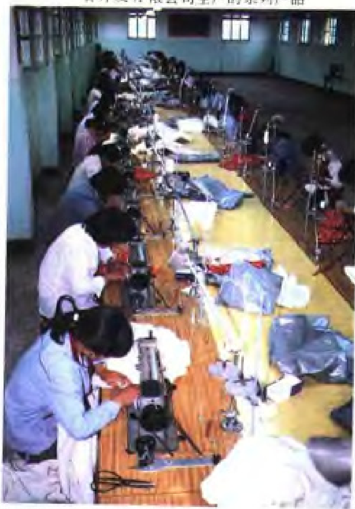
(52) 沛县羽绒服装厂生产车间