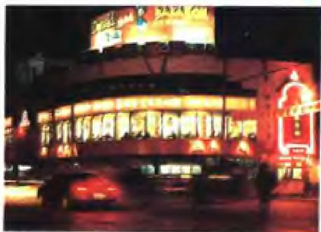
(14) 无锡市三阳公司南北货商场