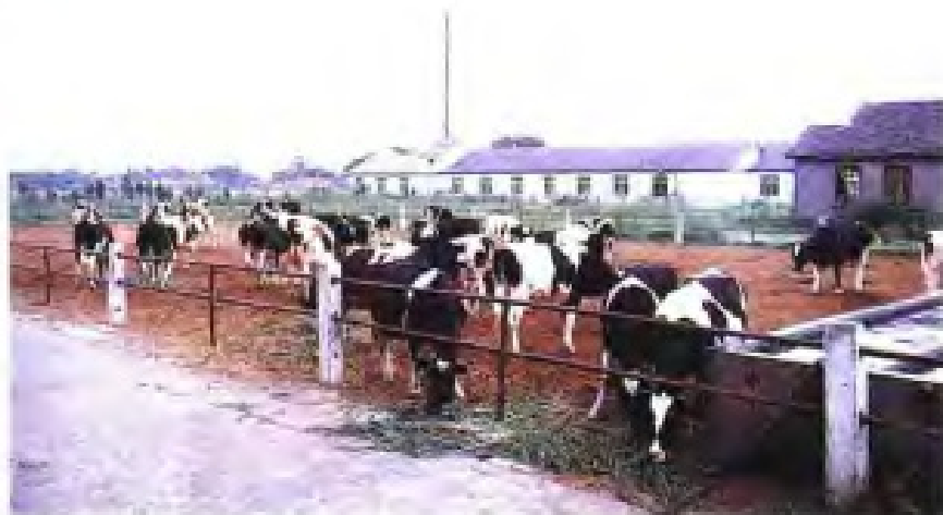
(37) 盐城市郊区供销社兴办奶牛场,向市场提供新鲜牛奶