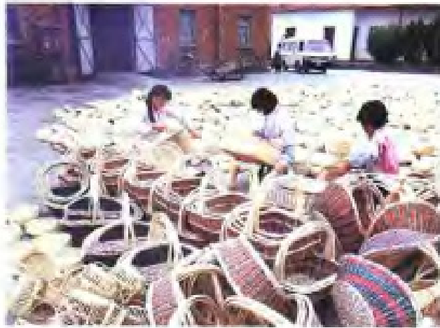
(42) 扬中县供销社组织的杞柳制品生产基地,为出口创汇提供资源