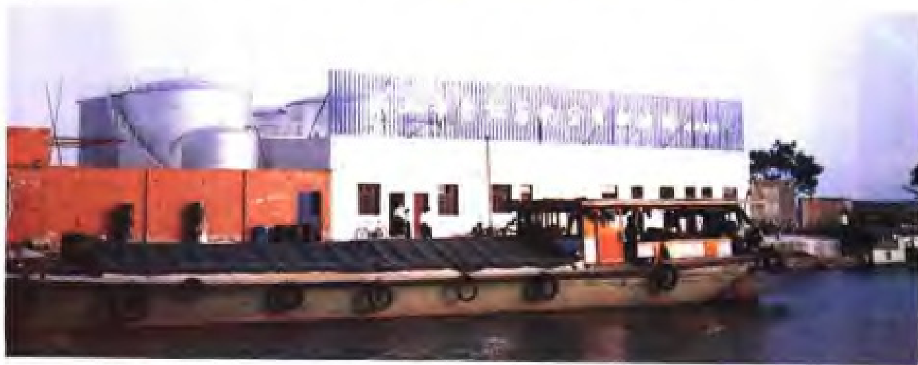
(39) 吴江市供销社垂虹石化公司水上加油站