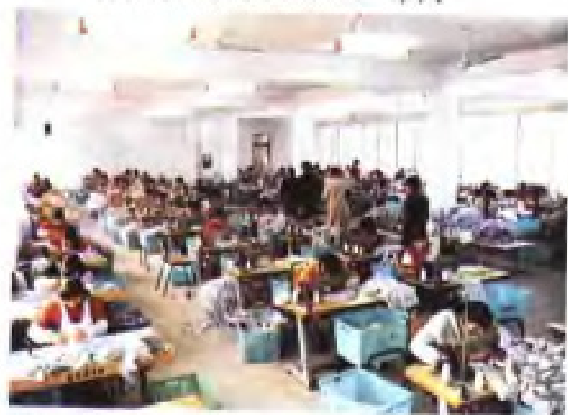
(51) 海门县供销社与澳商合资的爱迪克制衣有限公司