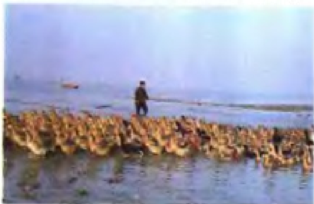
(34) 高邮市菱塘回族乡供销社饲养的种鸭