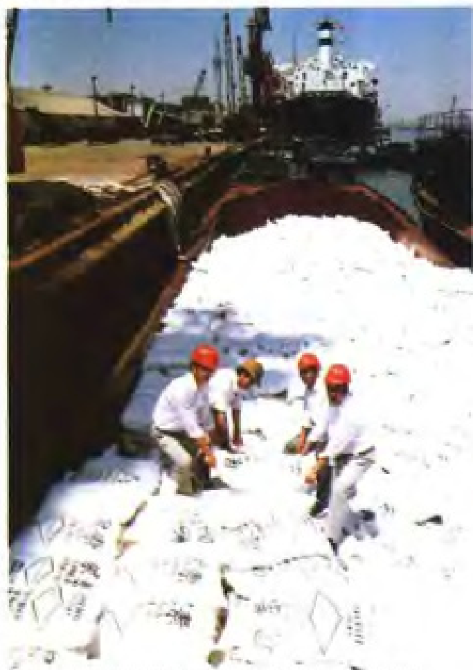
(28) 江苏省农资公司从科威特进口的尿素正在上海港口装卸