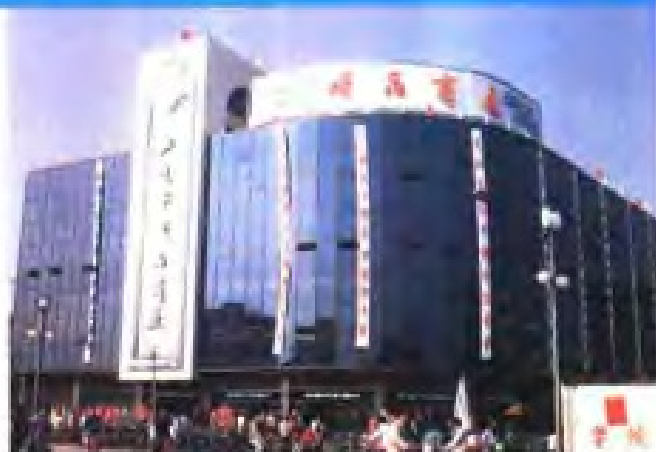
(20) 江阴市供销社精品商厦