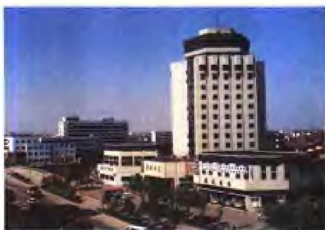
(21) 常熟市供销社虞城大厦