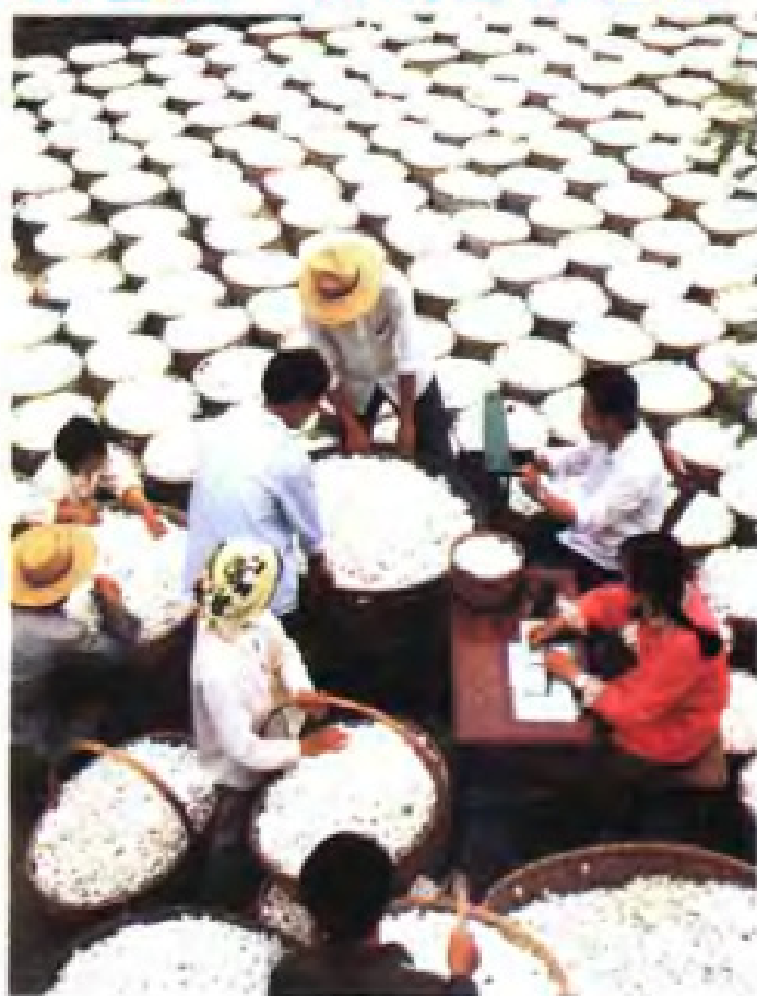
(33) 海安县海北供销社正在收购鲜茧