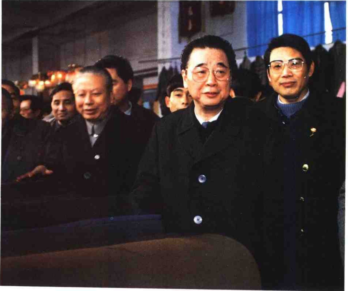
(1) 1990年1月20日,国务院总理李鹏(中),在全国供销合作总社代主任潘遥(左)、江苏省供销合作总社主任周秀德(右)陪同下,视察无锡市郊区供销社商场