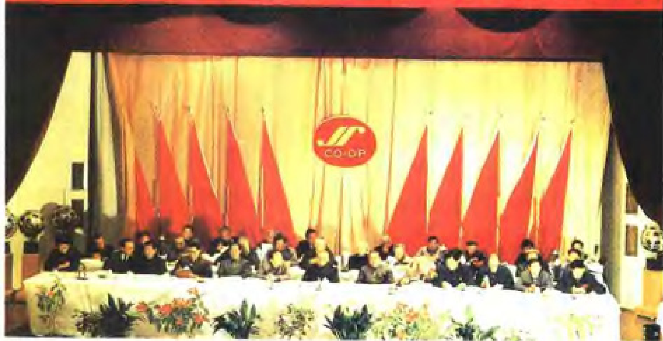
(2) 江苏省供销合作总社 1990 年 1 月召开第四届社员代表大会, 图为大会主席台