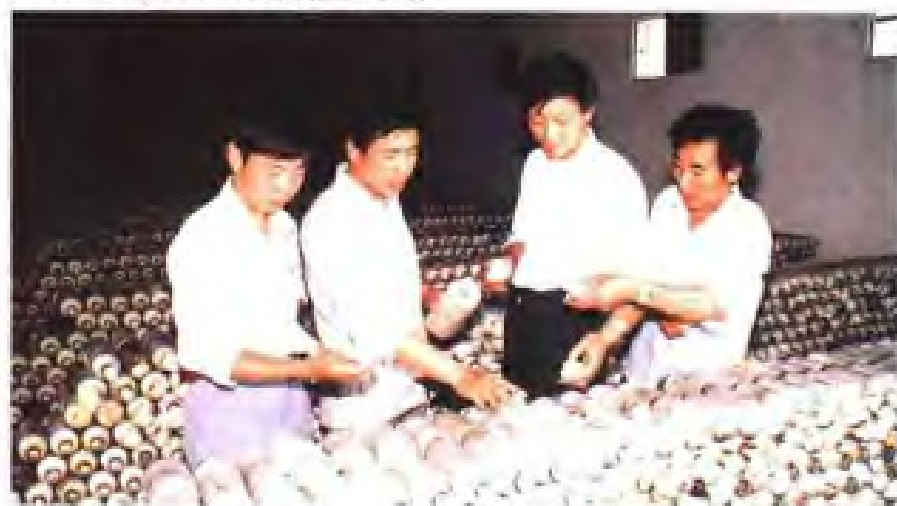
(38) 东台市富东供销社食用菌场生产的猴头菇