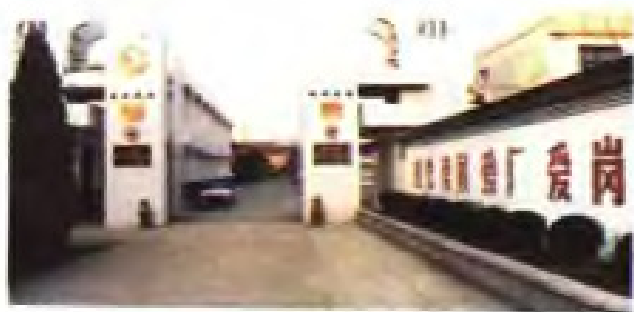
(46) 国家二级企业张家港市锦丰轧花厂