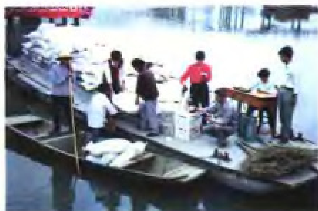
(29) 兴化市海南供销社送肥下乡