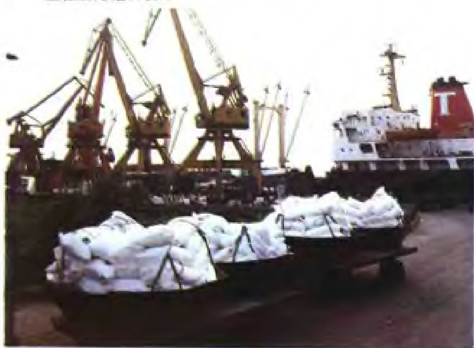
(31) 江苏省农资公司从沙特阿拉伯进口的化肥在镇江大港装运