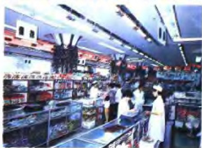
(15) 常州市供销社副食品商场