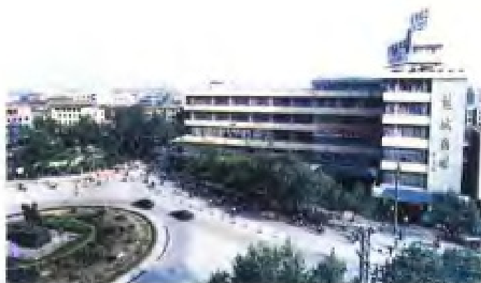
(24) 盐城市郊区供销社兴建的盐城商场