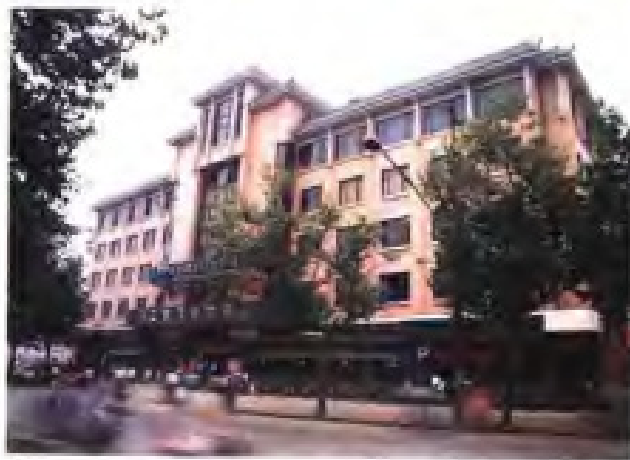
(8) 江苏最早成立的集体商业企业集团公司——镇江大鹏集团公司商场