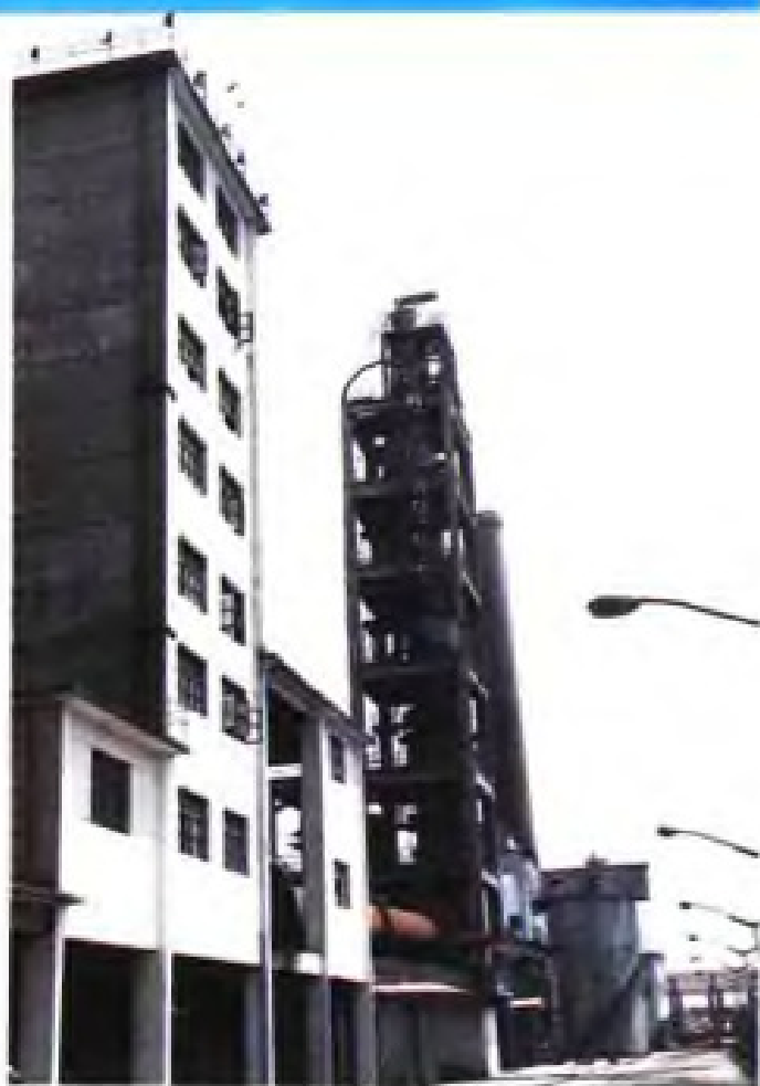
(45) 张家港市格林顿特种水泥有限公司五级旋风预热器水泥熟料生产线