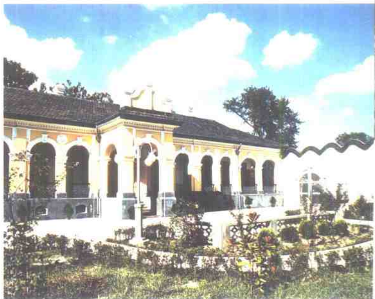
临时大总统办公室