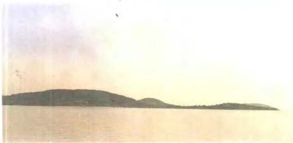
三山岛旧石器地点