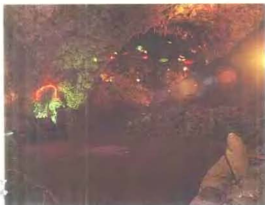
南京汤山猿人发现地点和溶洞