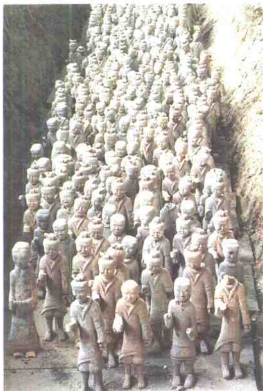
狮子山汉兵马俑坑