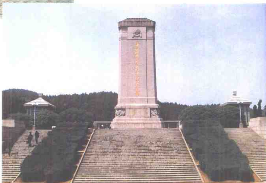
淮海战役烈士纪念塔