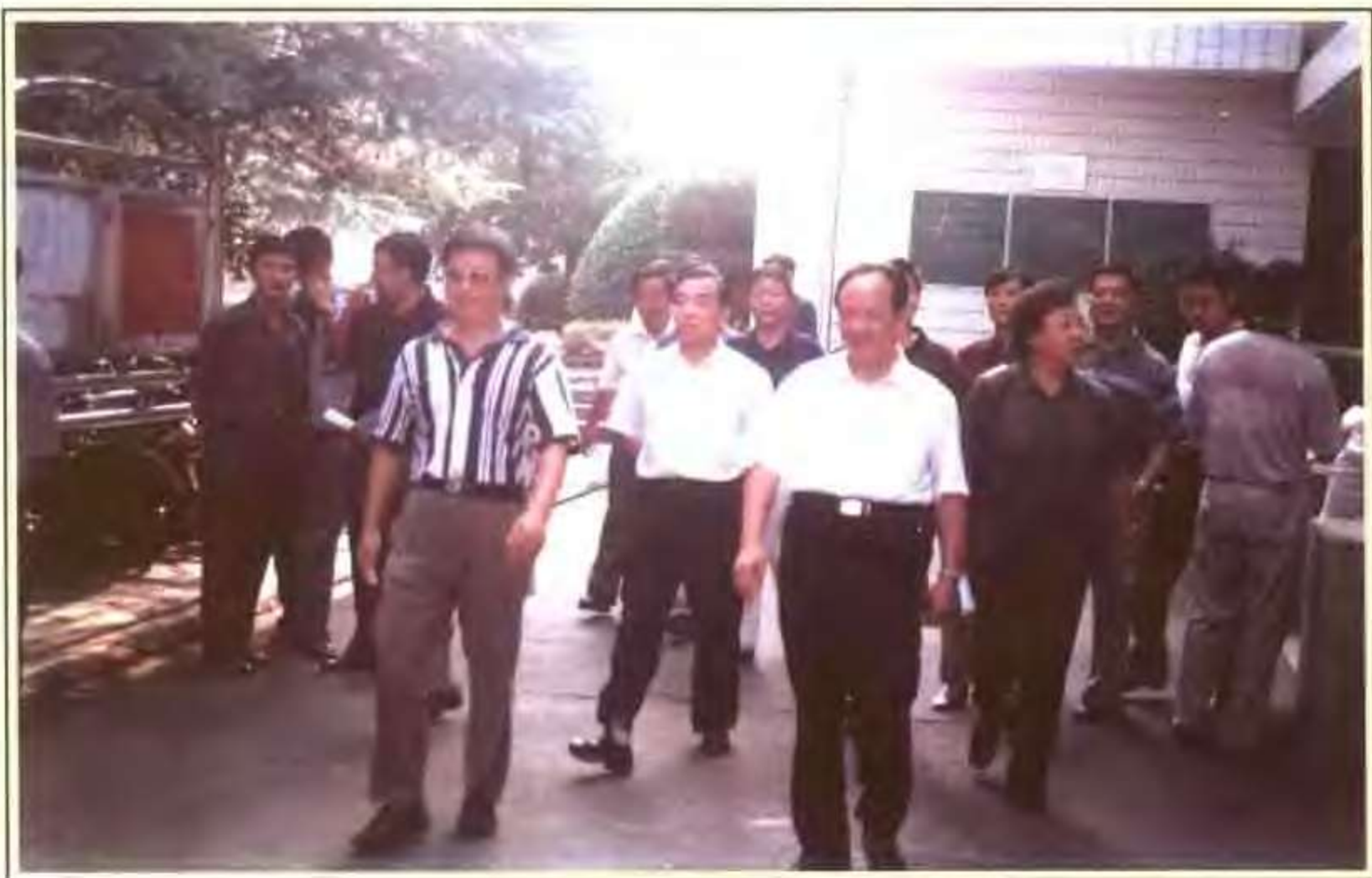
省委副书记方兆祥视察绩溪中学（2002.9）