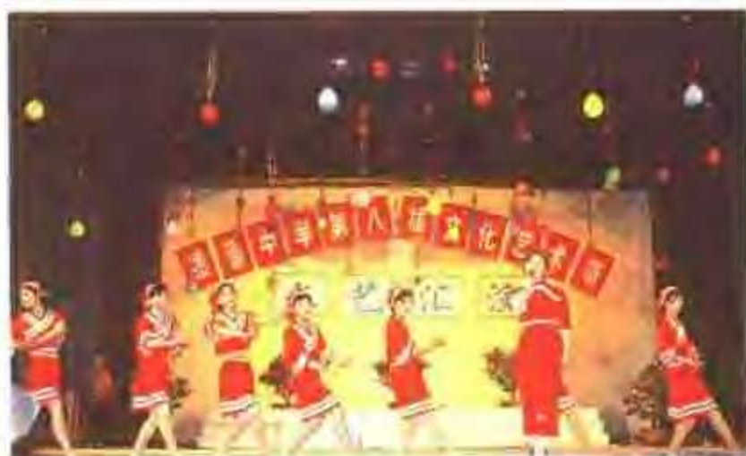
绩溪中学文化艺术节