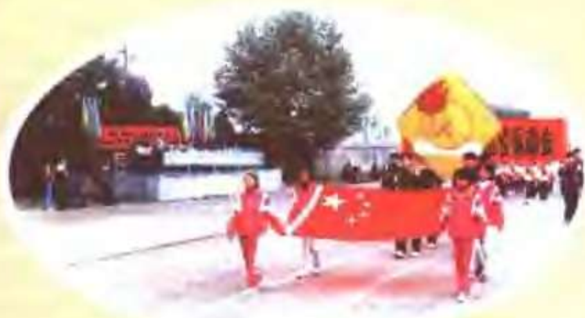
全县中小学生运动会开幕式