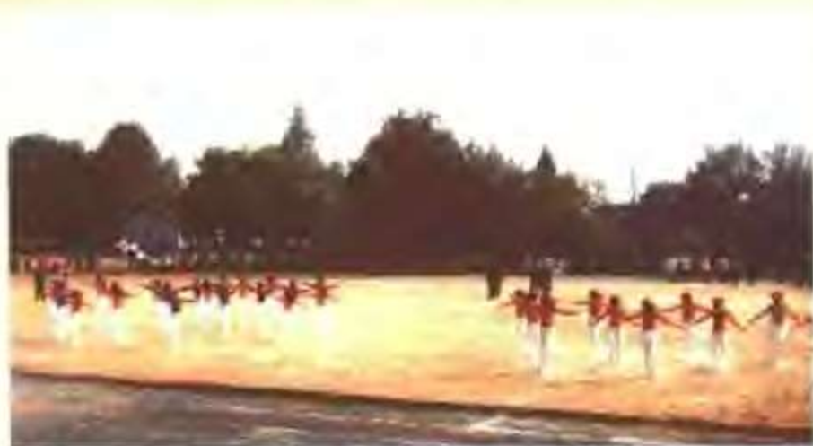
全县少儿广播操比赛