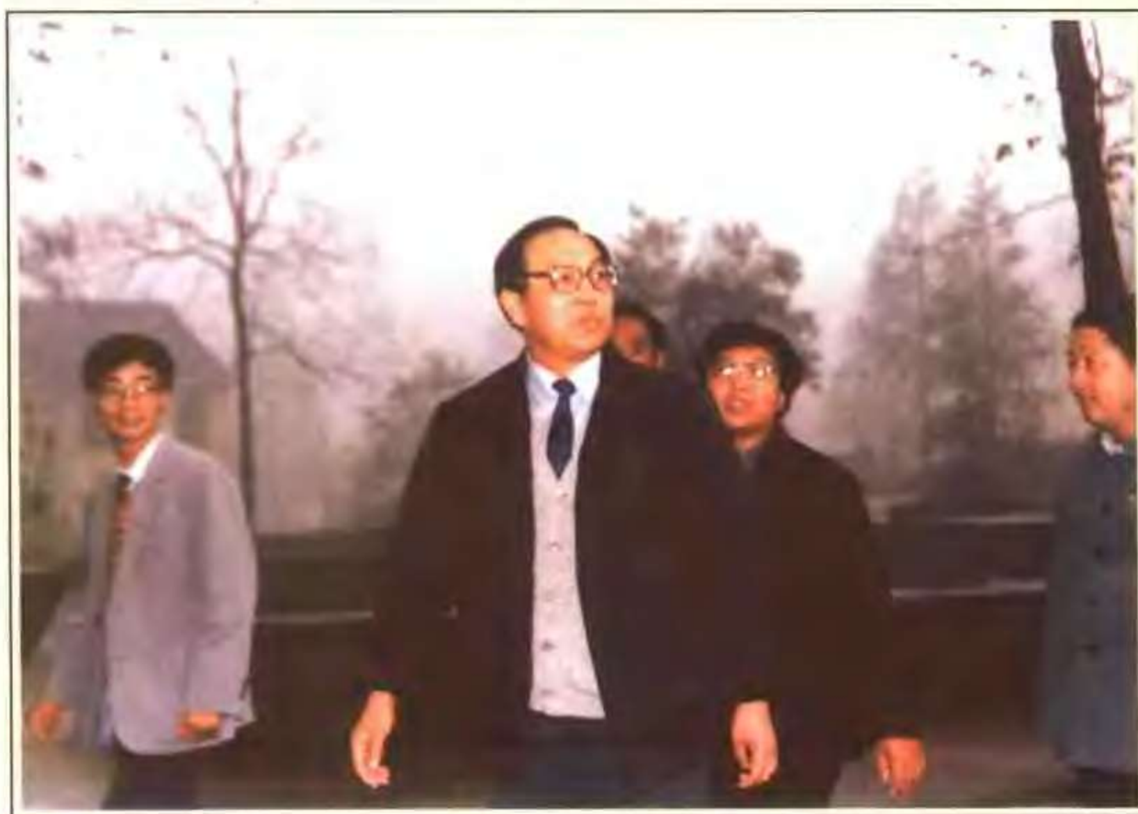
副省长杜宜瑾视察绩溪中学（2002.11）