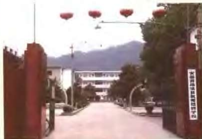
绩溪县教师进修学校