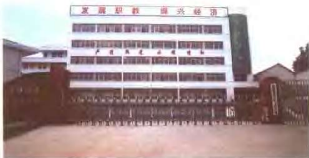
绩溪县高级职业中学