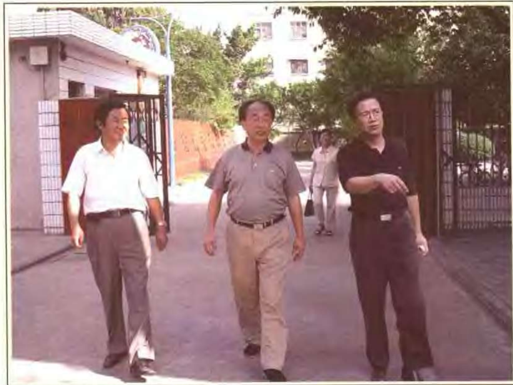
省教育厅厅长陈贤忠视察绩溪中学（2005.6）