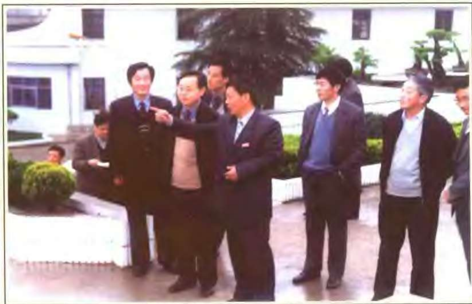
副省长蒋作君视察华阳中学（2001.4）