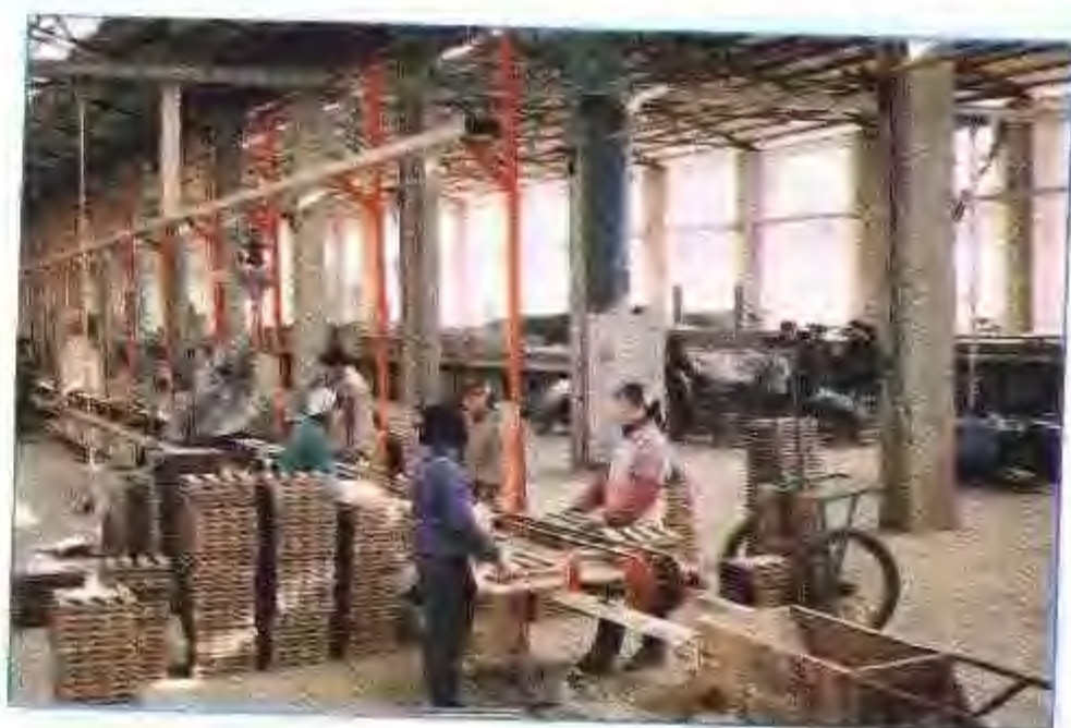
无为县建筑陶瓷厂墙地砖车间