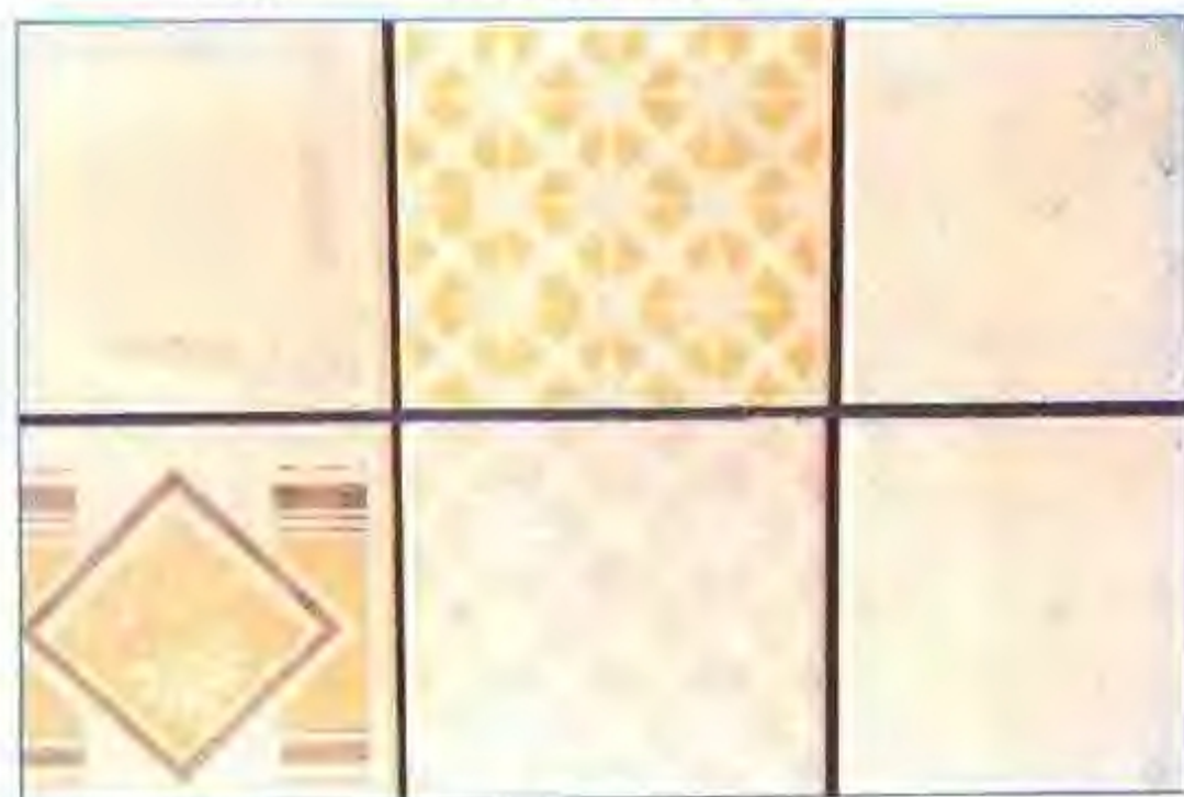
釉面砖——淮南市陶瓷厂产品