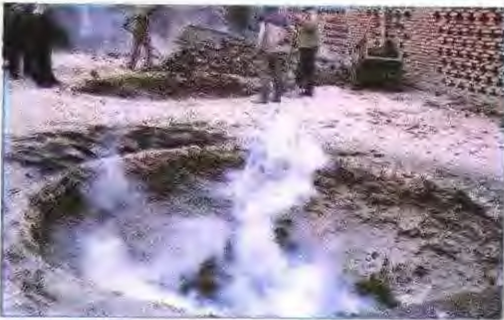
60 年代濉溪县烈山民办水泥厂地窑（俗称蛋窑）