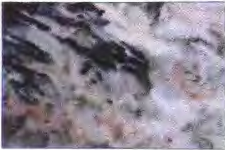
五彩玉 (大理石板材)