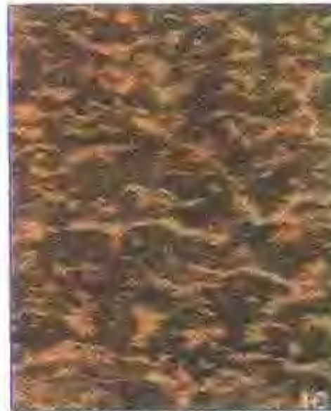
稻香玉 (大理石板材)