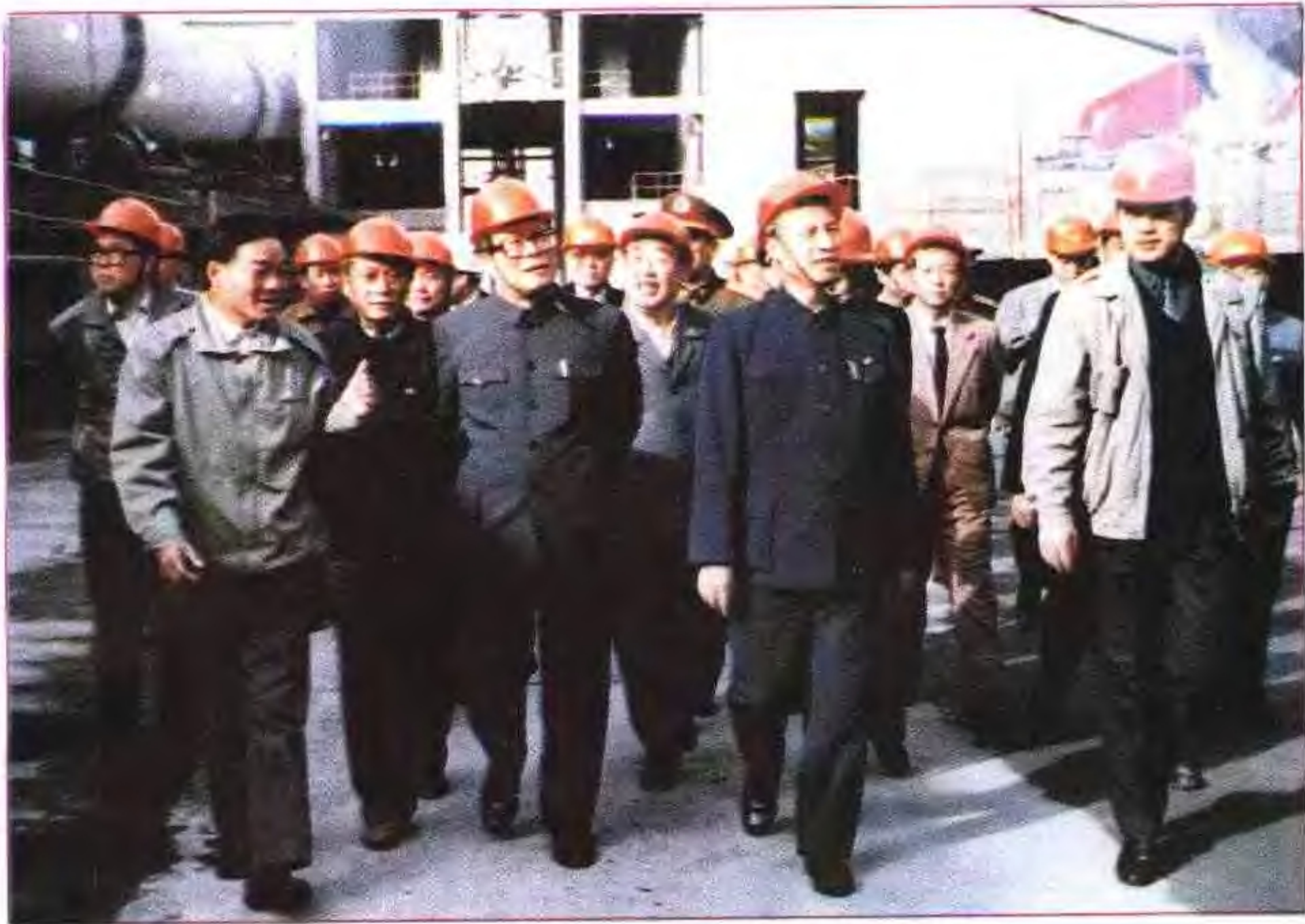
1991年11月江泽民总书记视察安徽省巢湖水泥厂