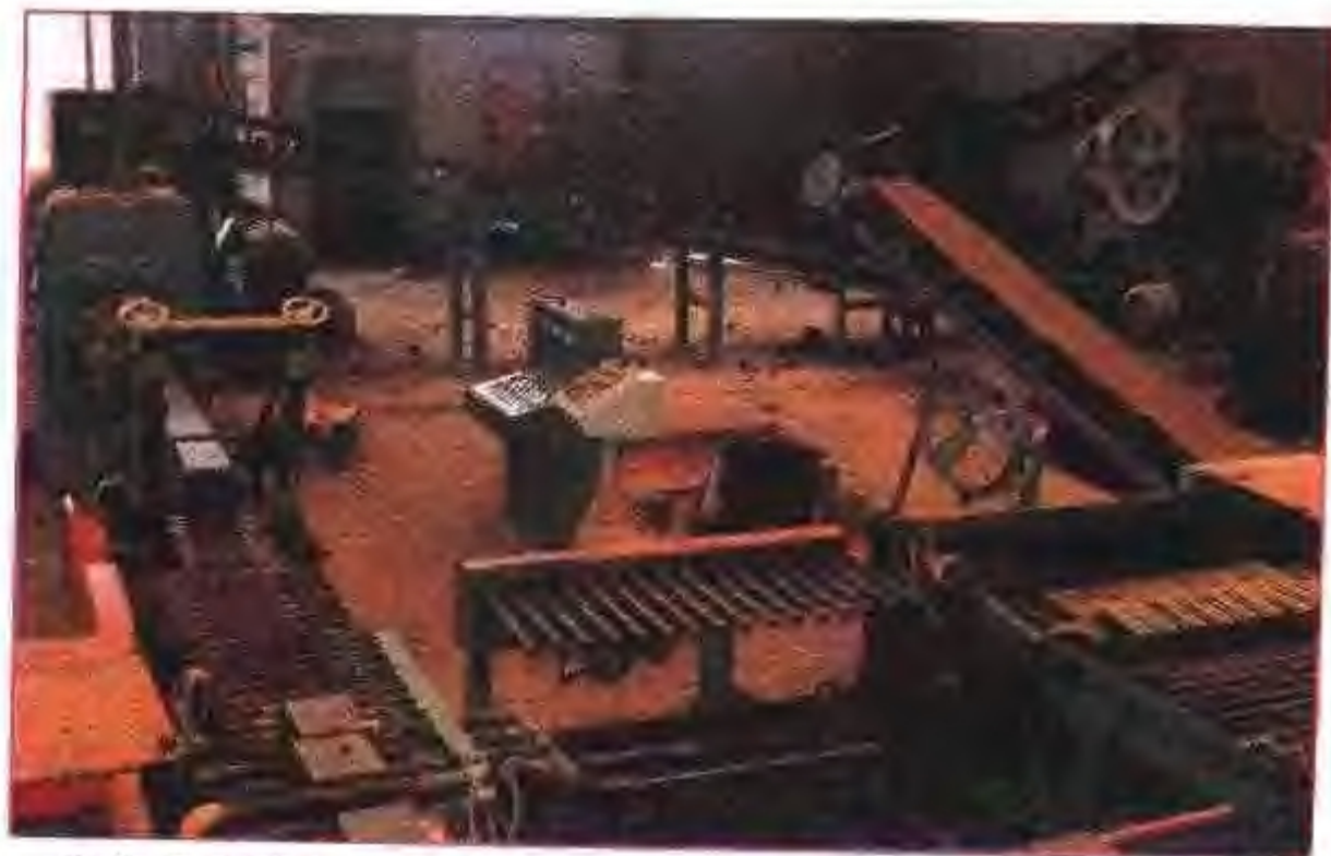
安徽省先进的空心砖生产企业——肥西县新型建筑材料厂