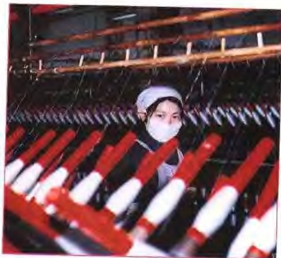
马鞍山市玻璃纤维厂生产线