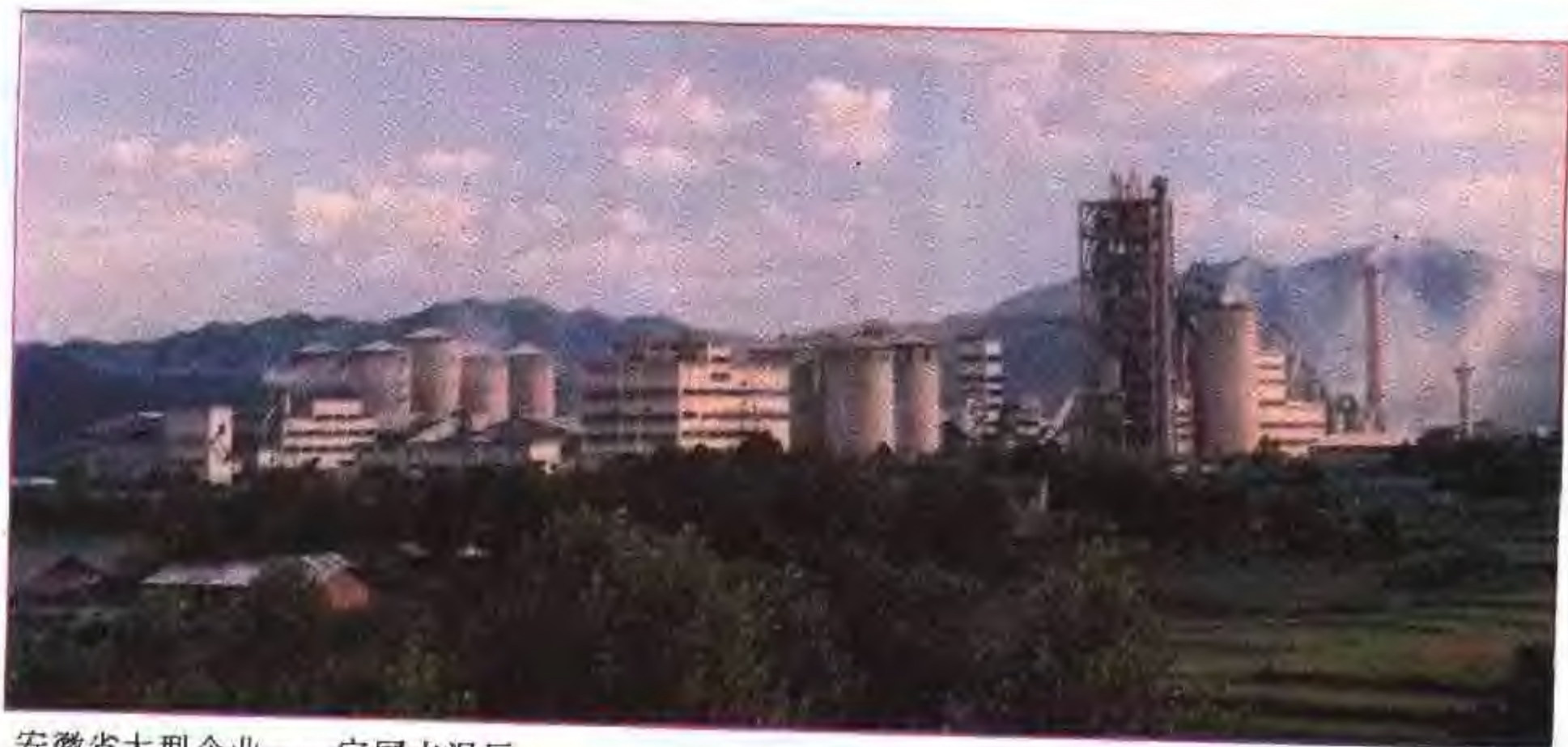
安徽省大型企业——宁国水泥厂