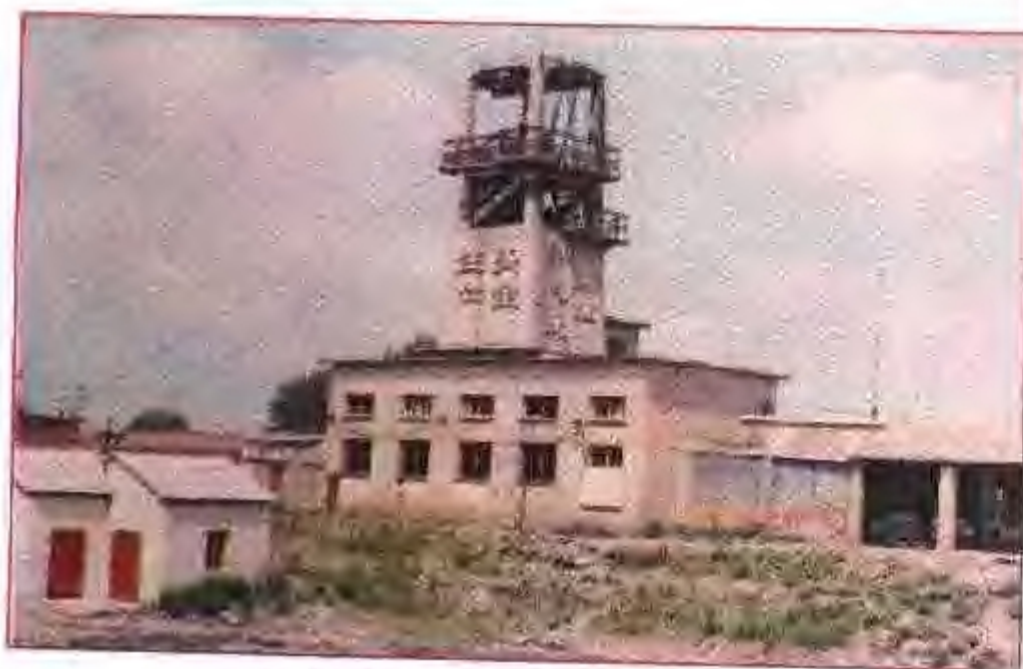
定远石膏厂矿井井架