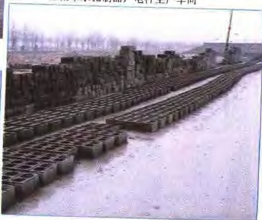
农房砌块——宿县水泥厂产品