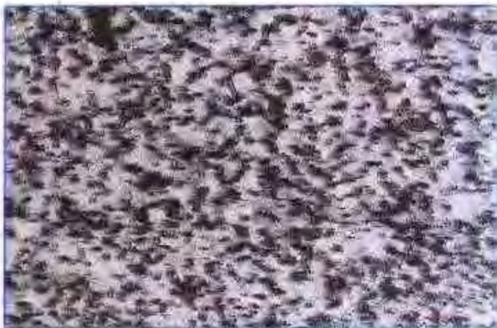
芝麻白 (花岗石板材)