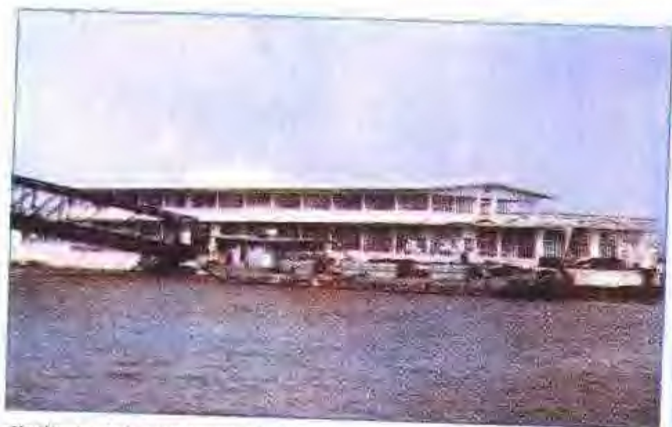
芜湖市水泥船厂建造的 3.5 万吨水上自来水厂船