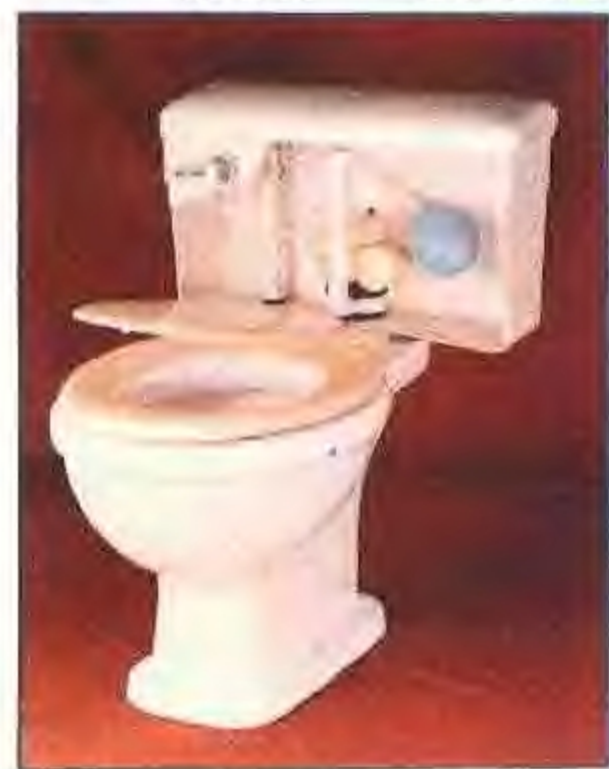
省优产品——淮南市陶瓷厂生产的抽水马桶