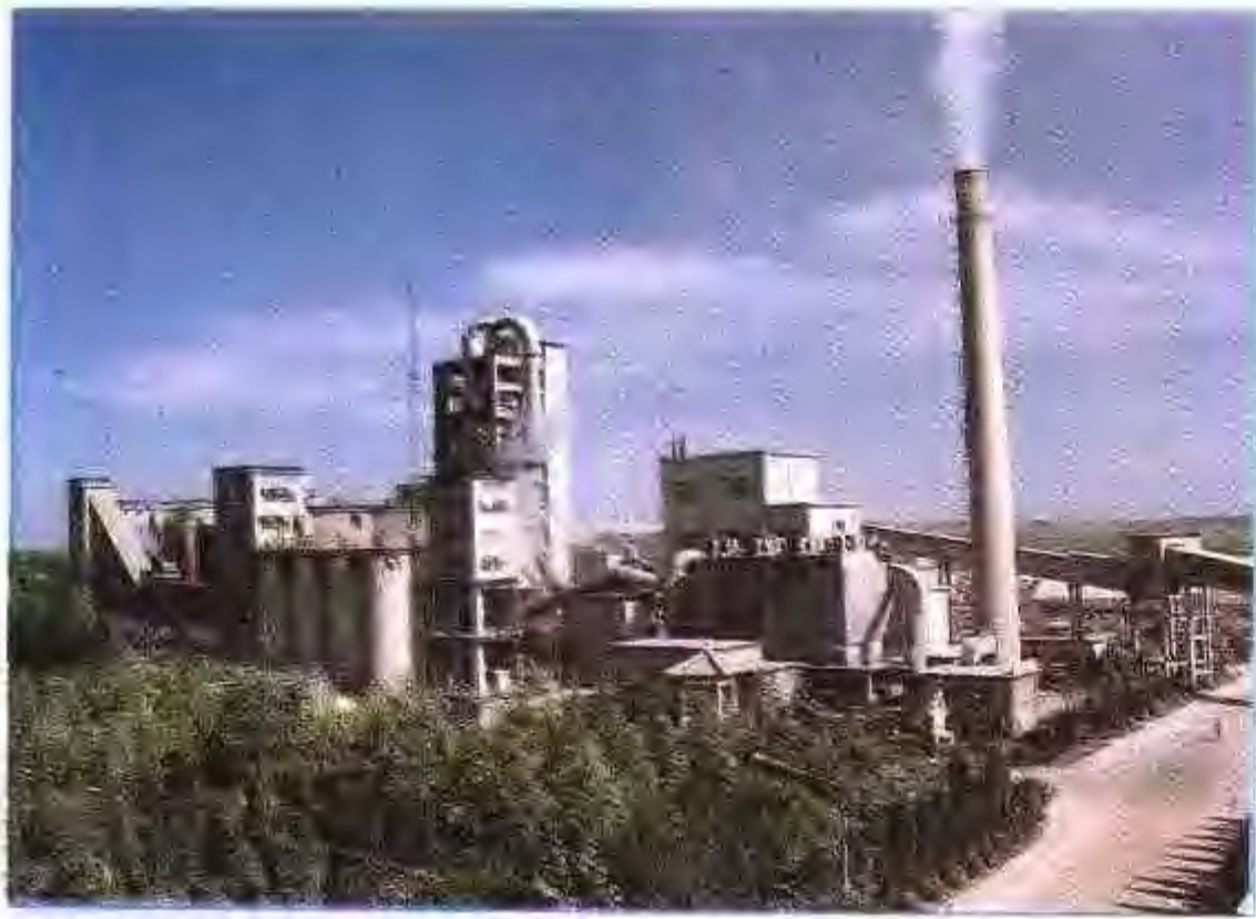
安徽省东关水泥厂日产 700 吨窑外分解干法生产线