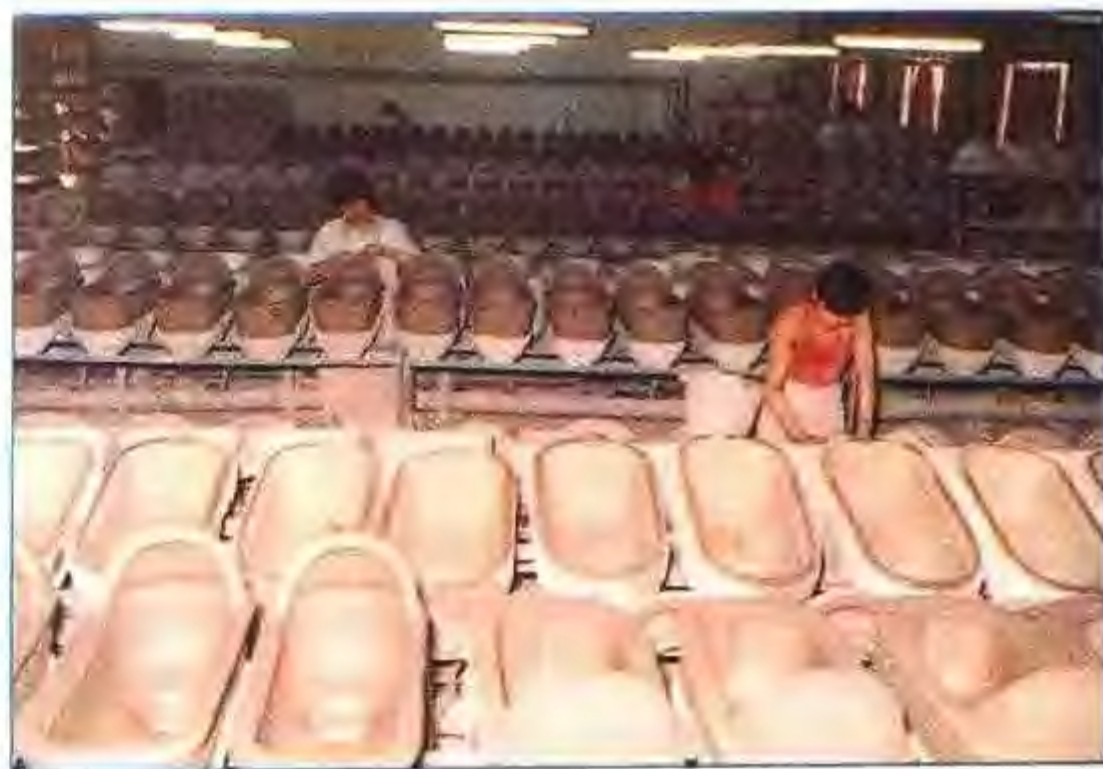
淮南瓷厂卫生瓷生产车间