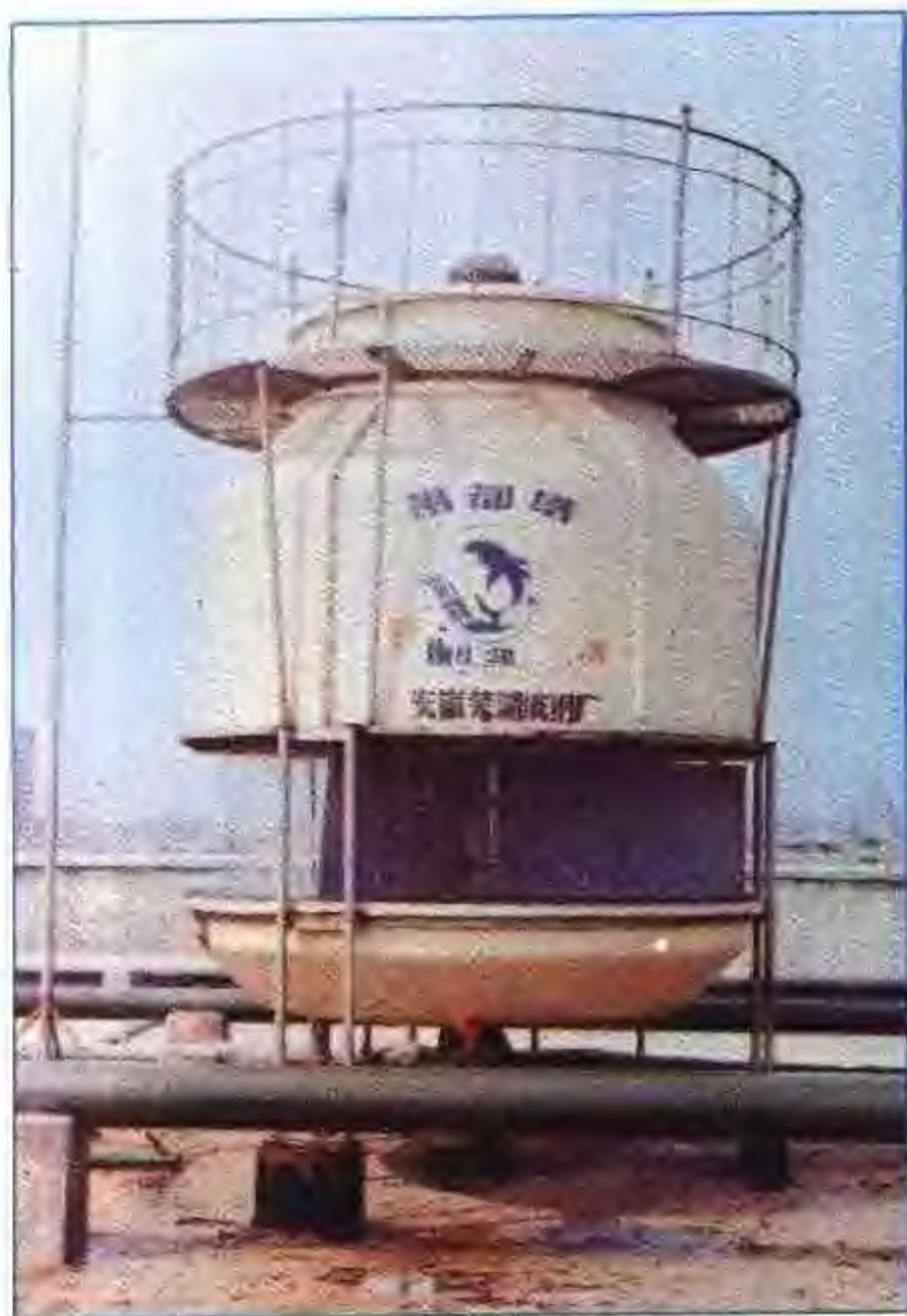
玻璃钢冷却塔——芜湖市玻璃钢厂生产