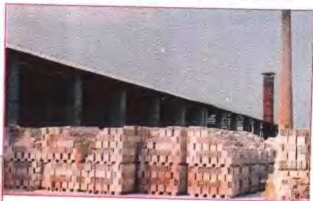
粘土空心砖——肥西县新型建筑材料厂生产