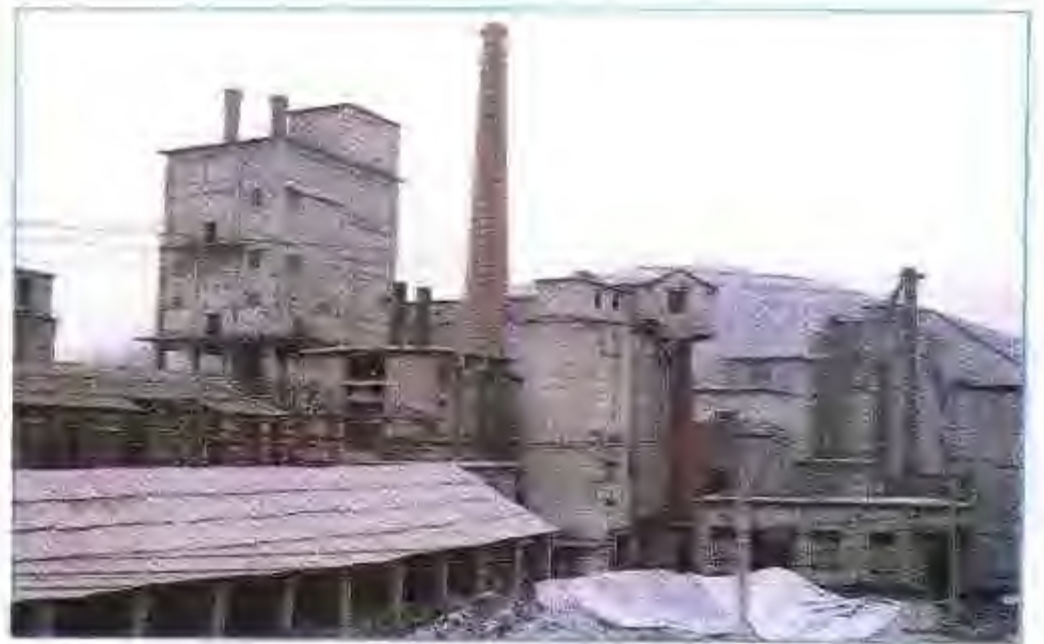
年产 8.8 万吨水泥的小型企业——宿县水泥厂