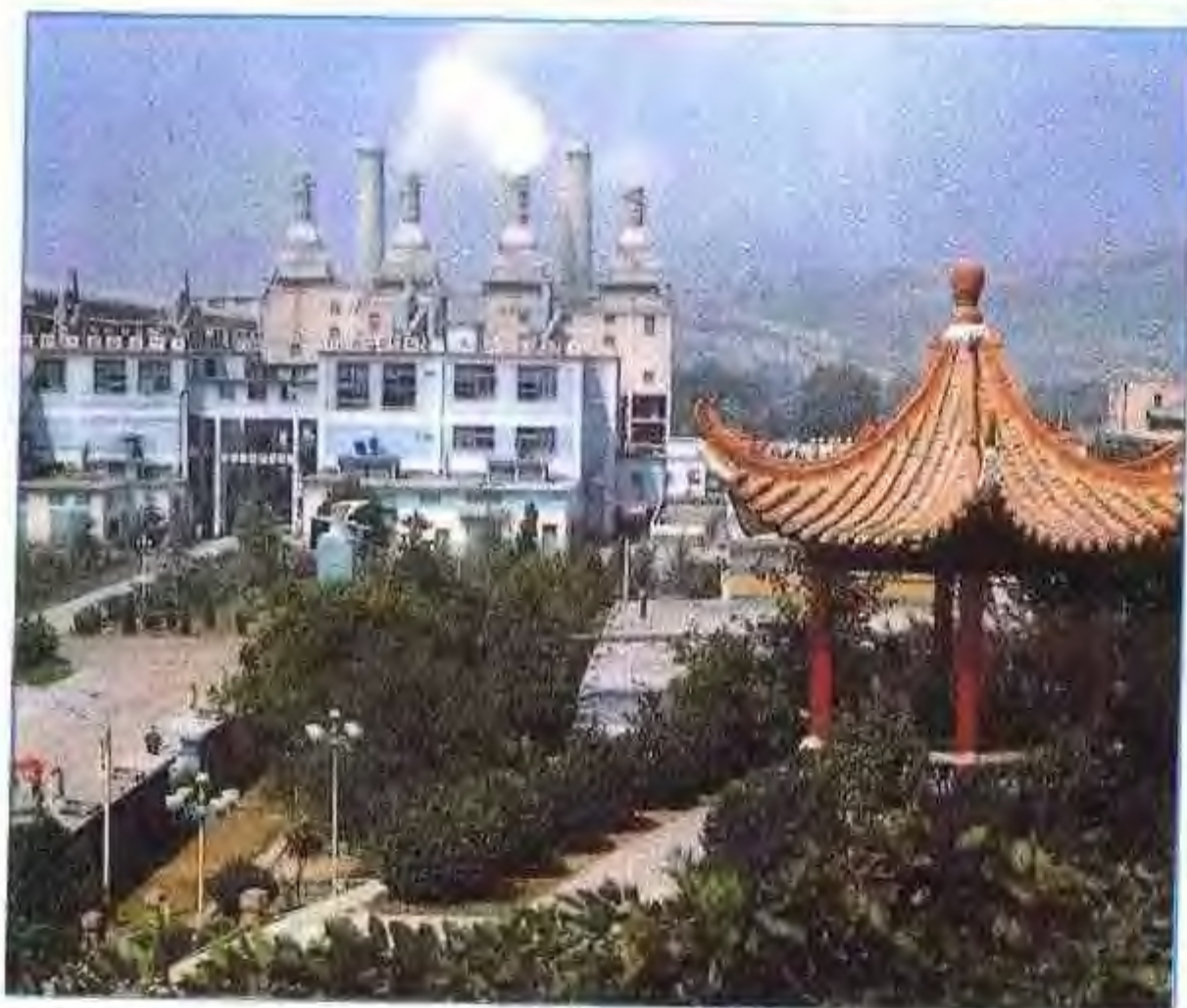
花园式企业——安徽省巢湖水泥厂