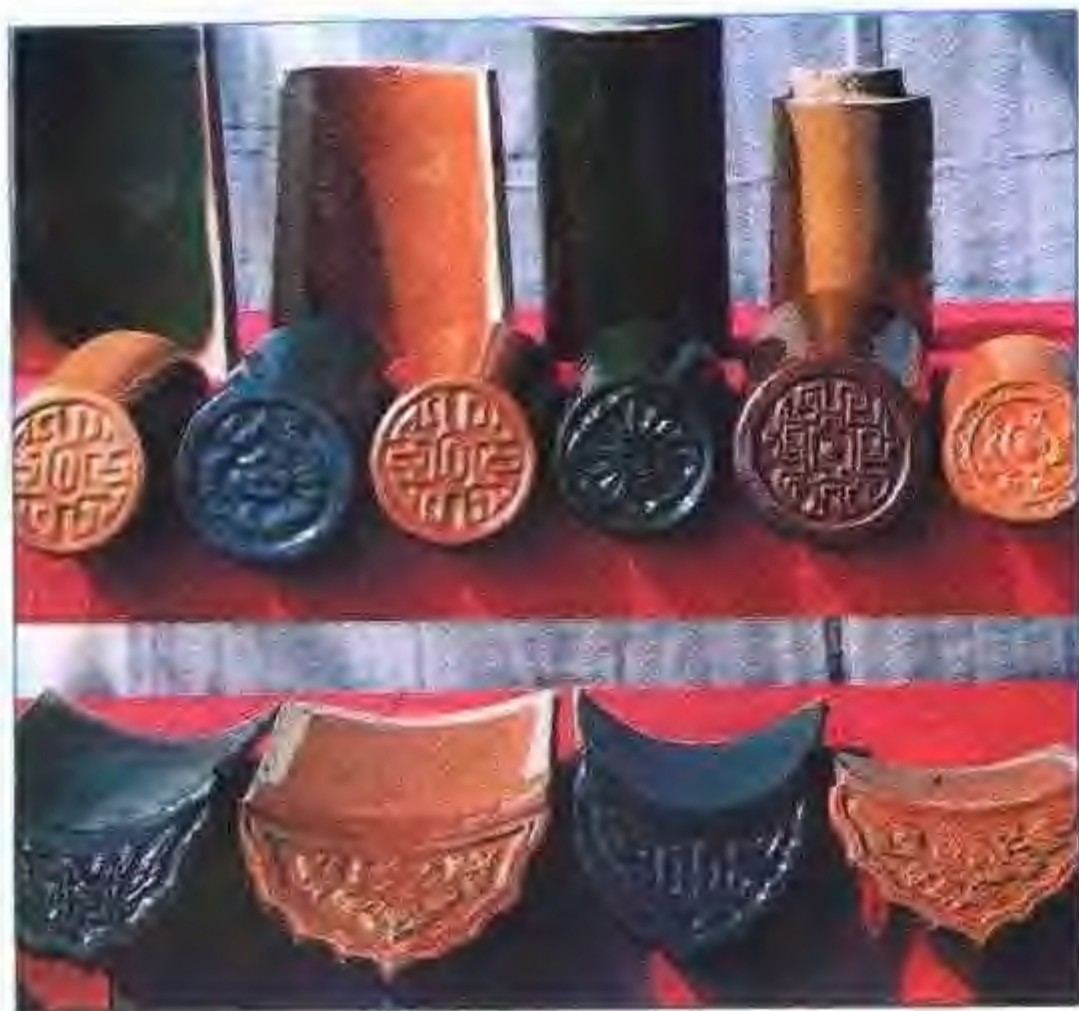
琉璃瓦——宁国县建筑陶瓷厂生产