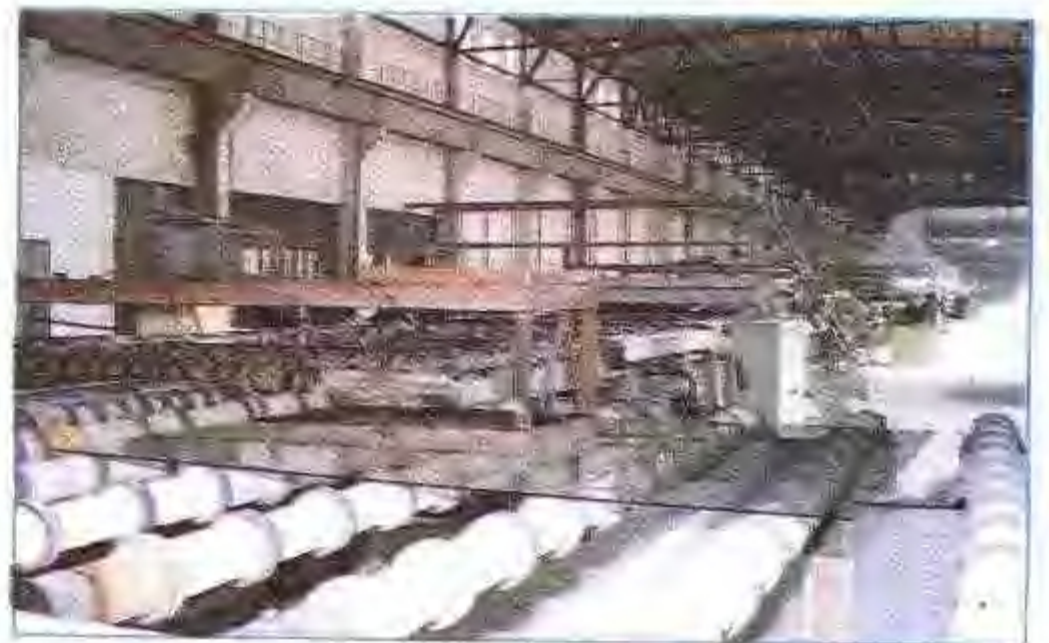
蚌埠平板玻璃厂浮法玻璃生产线