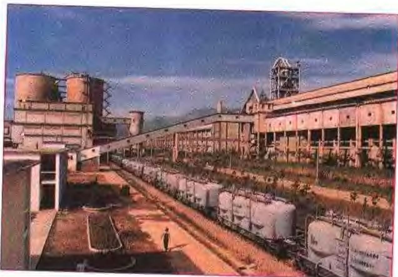
安徽省宁国水泥厂散装水泥设施