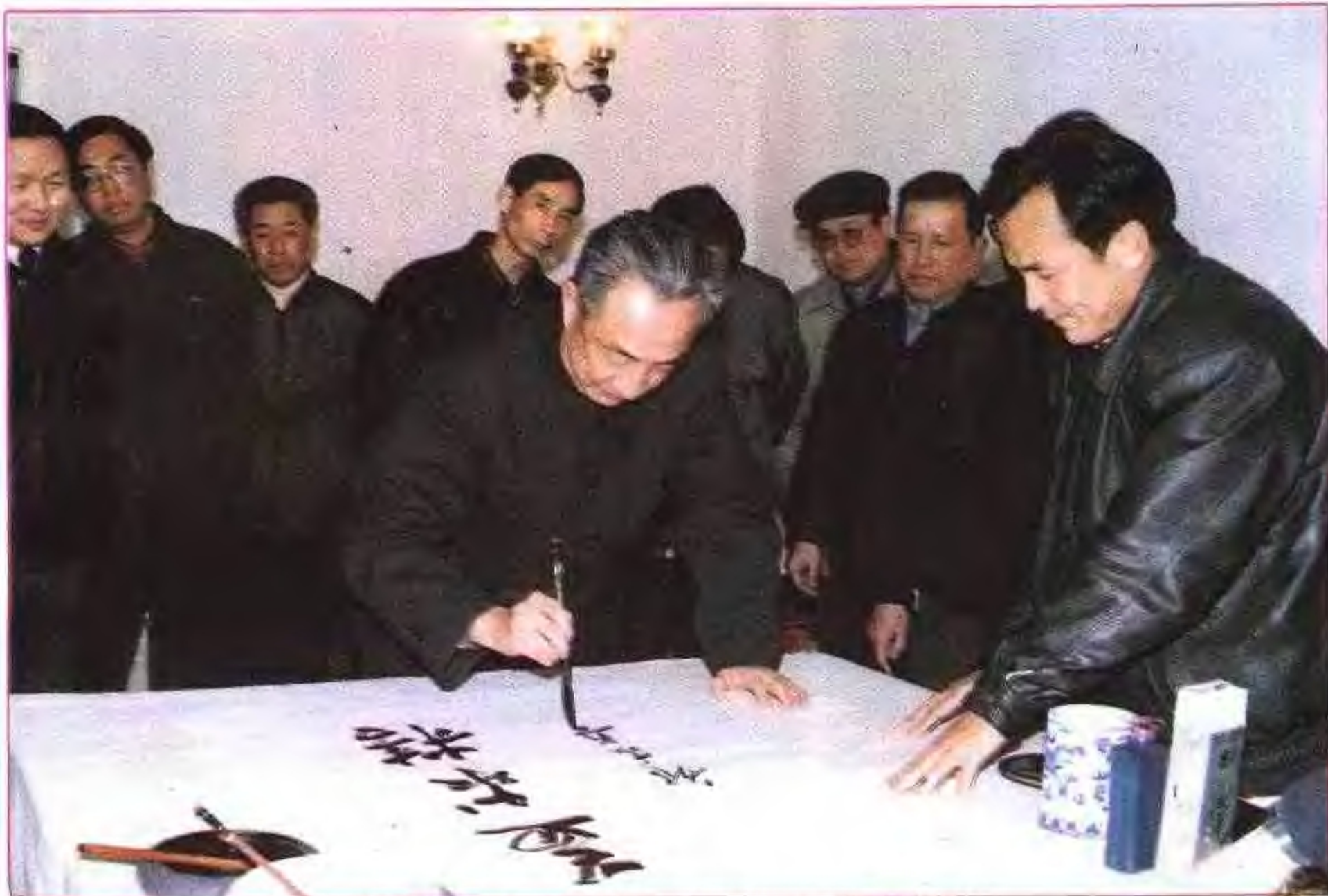
1992年1月邹家华副总理视察安徽省巢湖水泥厂