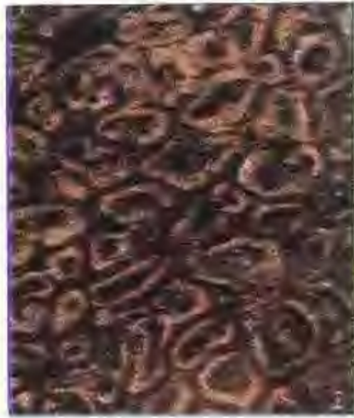
灰皖螺 (大理石板材)