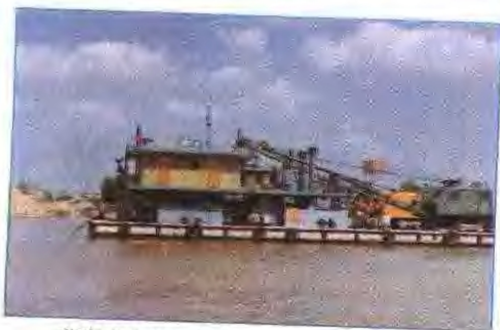
芜湖市水泥船厂建造的抓斗式挖泥船