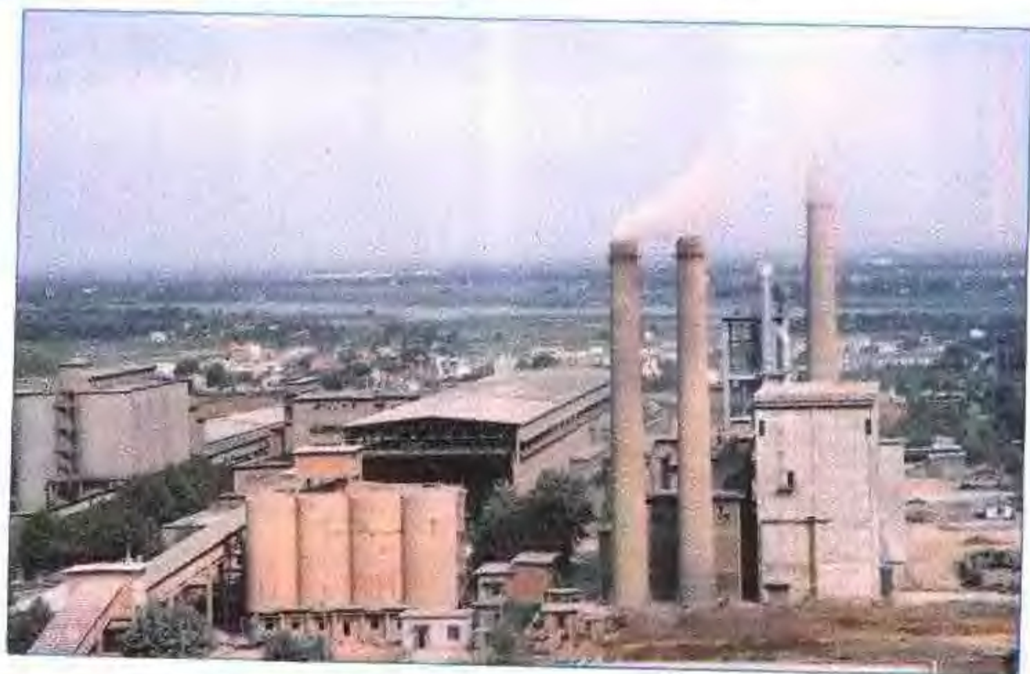
安徽省中型企业 —白马山水泥厂