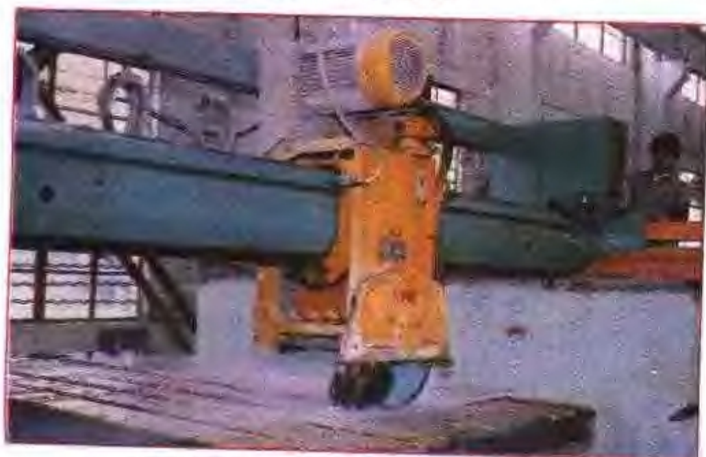
灵璧县大理石厂切割生产线