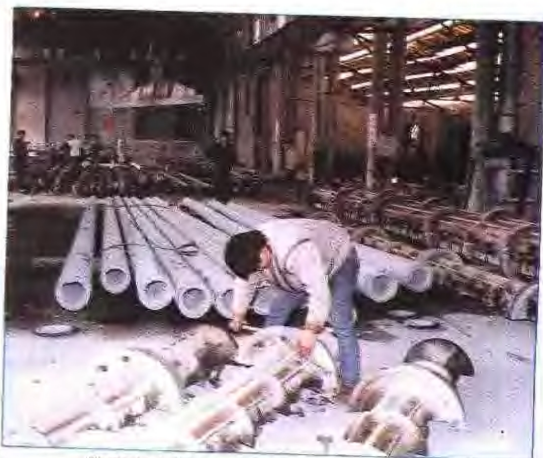
淮南市水泥制品厂电杆生产车间