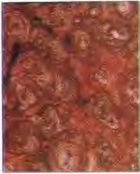
红皖螺 (大理石板材)