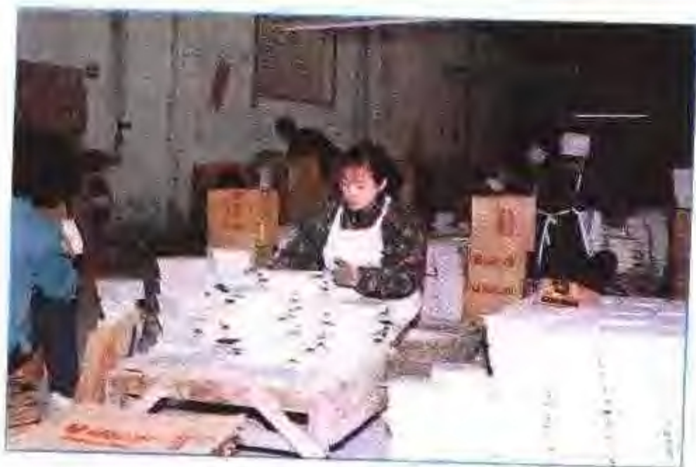
淮北市卫生陶瓷厂瓷砖检验车间