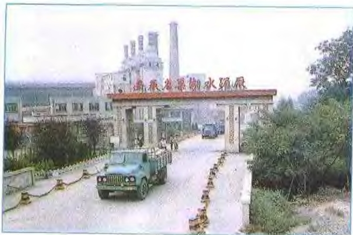
安徽省巢湖水泥厂北大门