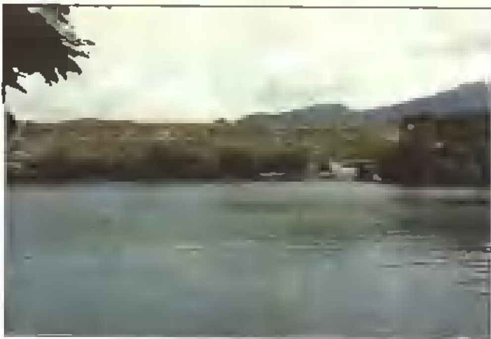
攸县蔡埠江水库大坝