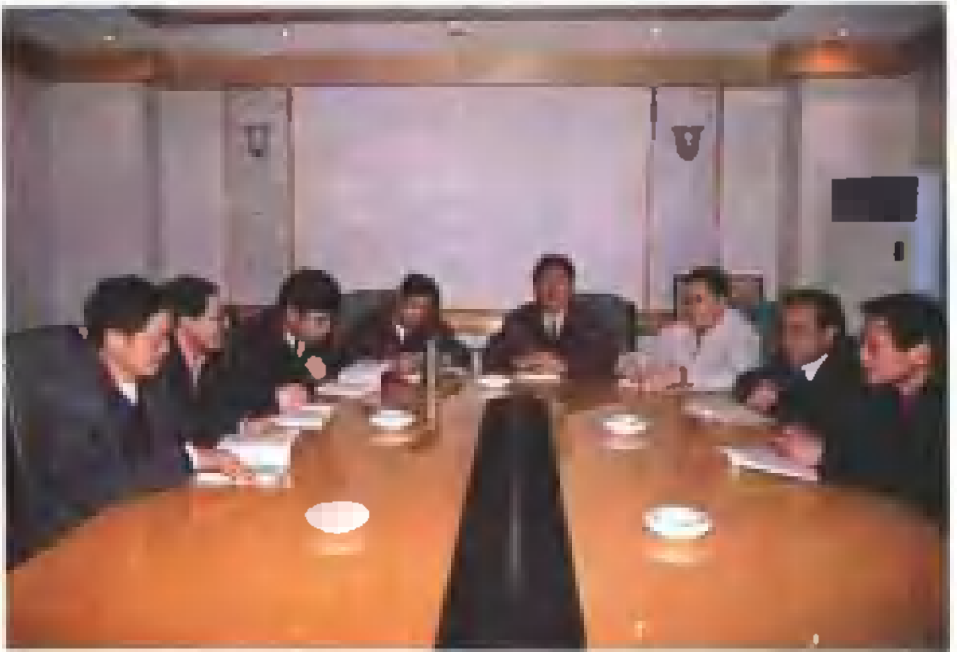
计委领导研究修志工作