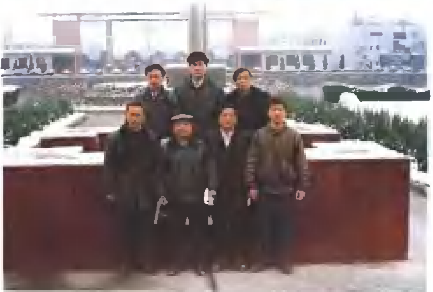
计委系统主编及市志办领导合影