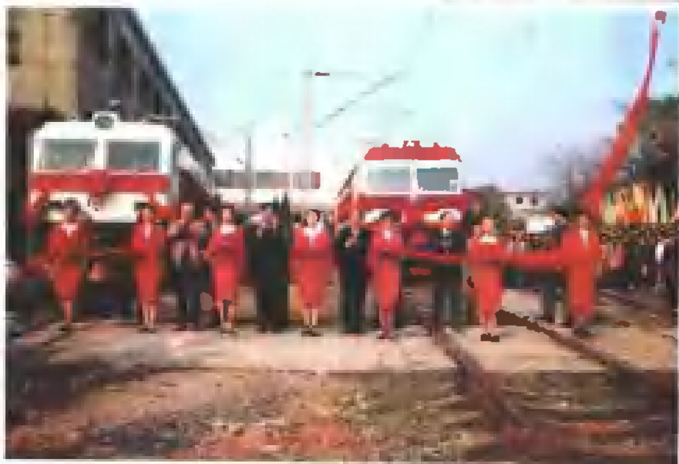
铁道部副部长傅志宝、湖南省人大常委会副主任俞海潮为韶山 8 型准高速客运电力机车及韶山 6B 型电力机车剪彩