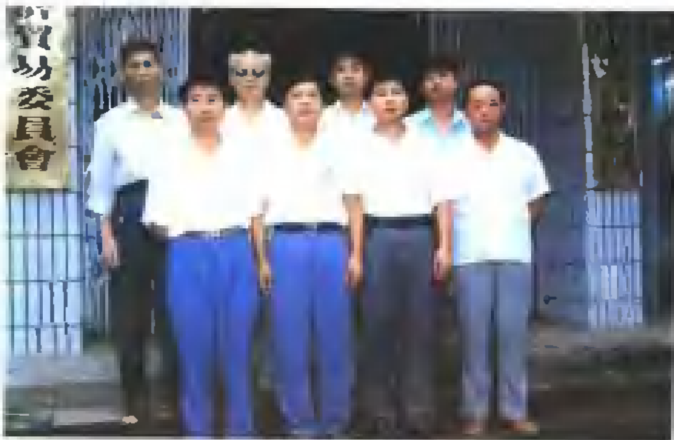
《株洲市志·对外经济贸易》编纂人员合影