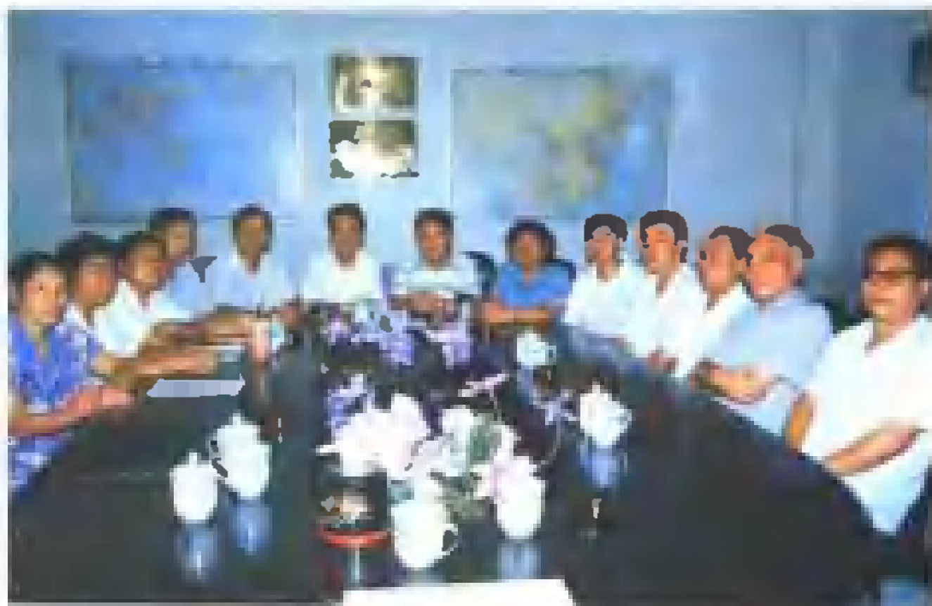
《株洲市志·对外经济贸易》编纂领导小组合影