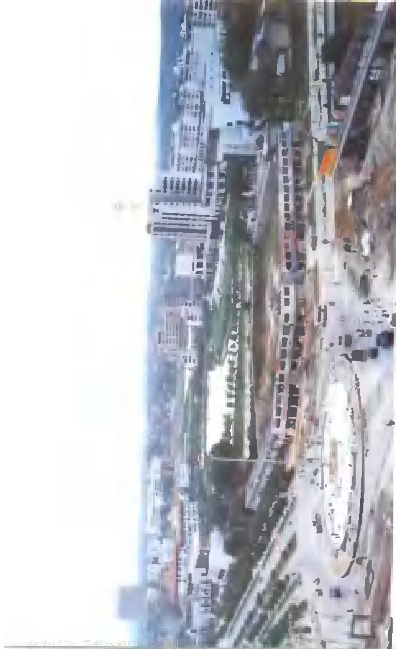
▲ 河西国家级高新技术产业开发区。