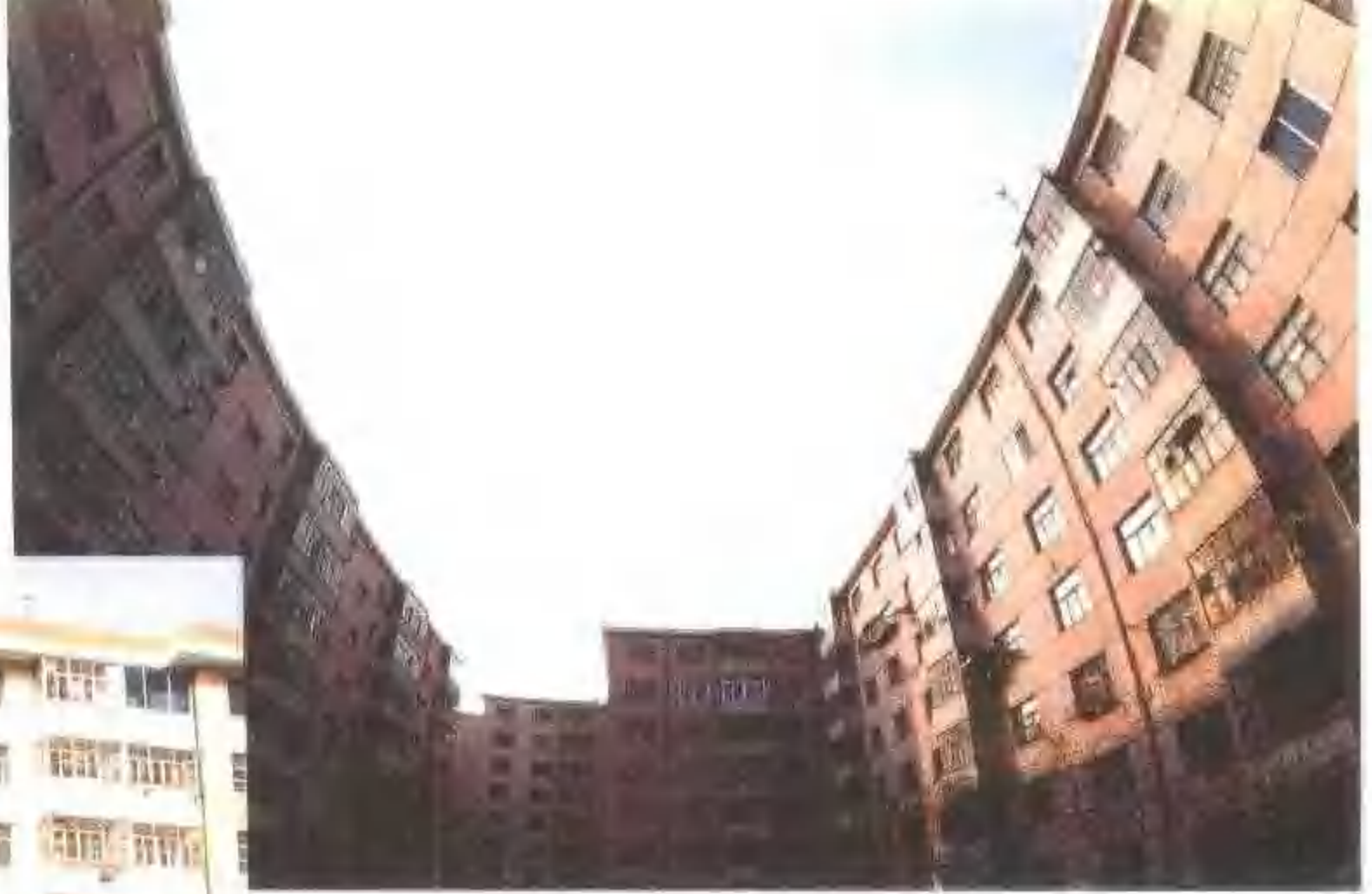
▼ 建大二小区住宅楼