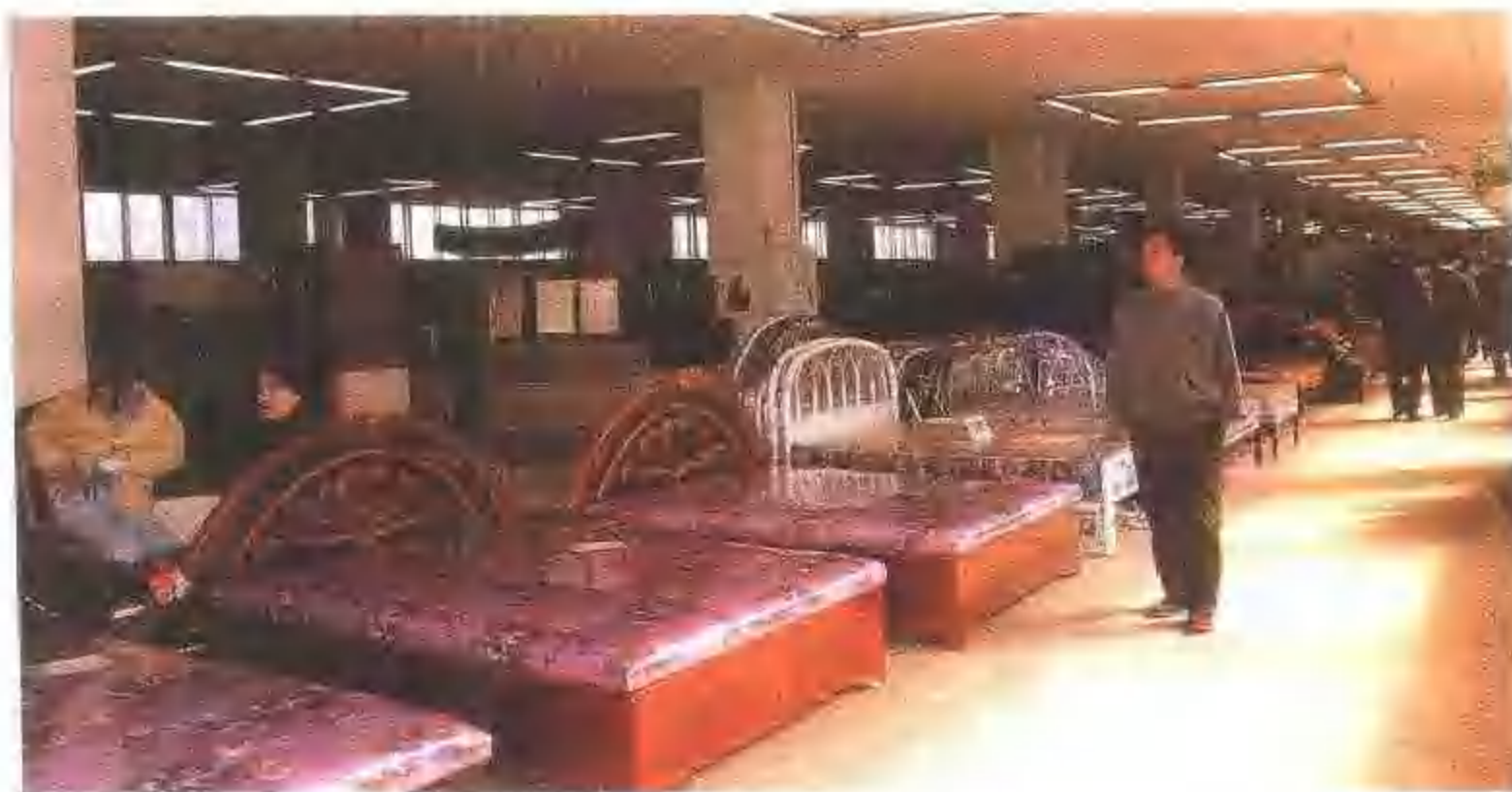
中国家具城经营的部分家具