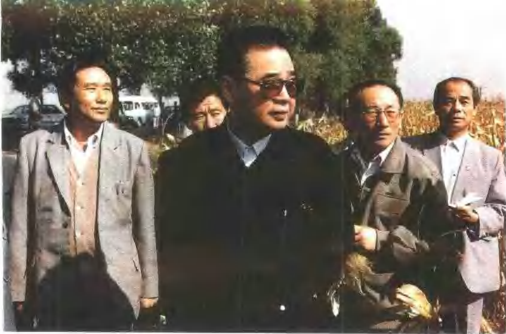
一九八九年九月十八日李鹏 视察苏家屯区十里河镇