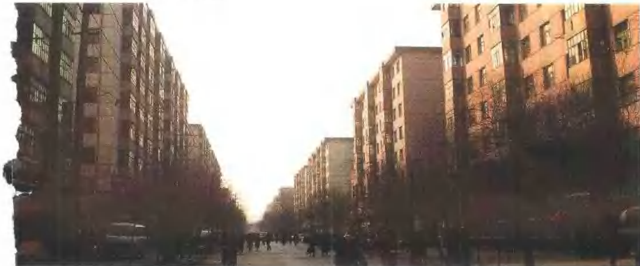
▼ 临街住宅楼底层为商业网点，图为南六路生产资料一条街。

铁西区城市建设综合开发公司，在全市率先承担了大面积棚户区改造工程，取得了宝贵经验。