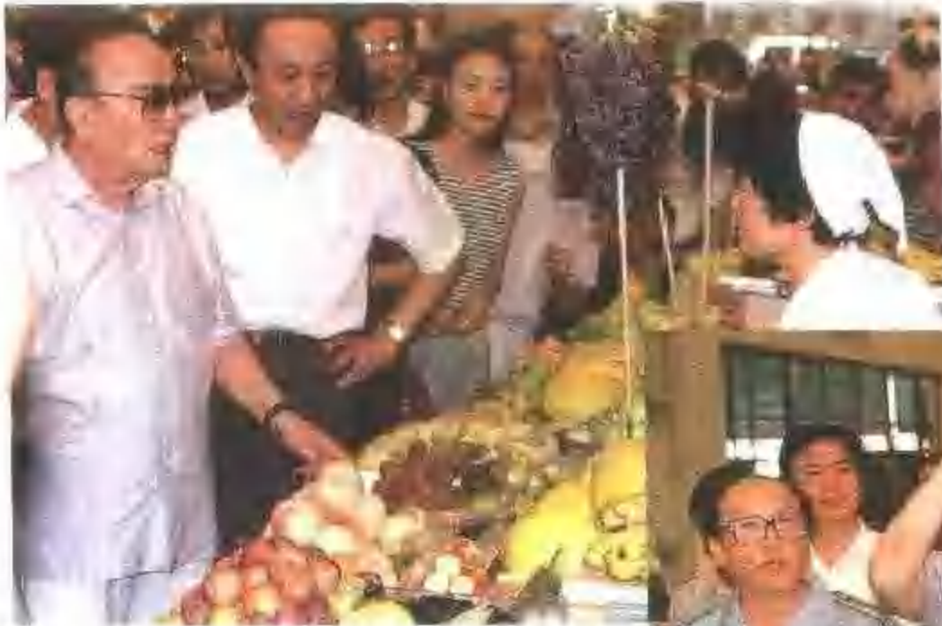
◀ 1994年7月20日杨尚昆视察皇姑北行农贸市场