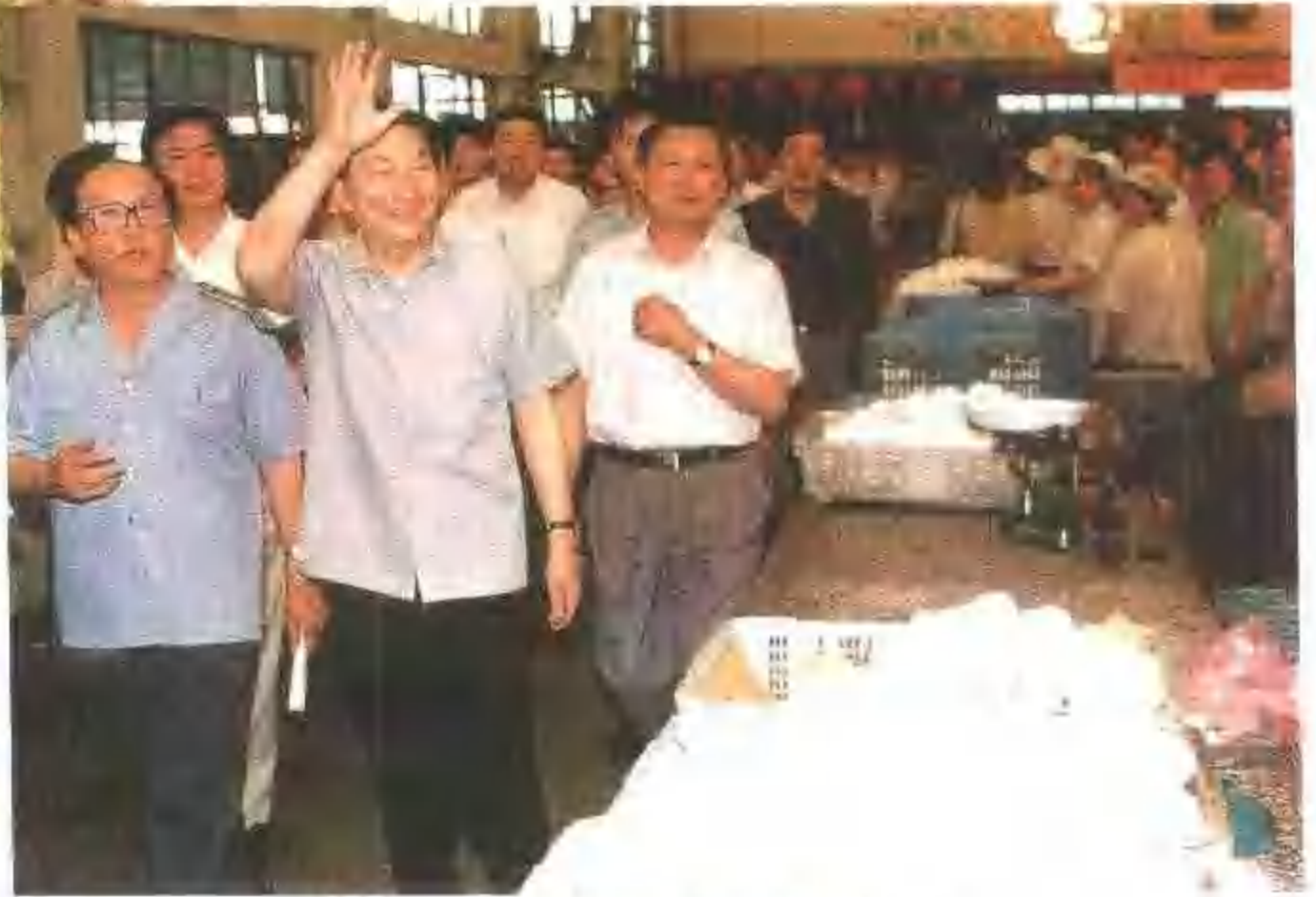
▼ 1994年6月朱镕基视察皇姑北行农贸市场