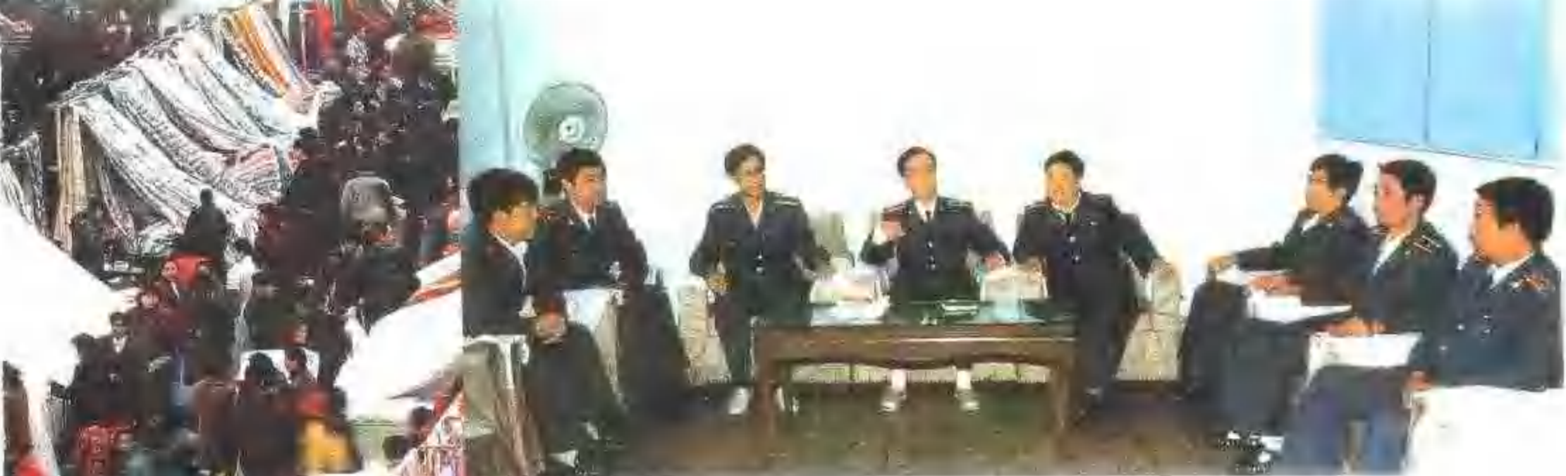
沈河区工商局领导班子在研究五爱市场摊位布局问题