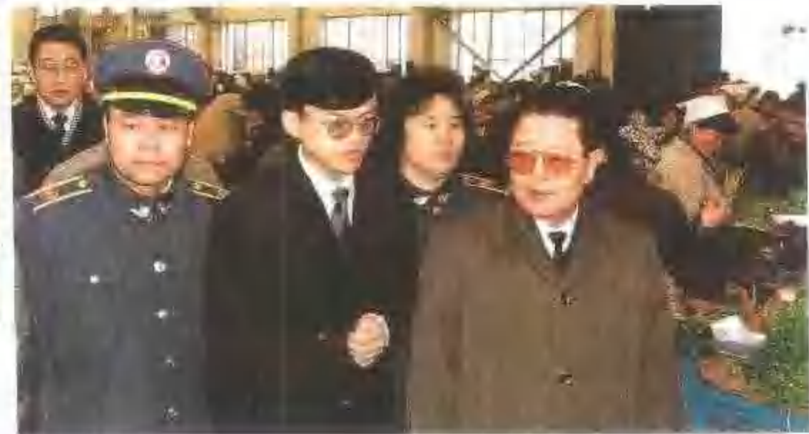
韩国客人参观北行农贸市场