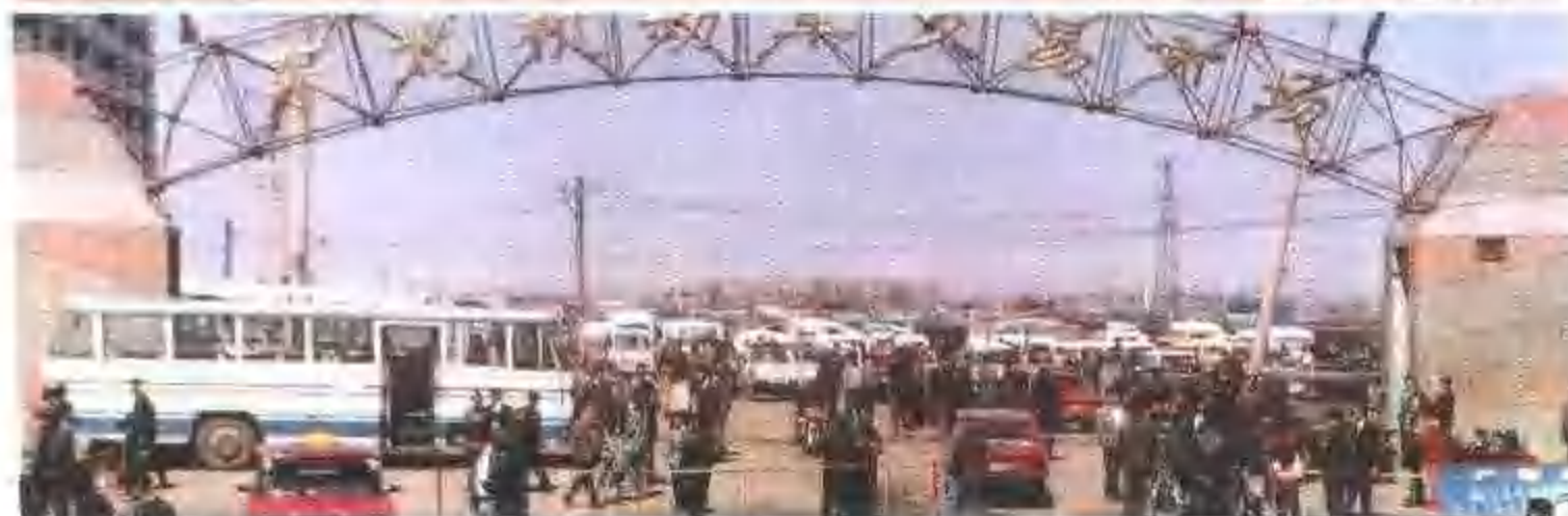
皇姑区东北 机动车交易市场