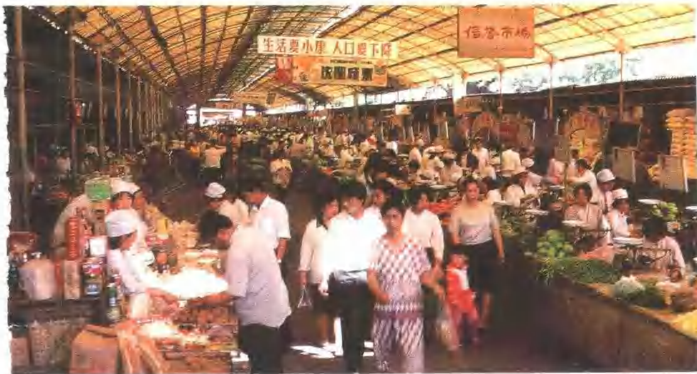
1993年位居20强农副产品市场第二位的九路市场