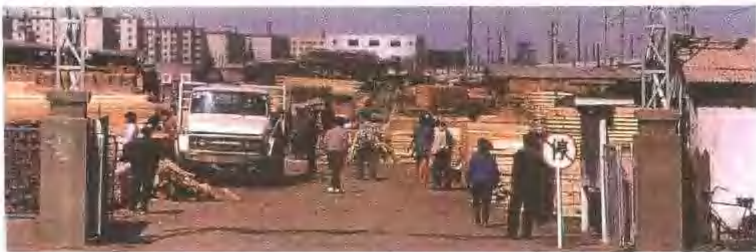
皇姑区塔湾 木材市场一瞥