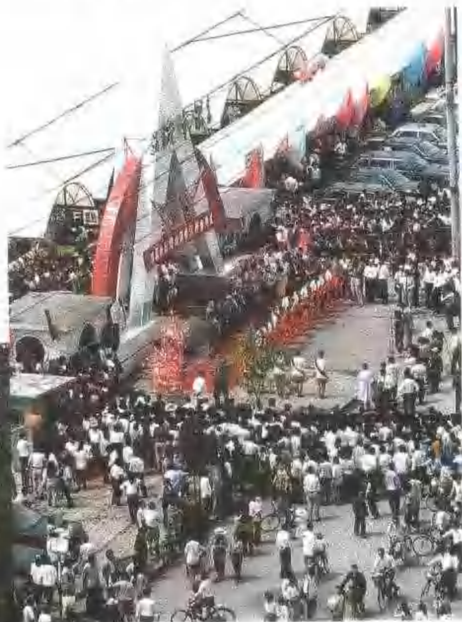
疏密有致的分组式拱型交易大棚

五爱市场占地面积达10万平方米，共设有15327个摊位。日客流量20余万人次。市场主营服装、鞋帽、小商品、针织、毛线、小食品、箱包、布料8大类近2万多个品种的批发业务。商品来自全国各地，流向东北三省及内蒙古、河北等地。1992年，市场成交额达19.6亿元，被国家工商行政管理局评为“全国文明集贸市场”。