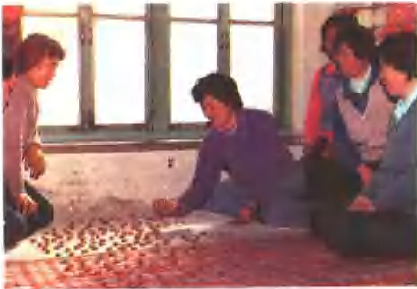
锡伯族妇女在 抓嘎拉哈。