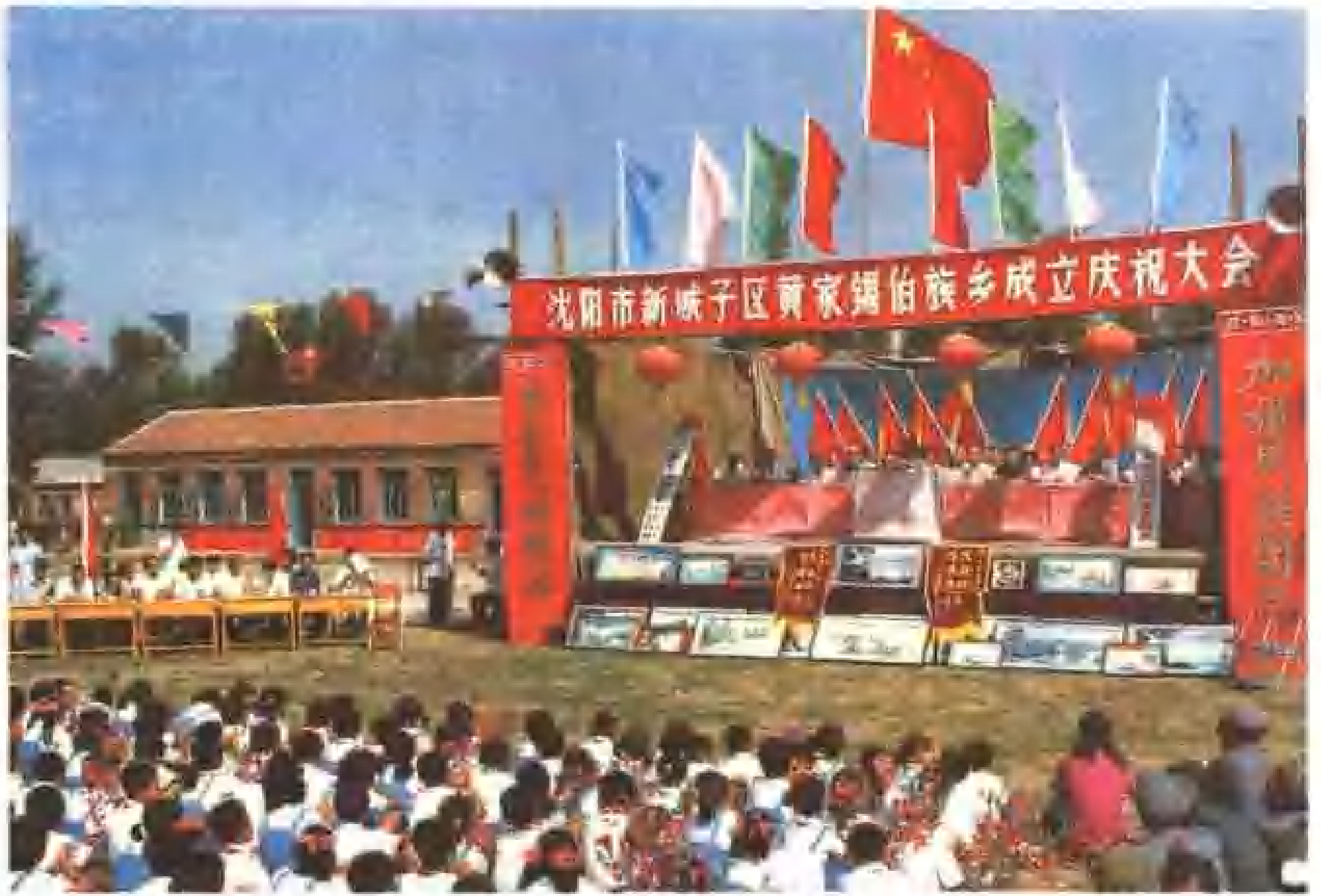
沈阳市新城子区黄家锡伯族乡成立庆祝大会会场