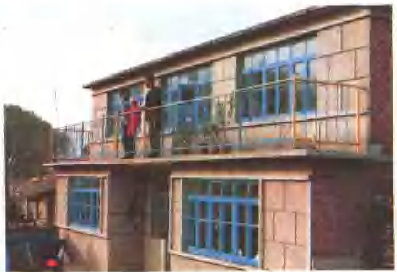
沈阳市东陵区 古城子乡永安村锡 伯族居住的新楼房。