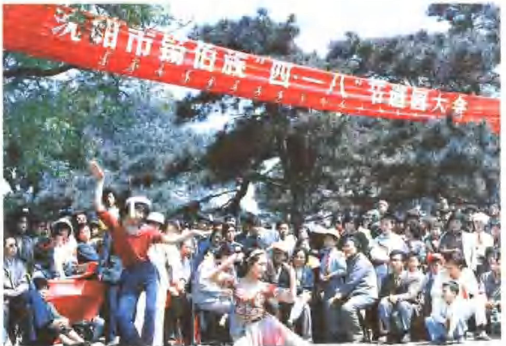
沈阳市锡伯族“四、一八”节游园大会。