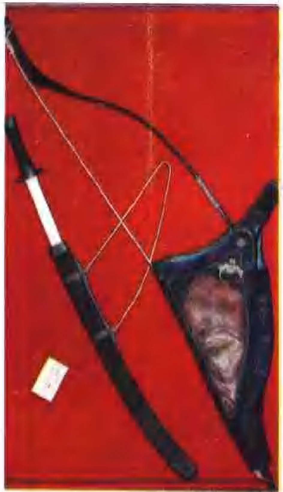
锡伯族使用的弓和刀