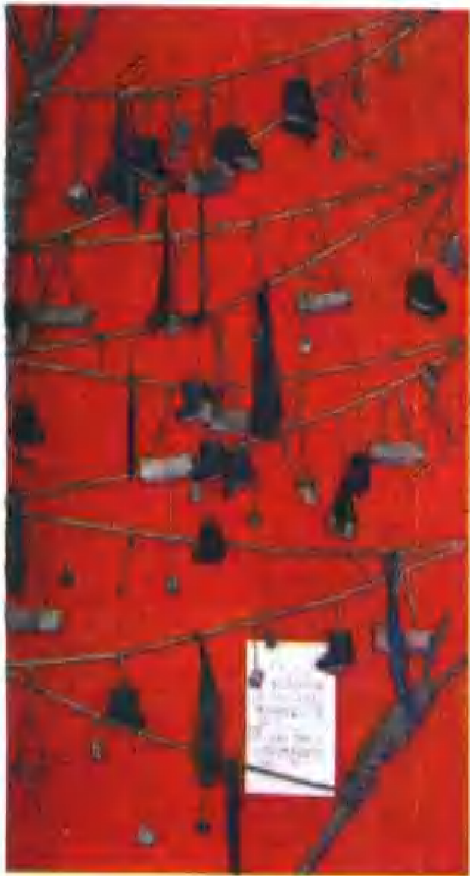
锡伯族信仰的喜利妈妈