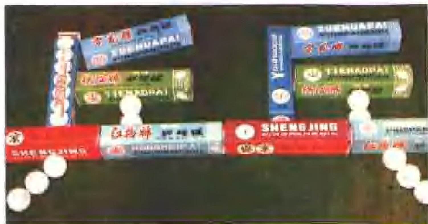
沈阳市新城子区黄家锡伯族乡乒乓球厂的产品。