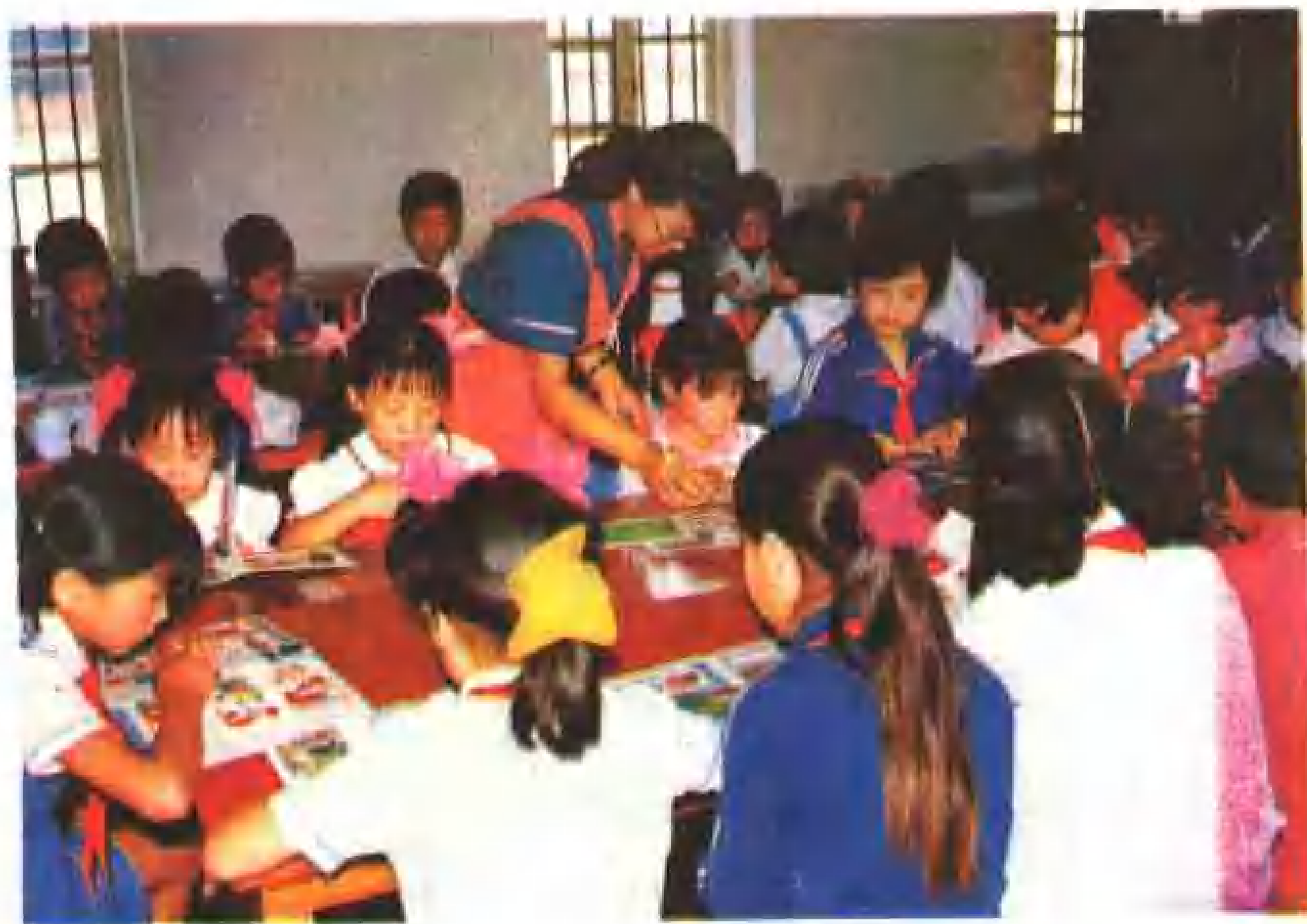
锡伯族小学生在课外阅读