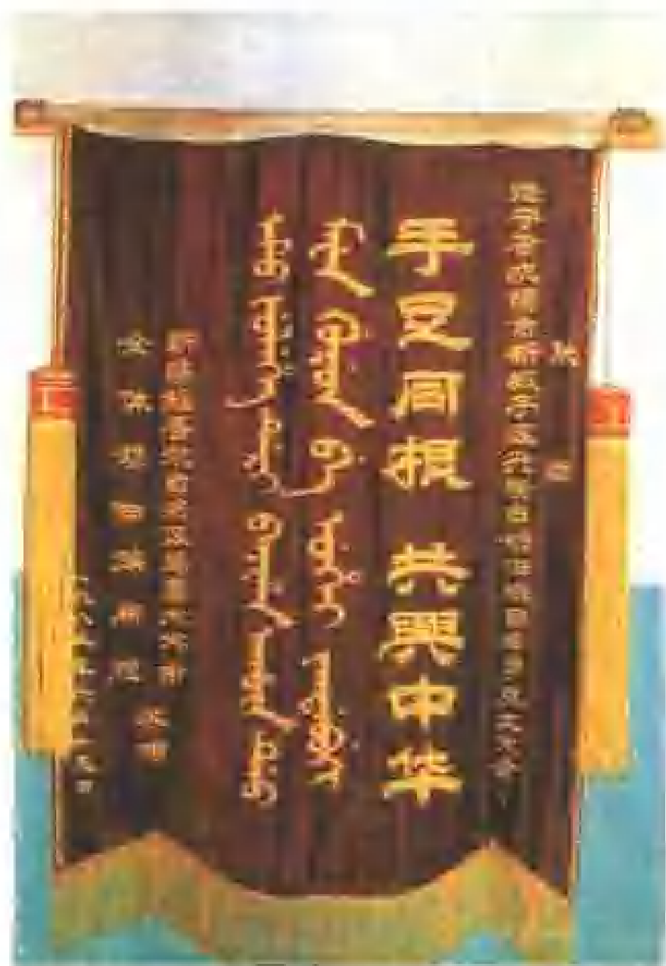
新疆乌鲁木齐市全体锡伯族同胞祝贺兴隆台锡伯族乡成立赠送的锦旗。