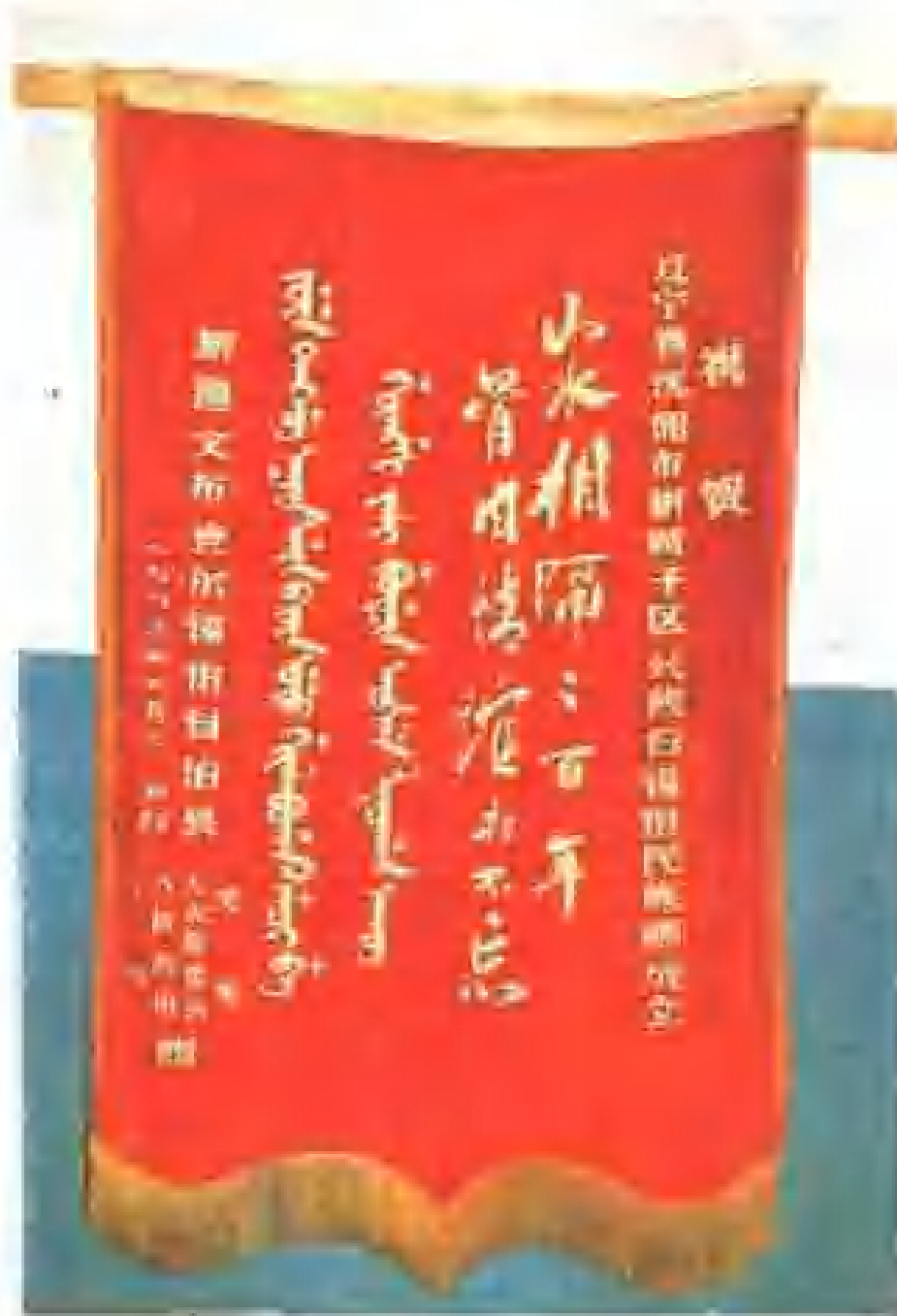
新疆察布查尔锡伯族自治县祝贺兴隆台锡伯族乡成立赠送的锦旗。