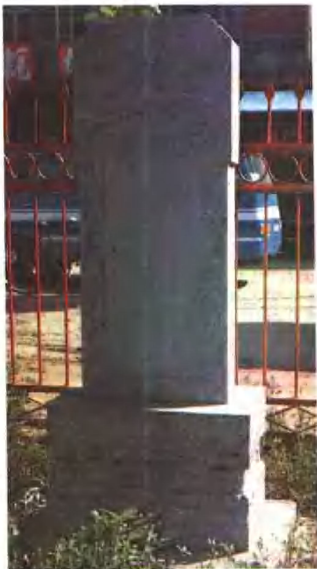
复制的太平寺满文石碑。