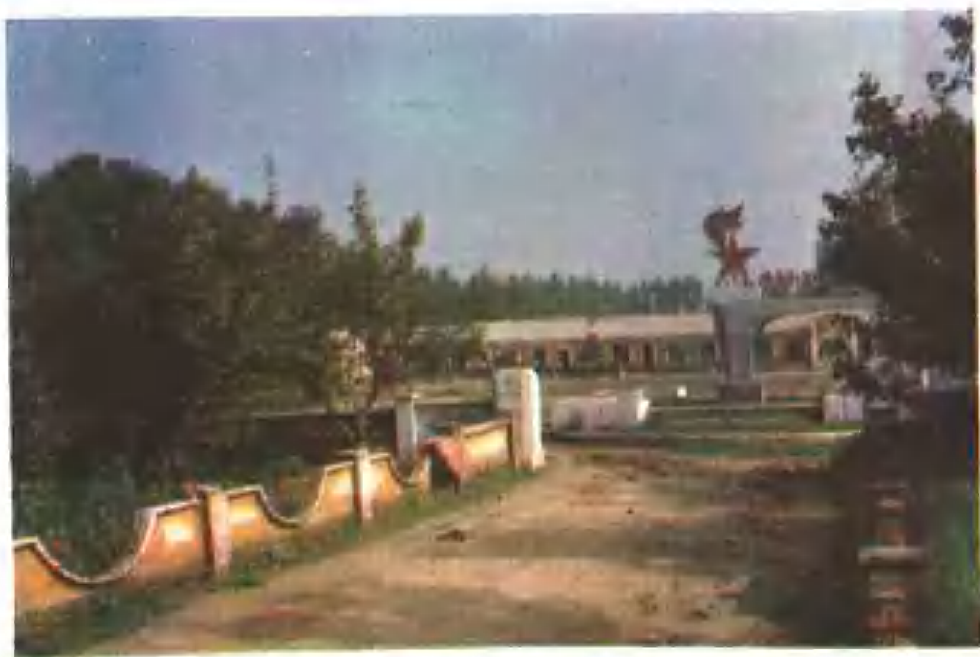
沈阳市新城子区黄家锡伯族乡中心小学。