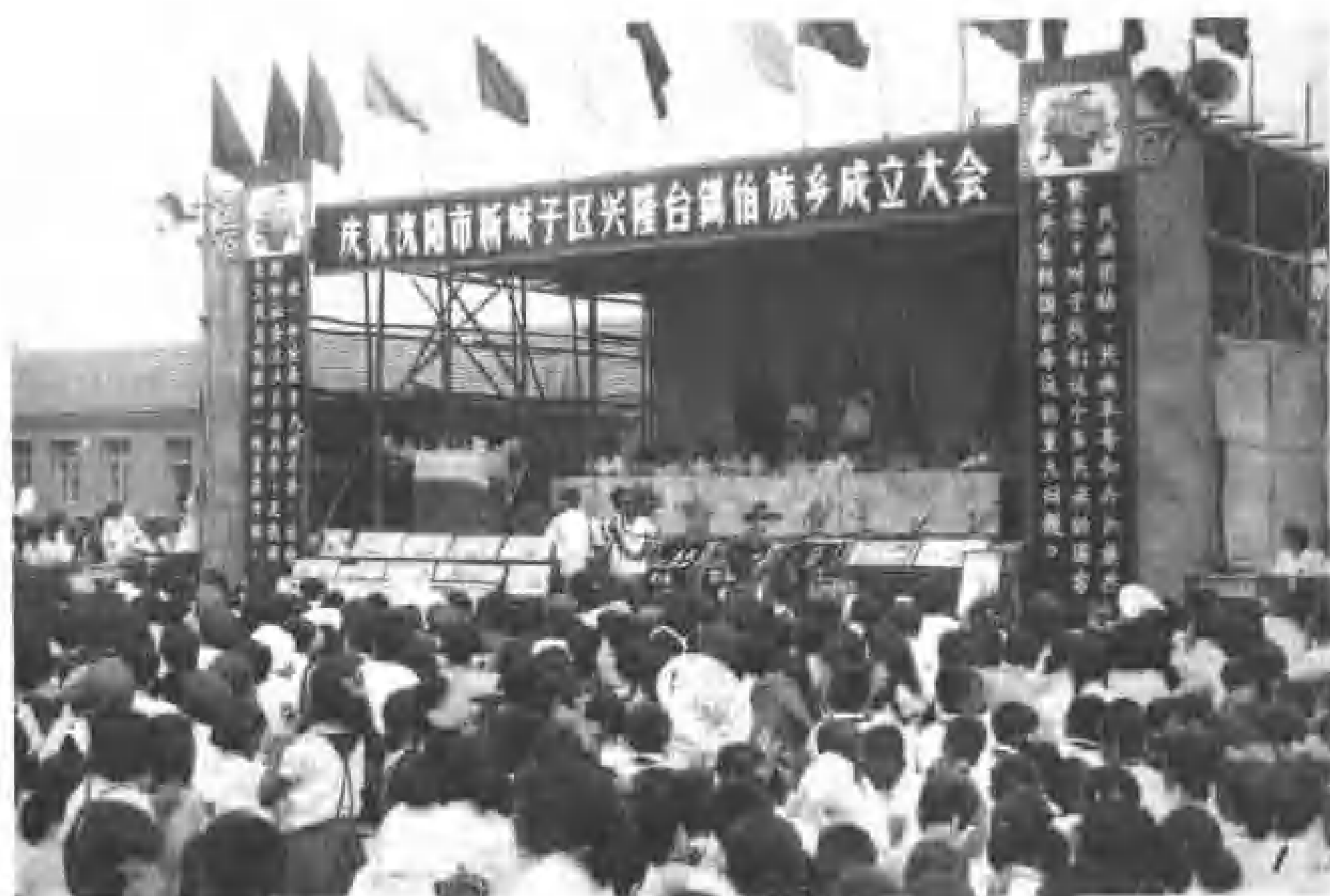
兴隆台锡伯族乡成立大会会场。