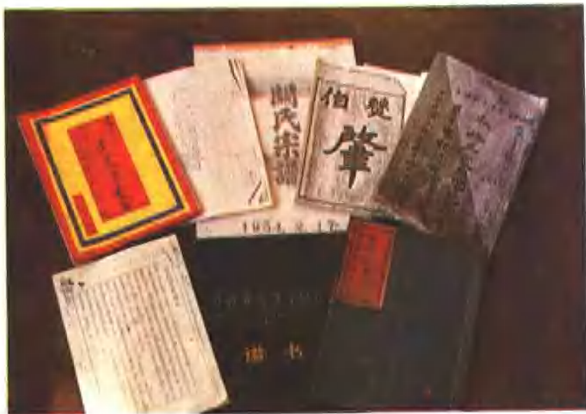
锡伯族群众为编纂沈阳锡伯族志提供的家谱。