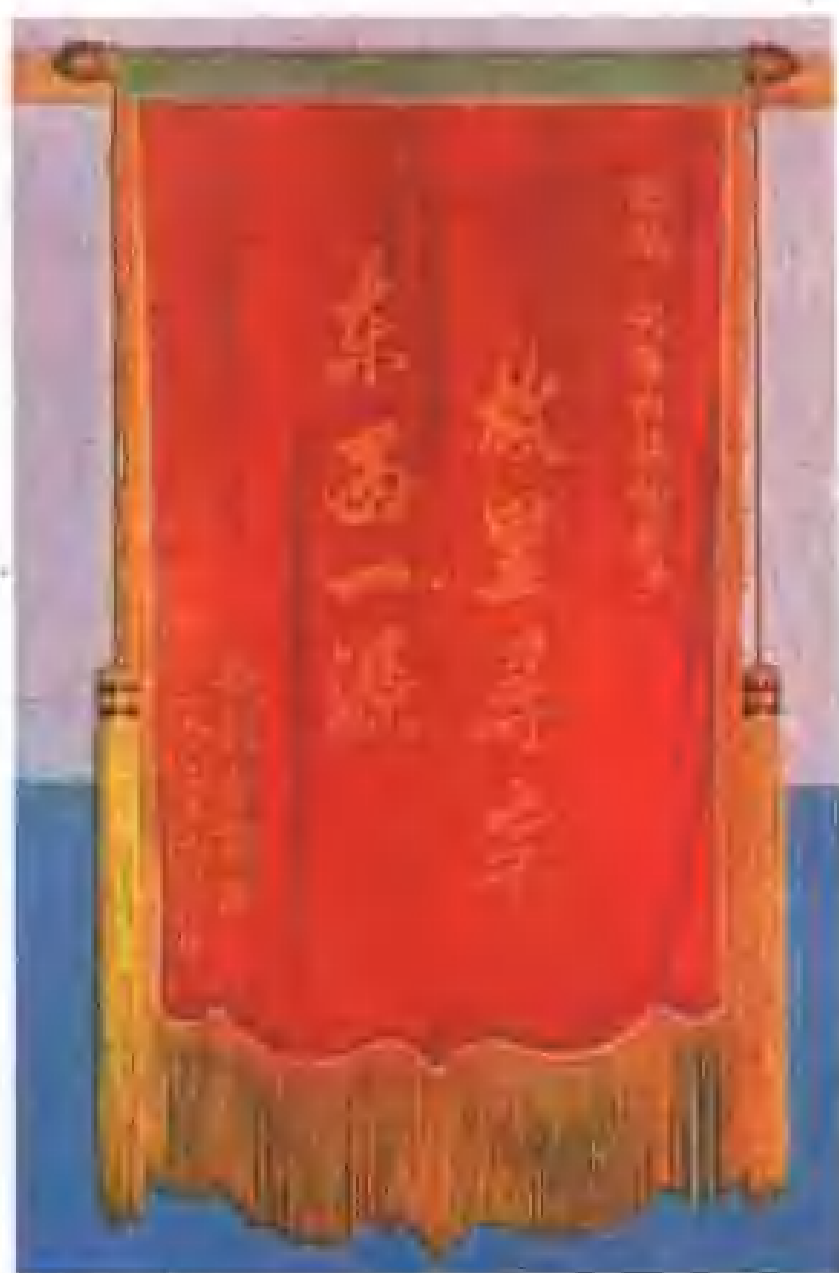
新疆射箭队在沈阳兴隆台乡表演时赠送的锦旗。