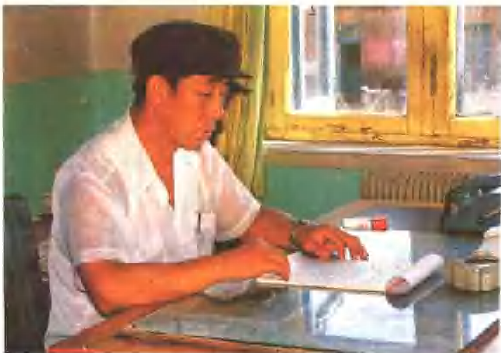
全国人大代表兴隆台锡伯族镇党委书记关余安在工作中。