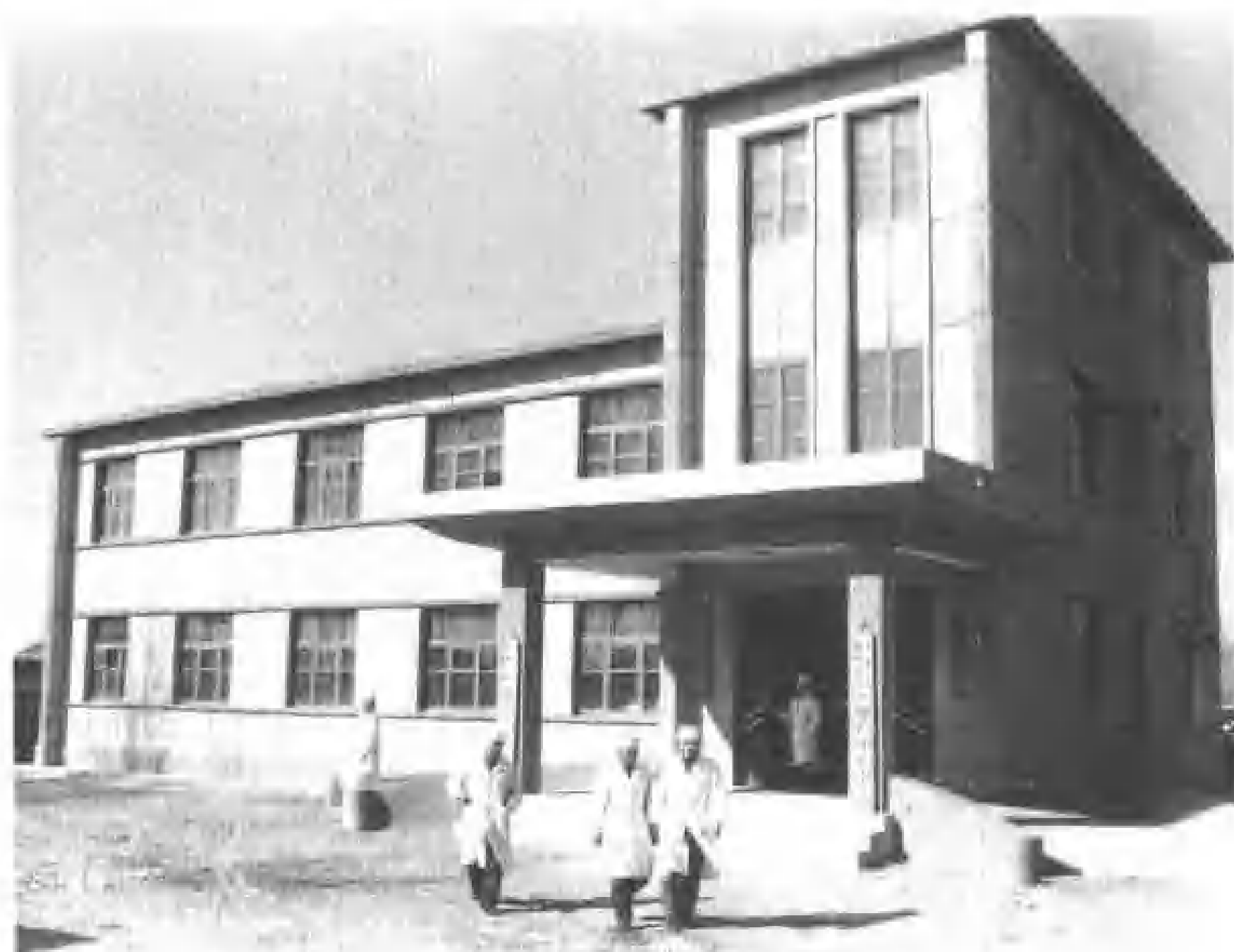
兴隆台中心卫生院。