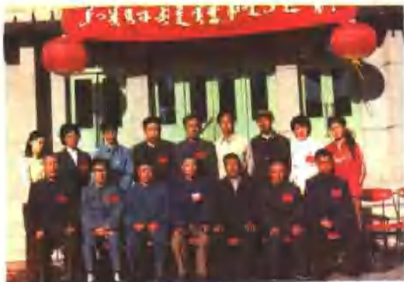
沈阳市锡伯族代表团全体成员与新疆察布查尔自治县主要领导同志合影。