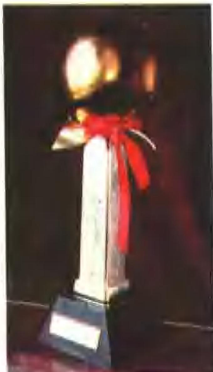
《西迁》壁画获 《大金果奖》。