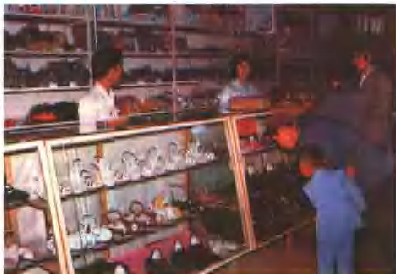
沈阳市新城子区黄家锡伯族乡供销社一角。