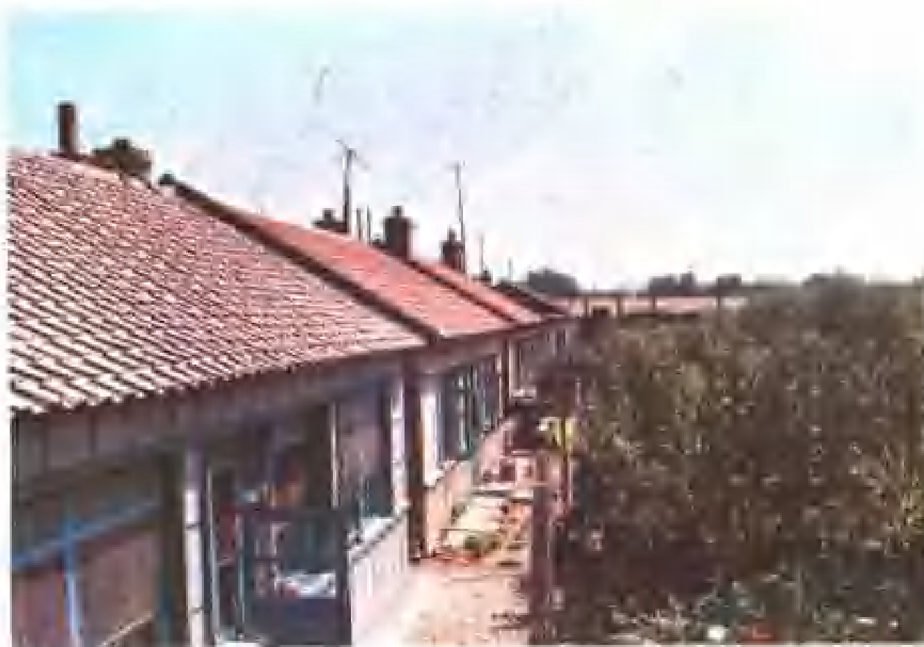
沈阳市苏家屯 区北营子村锡伯族 居住的新瓦房。