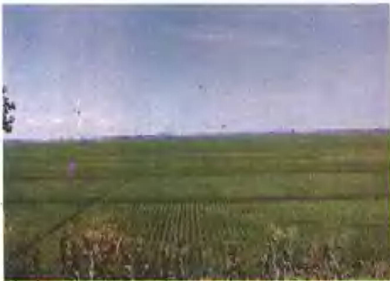
沈阳市苏家屯区北营子村锡伯族耕种的稻田。