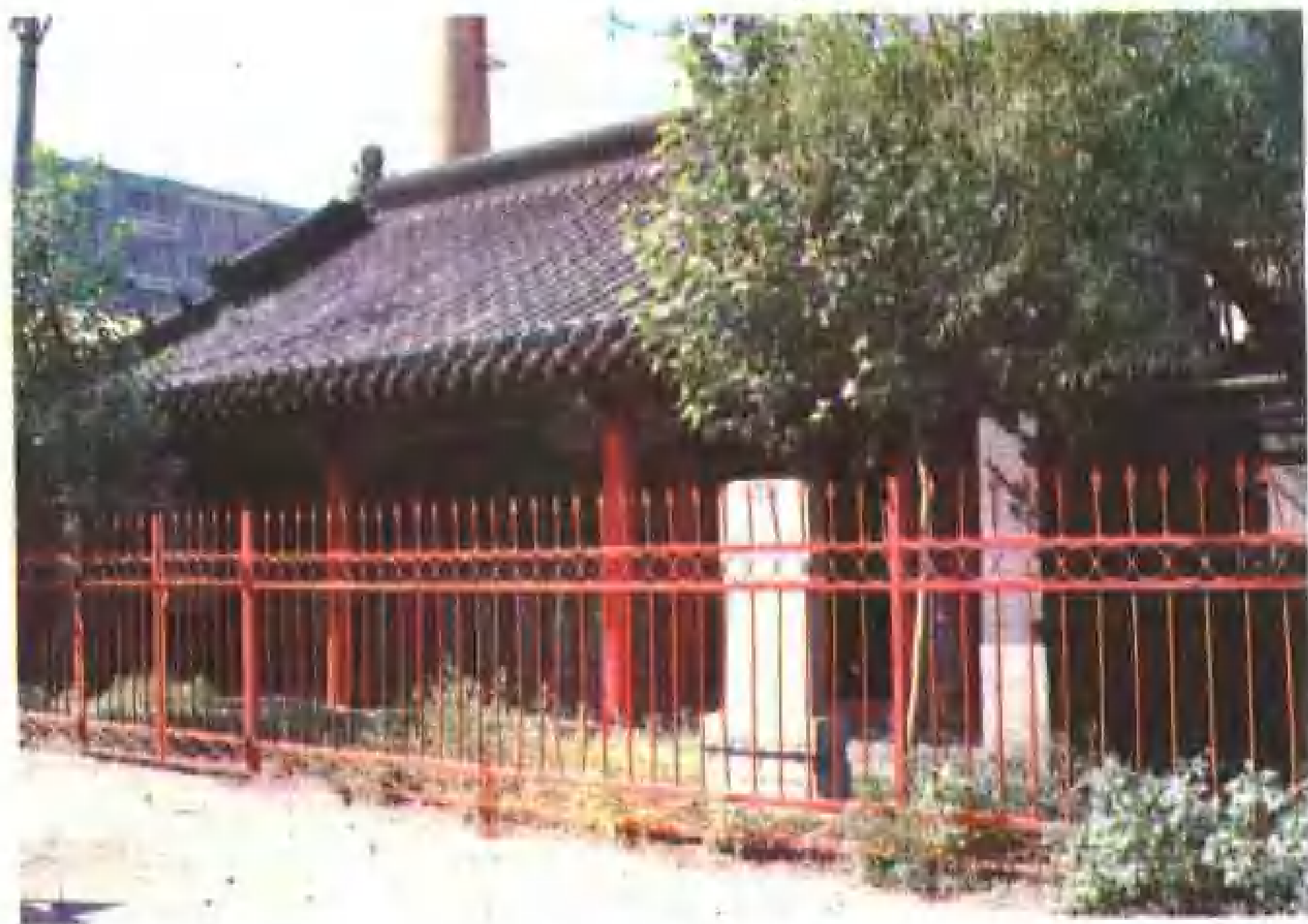
1982年修复的太平寺中殿