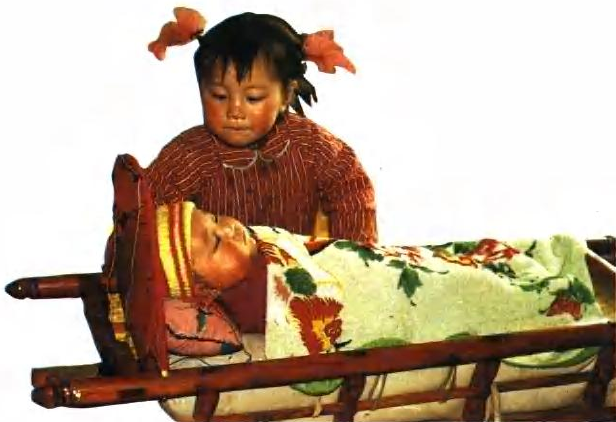
蒙古族传统“乌力贵”（摇车）