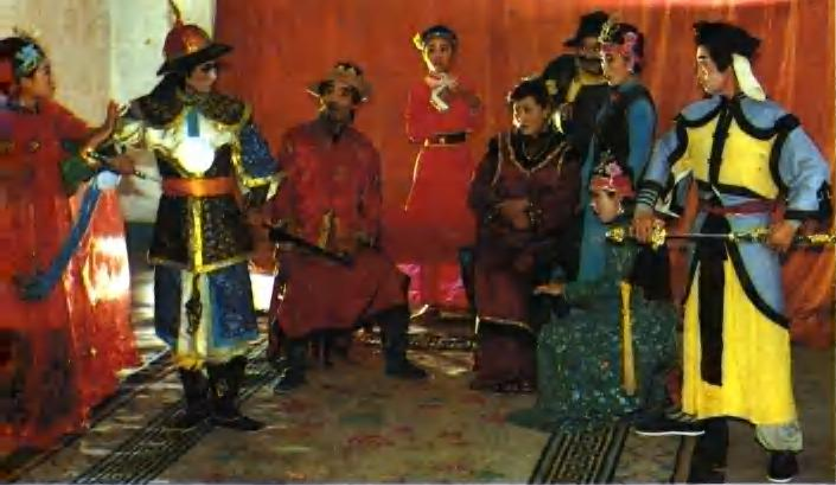
蒙古剧《乌银其其格》剧照