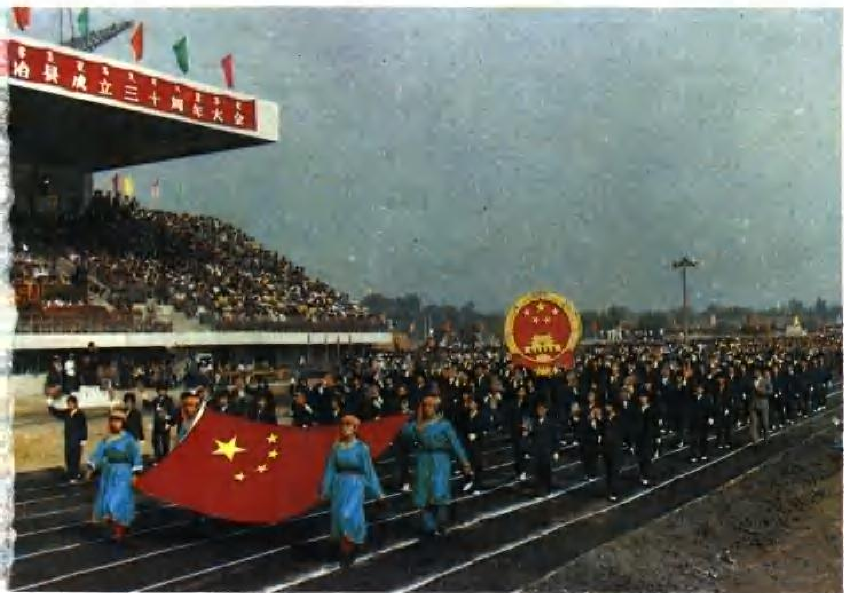
庆祝阜新蒙古族自治县成立三十周年大会一角