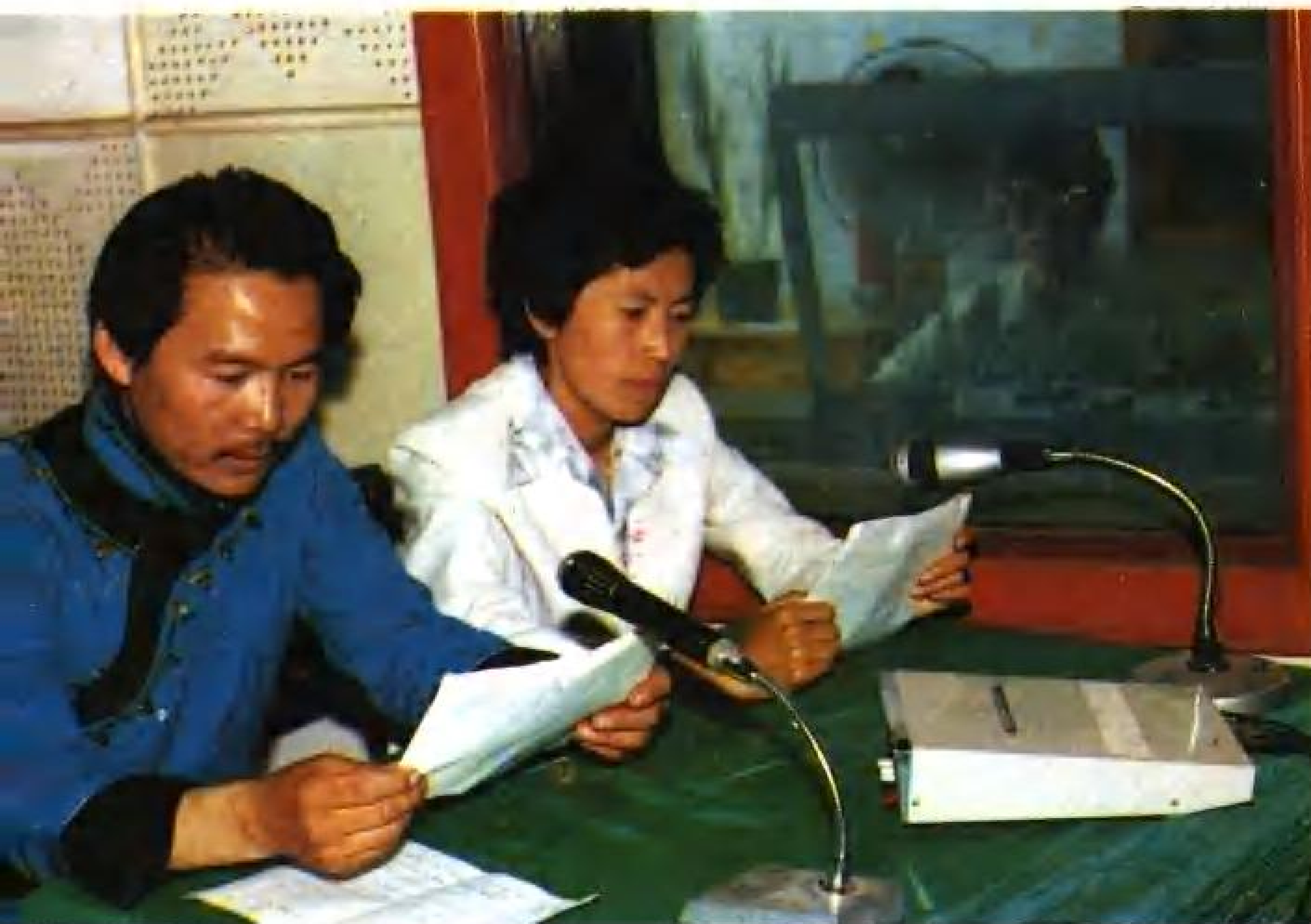
自治县人民广播电台播音室