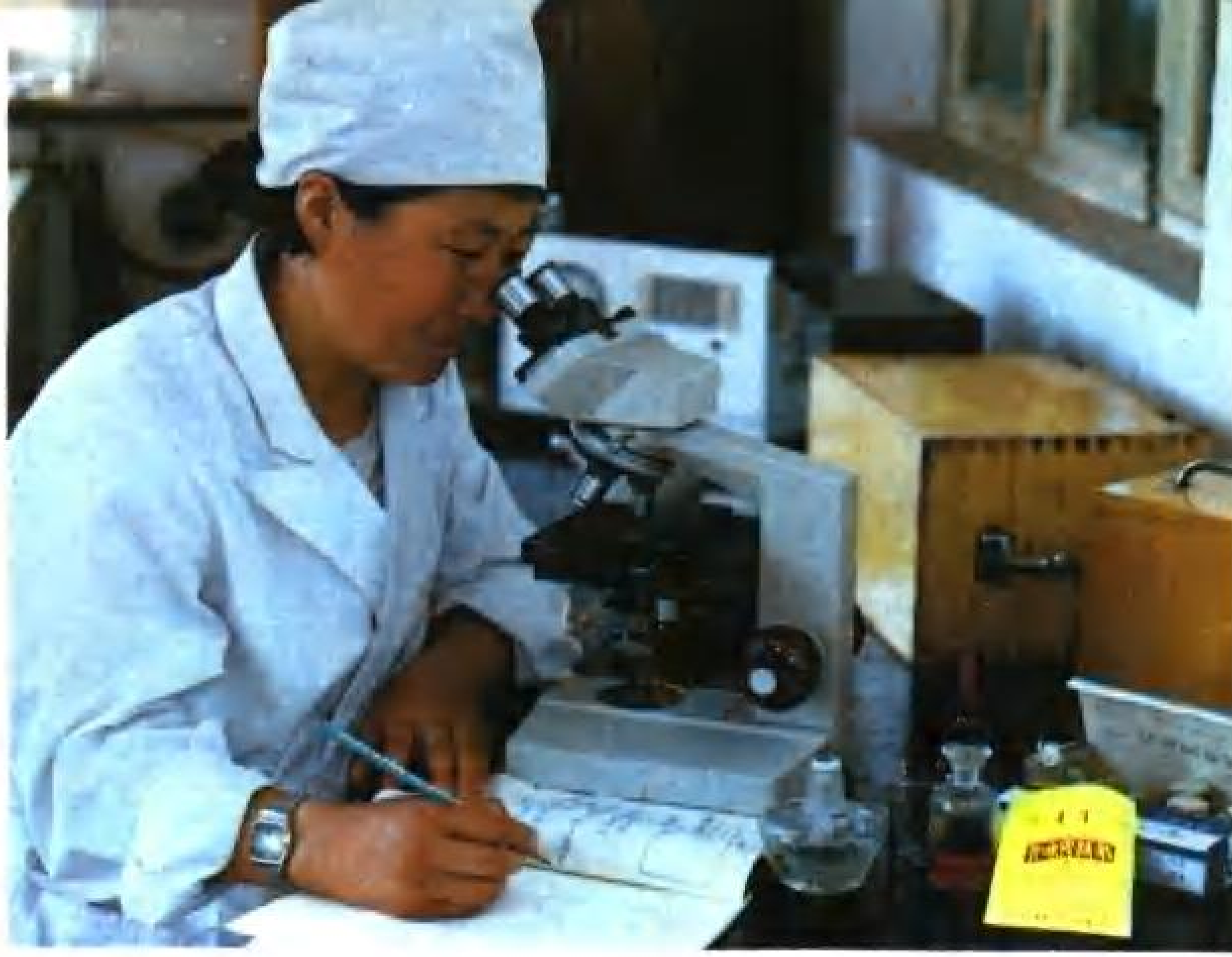
蒙药厂药品检测室