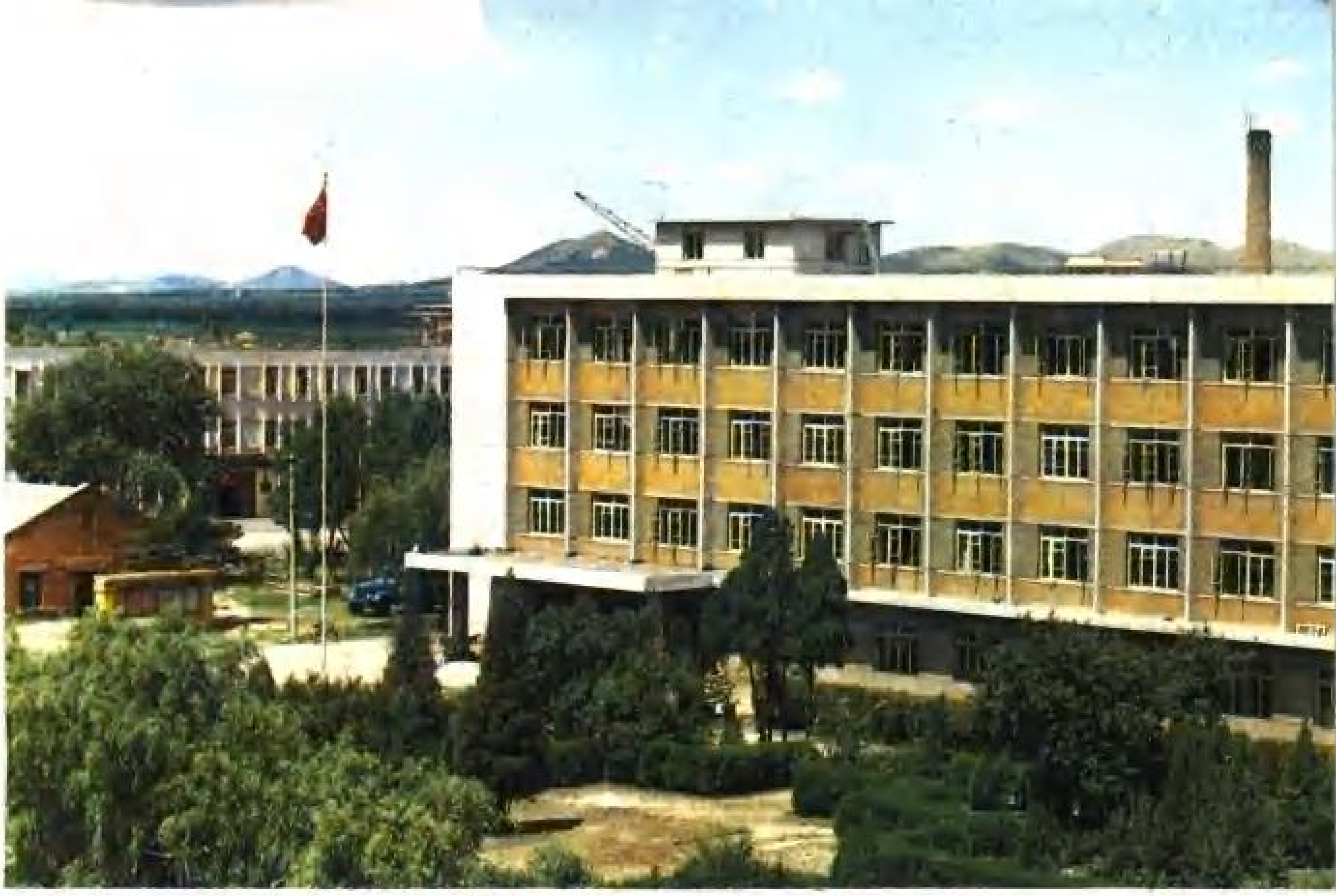
自治县政府办公大楼