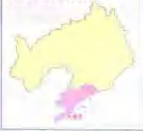
大连市在辽宁省的位置