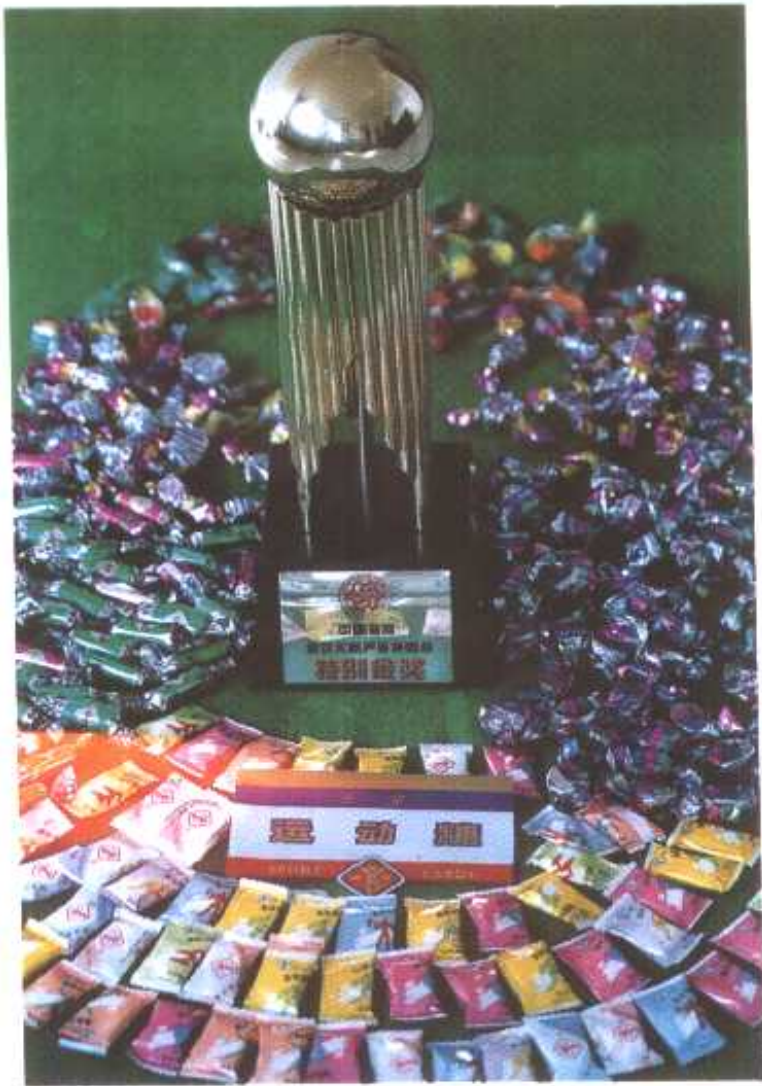
◁ 沈阳大二糖果厂产品运动糖获特别金奖