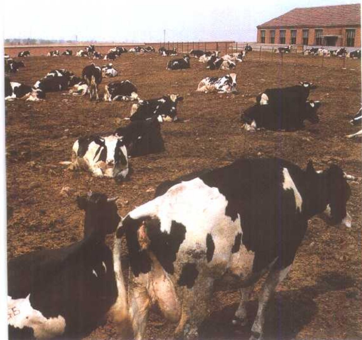
< 辉山畜牧场奶牛场地一角