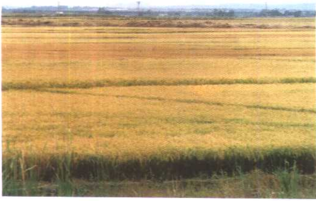
△水稻产区—汪家乡水稻田一角