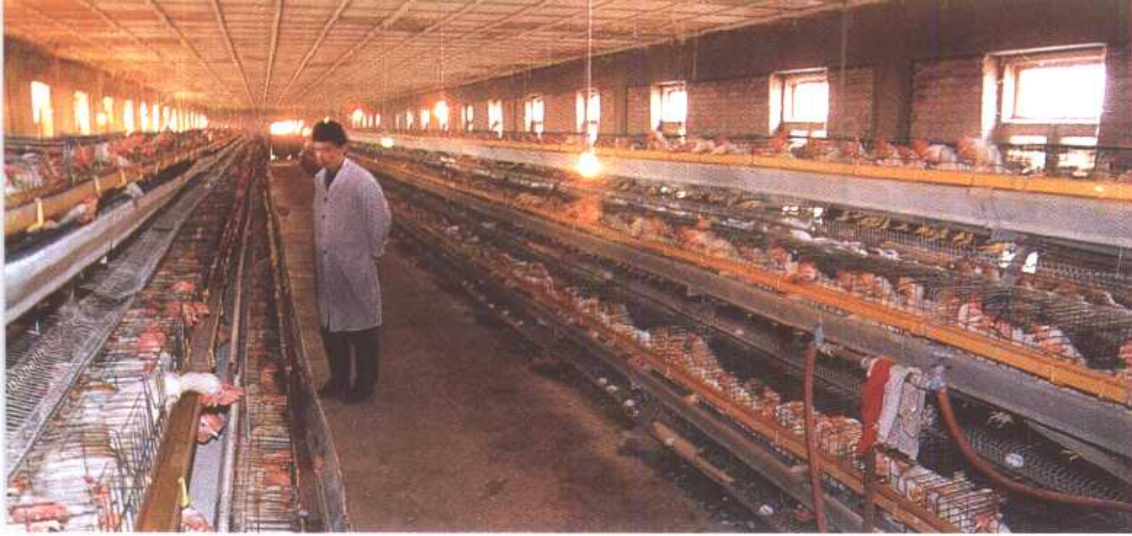
< 东陵区种畜种禽场一角