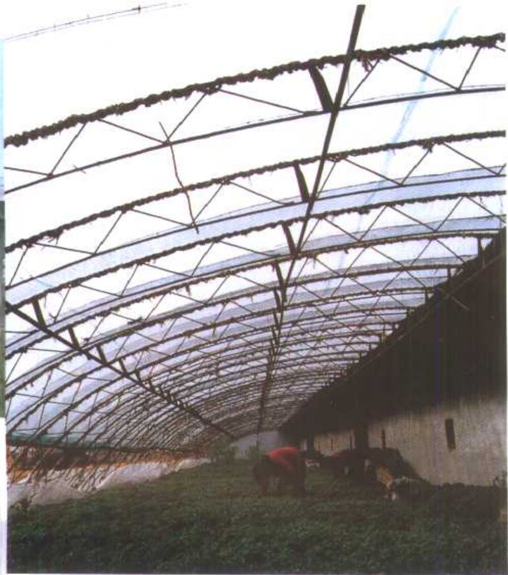
◁下深村蔬菜生产大棚内操作