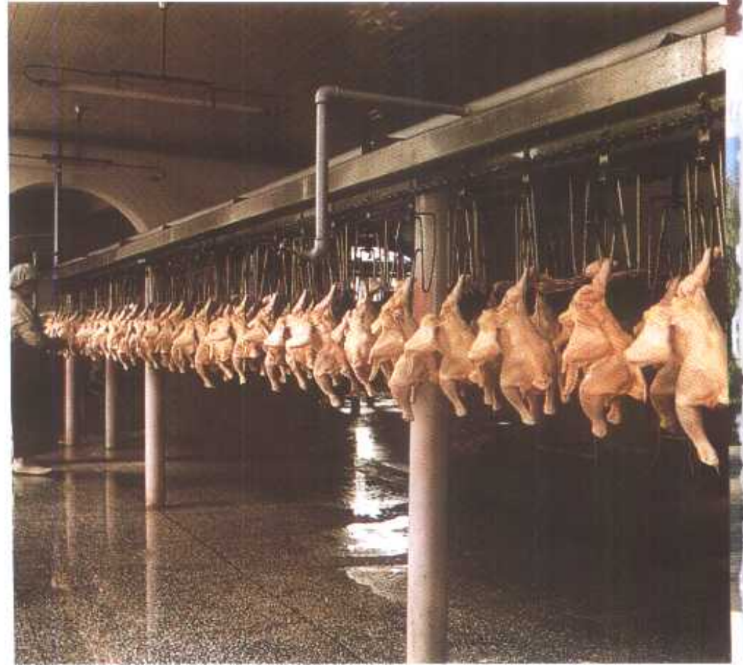
△ 东塔宰鸡厂生产车间