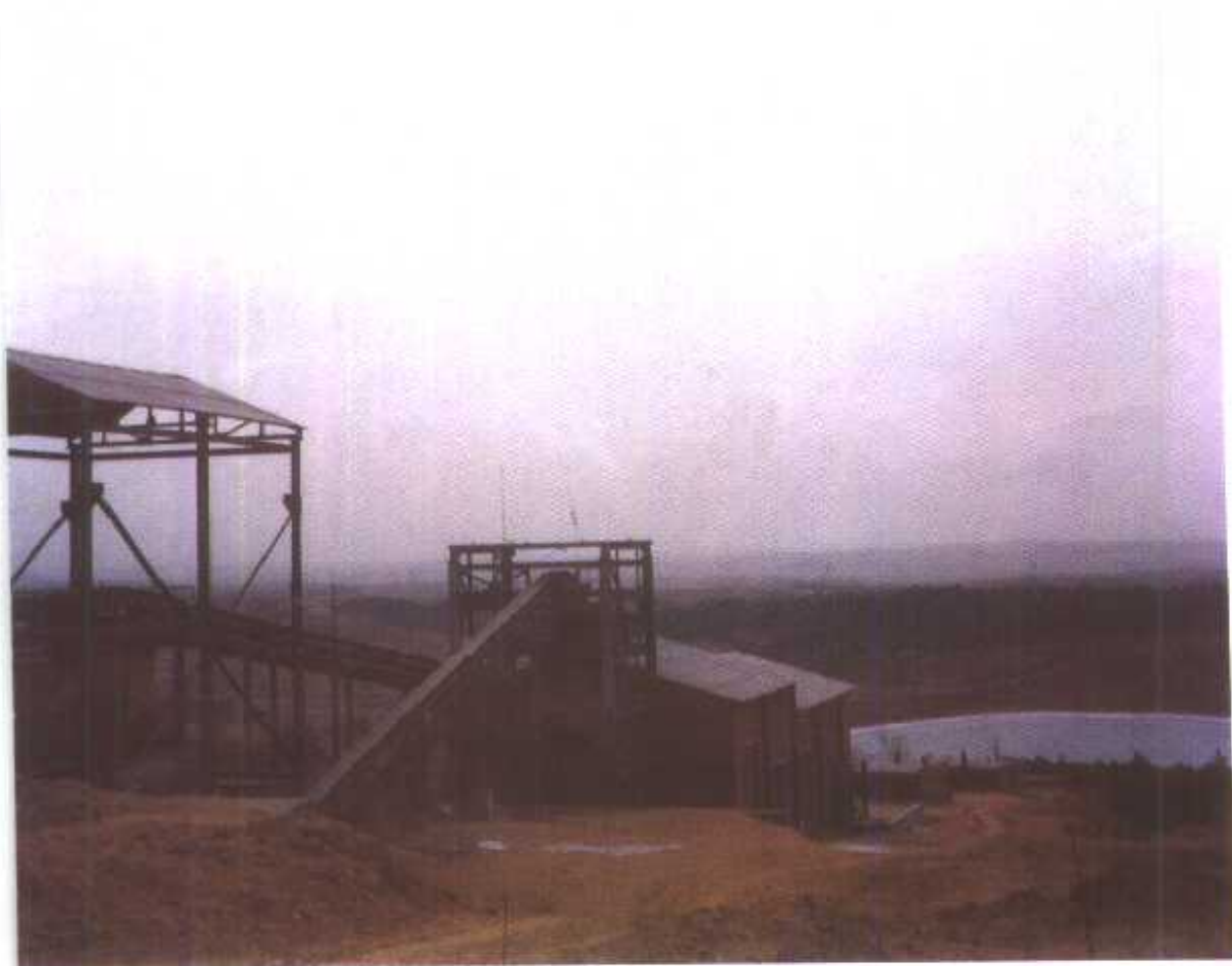
▽ 王滨沟乡尖山子铁矿破碎车间