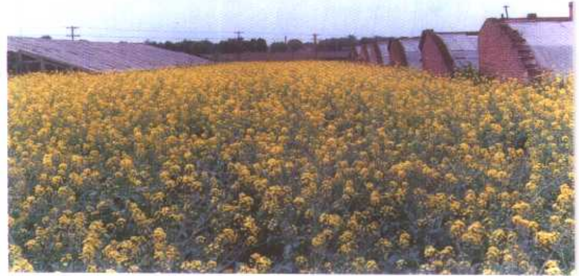
△东塔蔬菜种子田之一