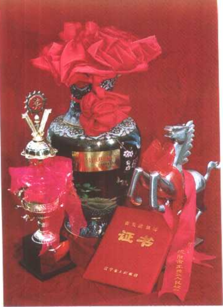
◁ 东陵区政府殊荣选照