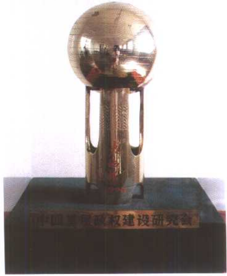
◁ 五三乡获全国十佳乡镇大地杯奖