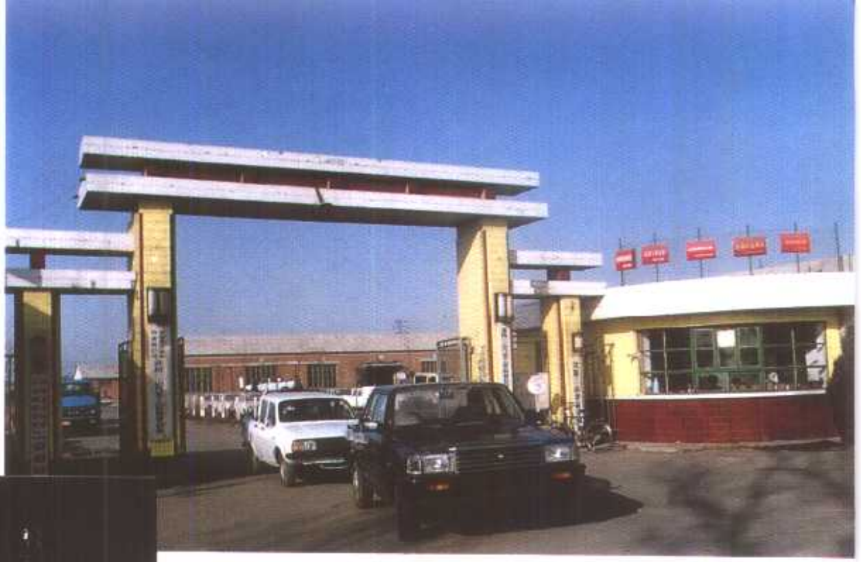
沈阳三山汽车工业联营公司