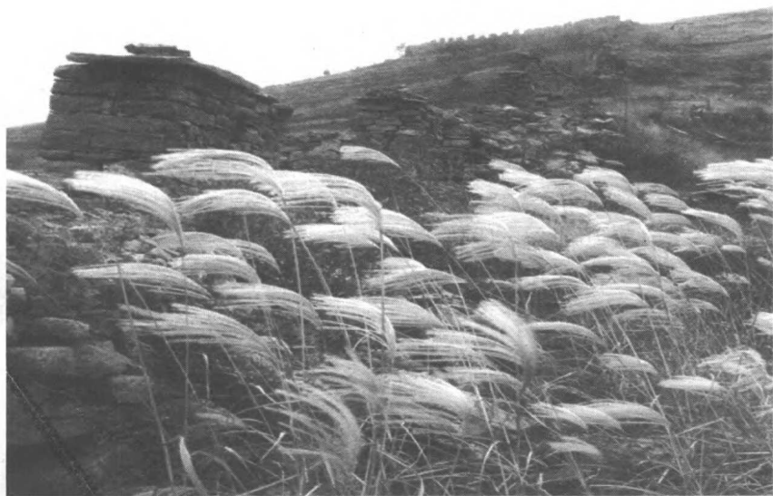
周庄五十二年(前685年),沿泰山山脉修筑的齐国长城局部(见本书第3页)。