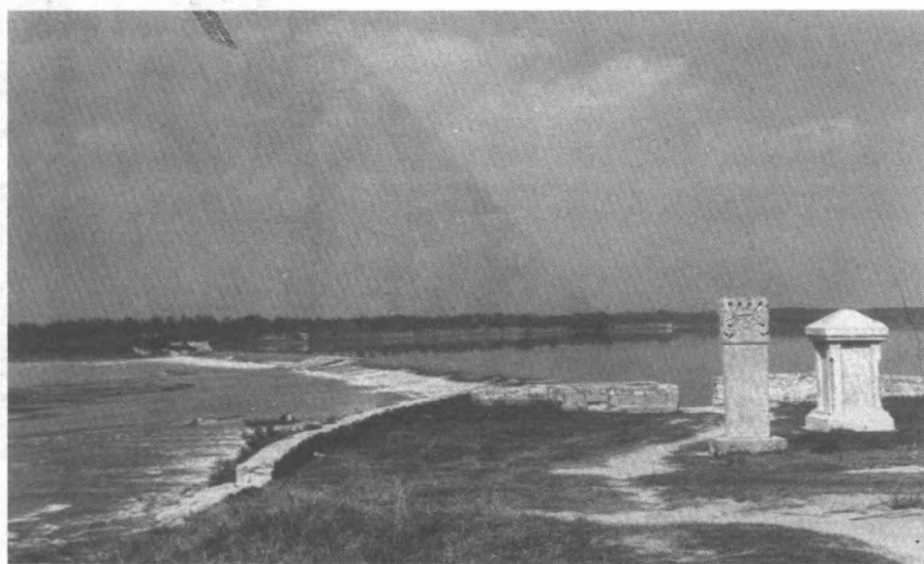
明永乐九年(1411年),在汶河下游修筑的截汶济运(河)工程——东平戴村坝(见本书第62页)。