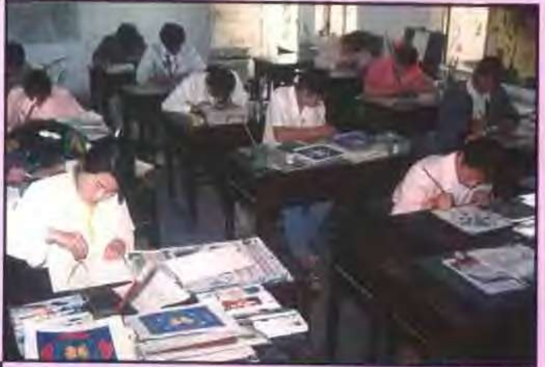
城镇职业高中学生在作画