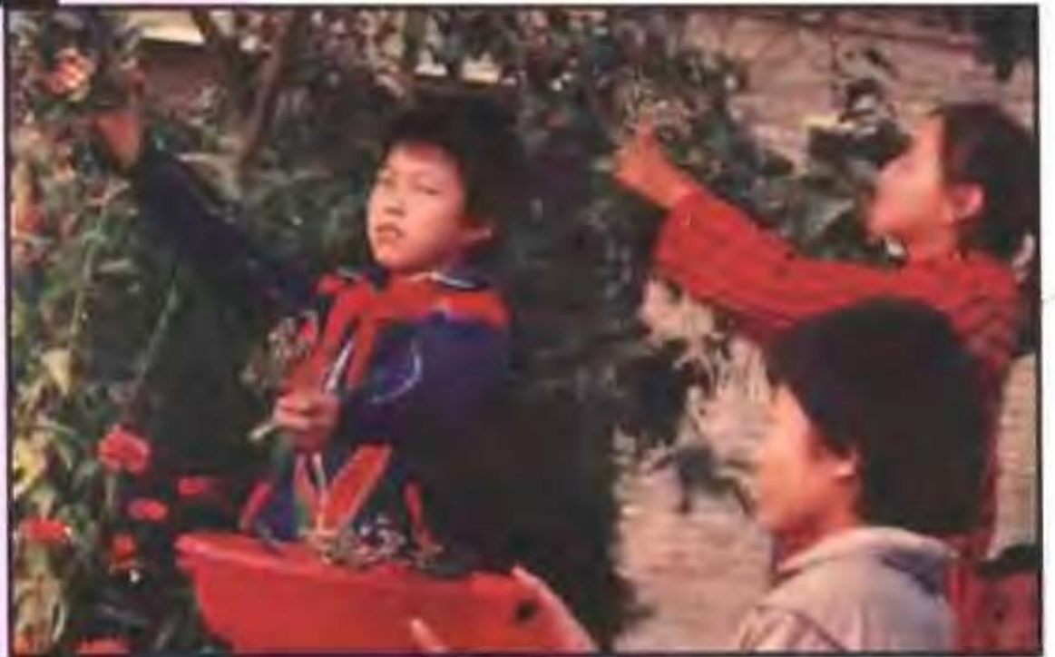
三桥乡中心小学（桂庄）学生在采集树种