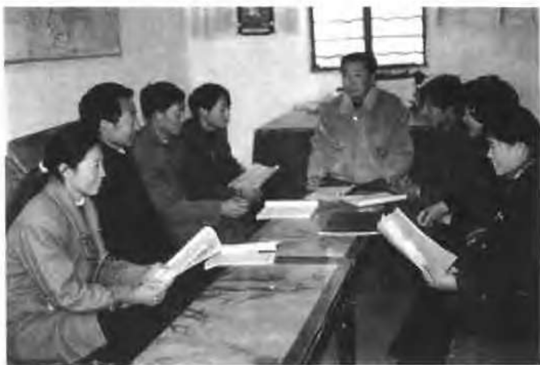
老君庙镇第一初级中学领导成员与教师一起备课