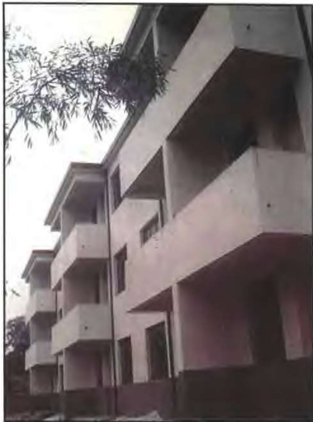
常兴乡初级中学新建的教师宿舍楼