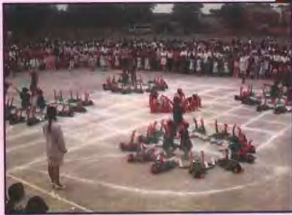
县直幼儿园的儿童在进行文艺表演