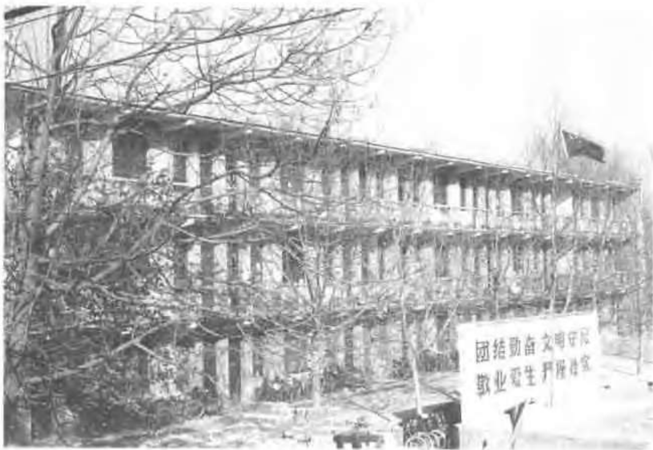
三门峡乡初级中学教学楼