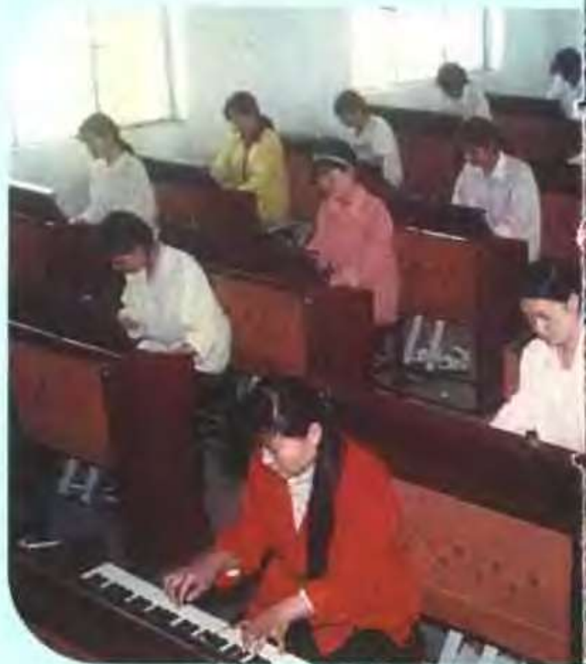
县教师进修学校的学员在琴房练弹