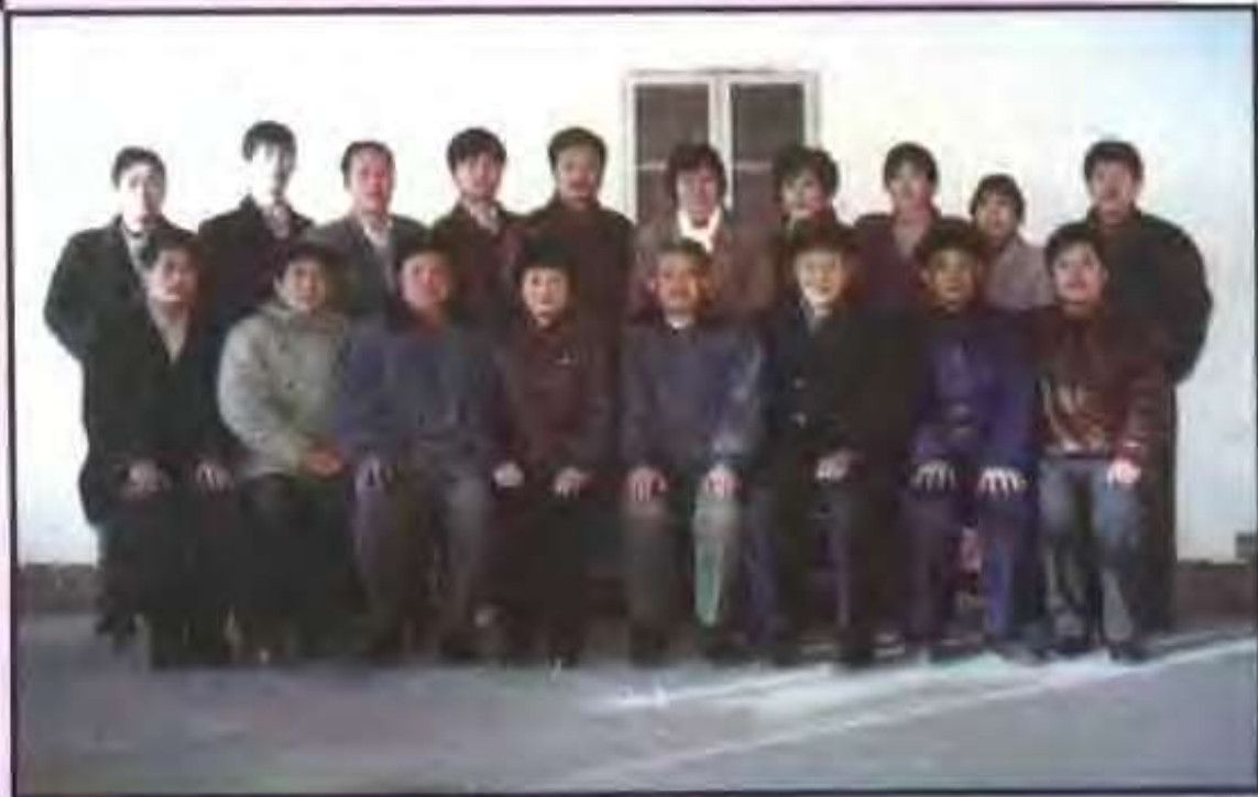
县教育体育局教学研究室全体同志合影