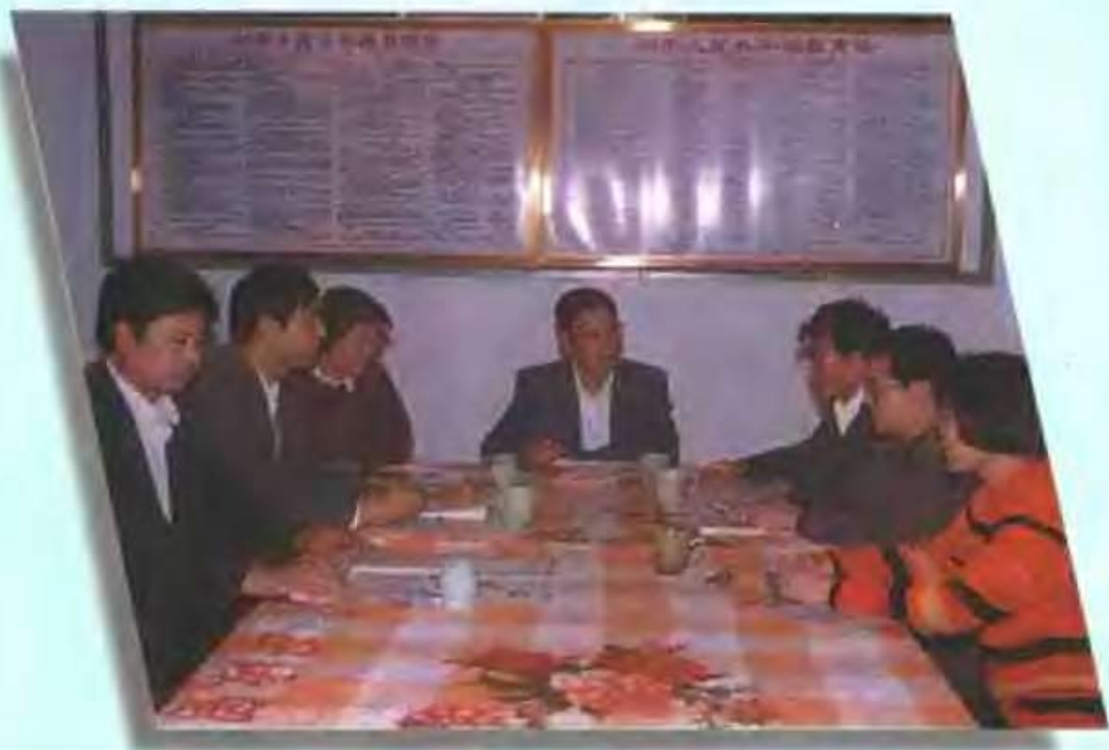
汝宁镇第二初级中学领导班子在研究德育工作措施