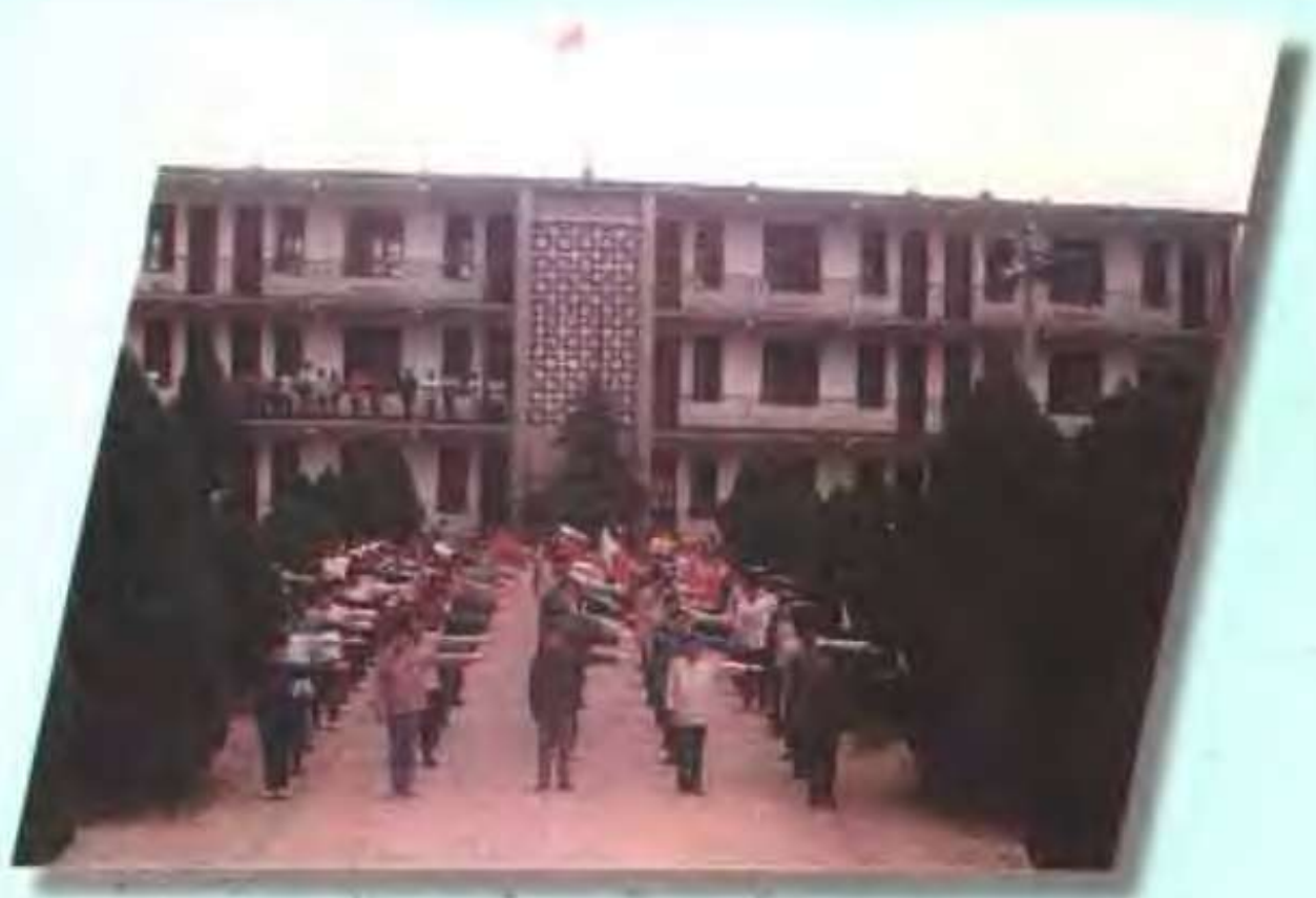
南余店乡初级中学学生在做课间操