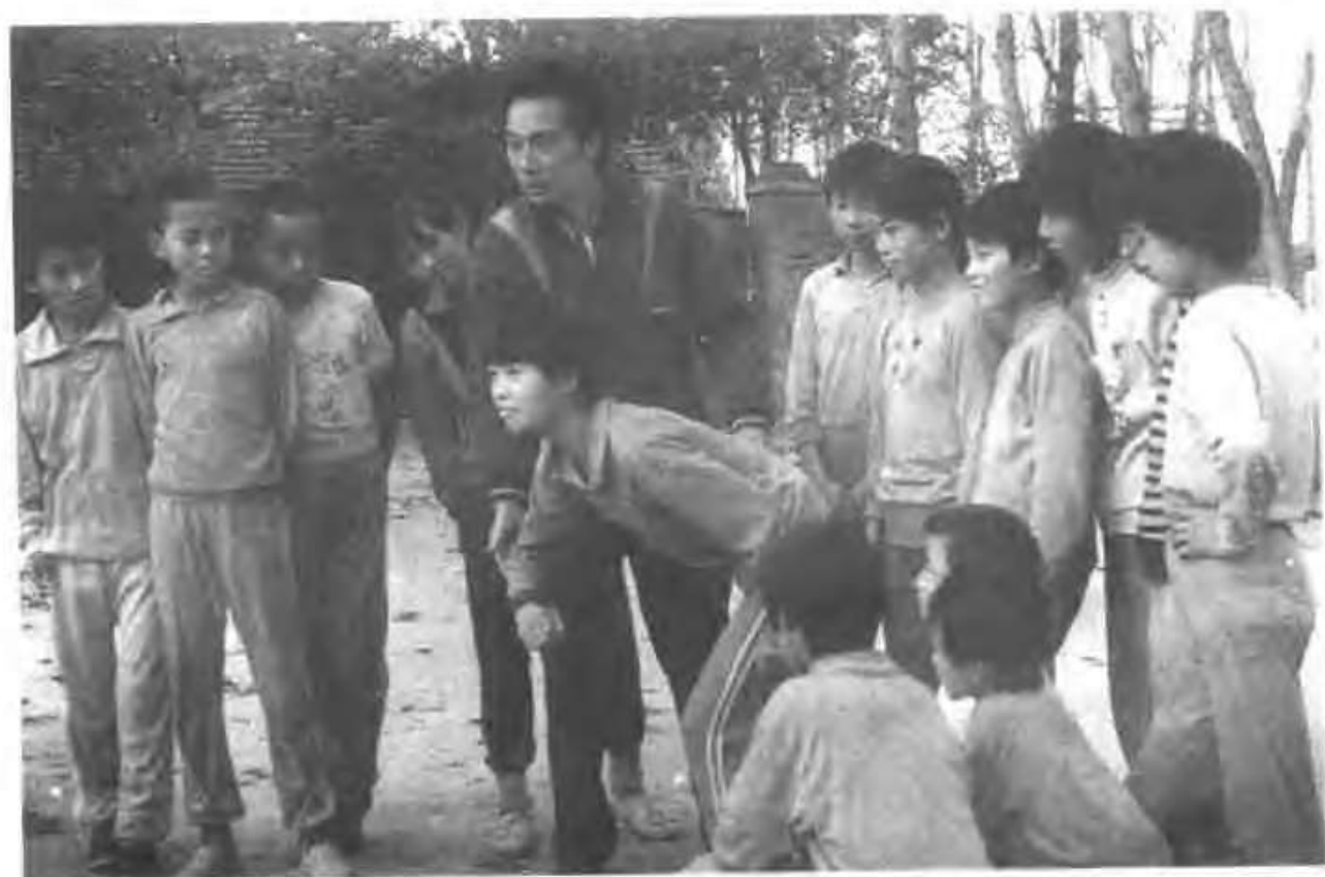
三里店乡果园小学教师在上体育课