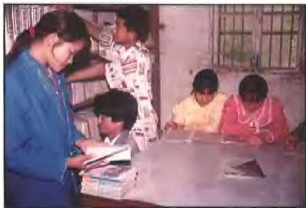
韩庄乡初级中学图书阅览室一角