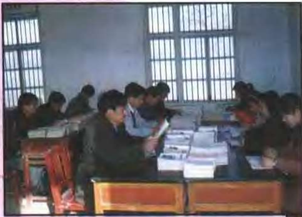
韩庄乡中心小学（韩庄）教师在办公