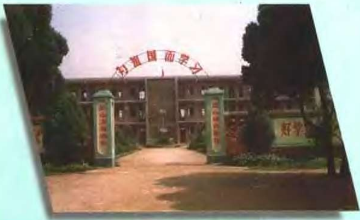
和孝镇第二初级中学校门