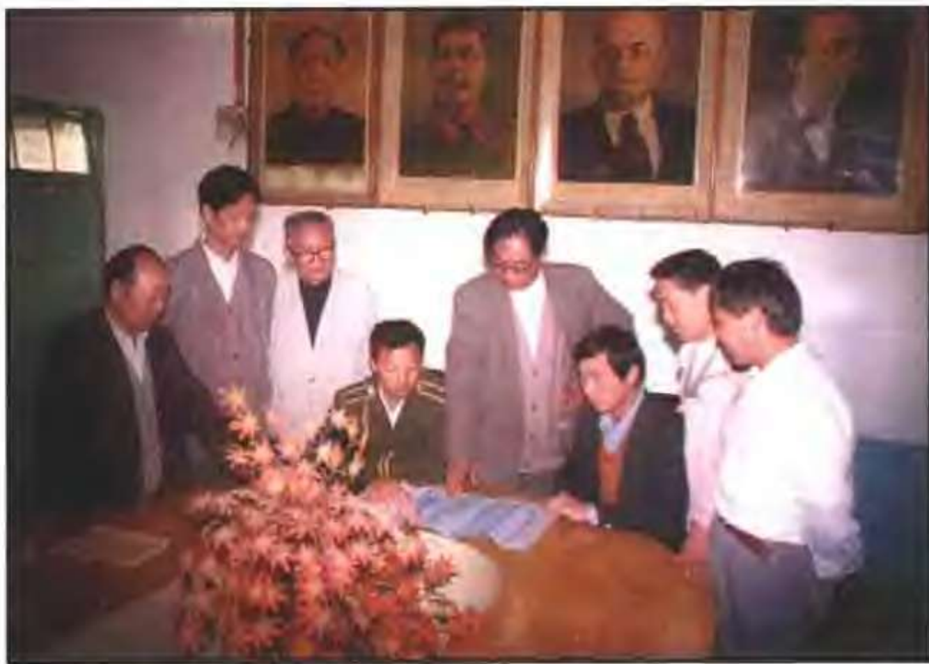
汝南高中领导班子在规划学校蓝图