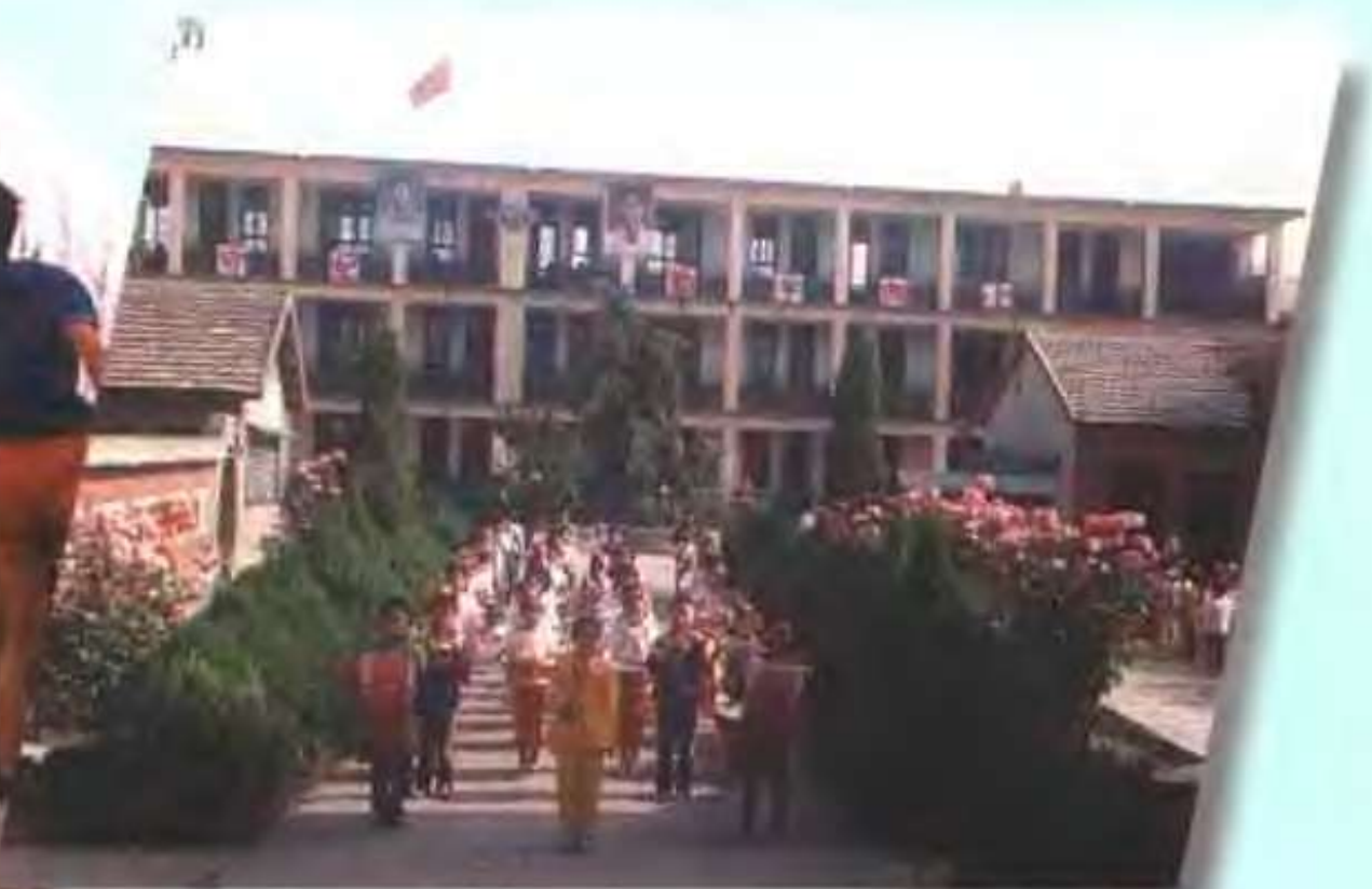
汝宁镇第三小学鼓乐队在操练