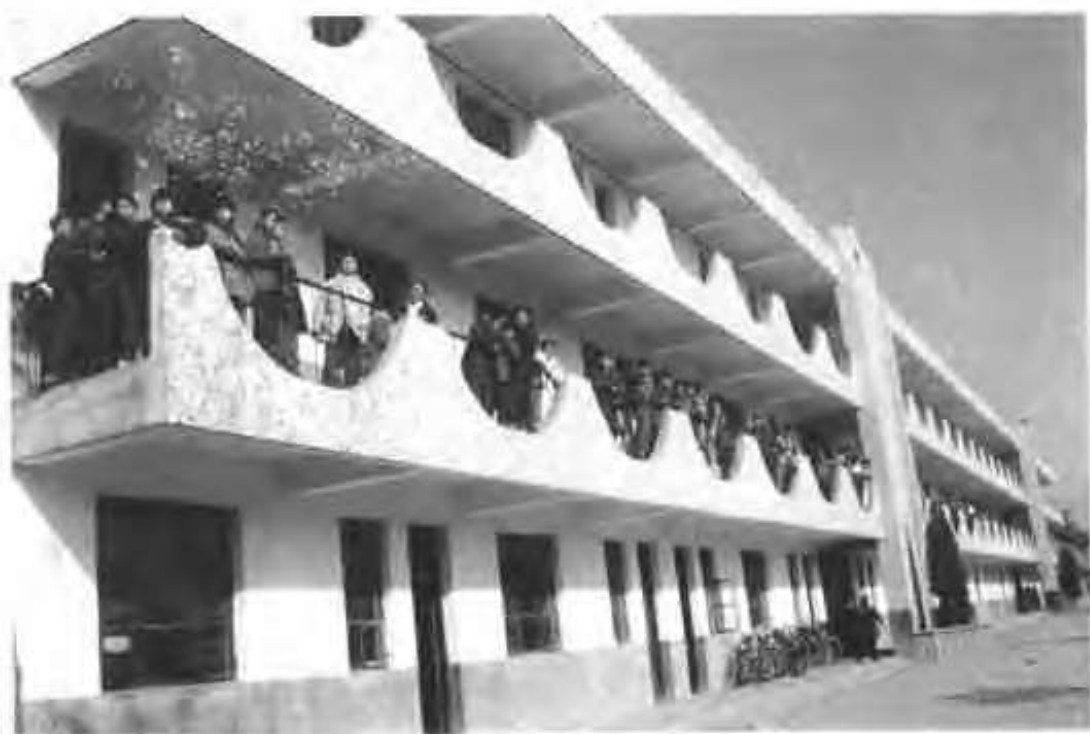
新落成的板店乡初级中学教学楼