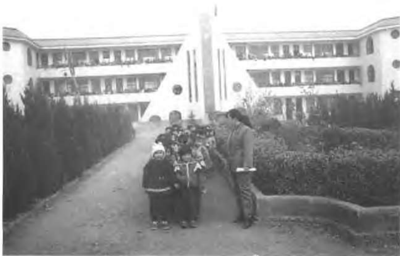
水电乡中心小学(水电)全貌