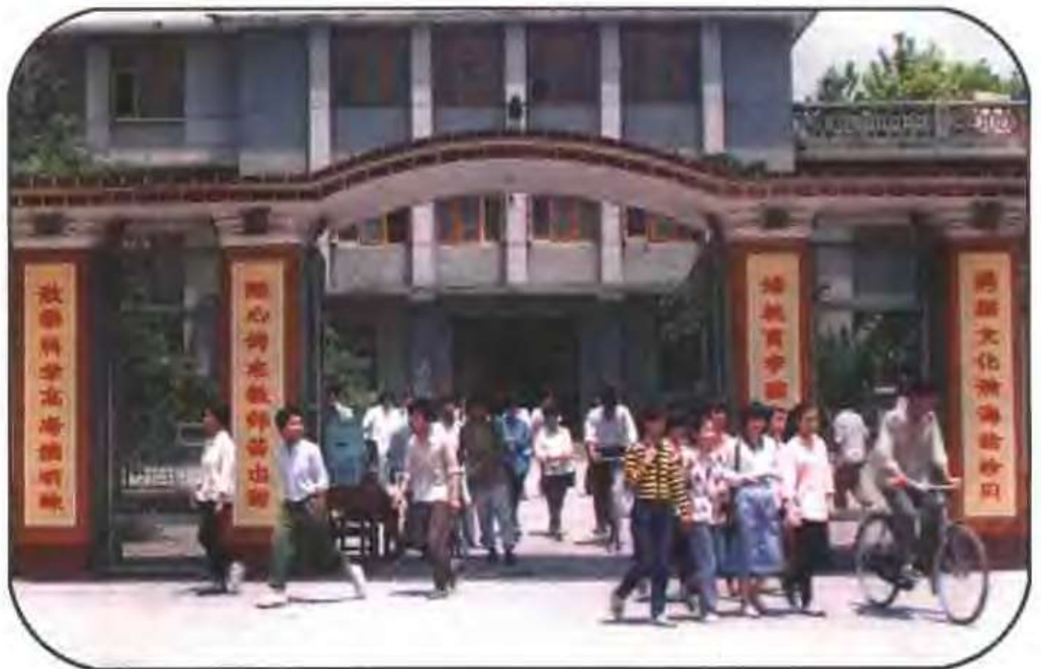
汝南第三高级中学校门