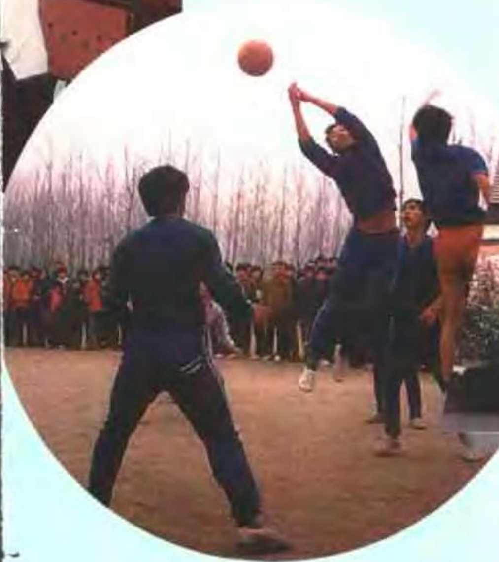
留盆镇第一初级中学学生在进行班级篮球赛