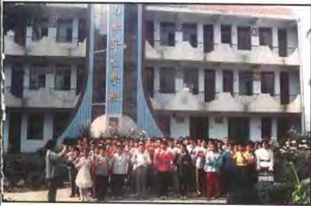
县聋哑学校学生在用哑语唱《国歌》