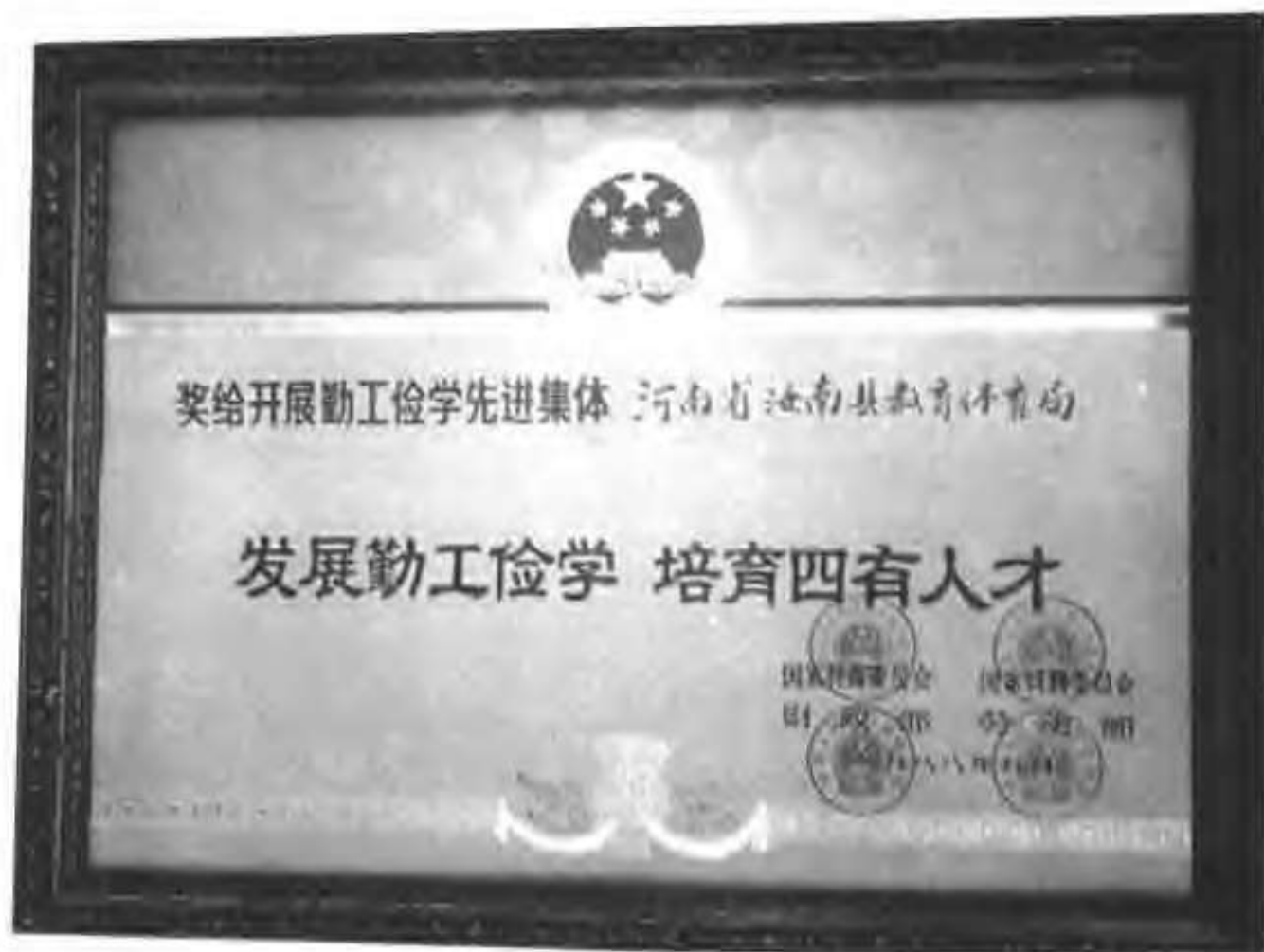
县教育体育局荣获的国家级“勤工俭学先进集体”奖状