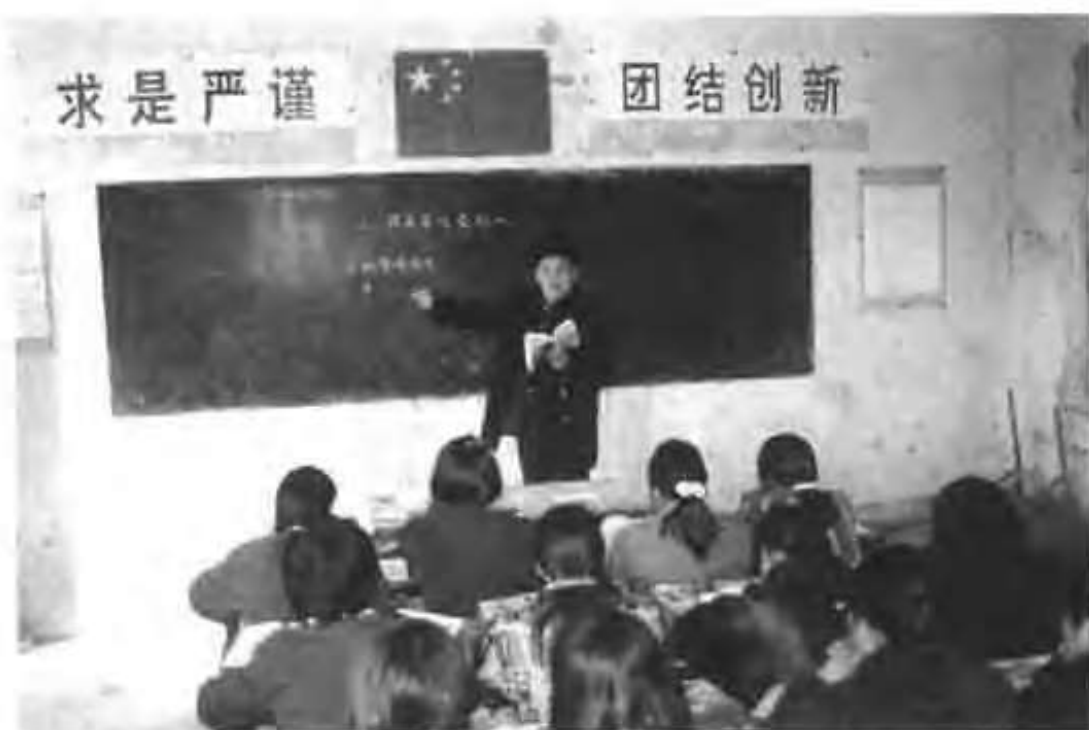
张楼乡庙东初级中学教师在讲课