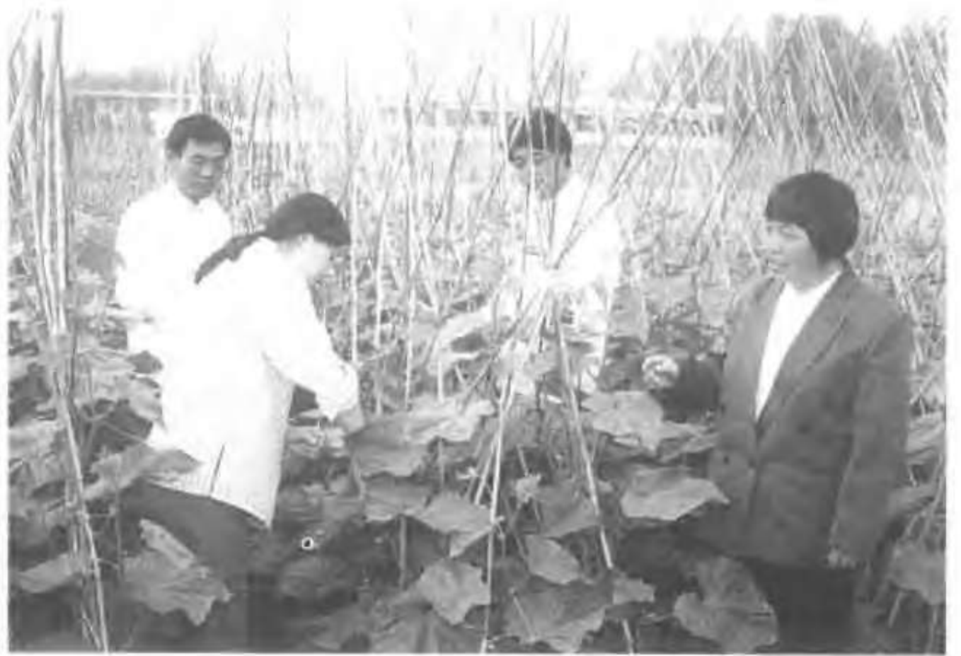
张楼乡中心小学(湖北)教师在试验田中操作