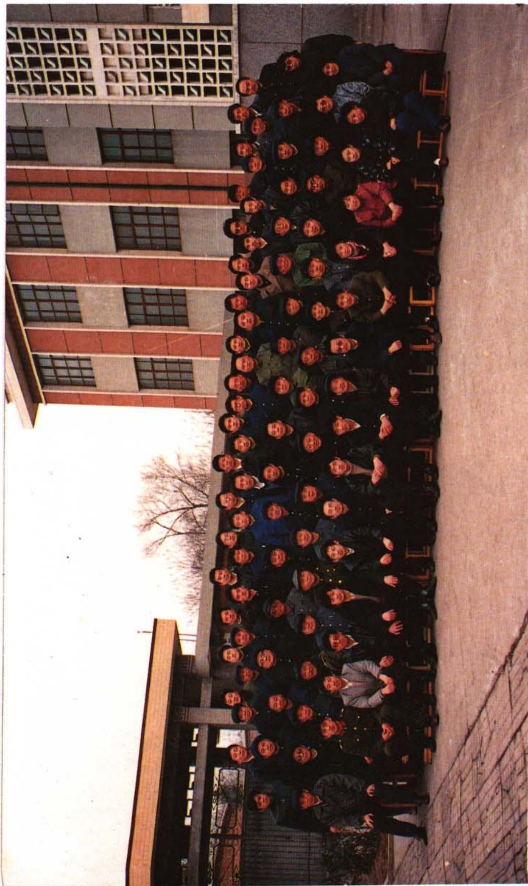
1990年聊城地区中心支行全体人员合影