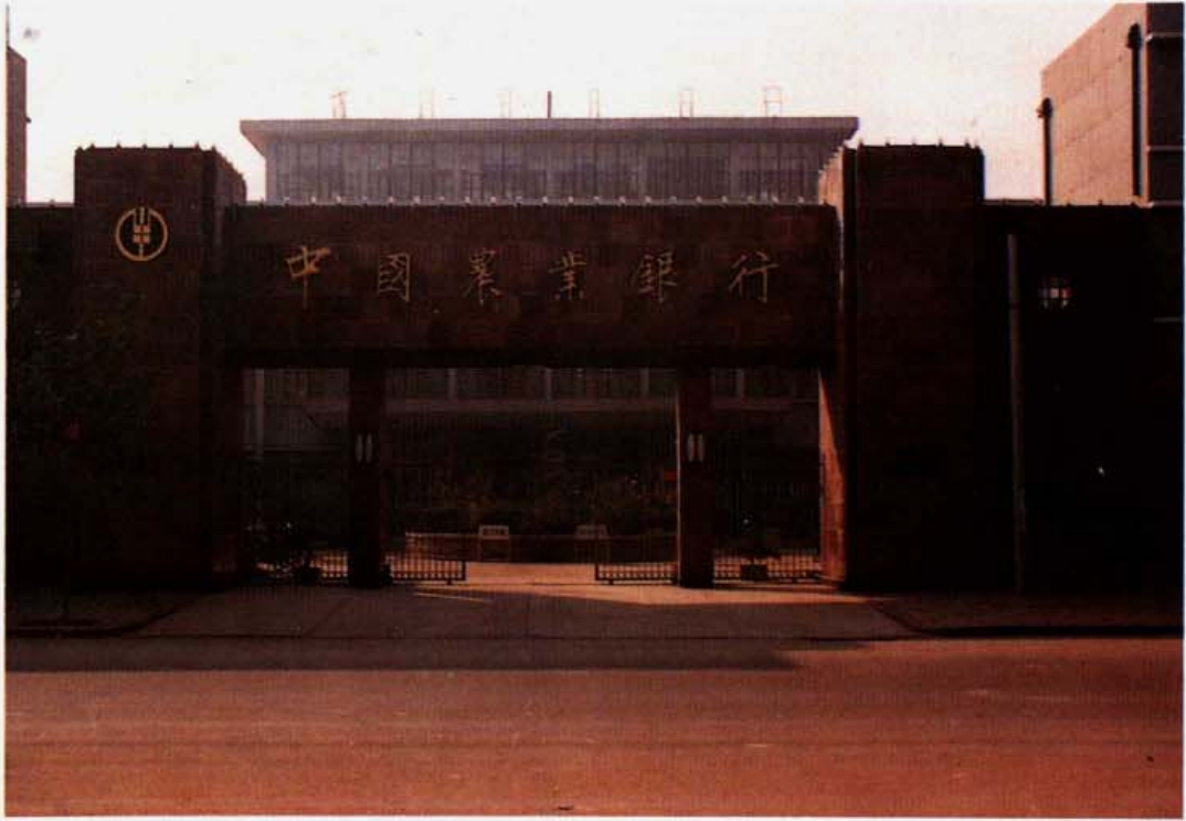
聊城地区农业银行正门