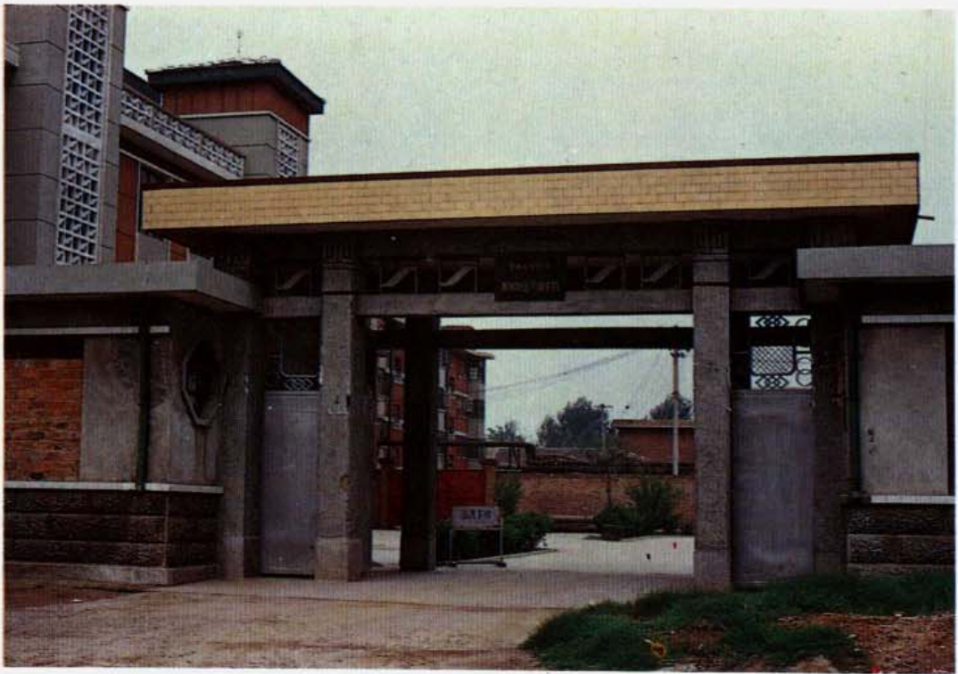
聊城地区农业银行干校