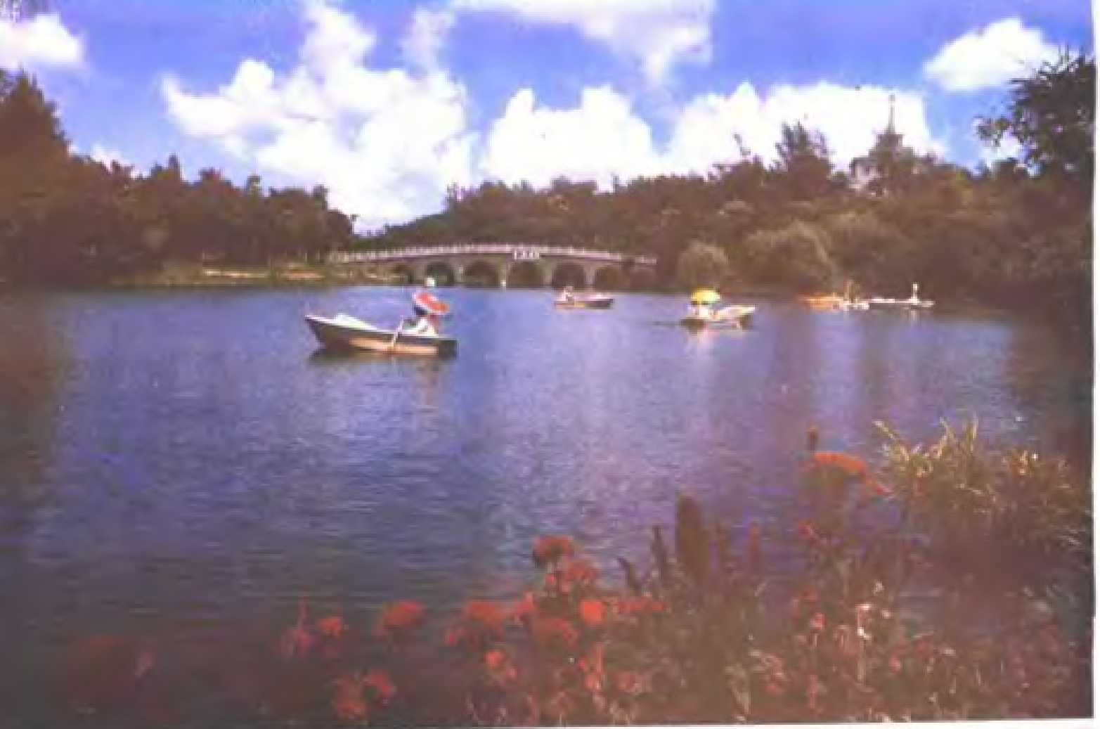
寸金桥公园月影湖（湛江）