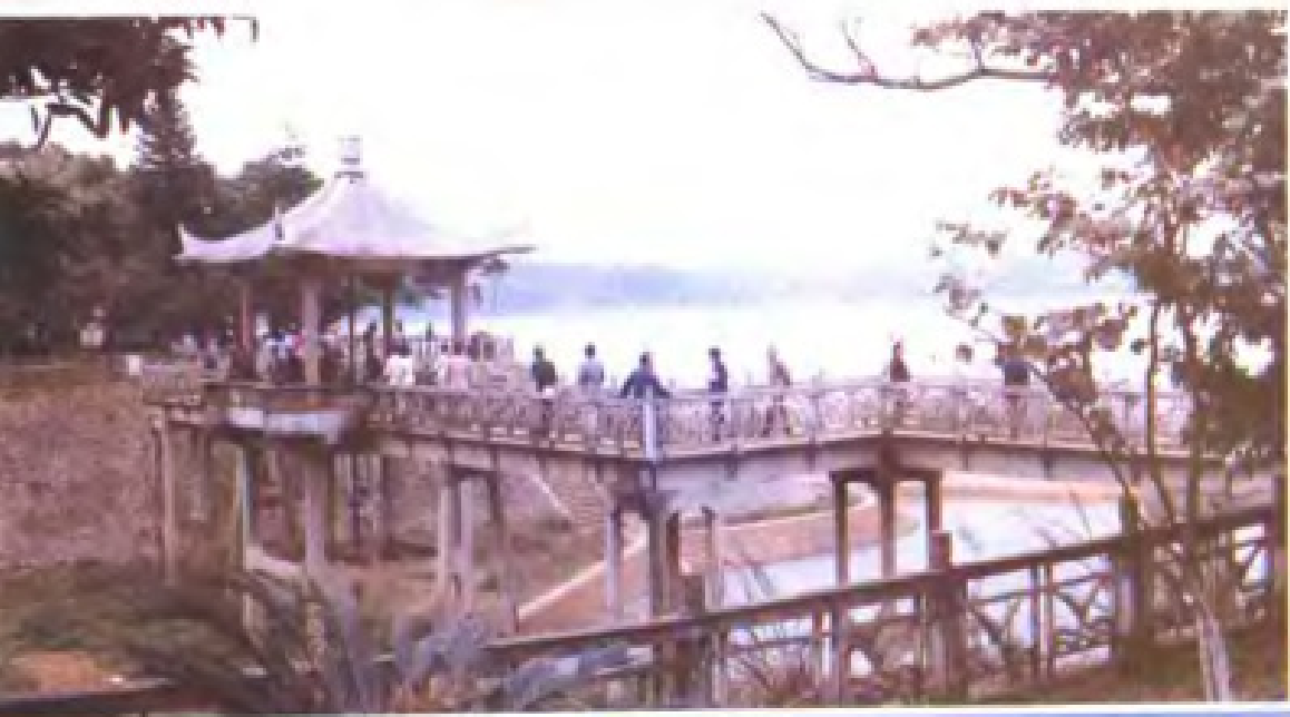
湖光岩风景区 (湛江)