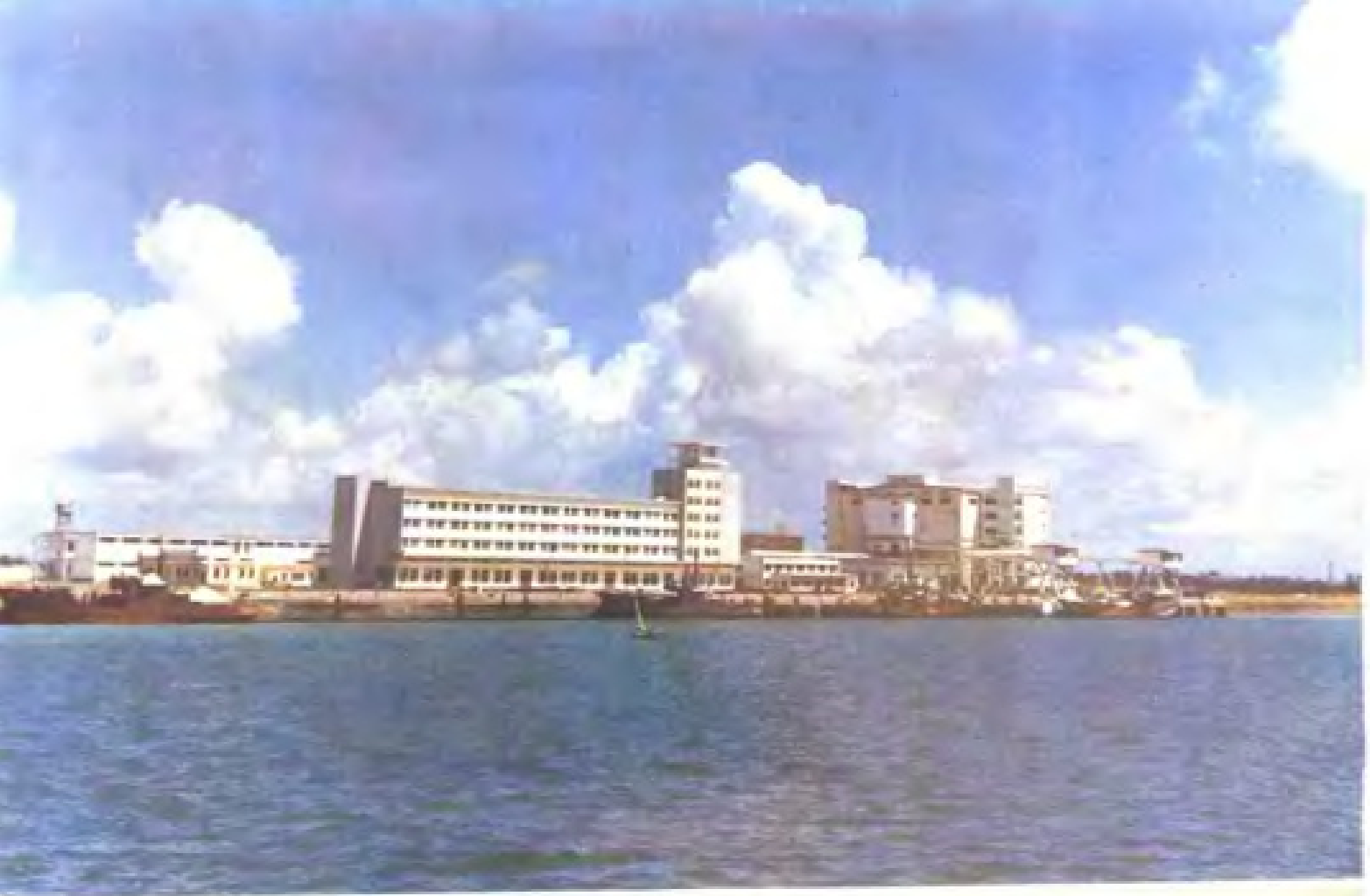
湛江海洋渔业公司码头