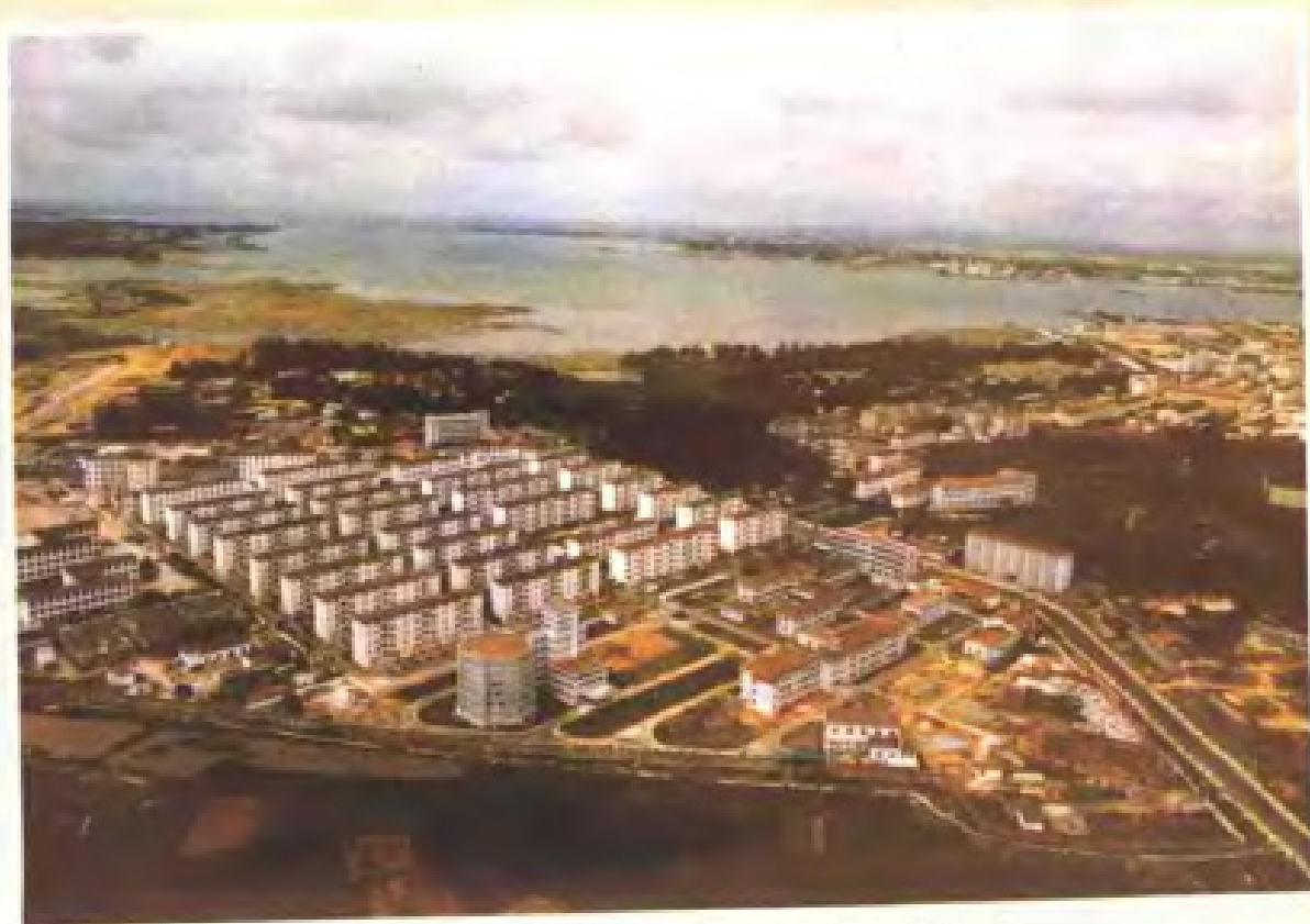
南海西部石油公司基地生活二区（湛江）