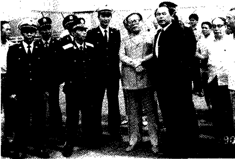
江泽民总书记视察皇岗口岸（1990年）