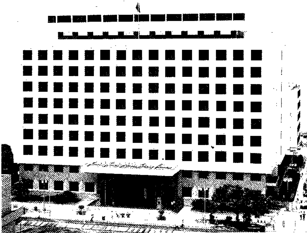
中华人民共和国九龙海关办公楼（1987年）