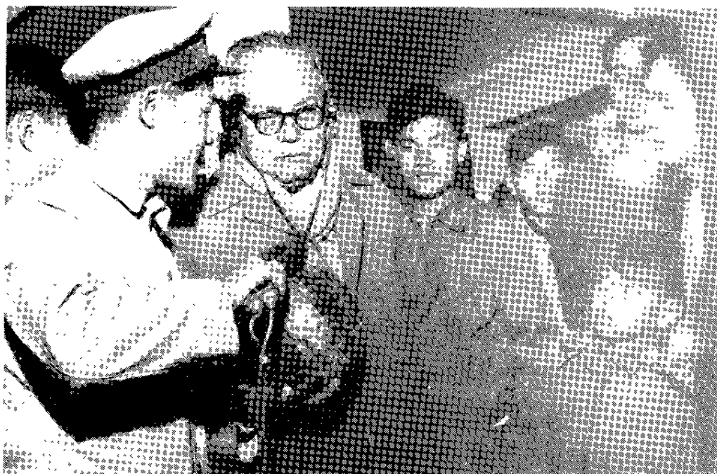
叶剑英元帅到关视察（1961年）