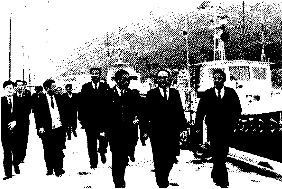
海关总署署长戴杰到关检查工作