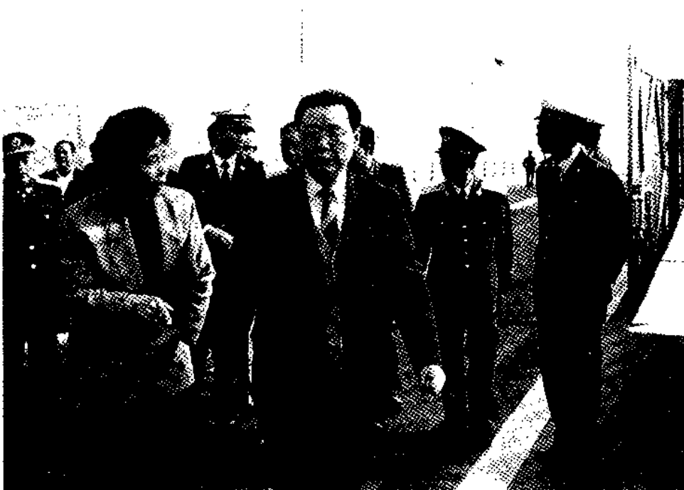
李鹏总理视察皇岗口岸（1990年）