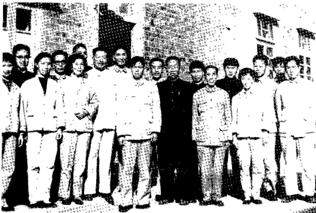
贺龙元帅到关视察（1961年）