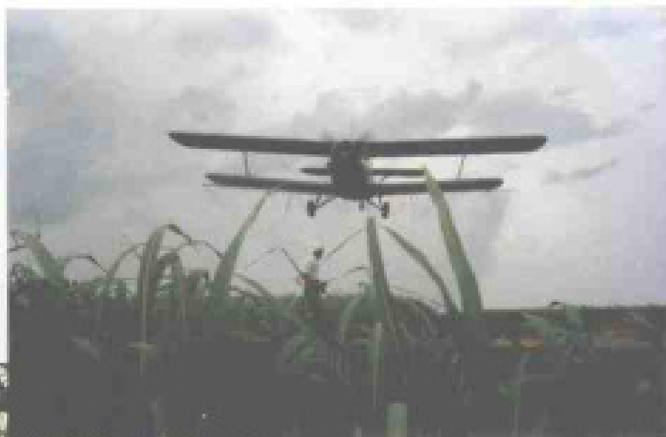
飞机对甘蔗 田喷施稀土肥