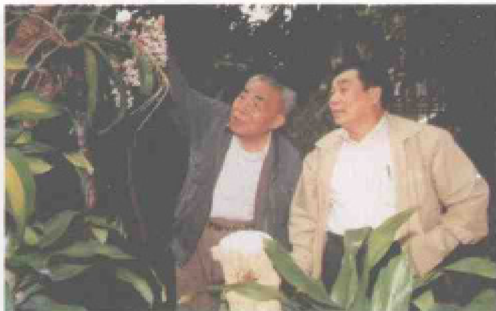
原海南区党委书记杨泽江 (左)在海南省农科院参观