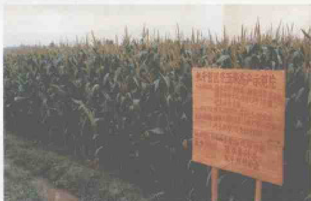
► 陵水县的冬玉米高产示范田