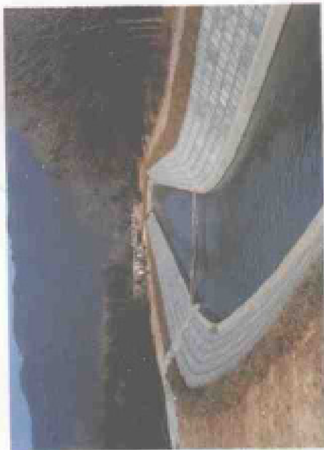
▲石碌水库干渠(东海段)