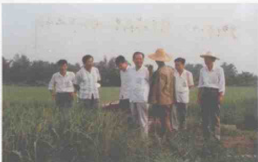
副省长陈苏厚深入基层了解 生产情况