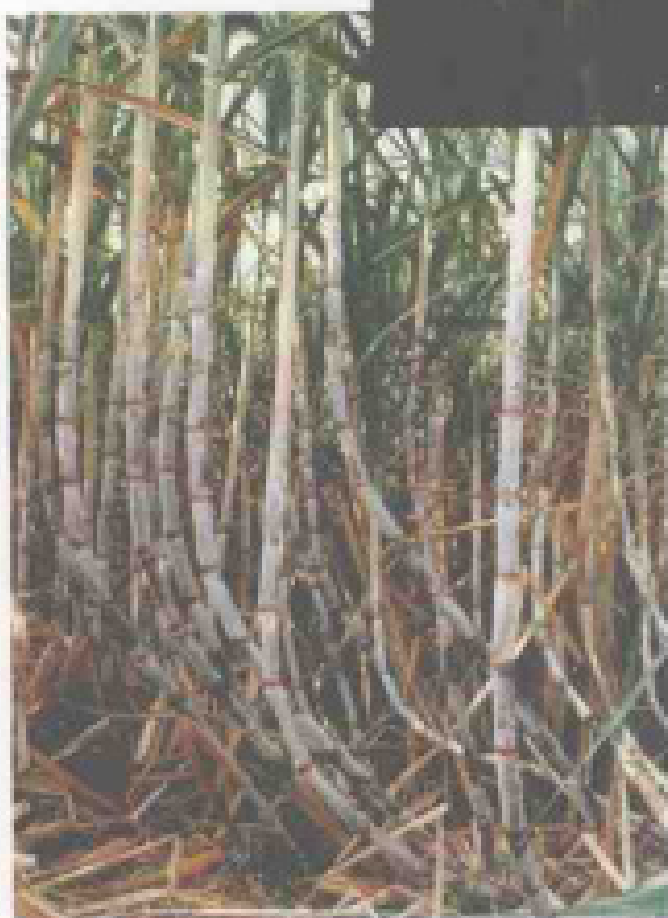
亩产 5 吨的高产坡地甘蔗