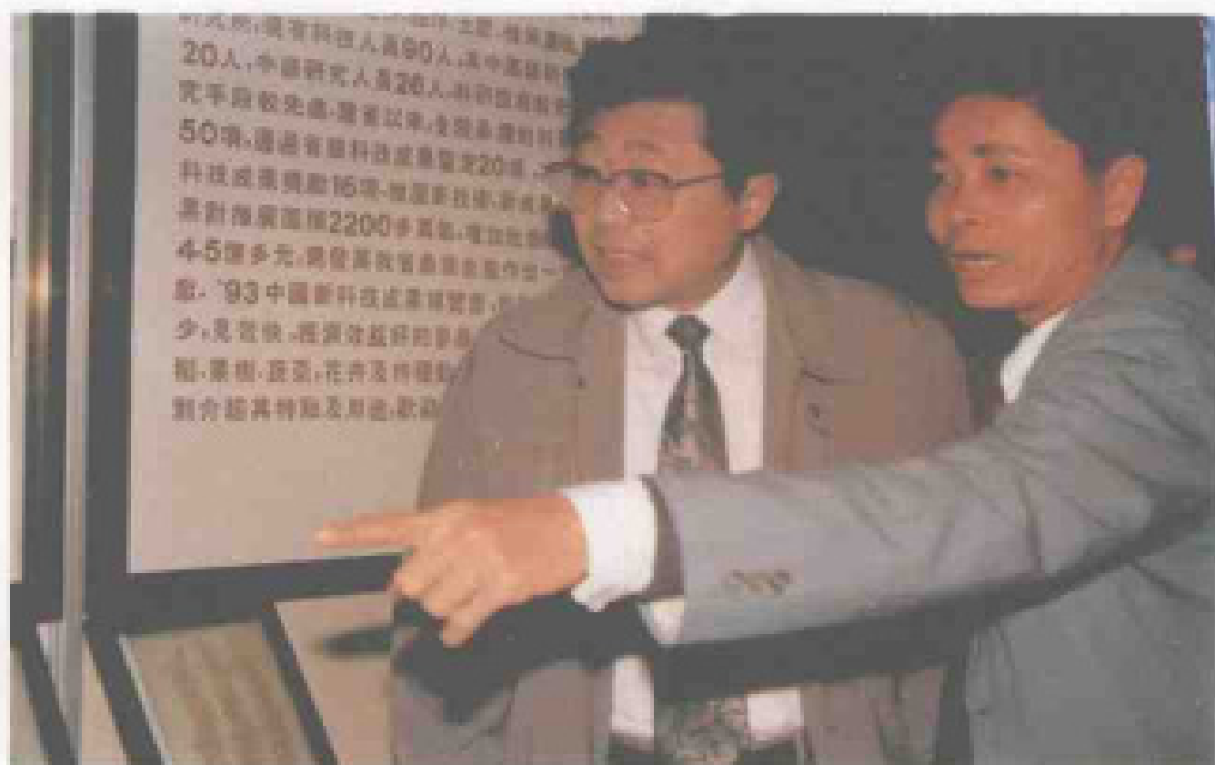
省委书记、省长阮崇武参观农科院科技成果展览