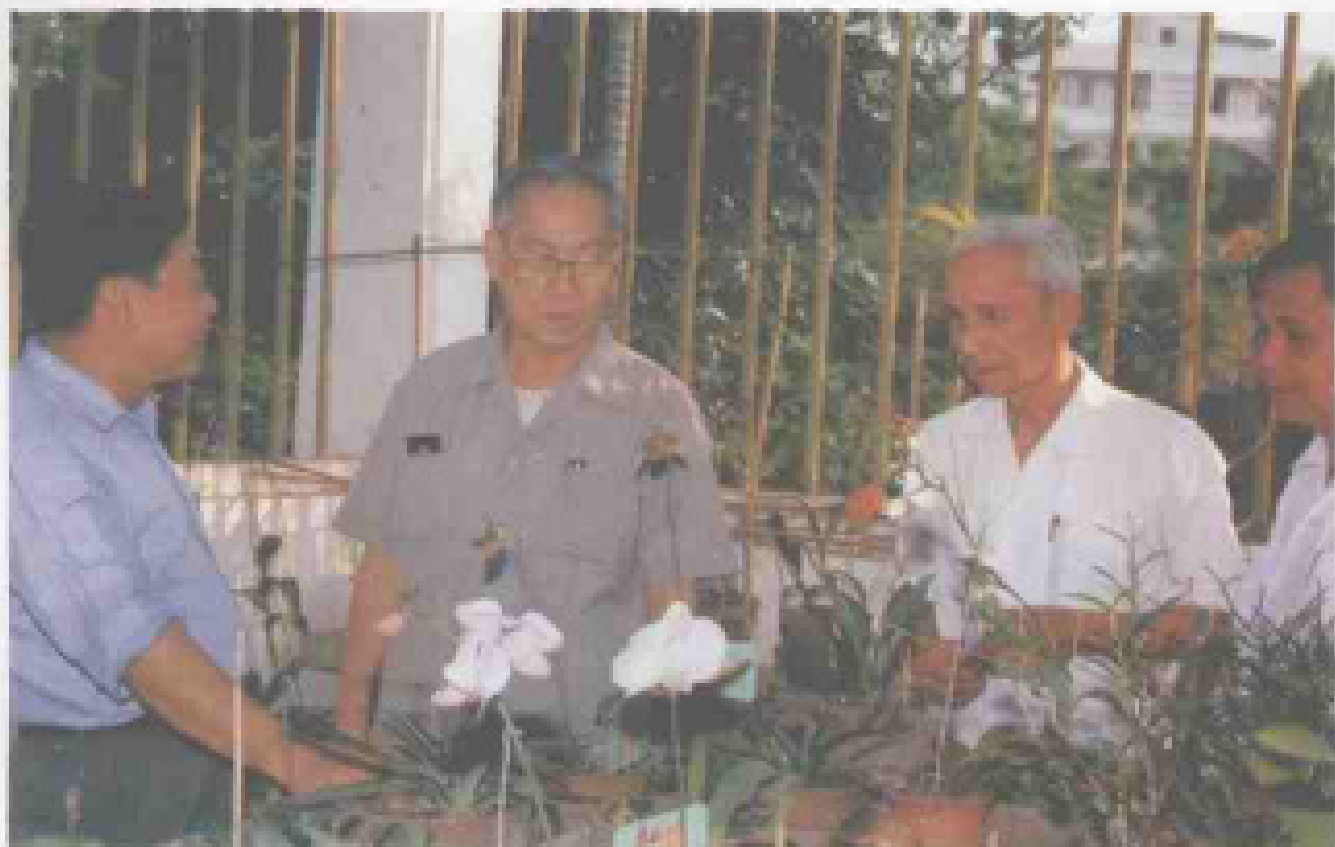
省委书记许士杰在省农科院兰花圃参观指导