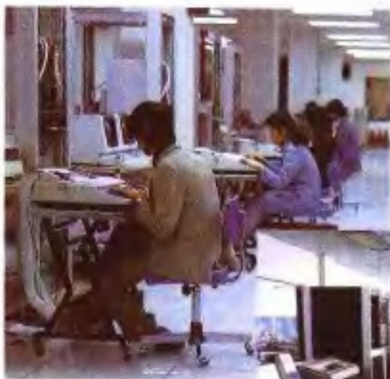
华南计算机公司生产车间