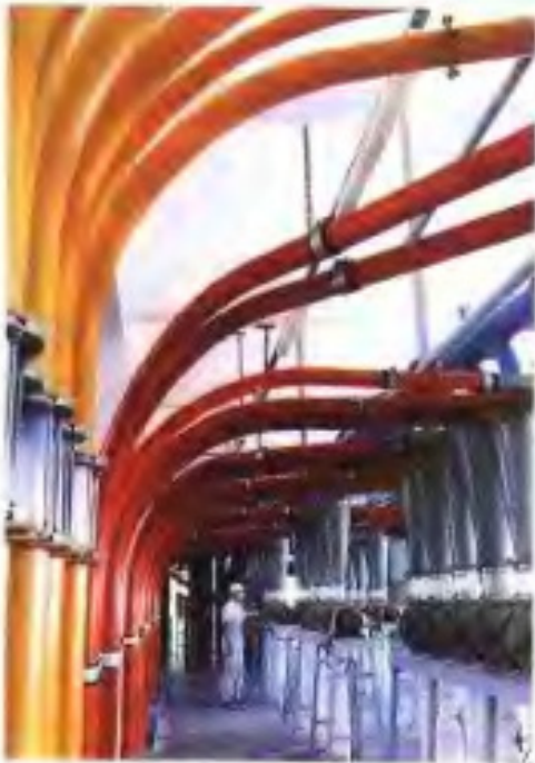
广州味精厂生产车间