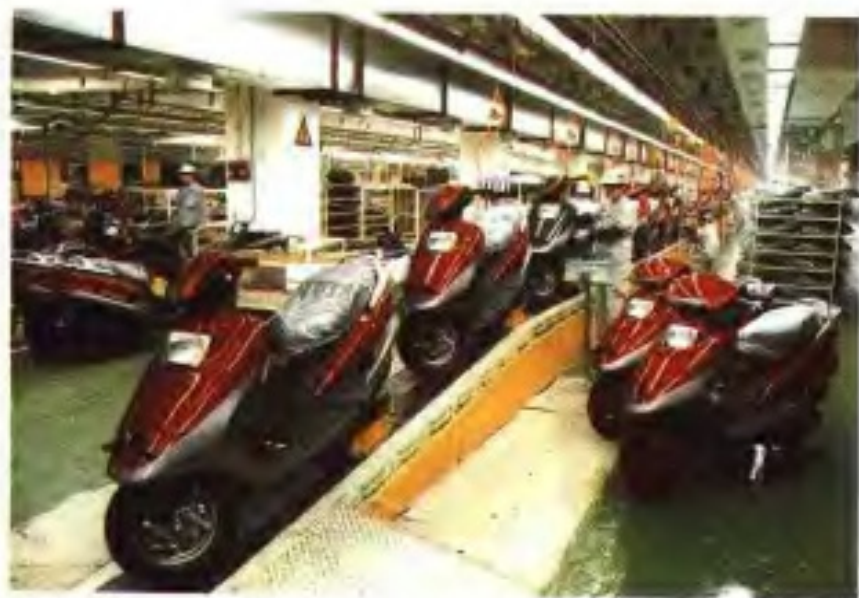
广州摩托集团公司摩托车装配线