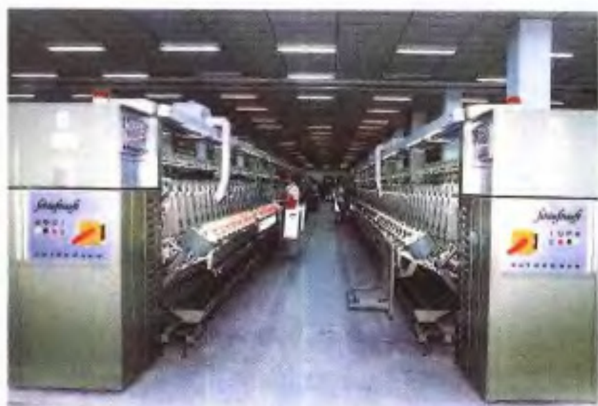
广州第二棉纺厂生产车间