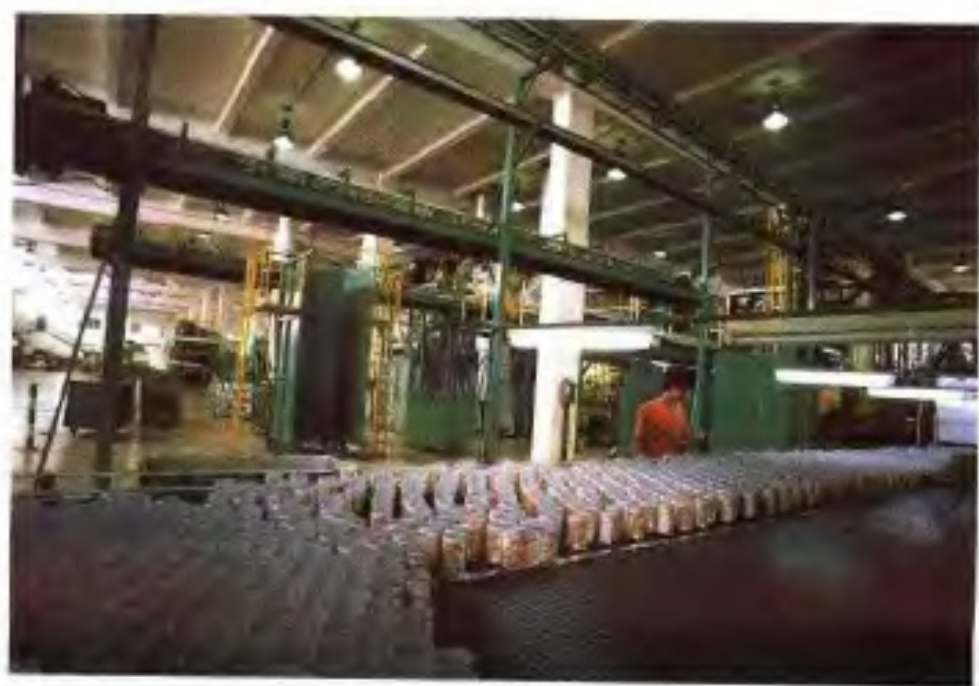
广州美村容器有限公司易拉罐生产线