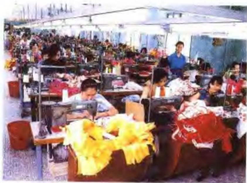
广州市东升儿童服装厂生产车间