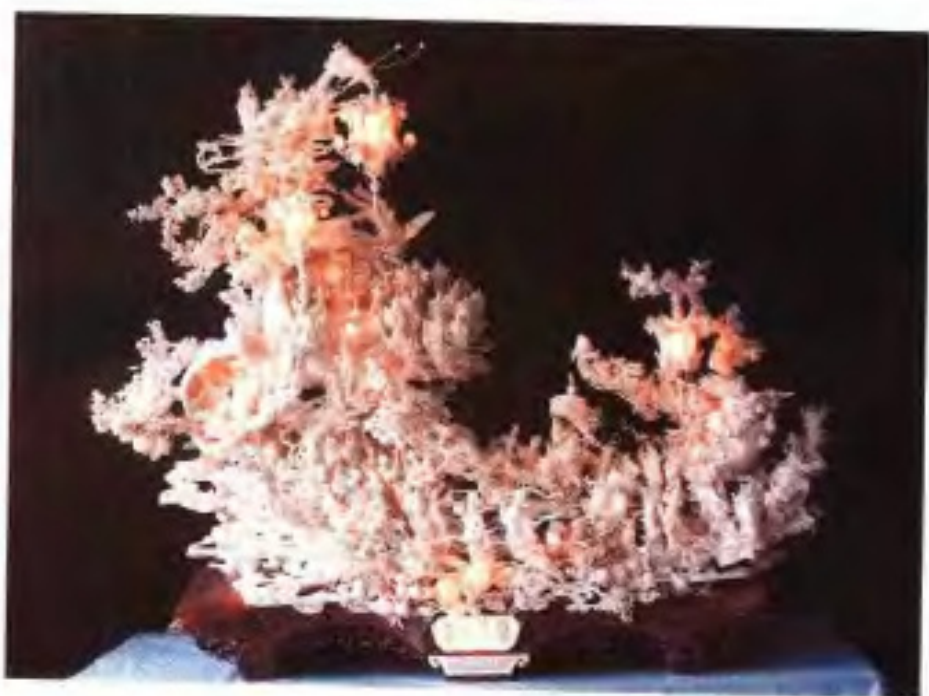
巨型牙雕《群仙祝寿》