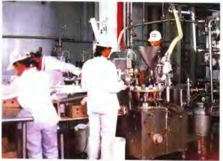
广美食品有限公司生产车间