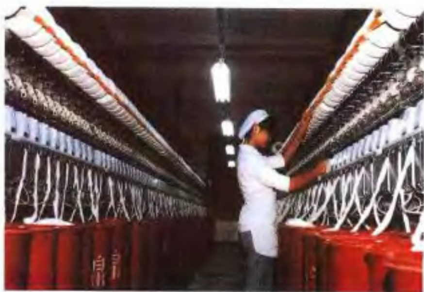
广州绢麻厂棉麻车间