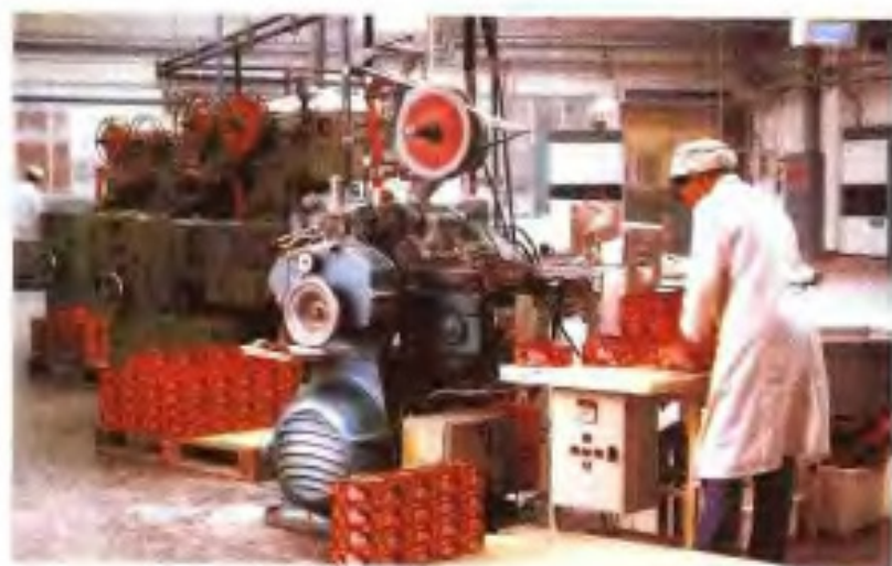
番禺糖果有限公司泡泡糖生产线