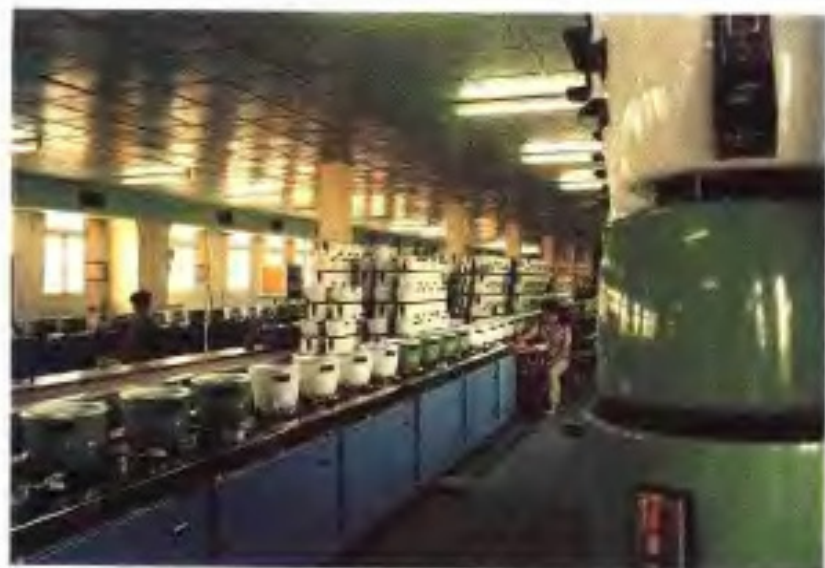
广州电饭煲厂生产线