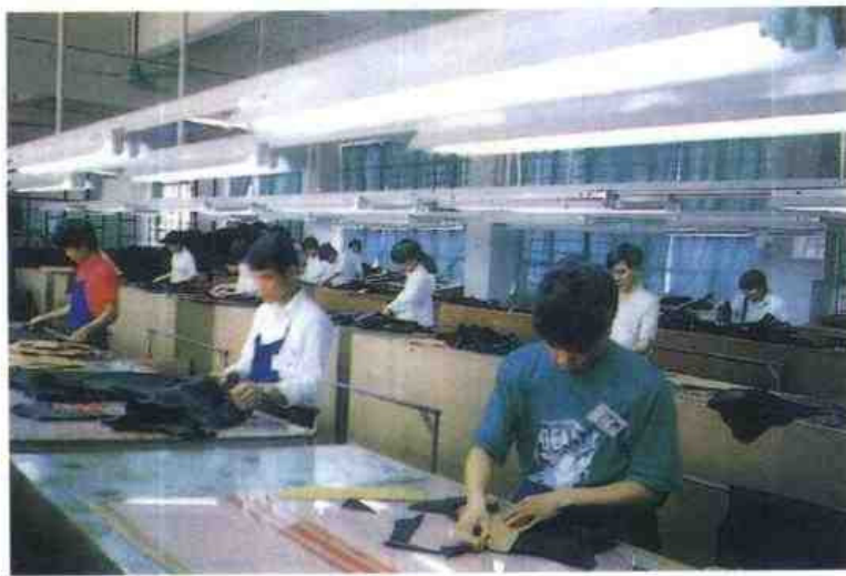
南华皮革制品厂生产车间