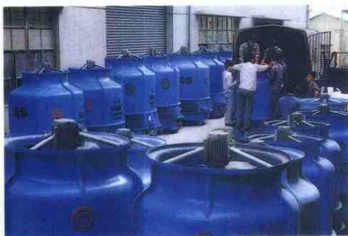
南华塑料厂冷却塔产品