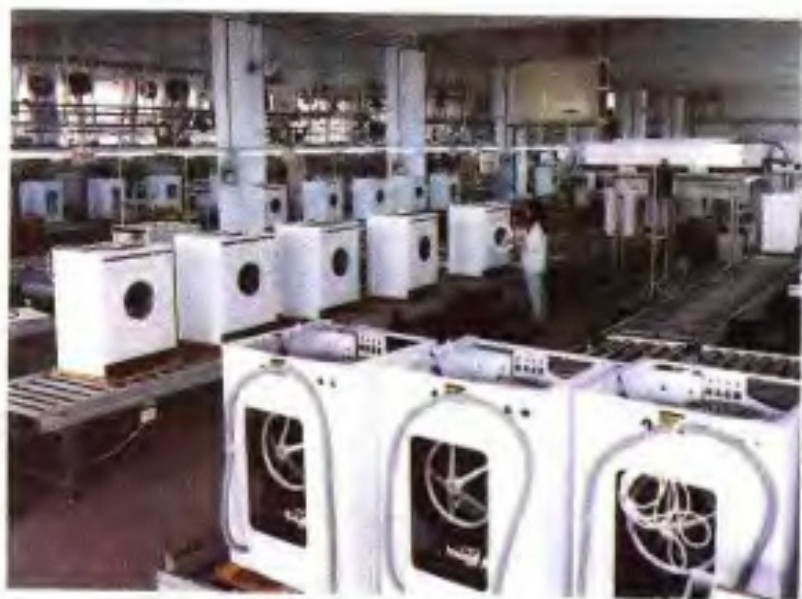
万宝电器集团公司洗衣机生产线