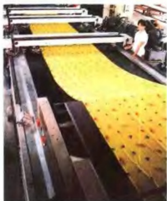
广州针织厂染整车间