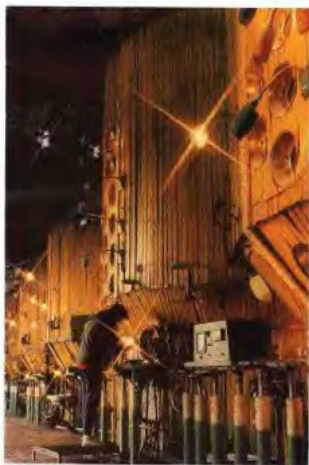
广州市华侨糖厂生产车间