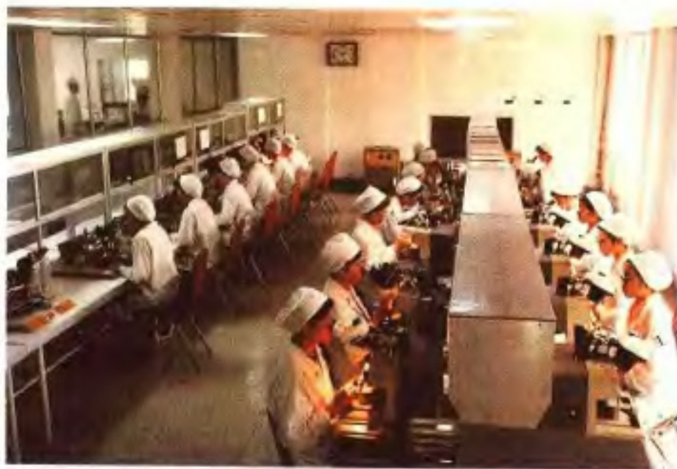
广州半导体器件厂装配线