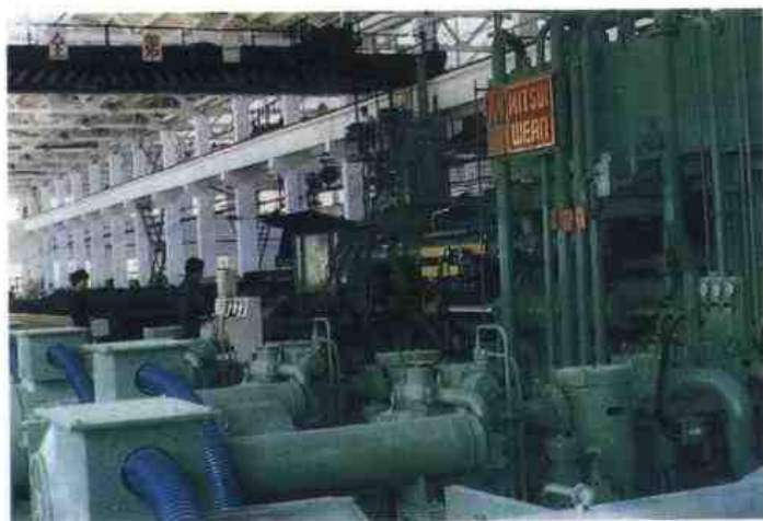
广州黄埔铜管材有限公司生产车间