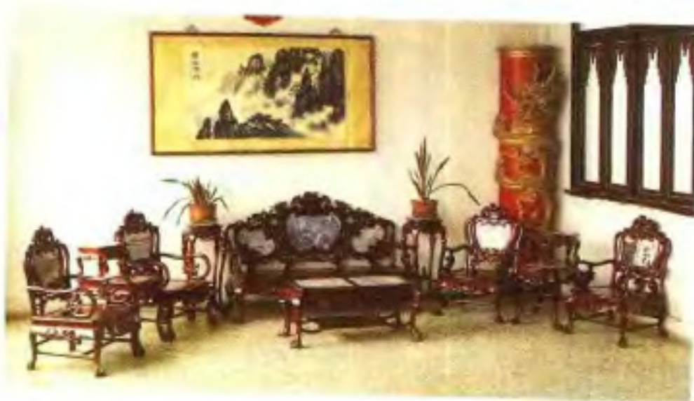
红木雕家具《古鼎十头床》