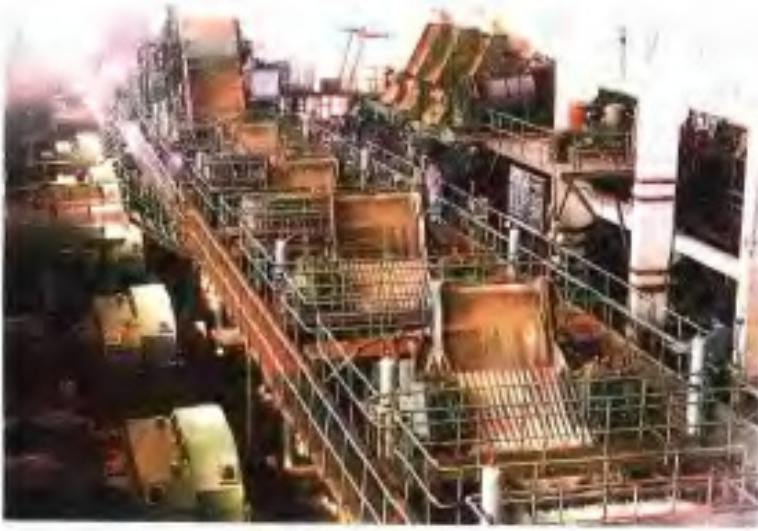
市头甘蔗化工厂生产车间