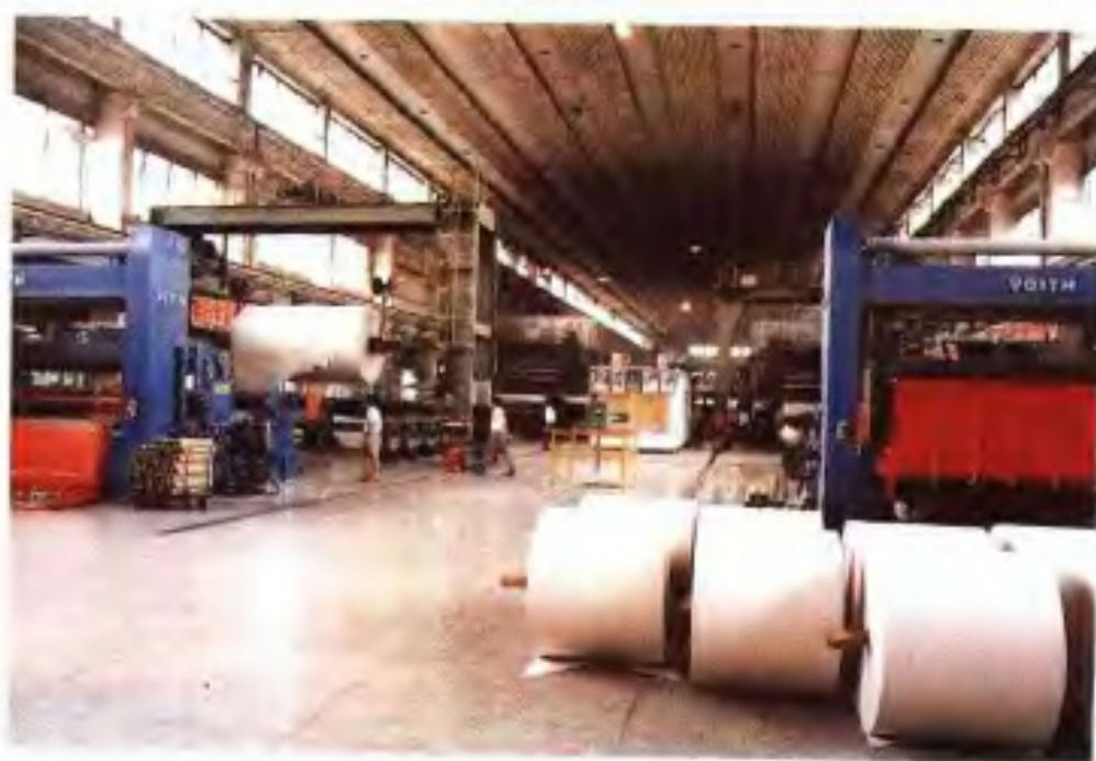
广州造纸厂抄纸车间