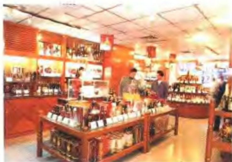
南方大厦酒类商场 (1994年)