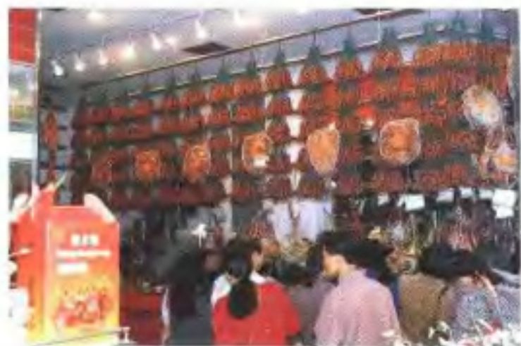
皇上皇腊味店 (皇上皇腊味店供稿)