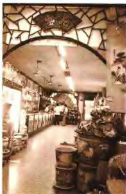
江南土特产商店