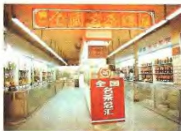
广州全国名茶总汇 (市供销社供稿)