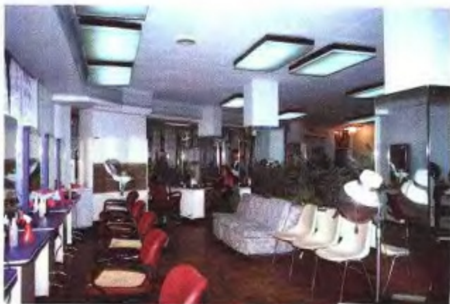
模范国际美容厅 (2001年)