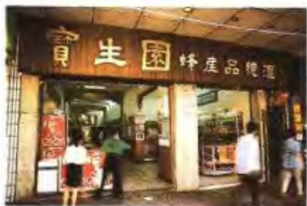
宝生园蜂产品总汇 (市供销社供稿)