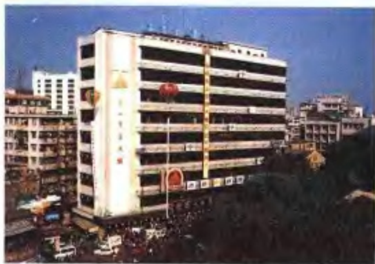
东山百货大楼 (1993年 东山百货大楼供稿)