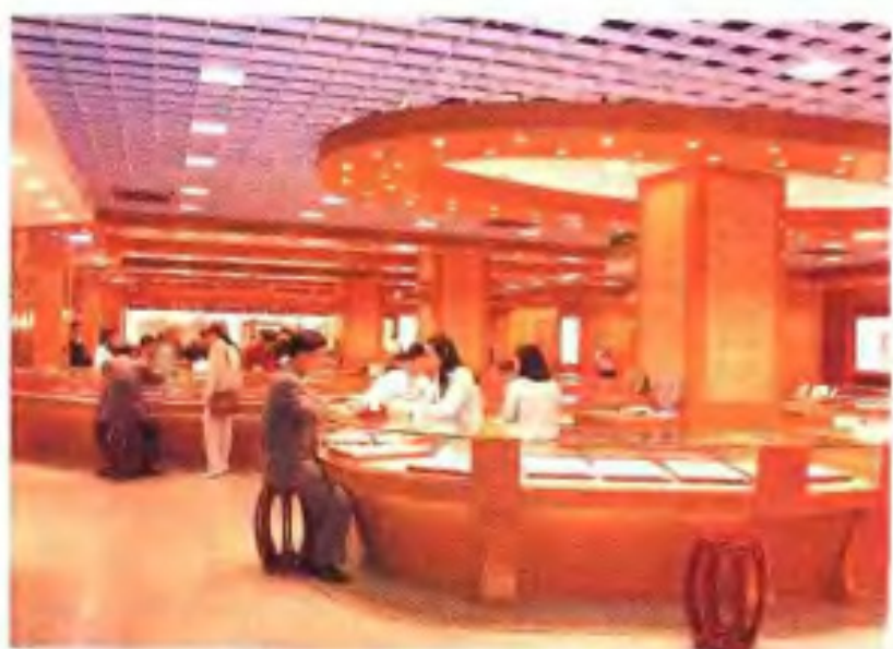
南方大厦旅游商场 (1994年)