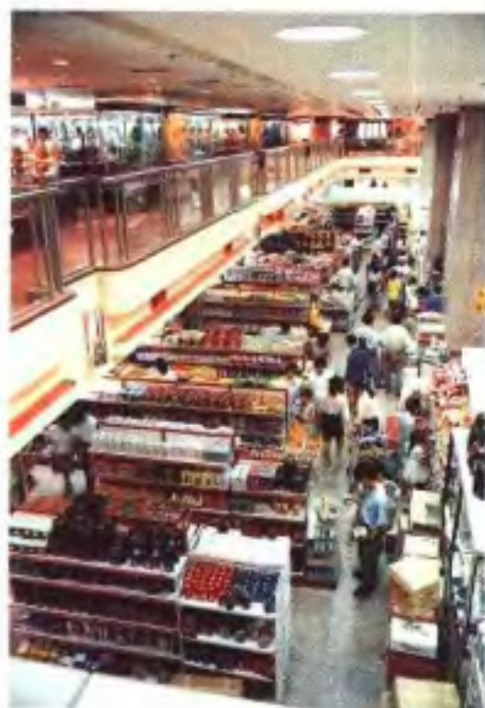
广州百货大厦自选商场 (1995年)