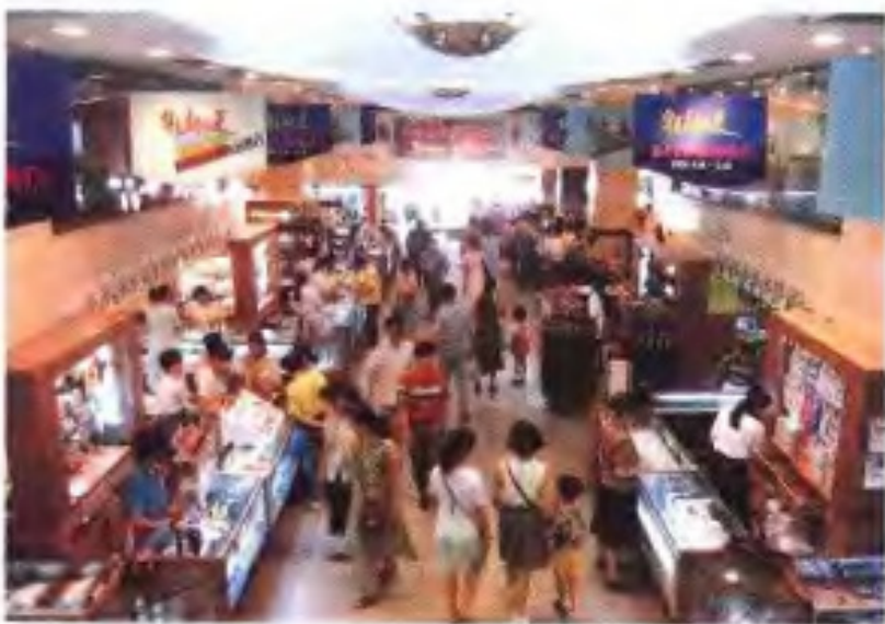
华夏公司商场 (1994年 华夏公司供稿)