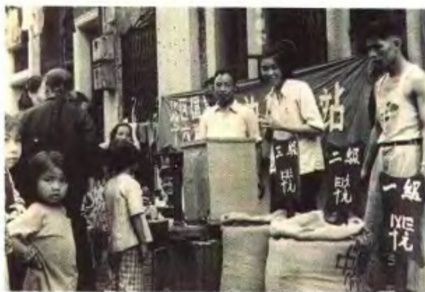
国营粮店上街设点售粮