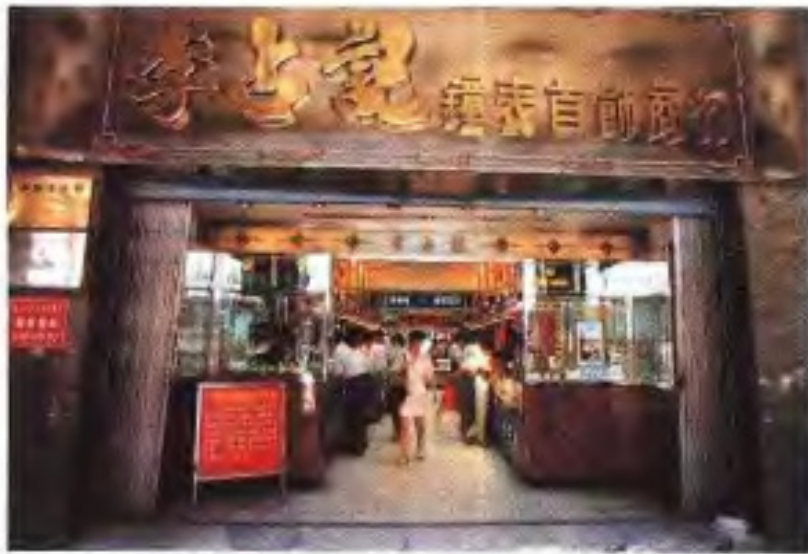
李古记钟表首饰商行 (1996年)