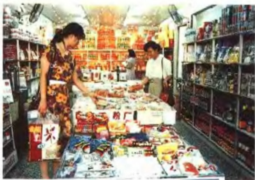
90年代的粮油食品店