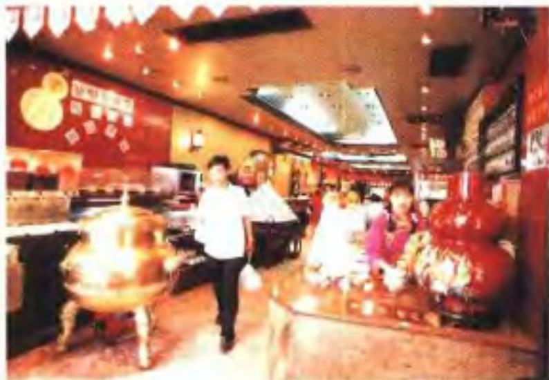
养生堂凉茶甜品馆 (1996年)