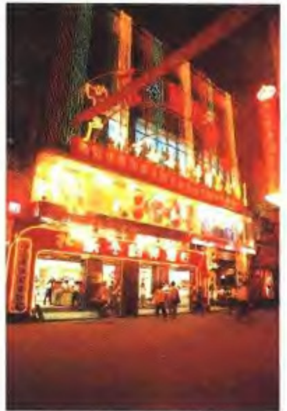
扫女儿童百货商店 (1994年 扫儿商店供稿)