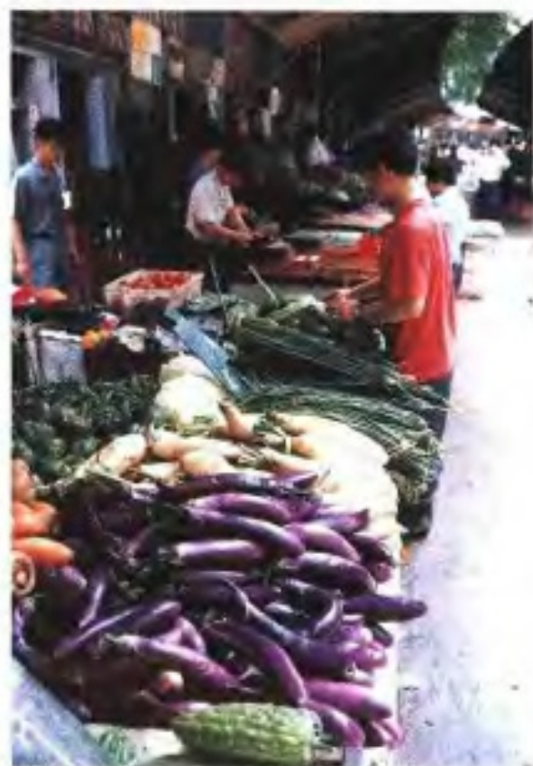
清平路农贸市场 (1996年)