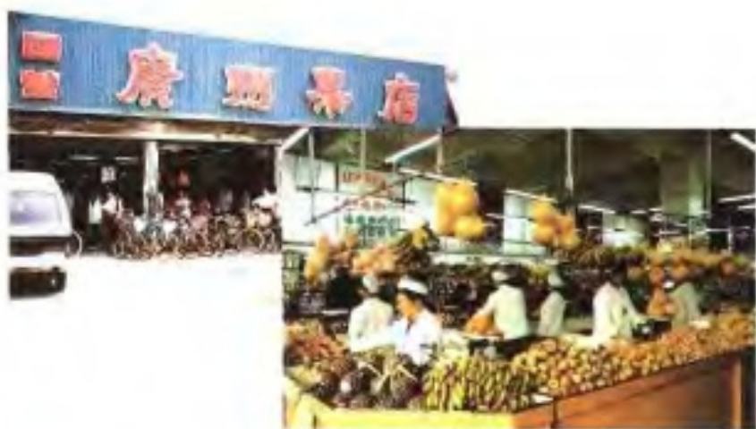
广州果店