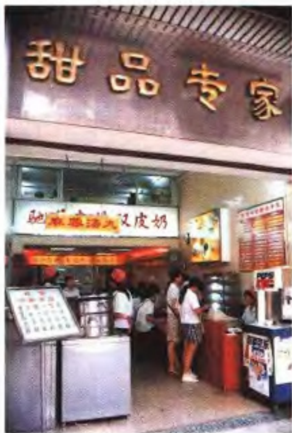
南信牛奶甜品店 (1996年)