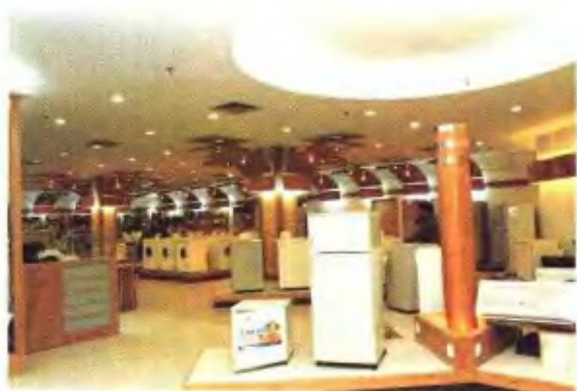
广州友谊商店家电商场