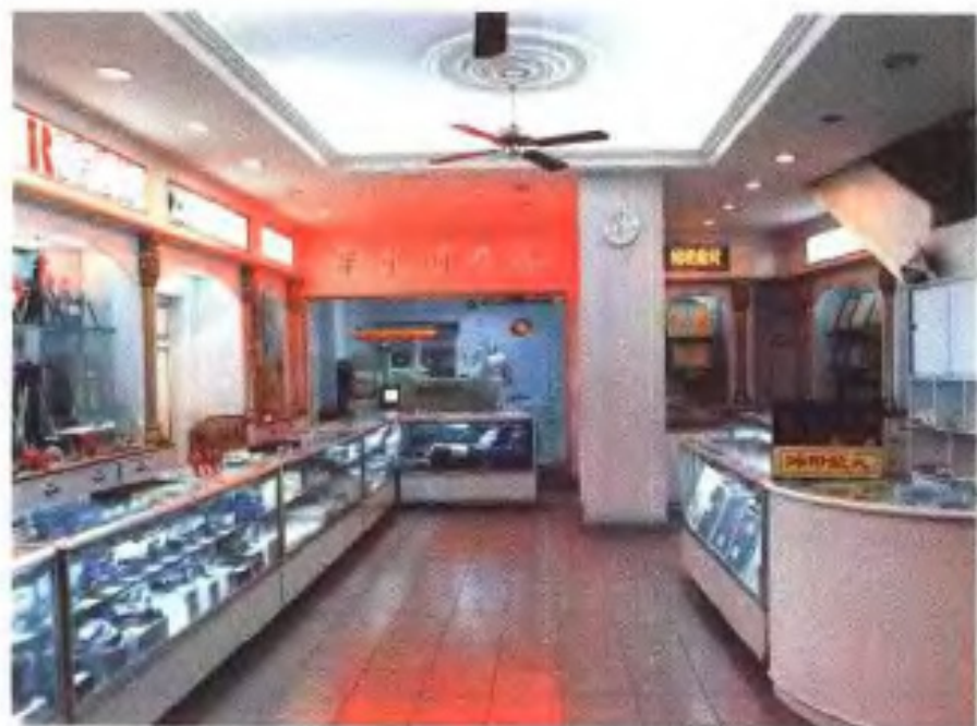
艳芳照相馆门市部 (1992年)