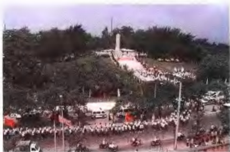
三元里抗英纪念碑