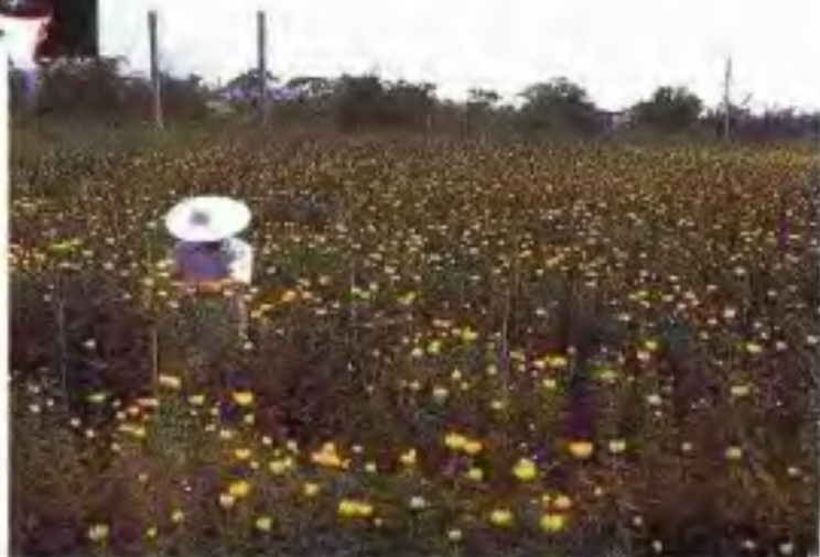
芳村花地个体花场