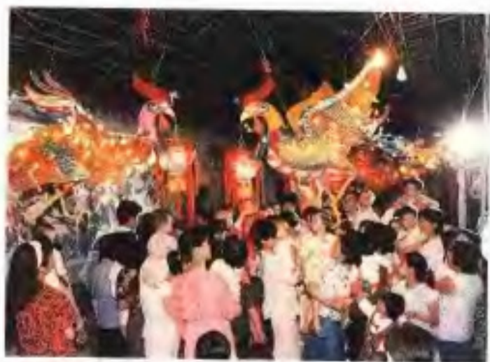
南华西街中秋灯会