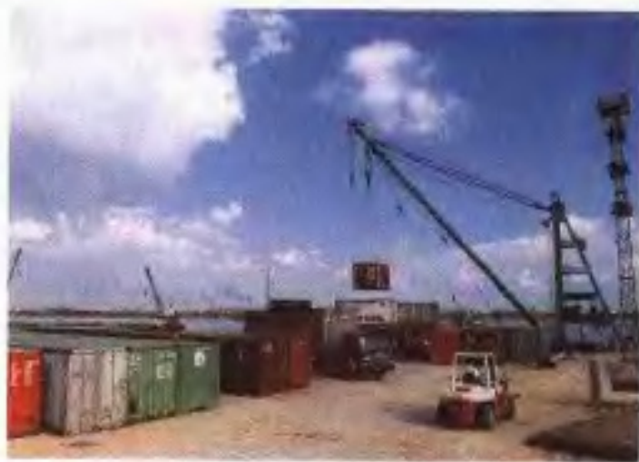
增城新塘港集装箱码头