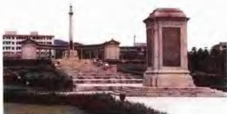
淞沪抗日阵亡烈士陵园