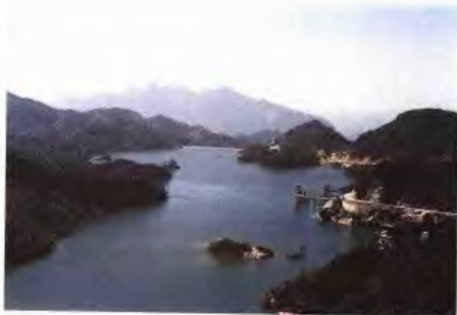
广州抽水蓄能电站上水库