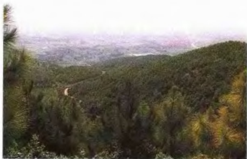
增城逸生丰产林基地