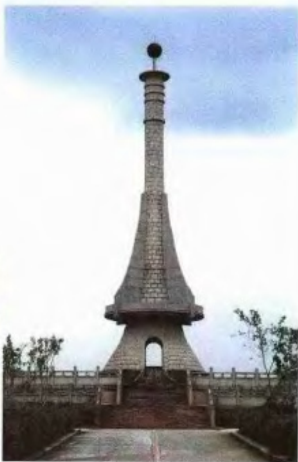
从化太平场北回归线标志