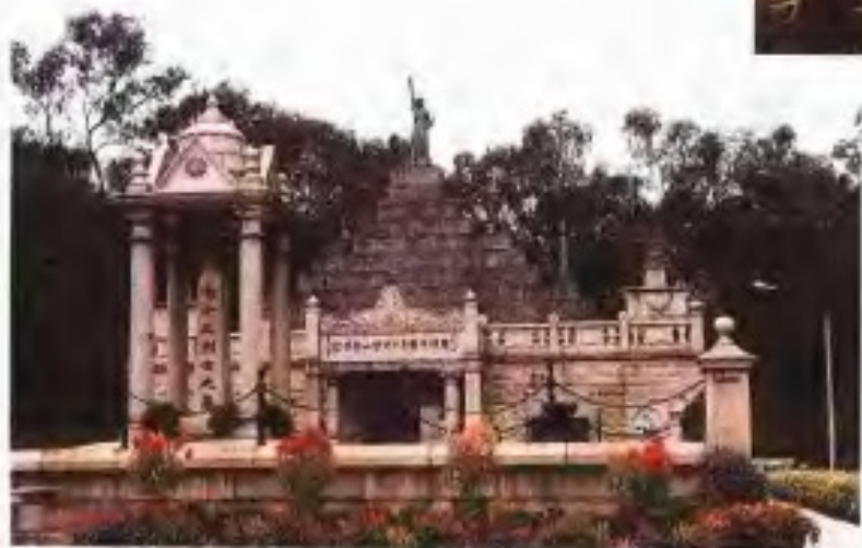
黄花冈七十二烈士墓