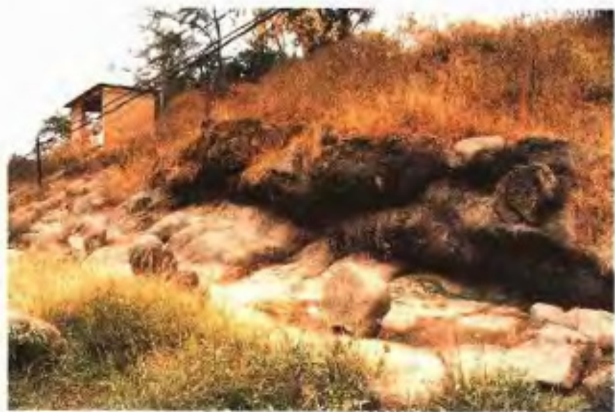
七星崗古海岸遺址