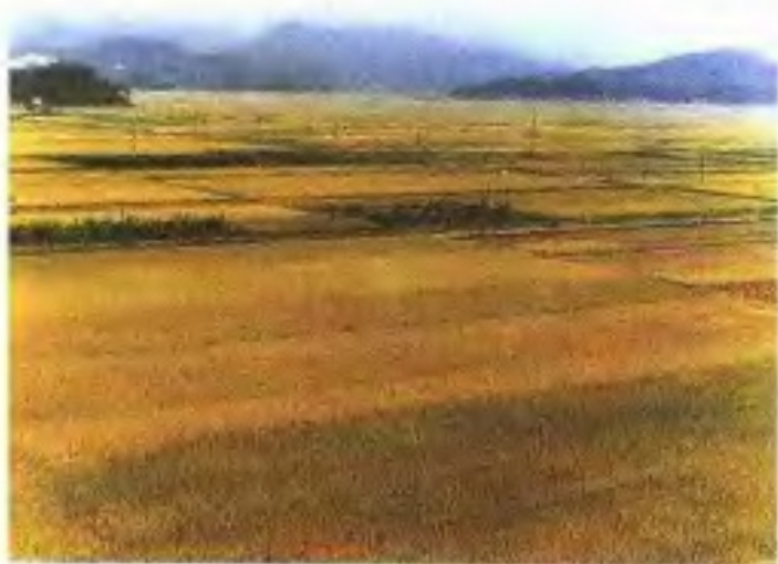
增城三江镇优质米生产基地