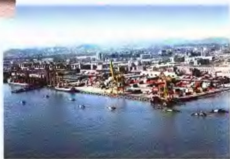
廣州港黃埔老港區