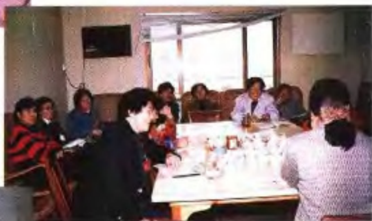
▶1993年自治区政协七届一次会议妇女界委员在进行小组讨论。