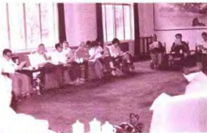
►自治区政协五届五次会设少数民族委员在进行小组讨论。