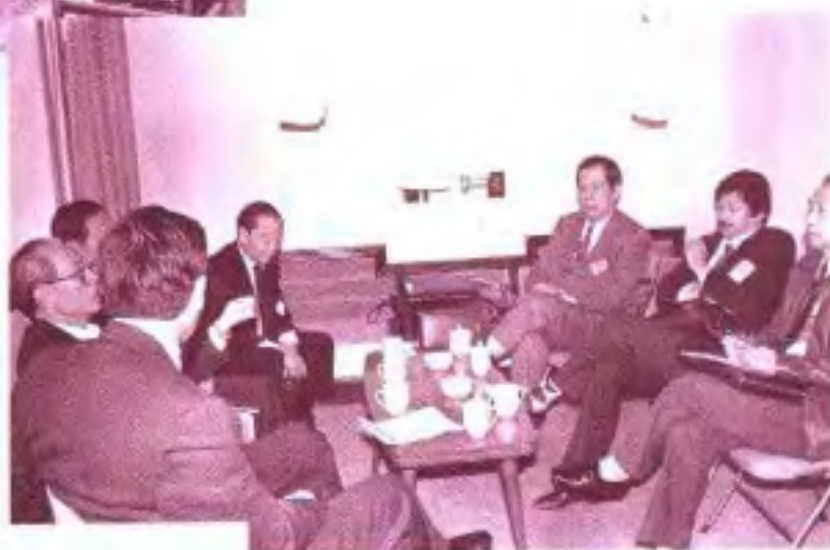
►自治区政协五届五次会设香港委员及贵宾在进行小组讨论。