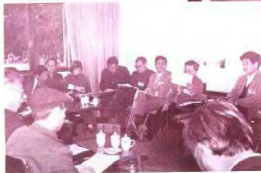
◀自治区政协五届五次会设特邀委员在进行小组讨论。