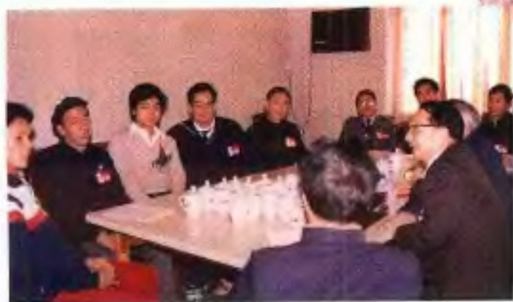
◀1989年自治区政协六届二次会议体育、新闻出版界委员在进行小组讨论。