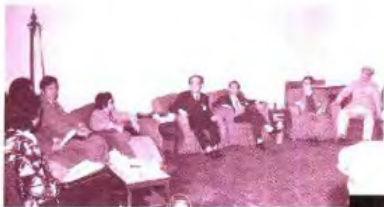
◀1987年自治区政协五届五次农工组委员在进行小组讨论。