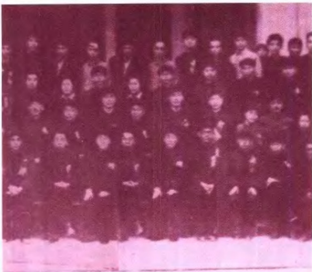
第一屆委員會第一次全體會議

◀1955年中國人民政治協商會議廣西省第一屆委員會第一次全體會議出席列席人員合影(局部)。