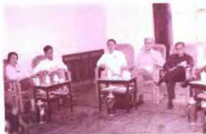
◀ 1987年自治区政协五届五次会议民建组委员在进行小组讨论。