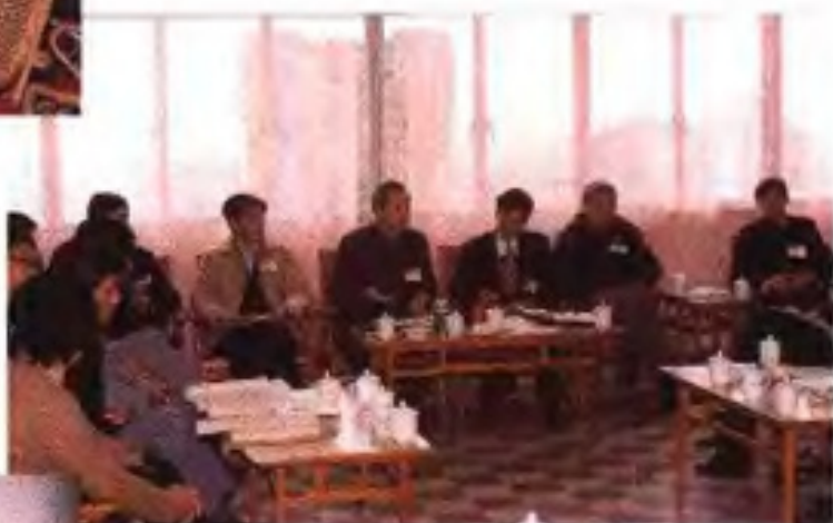
▶1989年自治区政协六届二次会议科技界委员在进行小组讨论。