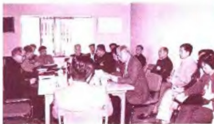
◀ 1987年自治区政协五届五次会议民建、工商联组委员在进行小组讨论。