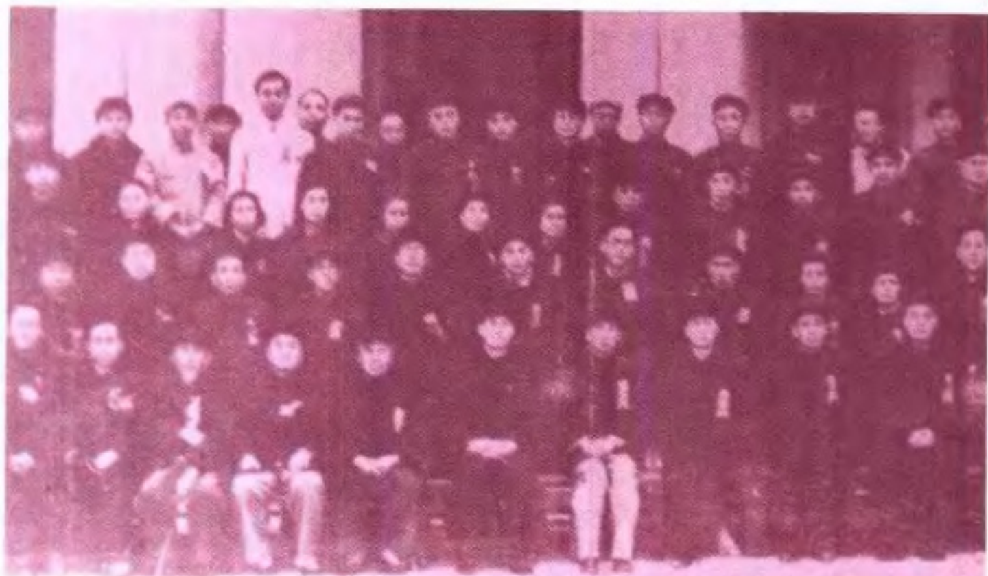
中國人民政治協商會議廣西省第一