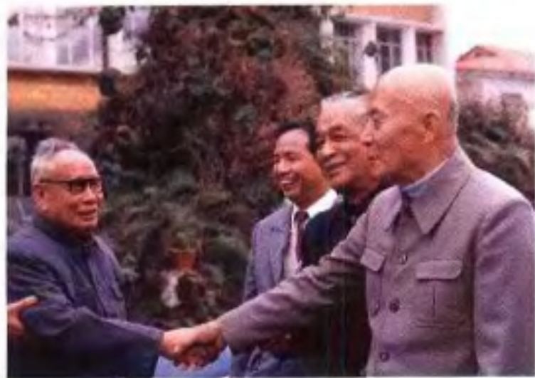
◀全国政协副主席吕正操(右前一)1987年1月来广西视察时与自治区政协常委、工商联副主席左镜明亲切握手。