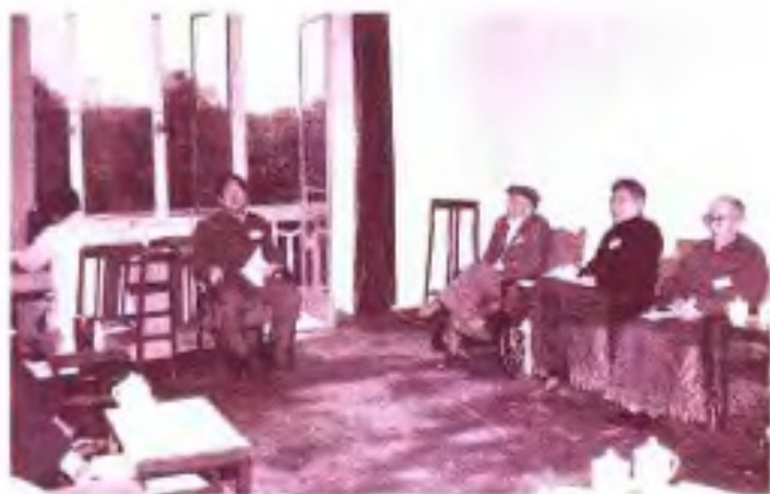
◀ 1987年自治区政协五届五次会议民革组委员在进行小组讨论。