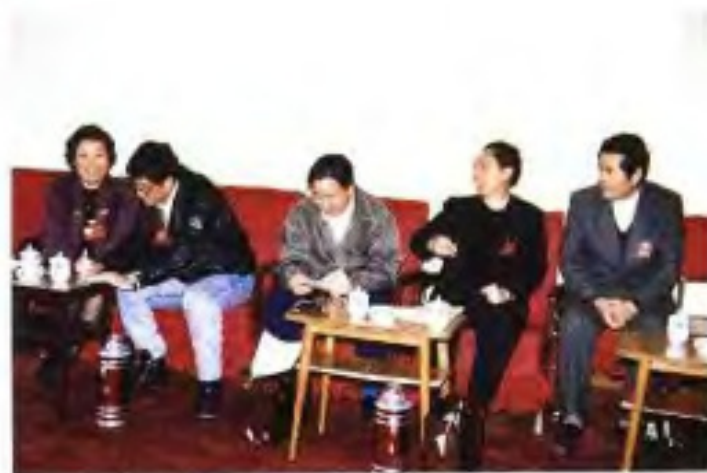
▶ 1993年自治区政协七届一次会议无党派组委员在进行小组讨论。