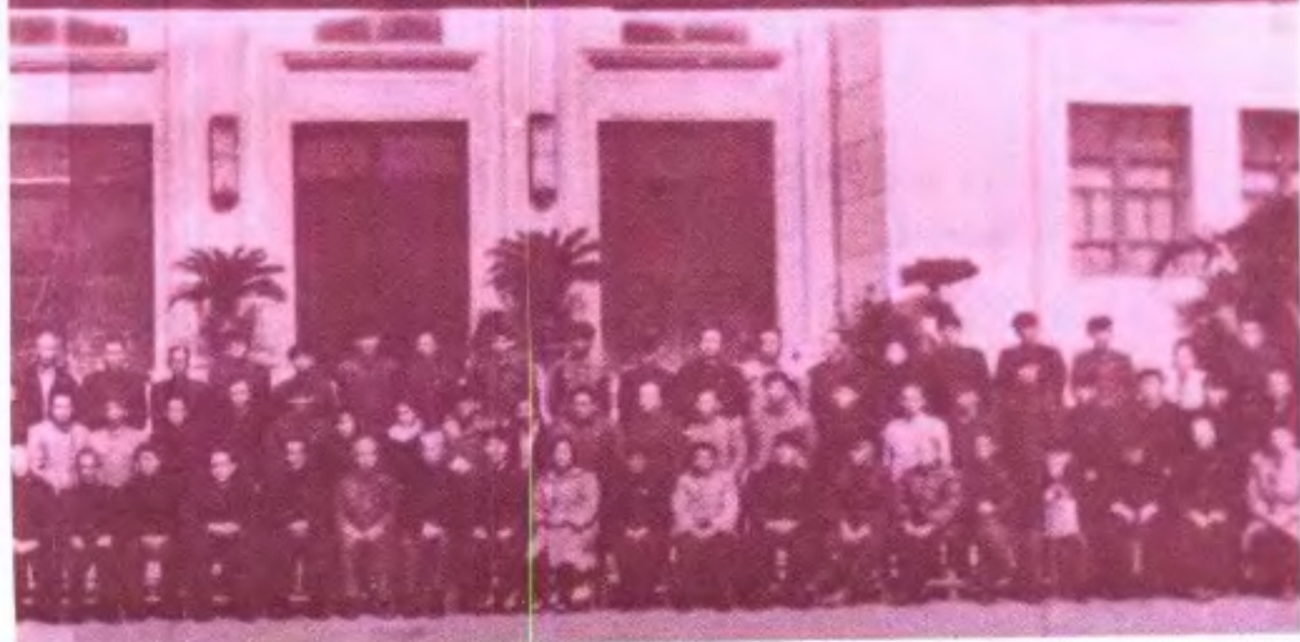
第二屆委員會第一次全體會議

◀1955年中國人民政治協商會議廣西省第一屆委員會第一次全體會議出席列席人員合影(局部)。