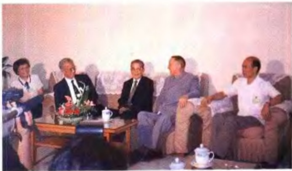
►全国政协副主席洪学智(右二)、程思远(右四)在1991年8月纪念李宗仁先生100周年诞辰活动期间接见李宗仁儿子李幼郁先生(右三)。