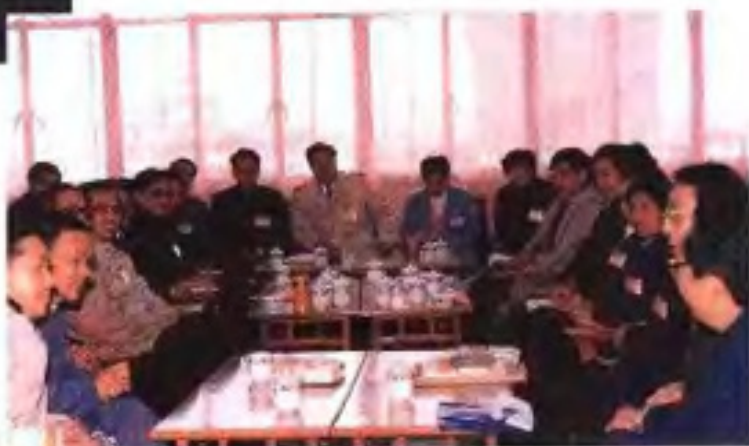
▶1989年自治区政协六届二次会议教育界委员在进行小组讨论。