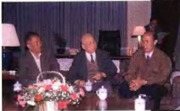
▶ 全国政协副主席钱伟长(前左二)1993年4月到广西视察时与自治区政协主席苏辉光(前左三)等合影。