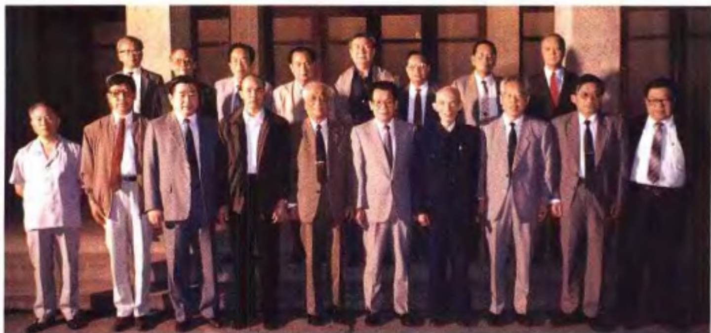
▲中共中央政治局常委、全国政协主席李瑞环(前右五)1993年4月考察广西时接见自治区党委、政协领导