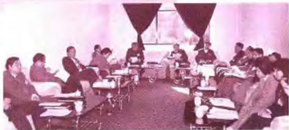
► 1987年自治区政协五届 五次会议中共组委组在进行小 组讨论。