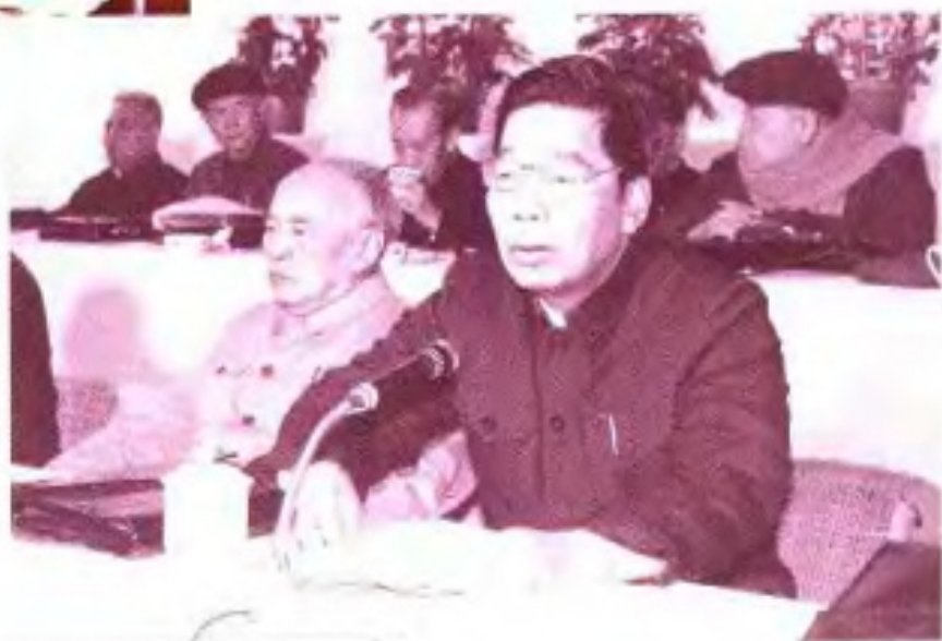
▶中共广西壮族自治区委员会副书记、自治区主席韦纯束（前左一）1985 年 12 月 25 日在自治区政协、民主党派、工商联先代会上讲话。