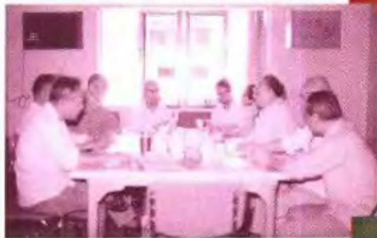
◀1987年自治区政协五届五次次会议九三组委员在进行小组讨论。