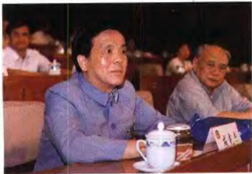
◀广西壮族自治区代主席成克杰（前左一）1990 年 4 月 9 日在自治区政协六届三次会议开幕式上讲话