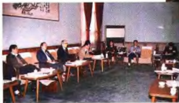
◀1993年自治区政协七届一次会议工商联组委员在进行小组讨论。