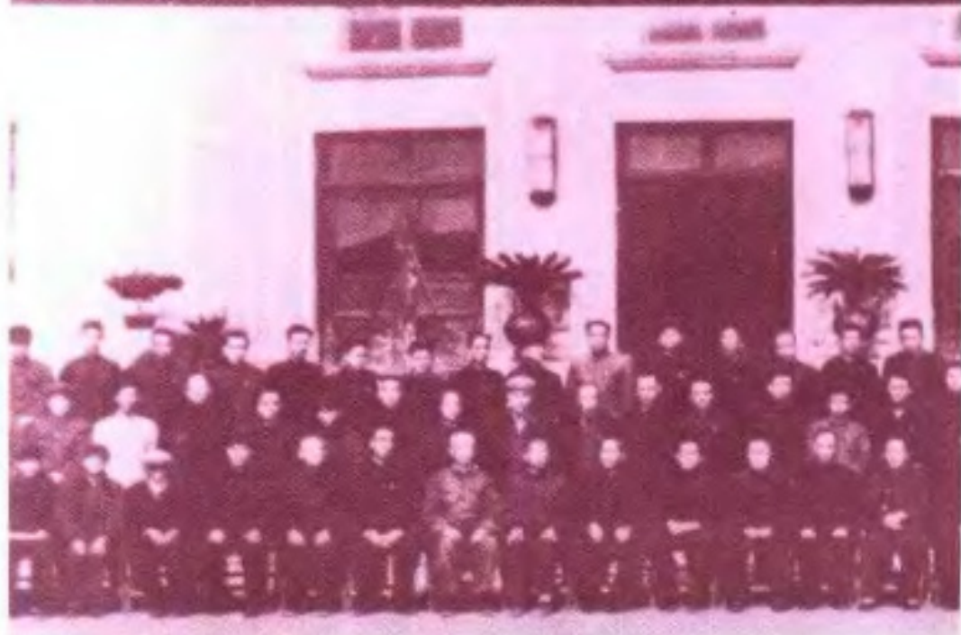
► 1958年中國人民政治協商會議廣西壯族自治區第二屆委員會第一次全體會議出席人員合影(葛郵)。