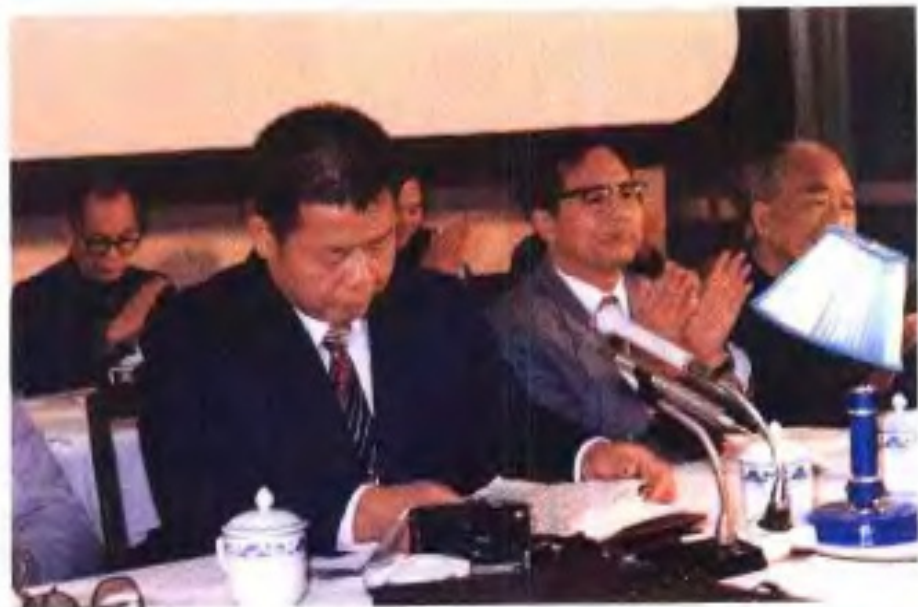
◀自治区党委副书记金世生(带右三)在1986年12月第二次全自治区政协工作会议开幕式上讲话。