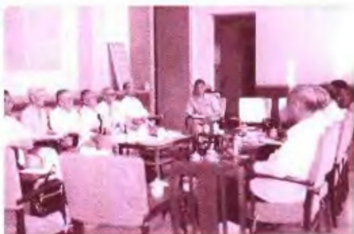
▶ 1987年自治区政协五届五次会议民盟组委员在进行小组讨论。