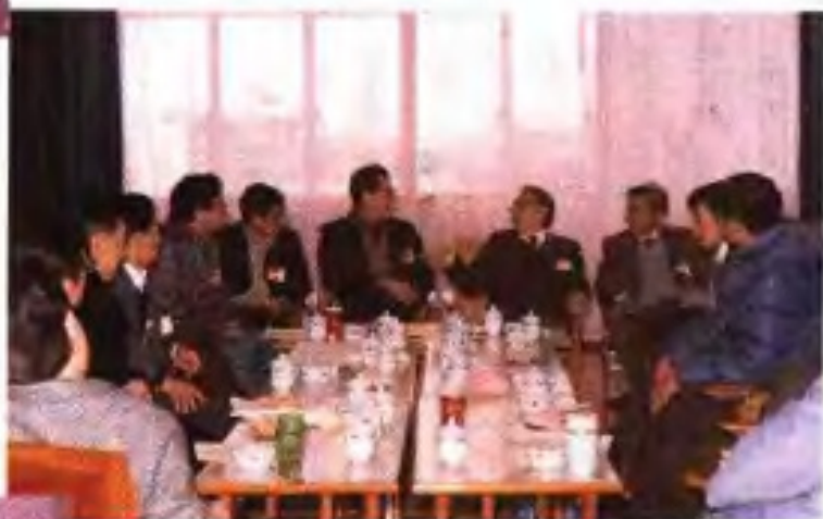
▶1989年自治区政协六届二次会议我公、归侨组委员在进行小组讨论。