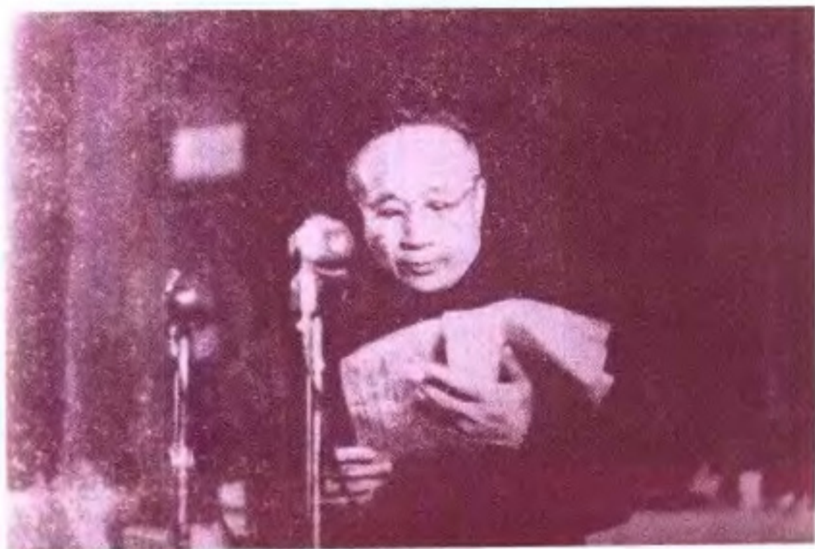
► 广西第一、二届各界人民代表会议协商委员会主席张云逸1950年11月2日在第一届各界人民代表会议上作报告。