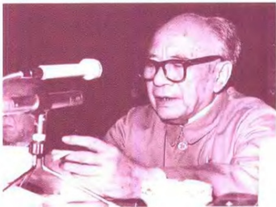
◀政协广西壮族自治区第四届委员会主席覃晓光(前)1979年12月20日在自治区政协四届二次会议上讲话。