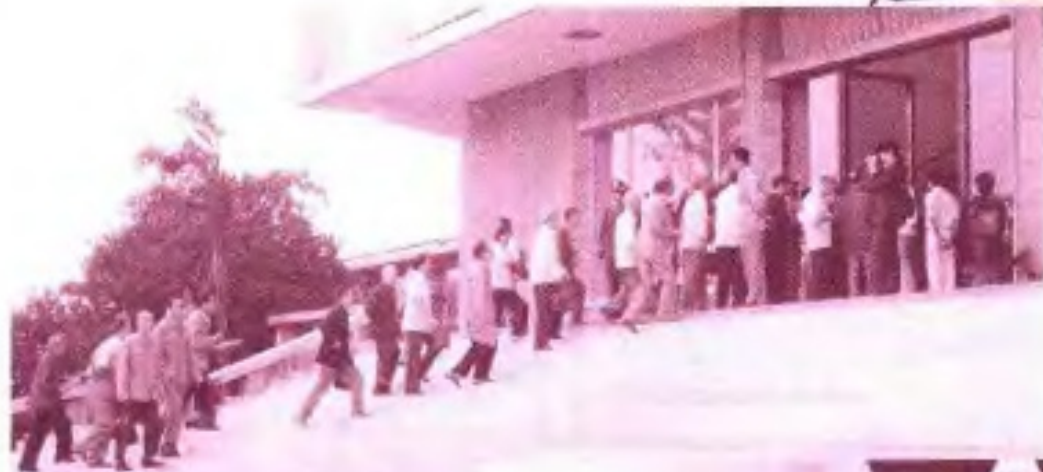
▲自治区政协副主席 董乃文（前右一）在自 治区政协六届二次会议 上讲话。