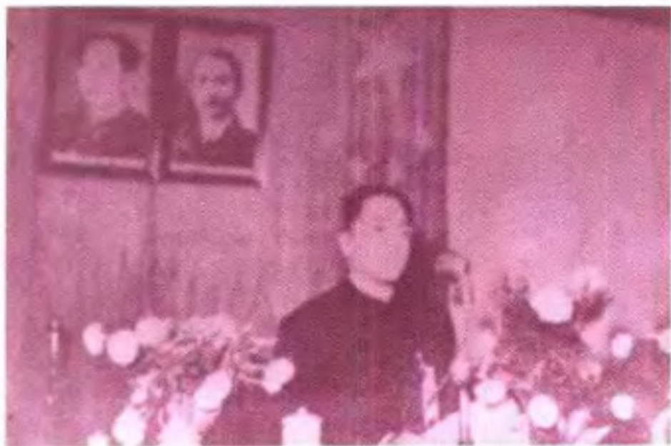
◀广西政协青委员会代主席、政协广西省第一届委员会主席陈雁延 1955 年 2 月 9 日在省政协一届一次会议上讲话。