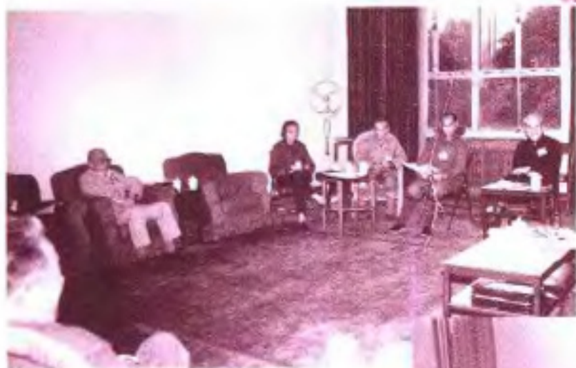
◀自治区政协五届五次会设宗教界委员在进行小组讨论。