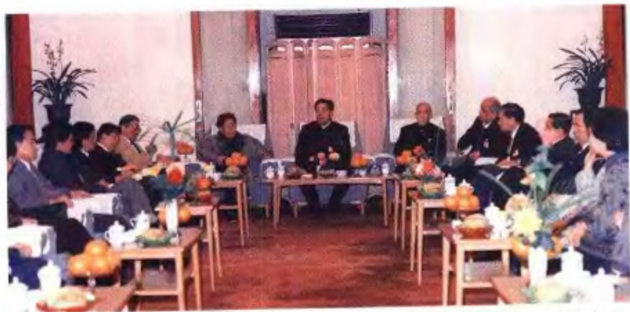
▲1989年1月自治区政协六届二次会议期间，自治区党政和政协领导与出席会议的香港地区政协委员和港澳贵宾举行座谈。