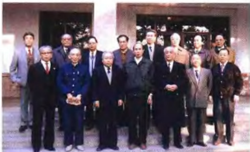
◀ 全国政协正主席杨汝岱(前左三)1994年十月视察广西时与自治区政协主席、副主席、秘书长合影。