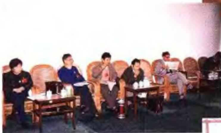
◀1993年自治区政协七届一次会议农林界委员在进行小组讨论。