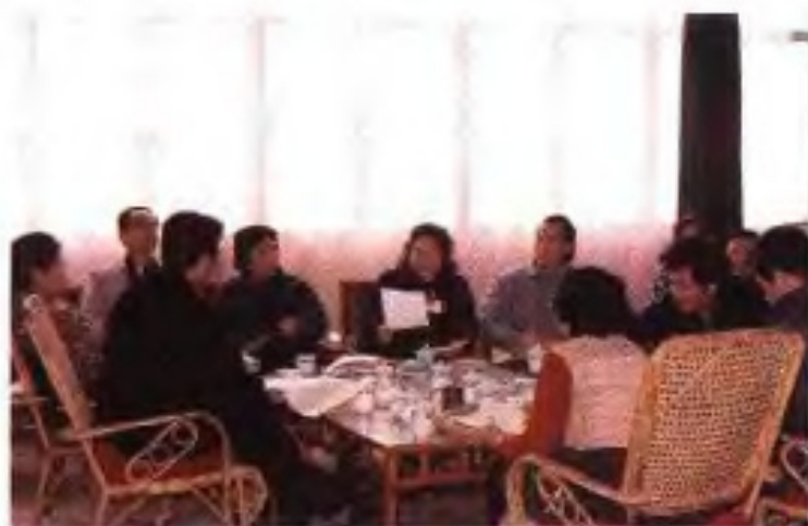
◀1989年自治区六届二次会议文艺界委员在进行小组讨论。