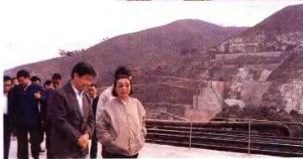
◀ 全国政协副主席钱正英(前右一)1990年2月考察红水河水电工程建设情况。