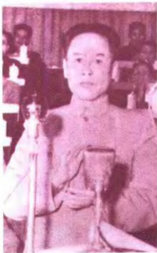
▶政协广西壮族自治区第二、三届委员会主席韦国清 1963 年 12 月 20 日在自治区政协三届一次会议上讲话。