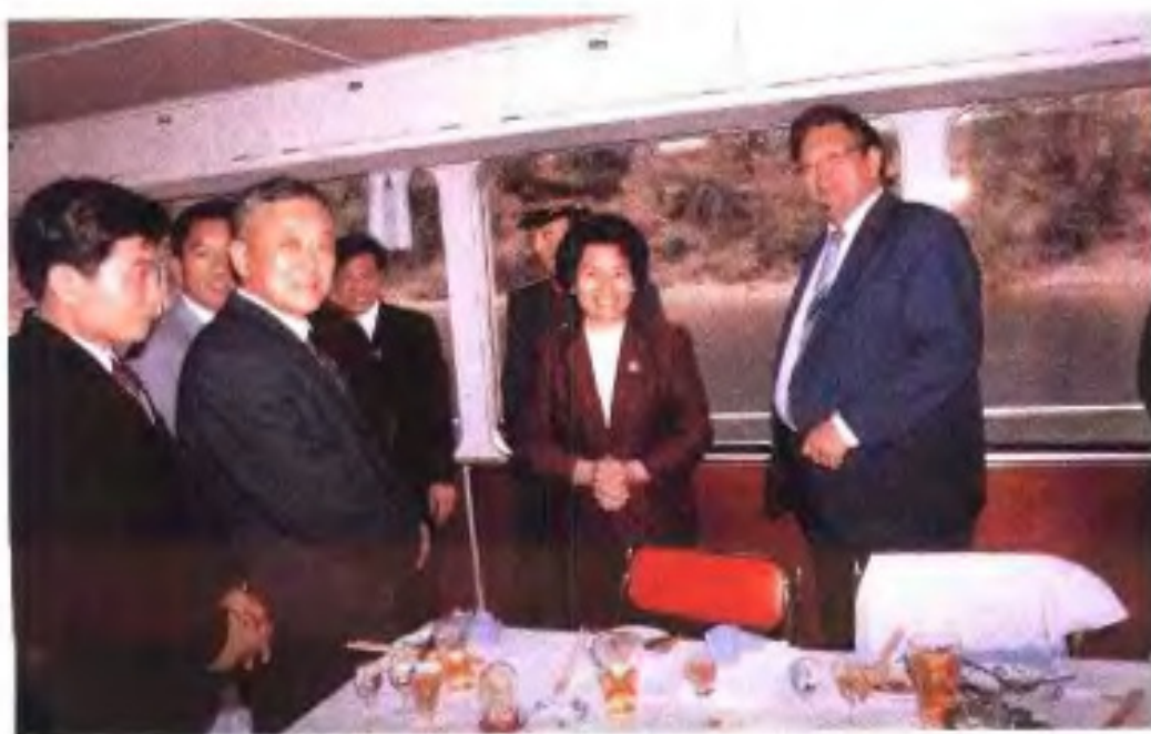
◀1986年3月，新西兰总理戴维·朗伊在桂林访问。