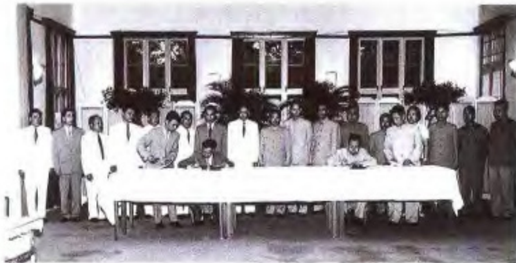
◀1965年6月，越南高平、谅山两省地方贸易代表团在南宁与广西代表团签订贸易协定。