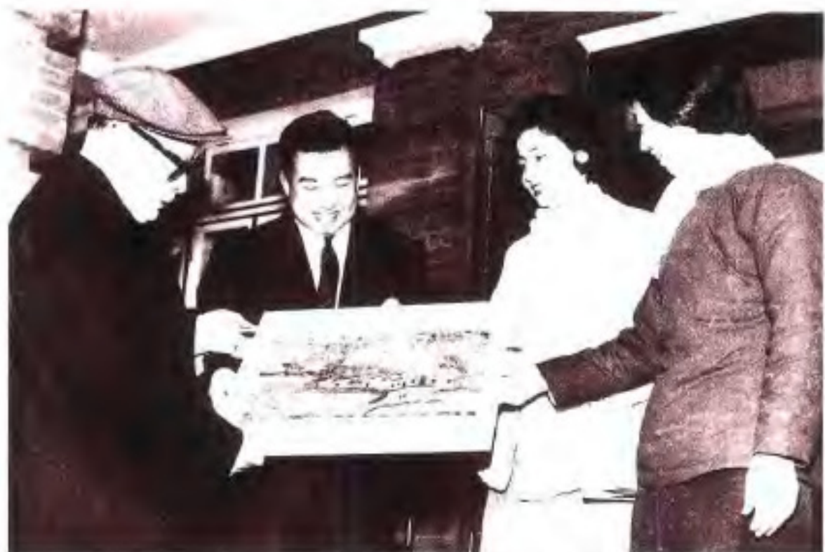
▲1963年2月25日，陈毅副总理陪同柬埔寨国家元首诺罗敦·西哈努克亲王访问南宁。图为西哈努克亲王亲笔绘制的毛泽东韶山故居图交陈毅转递毛泽东主席。