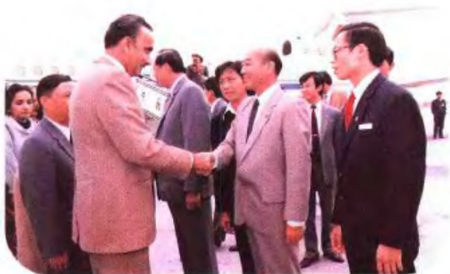
◀1985年11月,巴基斯坦 总理居内久访问桂林。