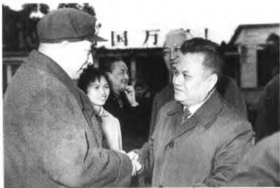
▶1976年3月，老挝人民革命党总书记、老挝人民民主共和国总理凯山·丰威汉访问南宁，受到中共广西壮族自治区委员会第一书记安平生等自治区领导人的欢迎。