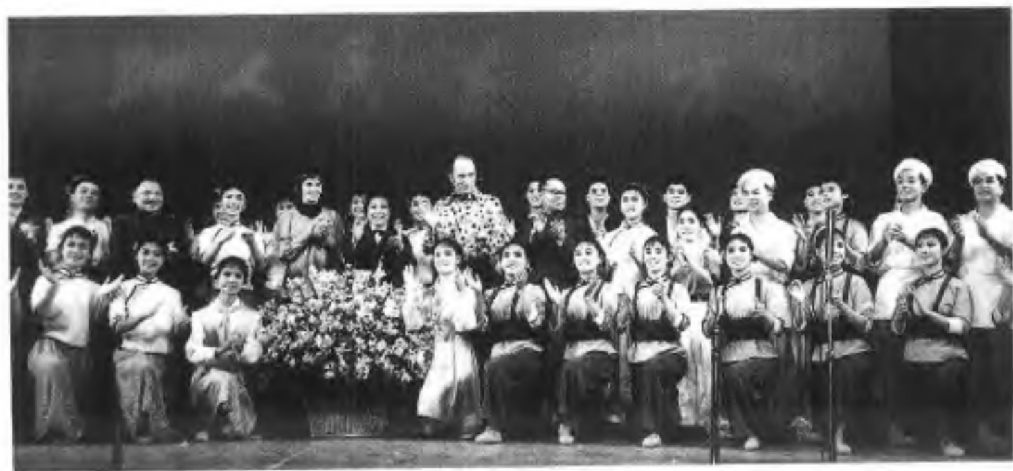
▲1973年10月15日，邓小平副总理陪同加拿大总理皮·埃·特鲁多访问桂林并出席晚会。