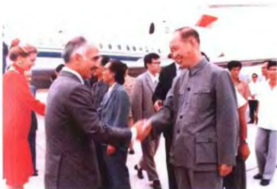
▶1983年9月，约旦国王侯赛因访问桂林。