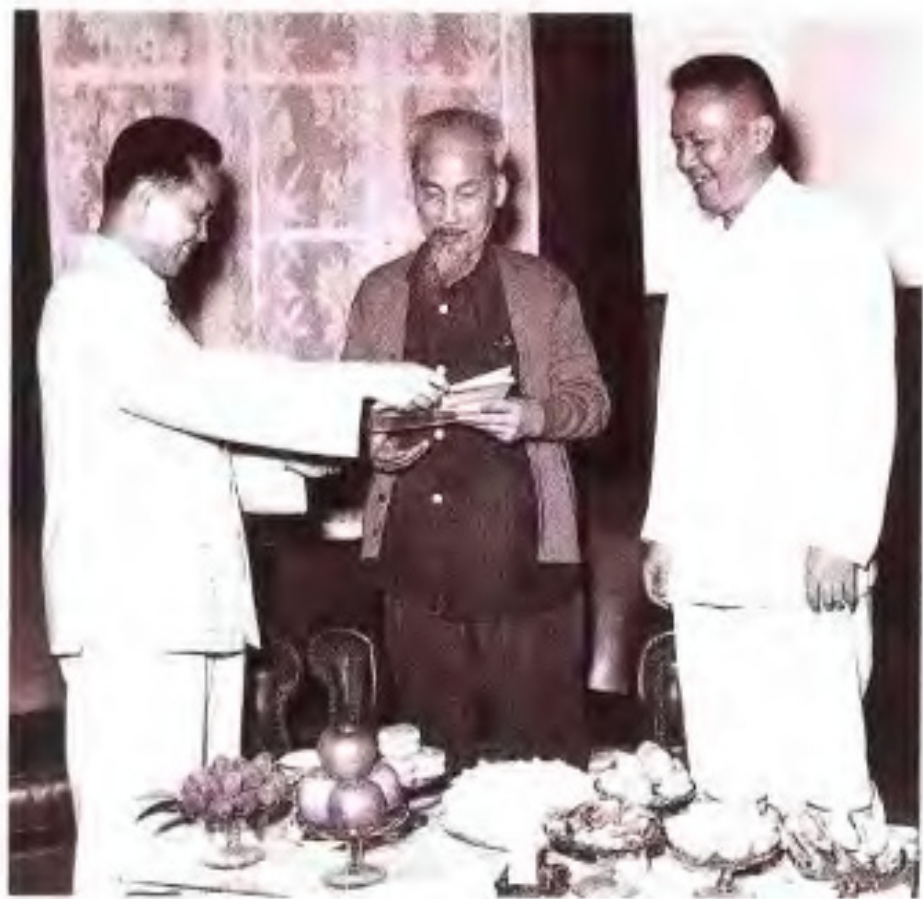
◀1960年5月17日，广西壮族自治区主席韦国清向在南宁的越南国家主席胡志明转交中国党和国家领导人毛泽东、朱德、刘少奇、周恩来给他的贺电，祝贺他70寿辰。