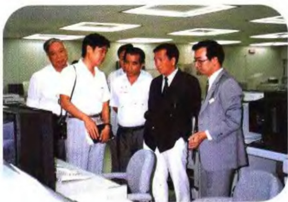
▶1991年6月，广西壮族自治区主席成克杰在日本熊本县参观访问。