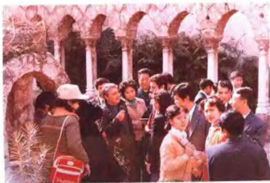
◀ 1983年2月，广西艺术团在意大利西西里访问演出。