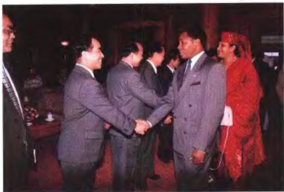
◀ 1997年5月，尼日尔共和国总统易·迈·巴雷访问南宁。