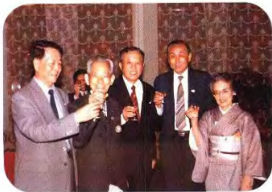
◀熊本市市长星子敏雄在桂林。