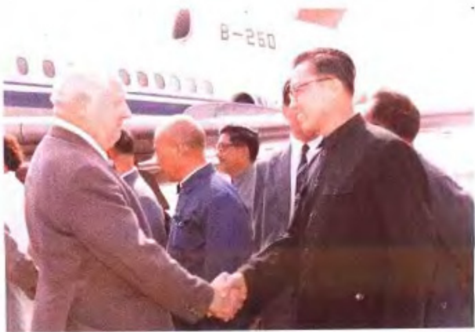
► 1982年10月，挪威议会议长佩尔·黑辛—达尔访问桂林。