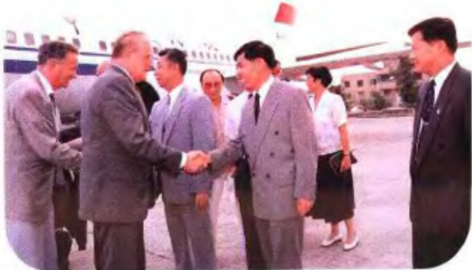
▶1993年美国议员访华 团抵桂林访问。