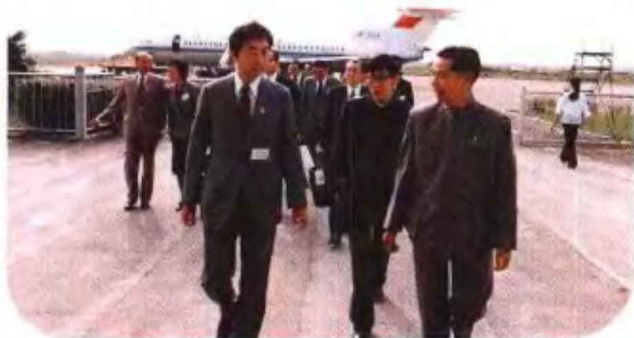
◀1984年10月，熊本县知事细川护熙访问南宁，自治区政府主席韦纯束前往欢迎。