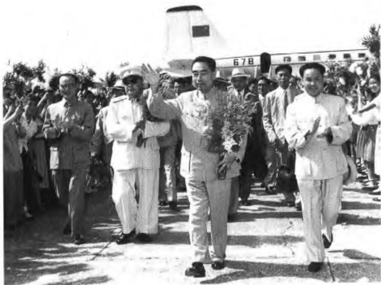
▲1960年5月13日，周恩来总理、陈毅副总理兼外长在访问朝鲜、越南后，回到南宁