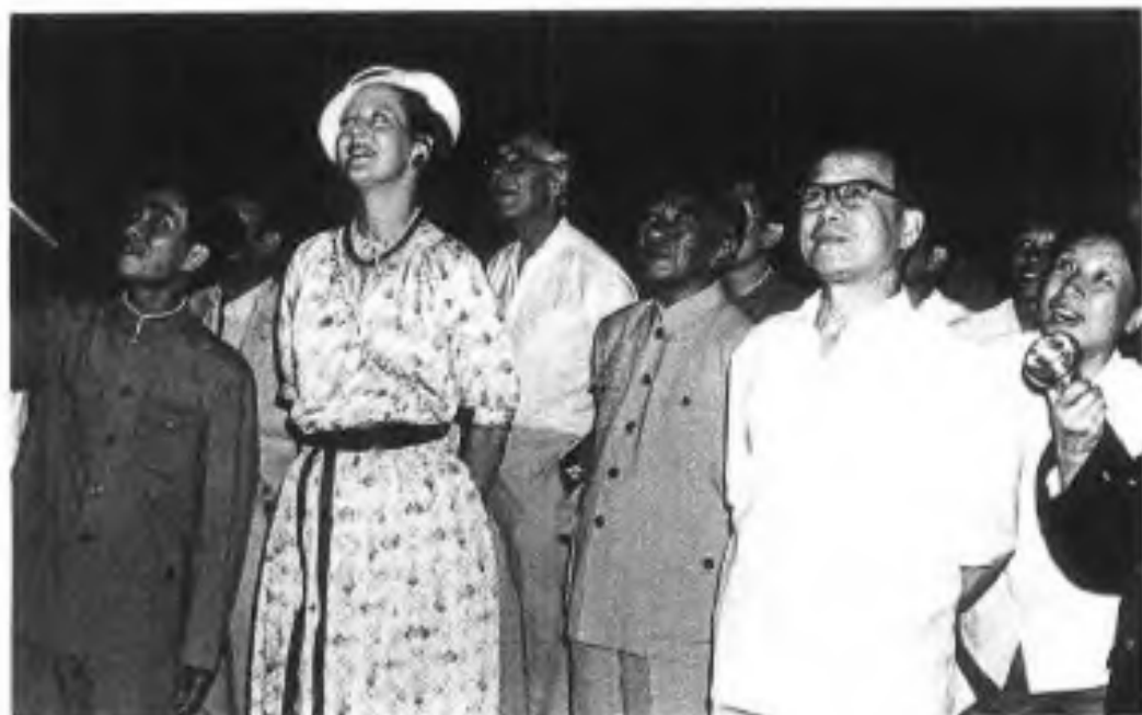
◀1979年9月，丹麦女王玛格丽特由国务院副总理谷牧陪同游览桂林芦笛岩。