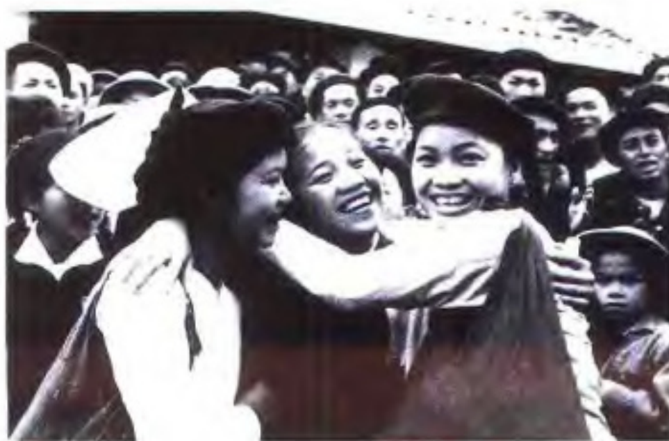
◀1957年1月，中越两国边民举行联欢，共同请愿县个宝水利工程竣工。