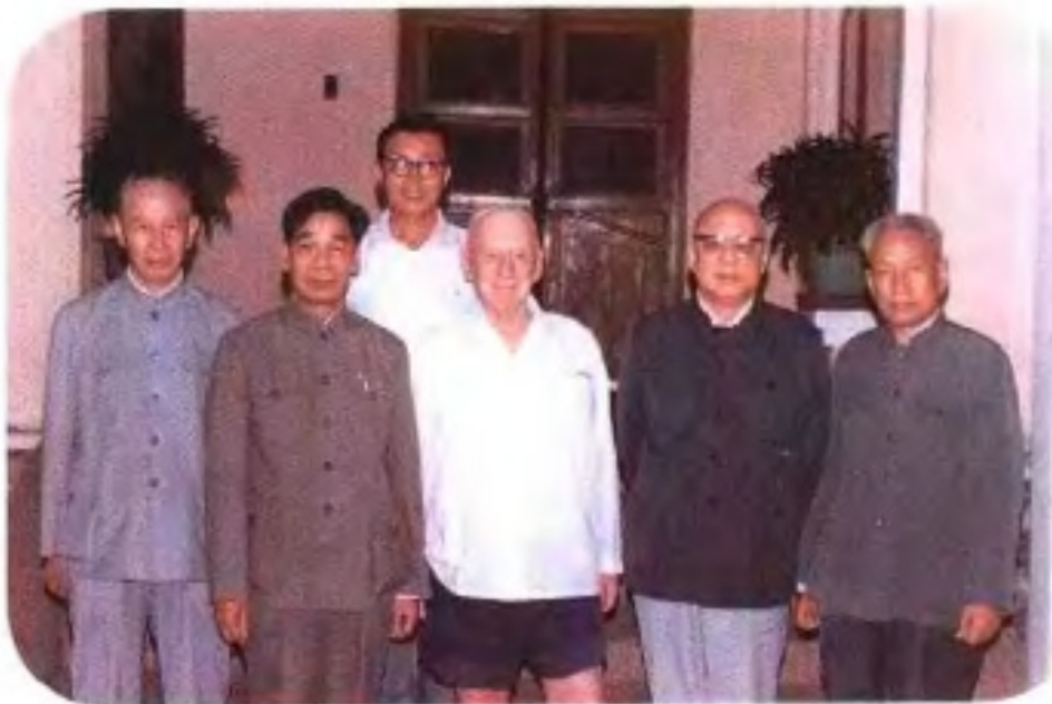
► 1983年10月，著名新西兰友好人士路易·艾黎到北海、钦州、防城、宁明等地考察，受到自治区政府主席韦纯束亲切会见。