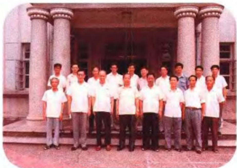
◀1984年6月,钱其琛副外长 出访归来途经南宁,到自治区外事 办公室看望机关工作人员。