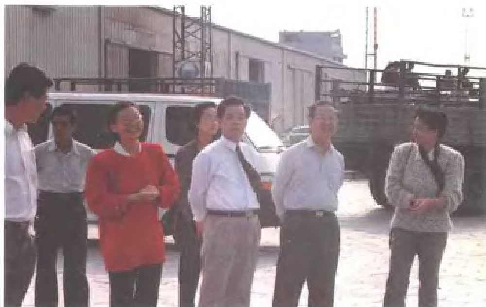
国家统计局局长张塞在北海考察。