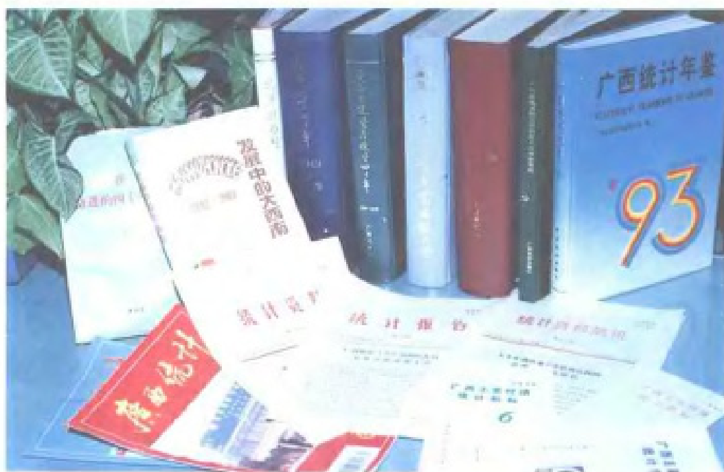
新中国成立后编印的部分统计资料及书刊。