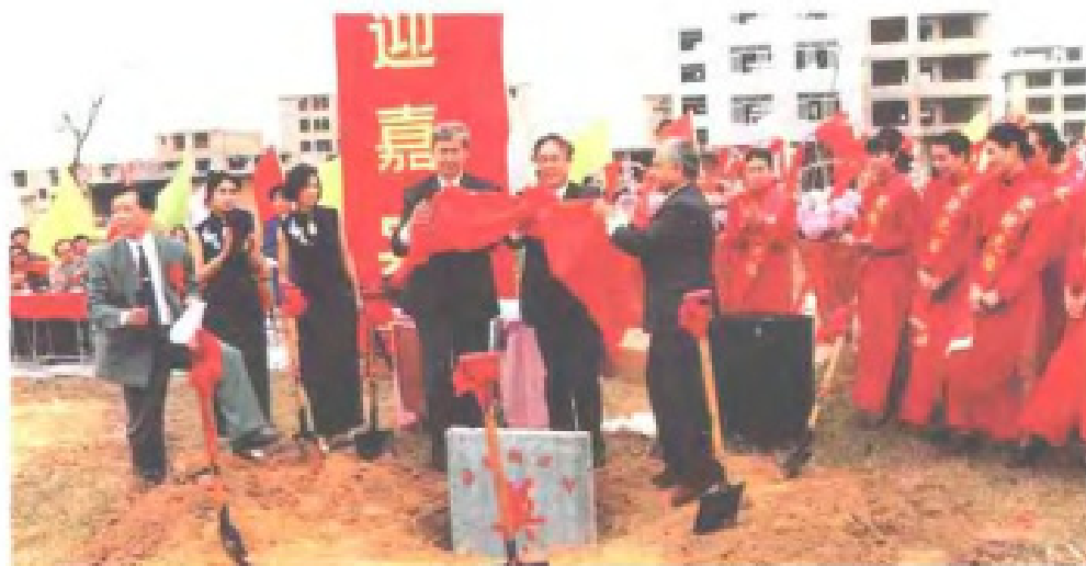
意大利驻华大使夸罗尼出席北海粮农中心奠基。