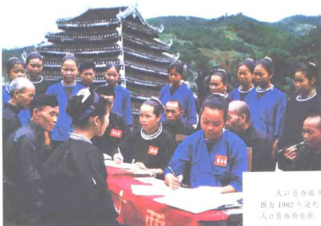
人口普查深入村寨。 图为 1982 年进行第三次 人口普查的情形。