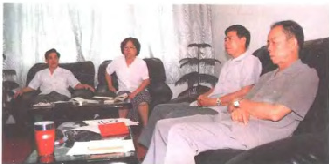
自治区统计局局长会议,研究全区统计事业发展规划。