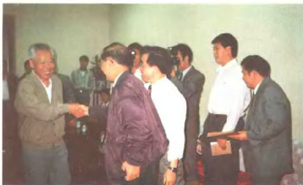
自治区党委书记赵富林会见国家统计局局长张塞。