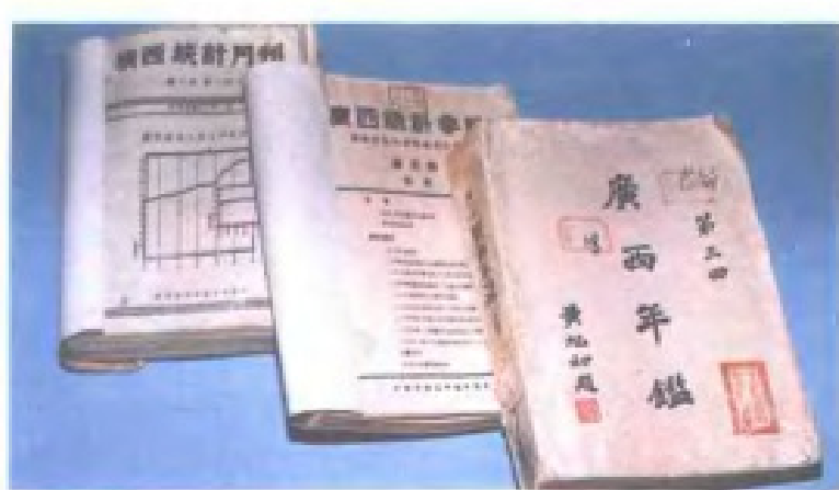
民国时期编印的部分统计资料及书刊。