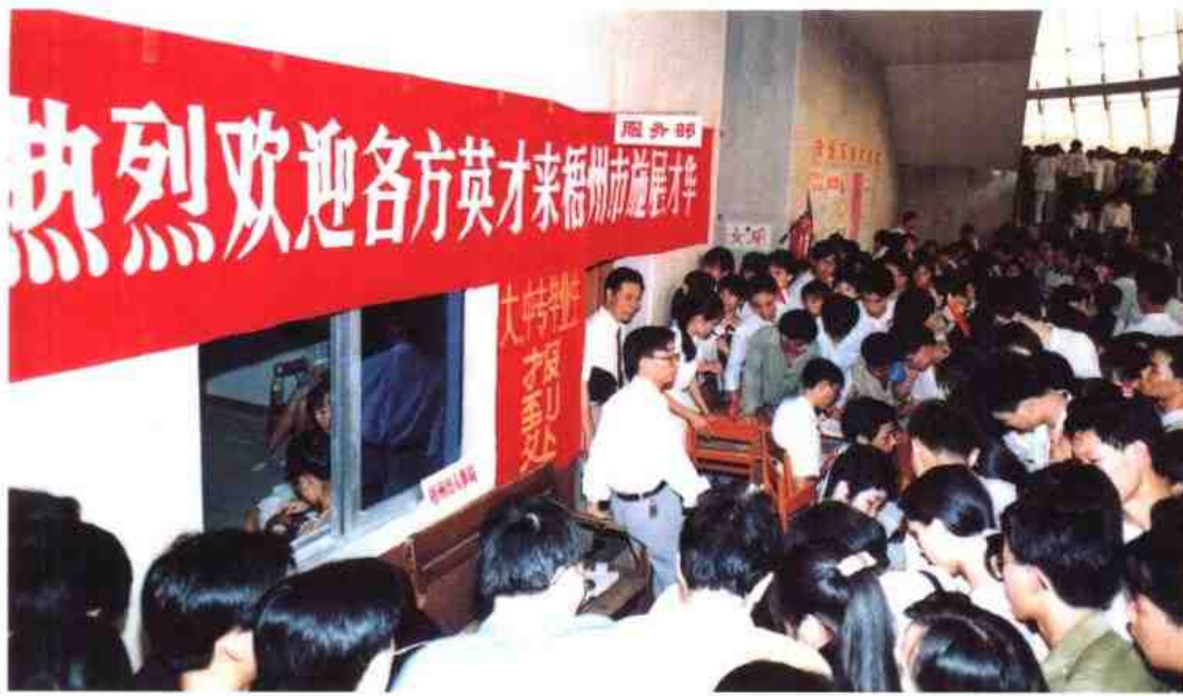
◁ 1996年7月29日，梧州市召开人才交流大会，热烈欢迎各方英才到该市施展才华。图为大会会场一角。