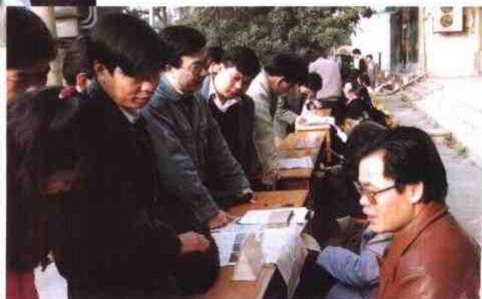
▷1996年元月，自治区直属机关10个厅局首次面向社会公开招考国家公务员。图为报名的场面。