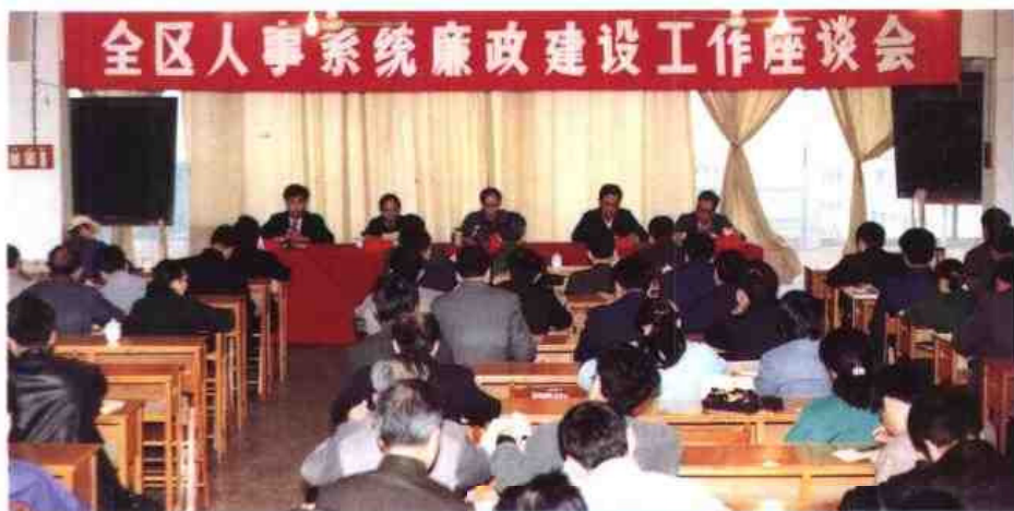
◁1990年12月19日，自治区人事厅召开全自治区人事系统廉政建设工作座谈会。图为座谈会会场一角。