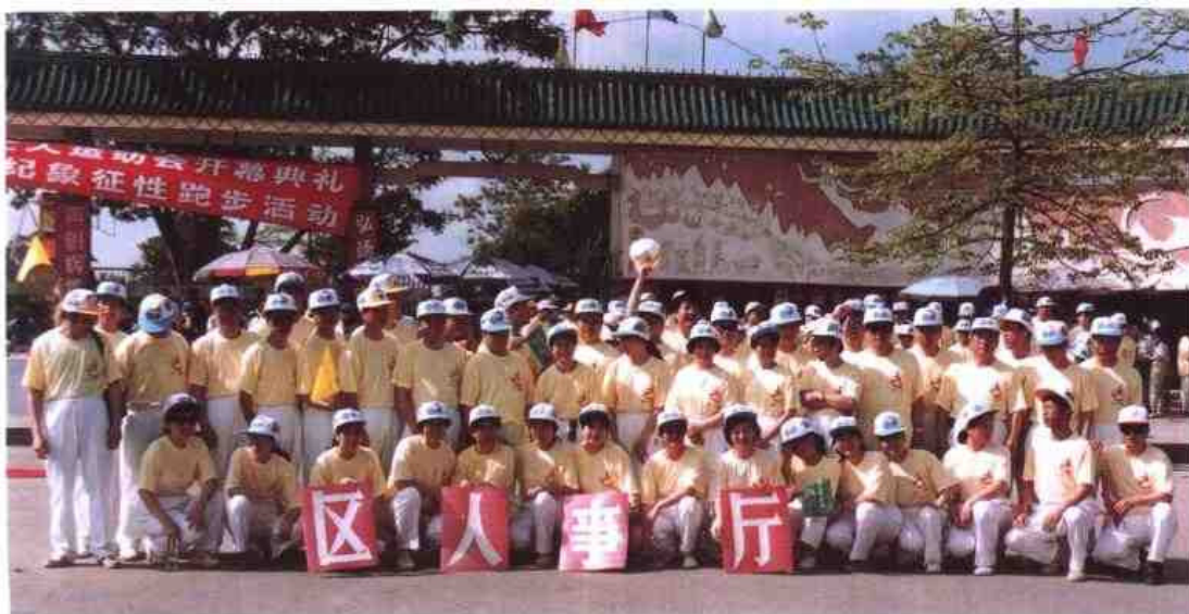
◁ 1996年5月，自治区人事厅50多名职工参加南宁市组织的第三届全国工人运动会开幕典礼和奔向21世纪象征性长跑活动。图为全体运动员合影。