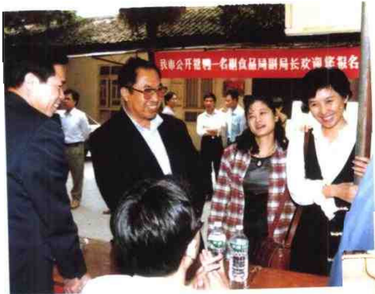
◁1996年3月，南宁市首次向社会公开招聘副处级领导干部。图为中共南宁市委副书记徐文彦（左二）到报名现场指导工作。