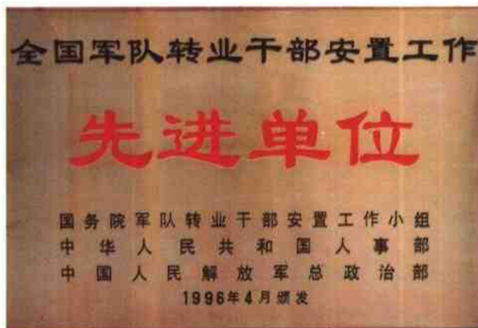
▷1996年4月，柳州市第二次荣获全国军队转业干部安置工作先进单位称号。