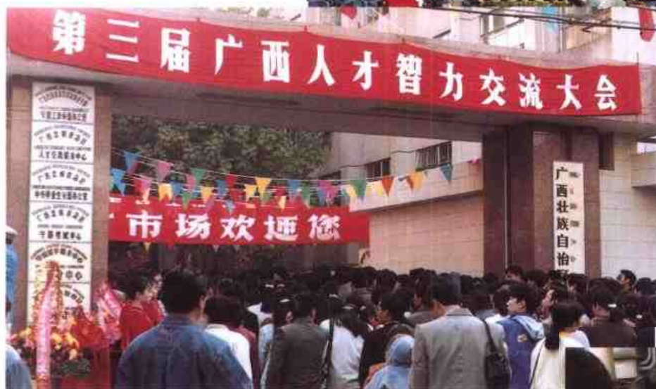
◁1995年12月，第三届广西人才智力交流大会在自治区人事厅大院内举行。图为大会入场情景。