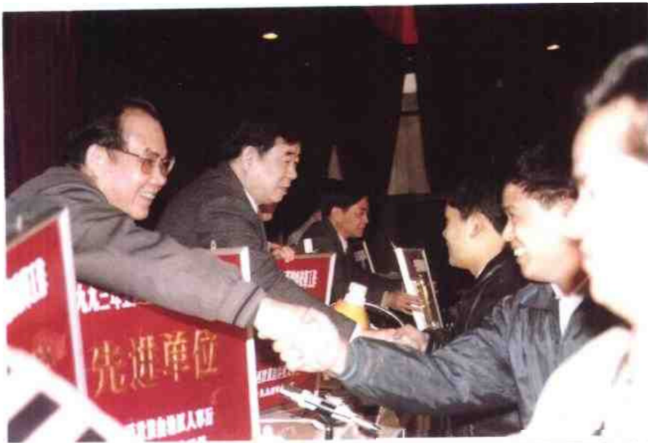
◁ 1990—1994年度全自治区人事系统先进集体、先进个人表彰会于1994年12月在邕举行。图为自治区党委副书记马庆生（左二）等领导为获奖单位和个人颁奖。