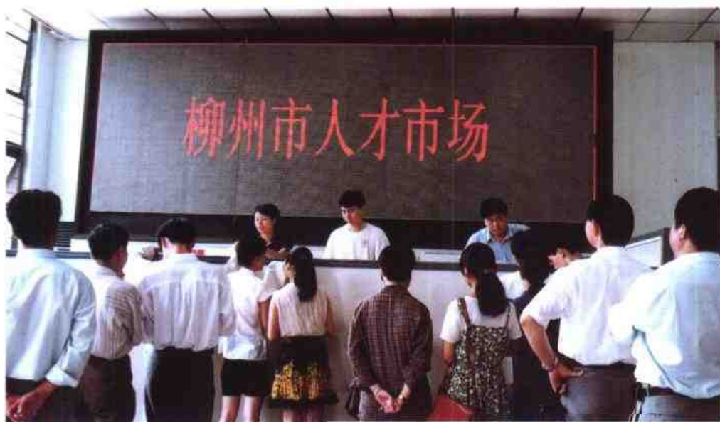
◁从1997年3月开始，柳州市人才市场就利用电子大屏幕发布人才信息广告。