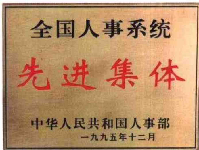
◁1995年12月，柳州市人事局荣获全国人事系统先进集体称号。