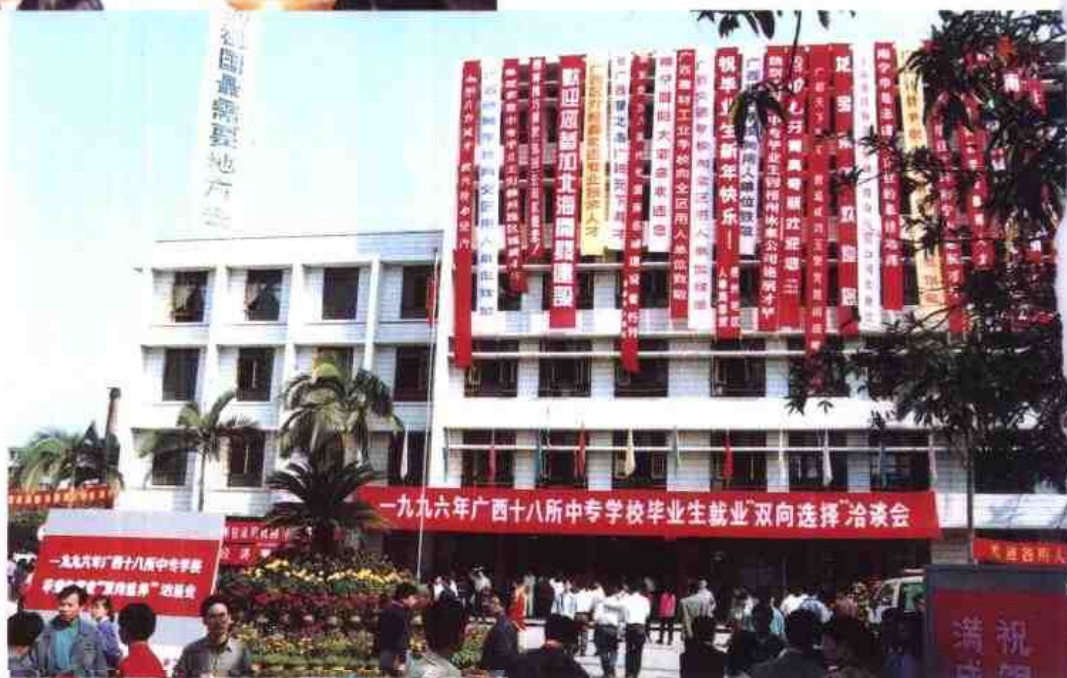
▷1996年广西18所中专学校毕业生就业“双向选择”洽谈会在南宁召开。图为大会会场一角。