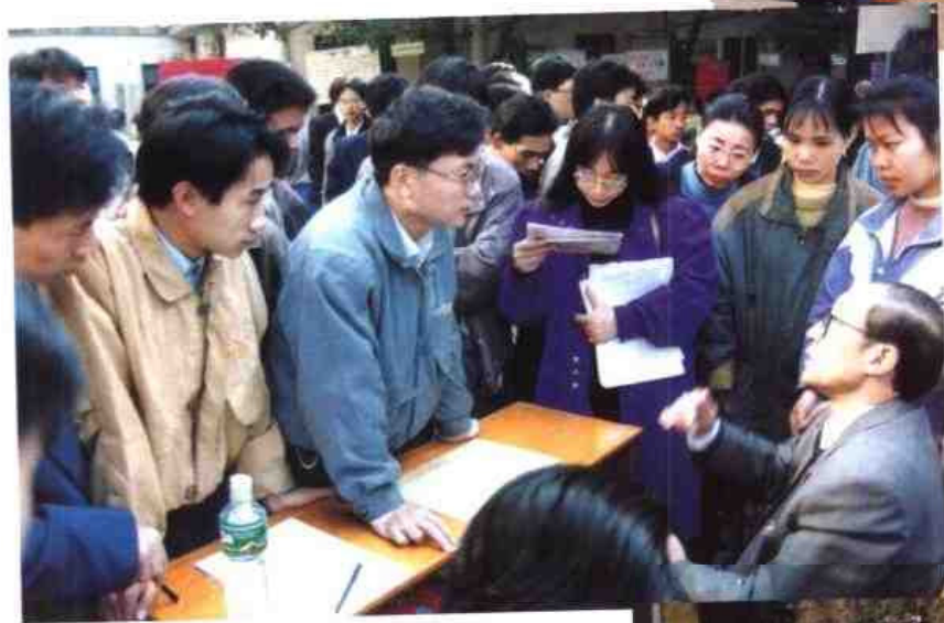
◁三资企业踊跃到南宁市人才市场招聘人才。图为1997年元月某外资企业的负责人（右一）向应聘人员介绍本企业的情况。