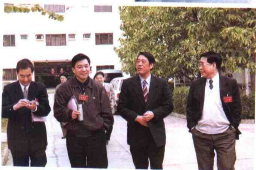
◁1997年2月，全国地方考试录用工作会议在南宁举行。图为国家人事部副部长张学忠（右一）、自治区副主席袁正中（右二）与代表们步入会场。