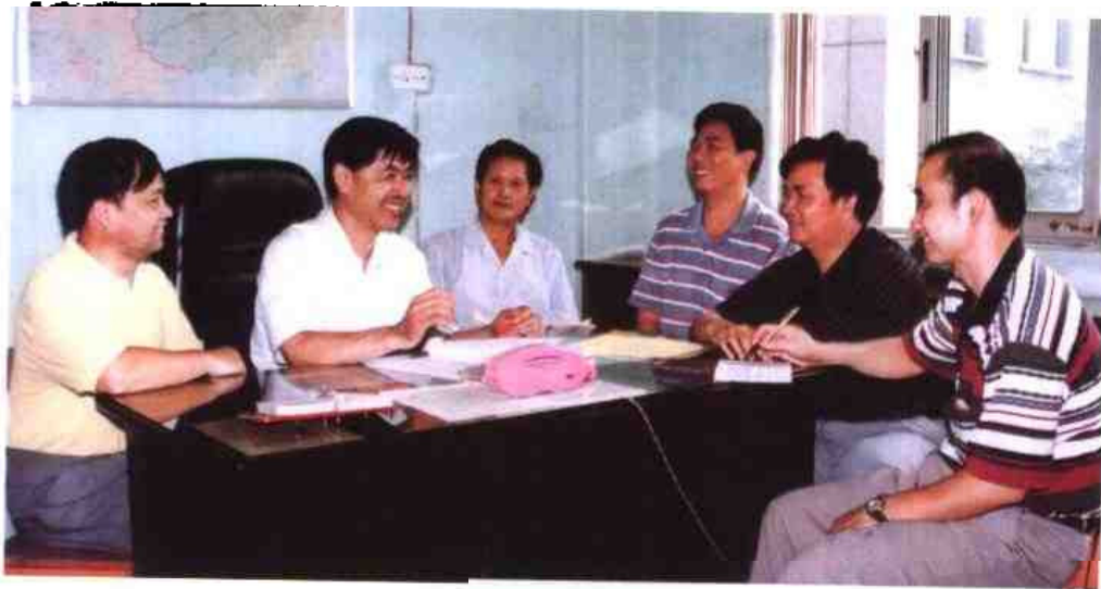
◁1997年7月8日，柳州市人事局领导与中层干部一起研究新时期的人事工作。