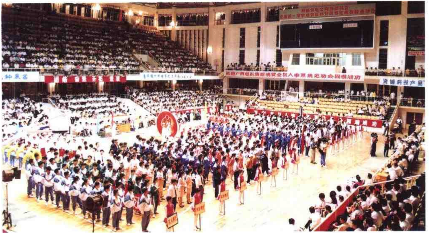
△ 1993年5月，自治区人事系统首届运动会在广西横县举行。图为运动会会场一角。