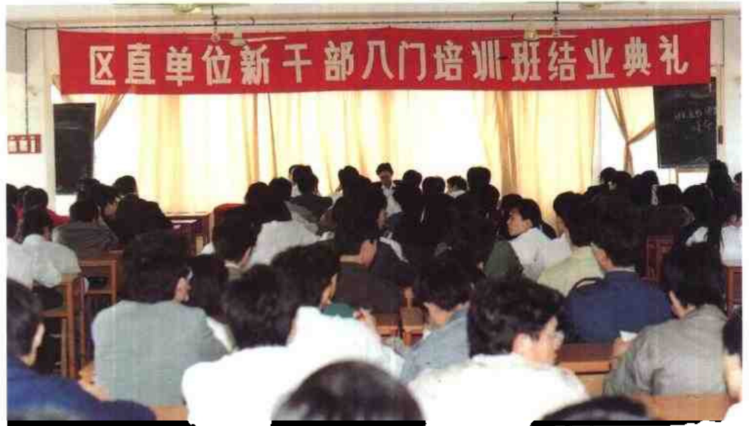
▷ 1991年12月15日，自治区人事厅开办区直单位新干部入门培训班。图为培训班结业典礼会场一角。