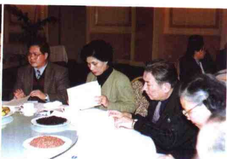
△1996年2月，自治区党委组织部、人事厅等8家单位联合举办在邕知识分子迎春团拜会。自治区领导赵富林、马庆生、潘琦、徐爱俐、袁凤兰、张慕洁、侯德彭等出席。