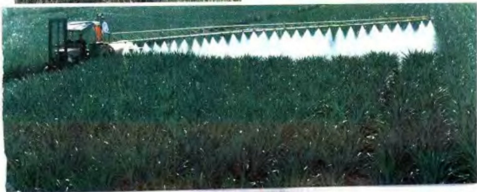
▼ 90年代金光农场菠萝园机引灌溉。