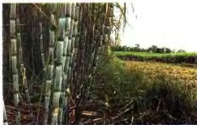
▼ 旱地甘蔗大面积高产技术推广获农业部丰收奖三等奖。