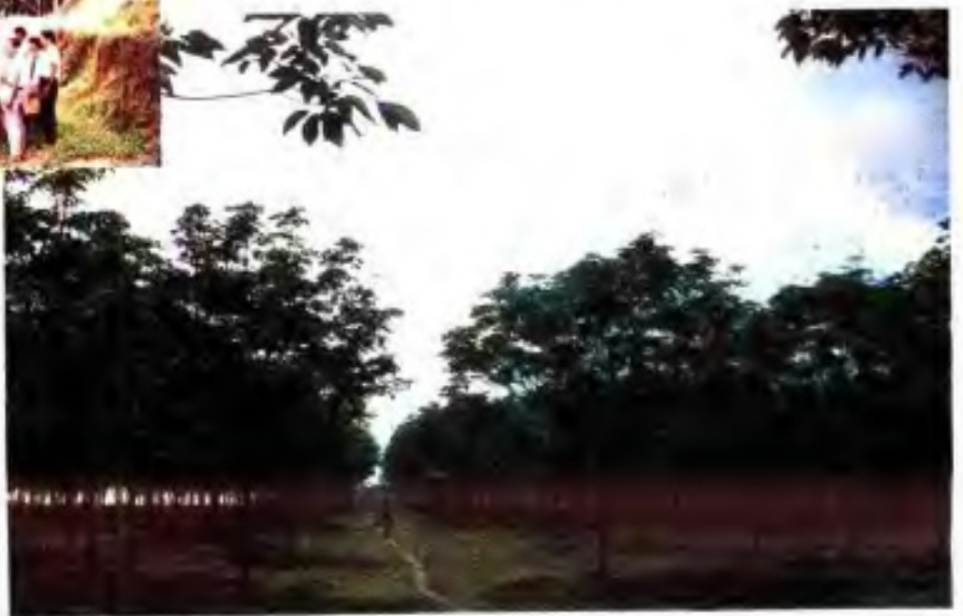
▲ 前正农场第二代橡胶园