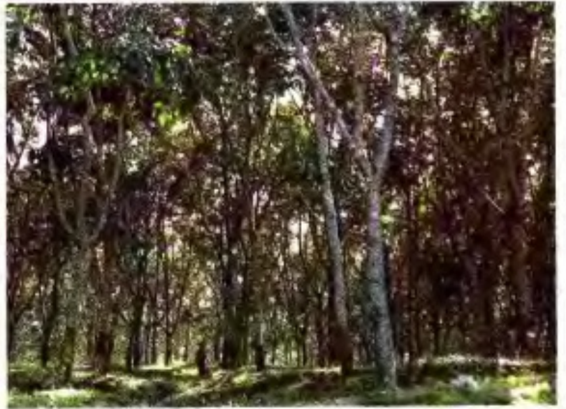
▲ 龙北农场第一代橡胶园