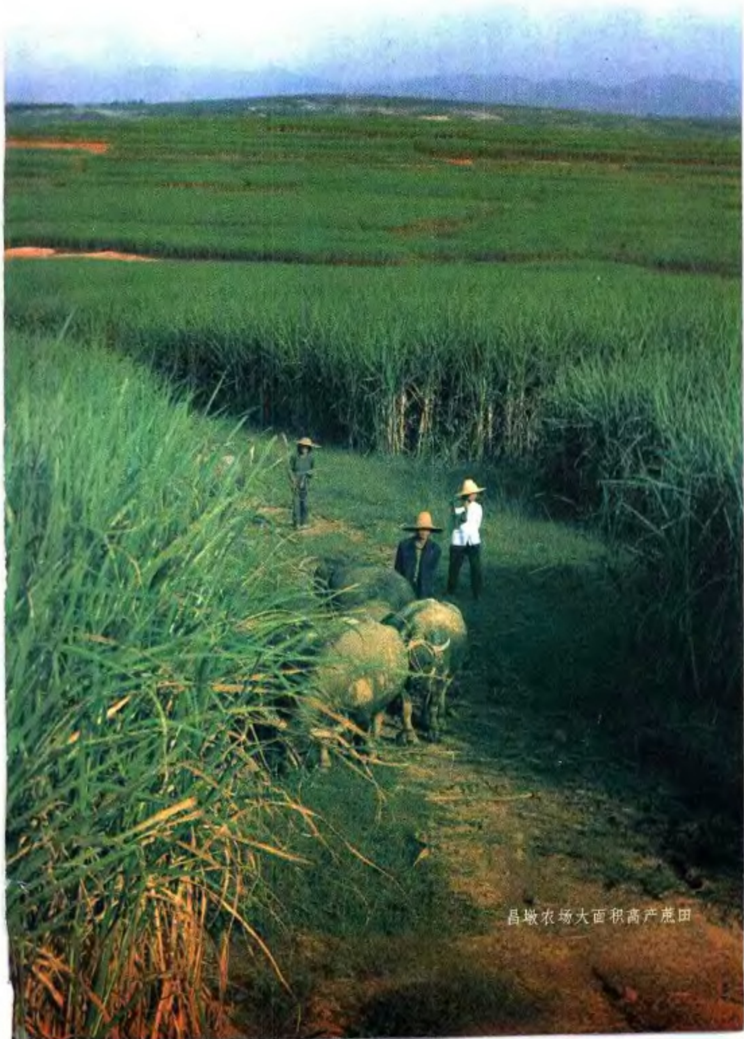
昌墩农场大面积高产蔗田