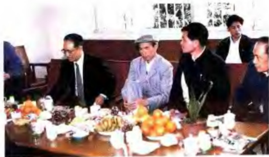
◀ 1988年，农业部部长何康在自治区党委书记陈辉光陪同下视察广西农垦。