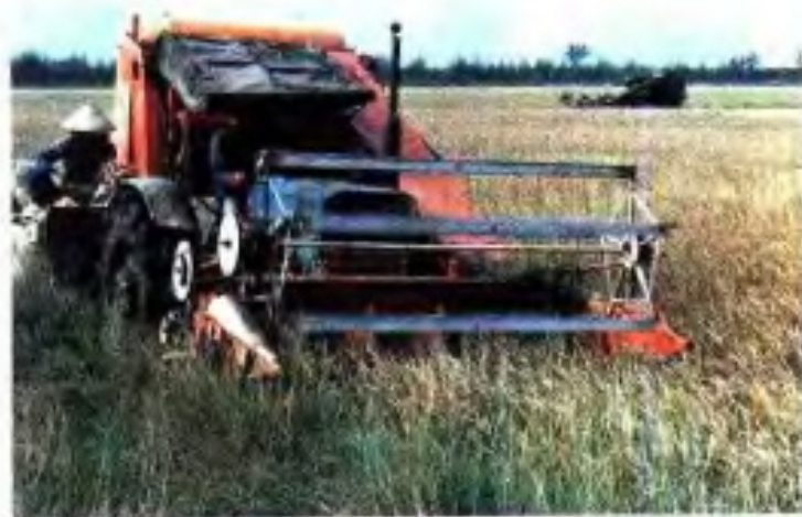
◀ 80年代大光农场榕树头队水稻机械收割。