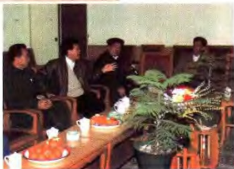
▶ 1990年，自治区主席成克杰在自治区农垦局局长黄道业，副局长翁伯鹏陪同下视察金光农场。