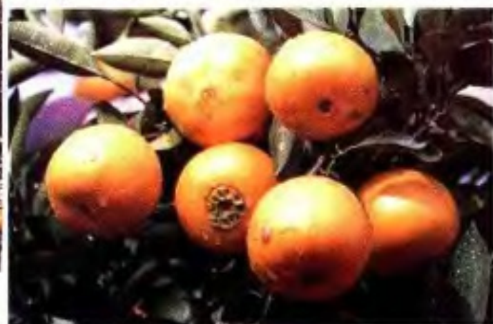
▼ 主要的出口柑桔良种——脐橙。