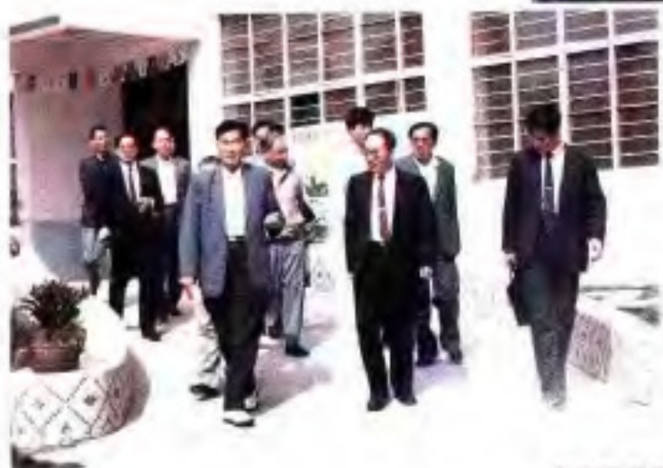
◀ 1991年，国务委员陈俊生视察广西农垦。