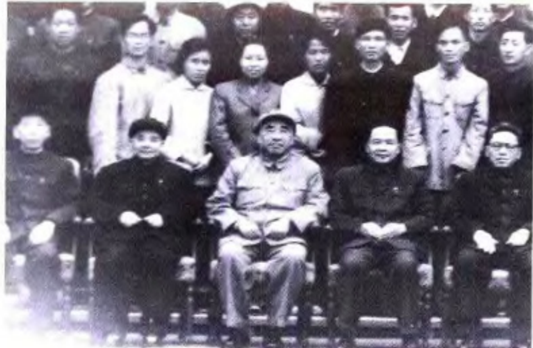
◀ 1964年，中共中央副主席、全国人大常委会委员朱德与广西农垦三级干部会议代表合影。