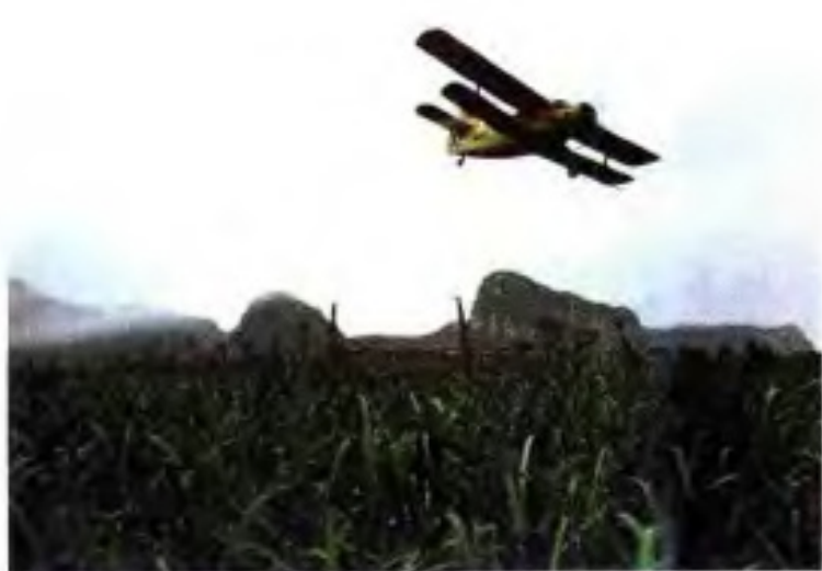
◀ 80年代末大面积蔗田采用飞机施肥。