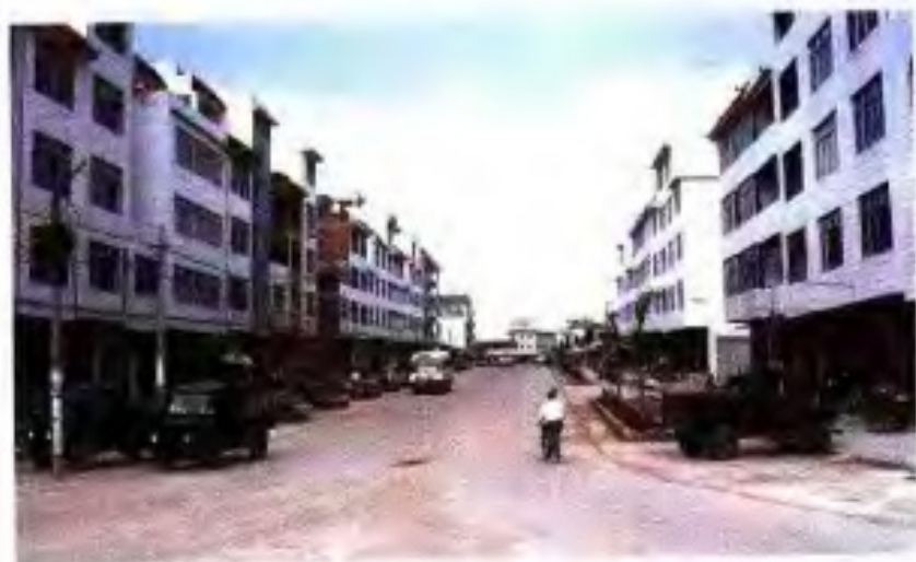
▲ 90年代西江农场小城镇新街。