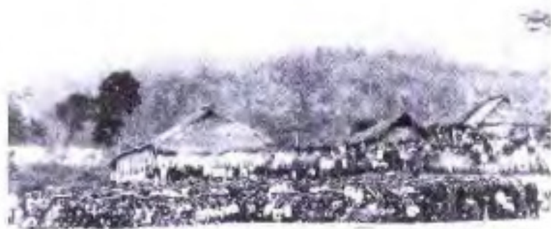
◀ 50年代的阳灯咖啡农场场部。