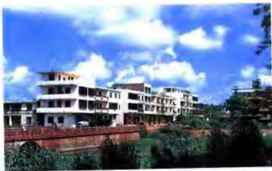
▶ 90年代良斯农场场部小城镇一角。