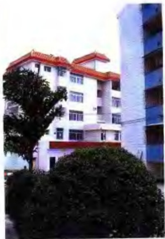
▲ 90年代西江农场职工住宅楼。