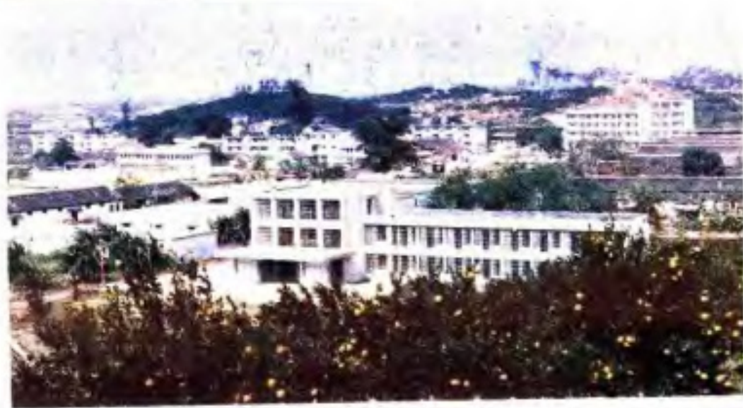
▶ 80年代的新光农场场部。