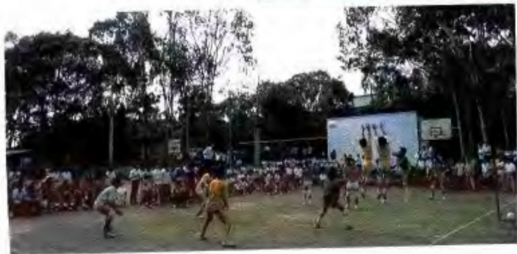
◀ 职工业余文体活动。