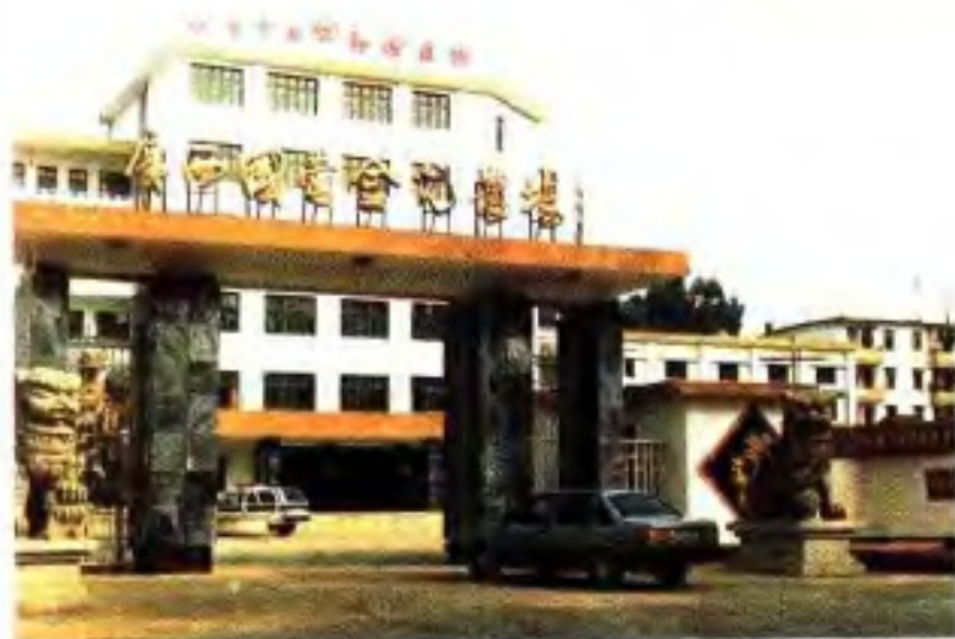
◀ 80年代的金光农场场部。