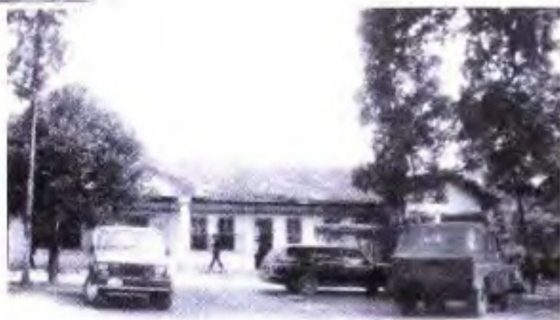
▶ 60年代的惠风农场场部办公室。