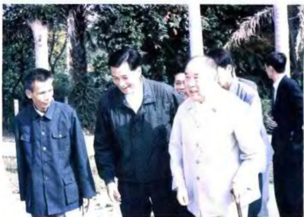
▼ 1984年，全国人大副委员长赛福鼎到广西农垦视察。