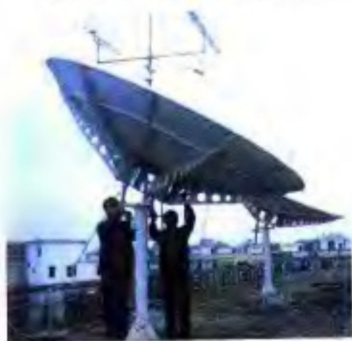
▲ 90年代安装的良斯农场卫星接收天线。