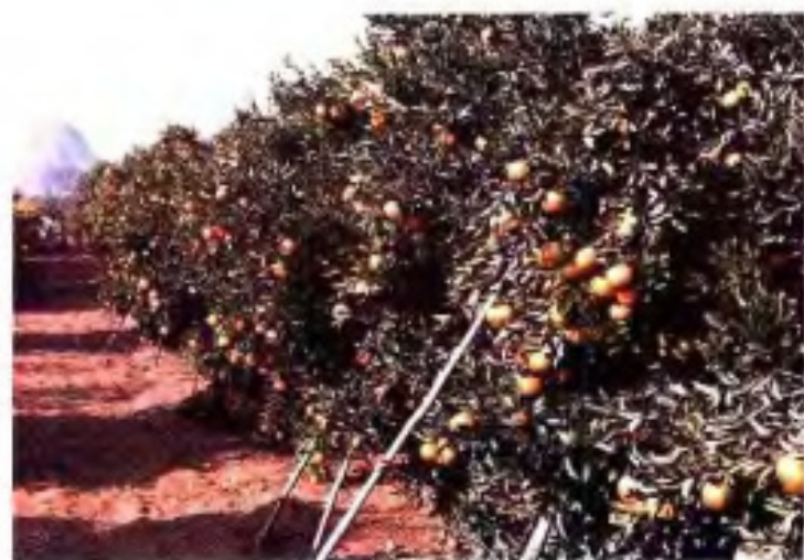
▲ 源头农场高产橙柑。