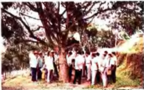
▲ 五星农场五星1号实生母树