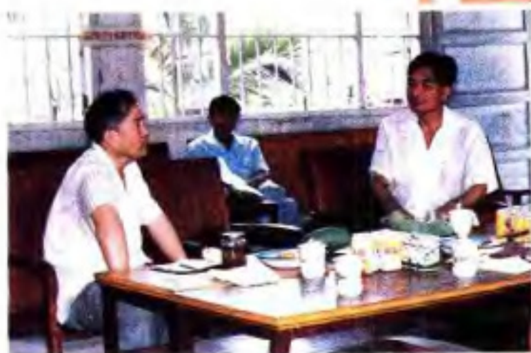
◀ 自治区副主席杰川到广西亚热带作物研究所视察。