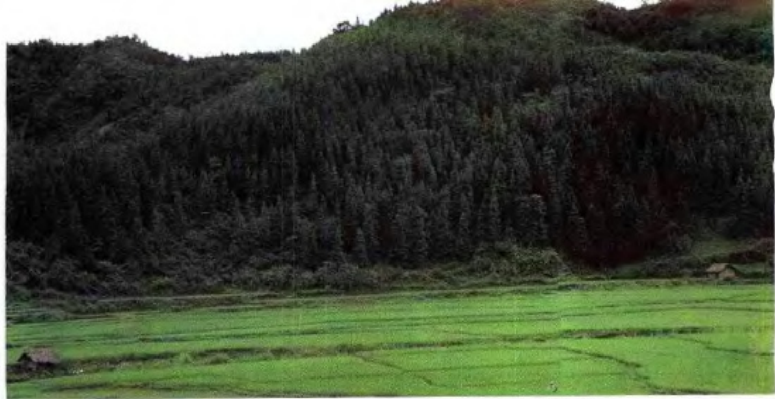
▲ 先锋农场一望无际的杉木林。