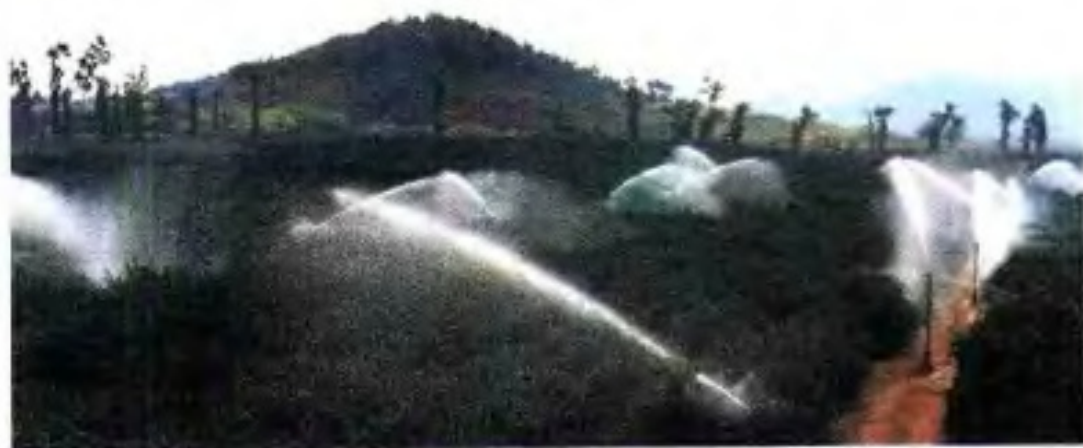
▶ 80年代后期，平原地区甘蔗等采用节水喷灌技术。