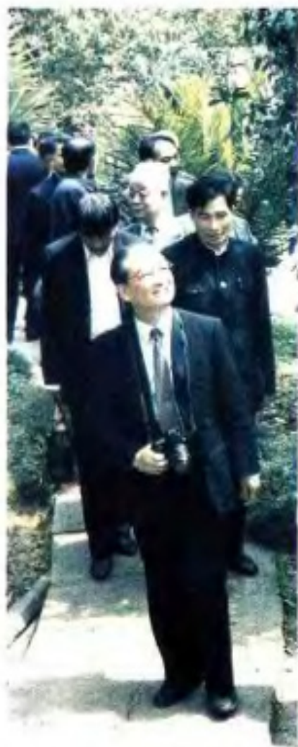
▲ 1987年，农牧渔业部部长何康到广西农垦视察。