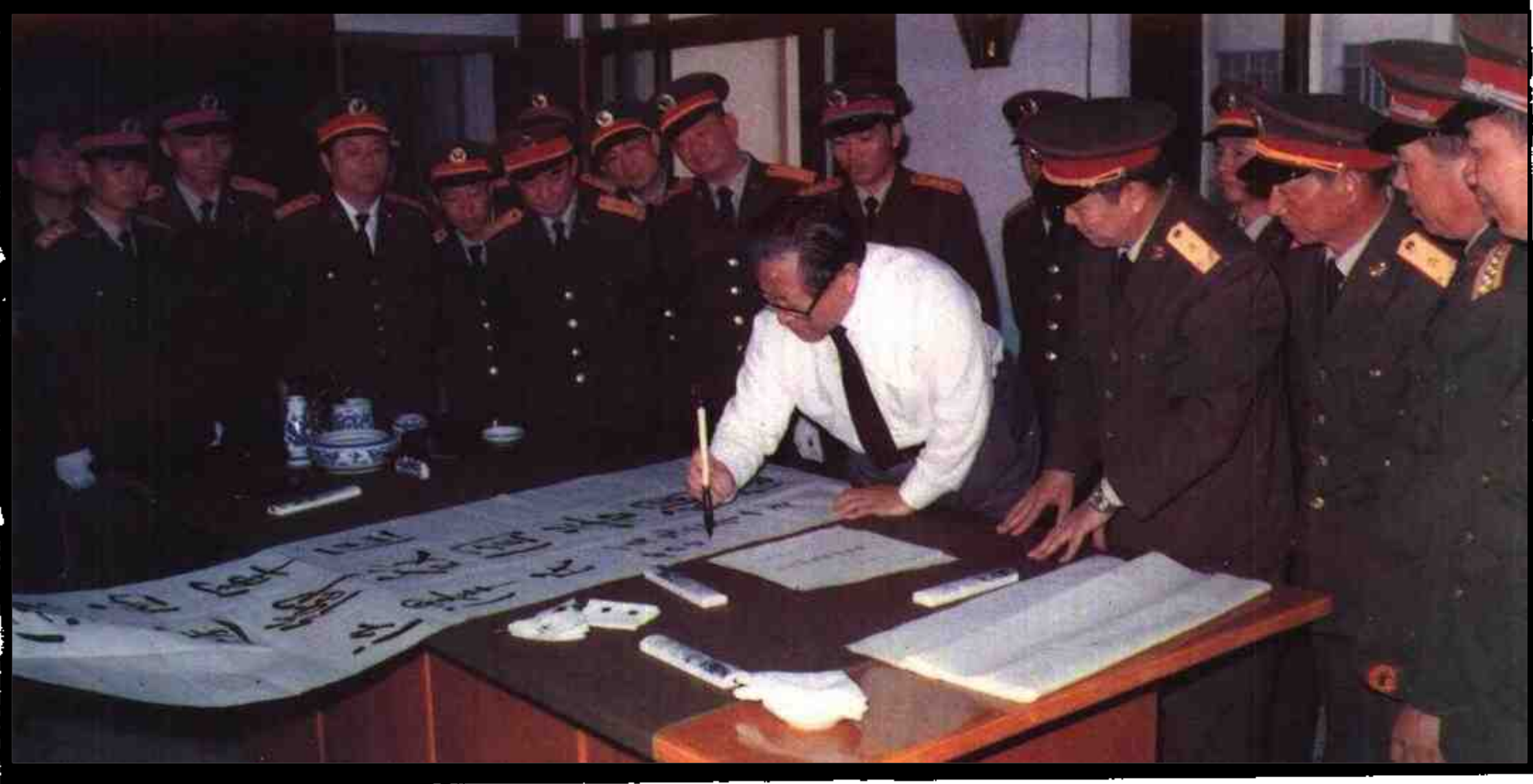
1990年11月24日，中共中央总书记、中央军委主席江泽民在总政治部副主任周文元、广州军区司令员朱敦法等陪同下，视察了军区机关和驻桂陆、海、空部队及军事院校。图为江主席为广西军区、驻桂部队题词。