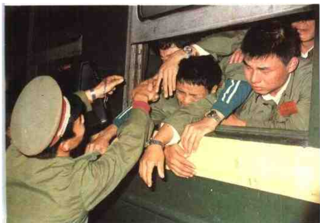
1991年，广西军区机关和部队干部到南宁火车站欢送老兵退伍。