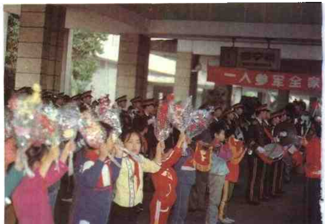
1992年，自治区党政军领导和机关干部及人民群众到火车站欢迎新兵入伍。