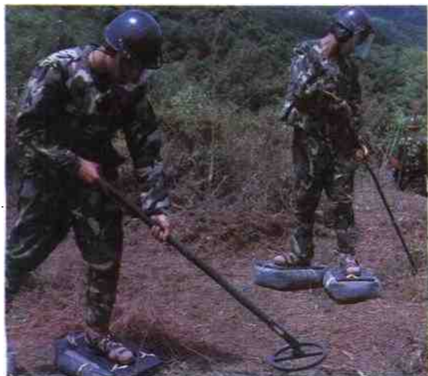
军区工兵在中越边境排雷。