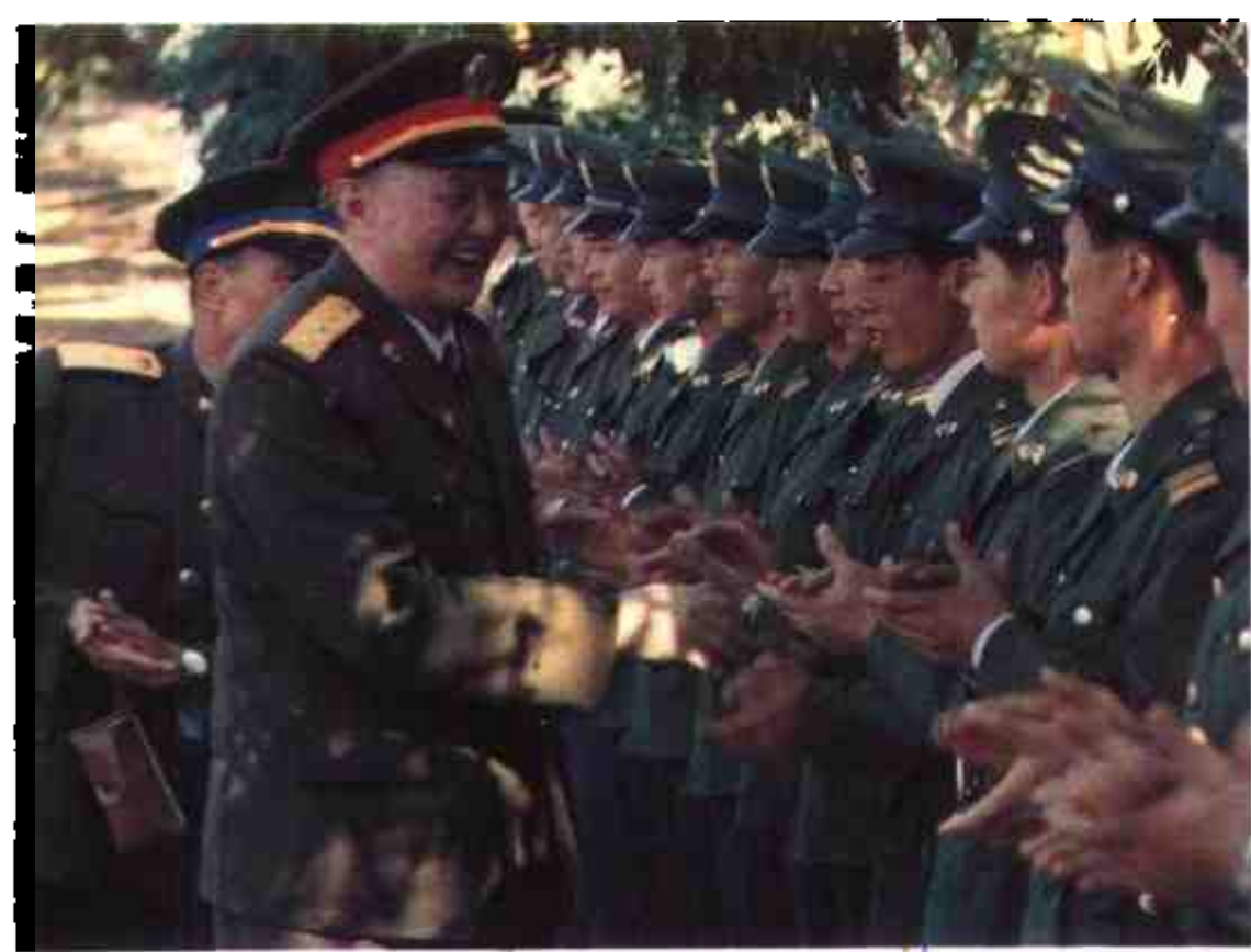
1989年，中央军委委员洪学智上将接见驻桂空军指战员。