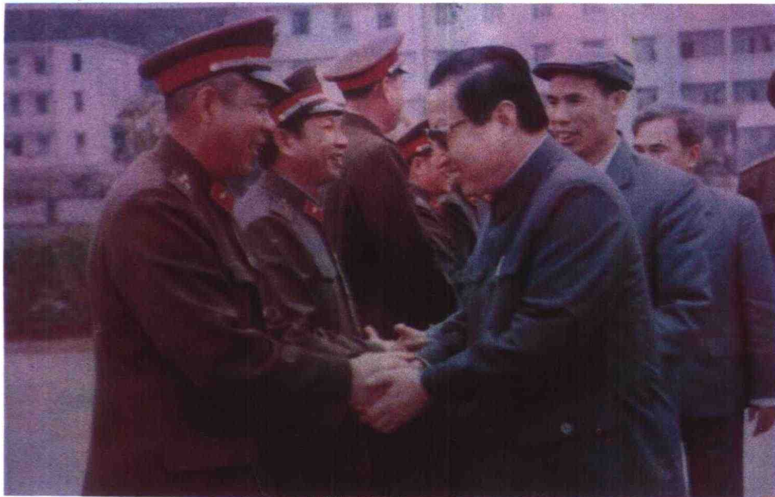
1988年1月，中共中央政治局常委乔石在自治区党委书记陈辉光陪同下，看望边防部队指战员。