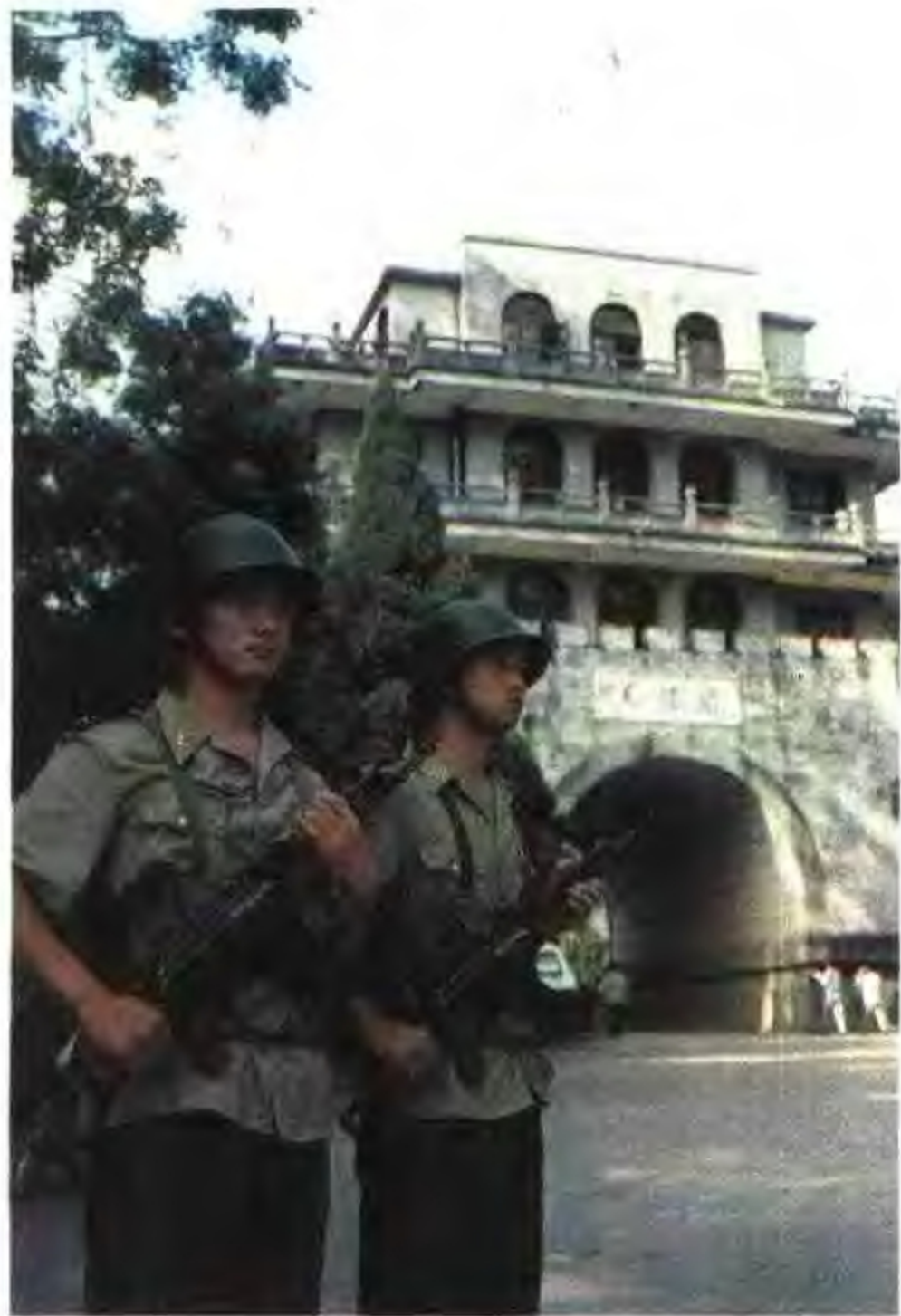
守卫友谊关的解放军战士。