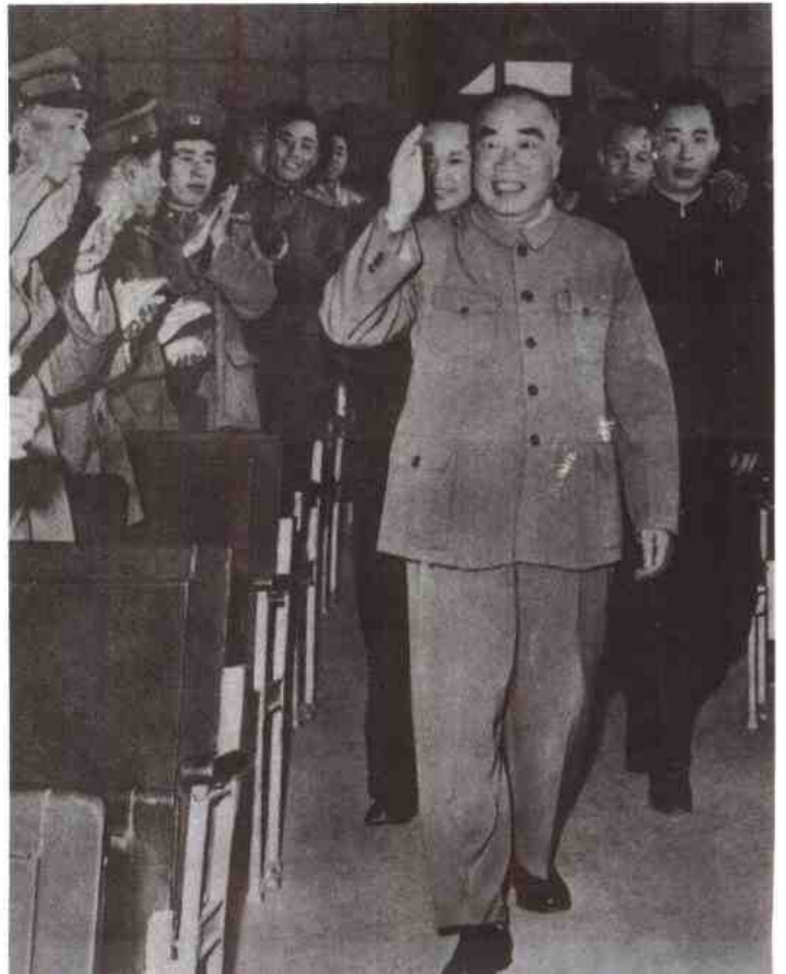
1964年3月，朱德元帅在广西军区礼堂接见部队代表。