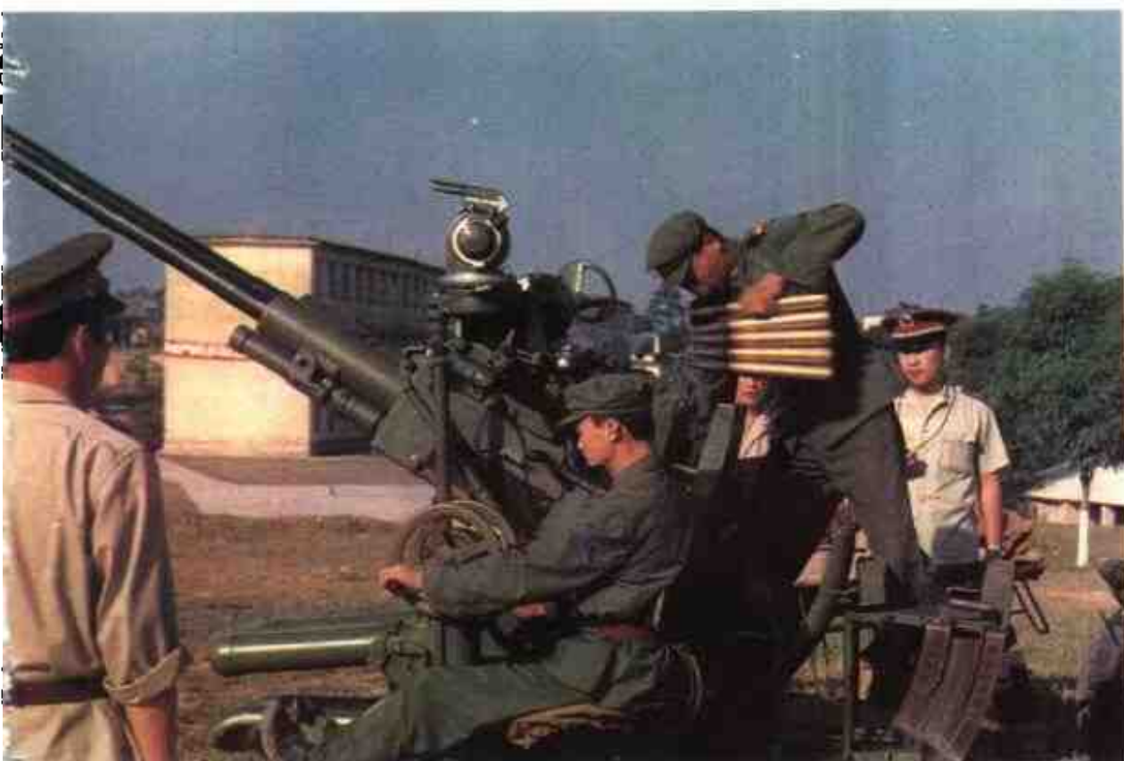
军区炮兵在进行装弹操纵训练。