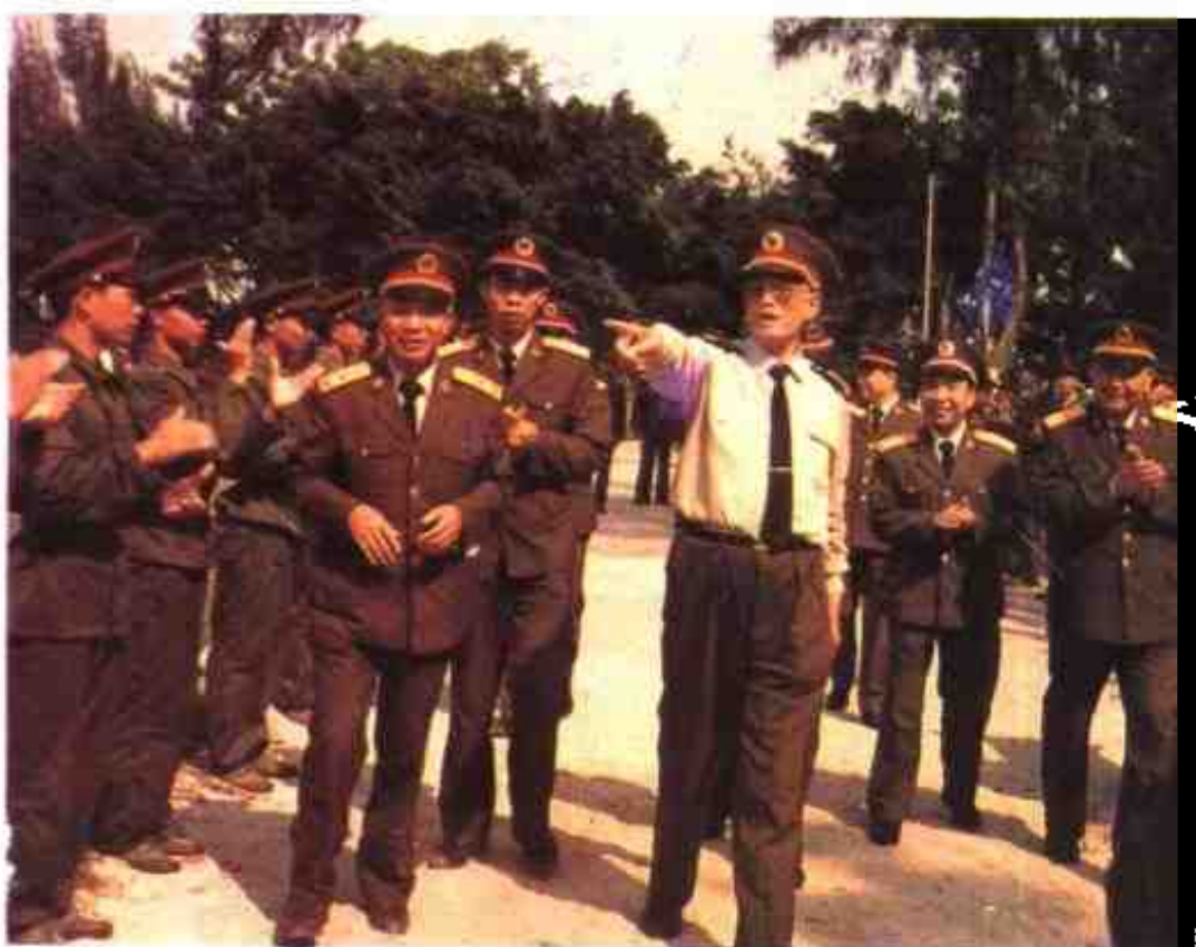
1993年4月17日，中央军委副主席张震上将视察北海警备区机关分队。