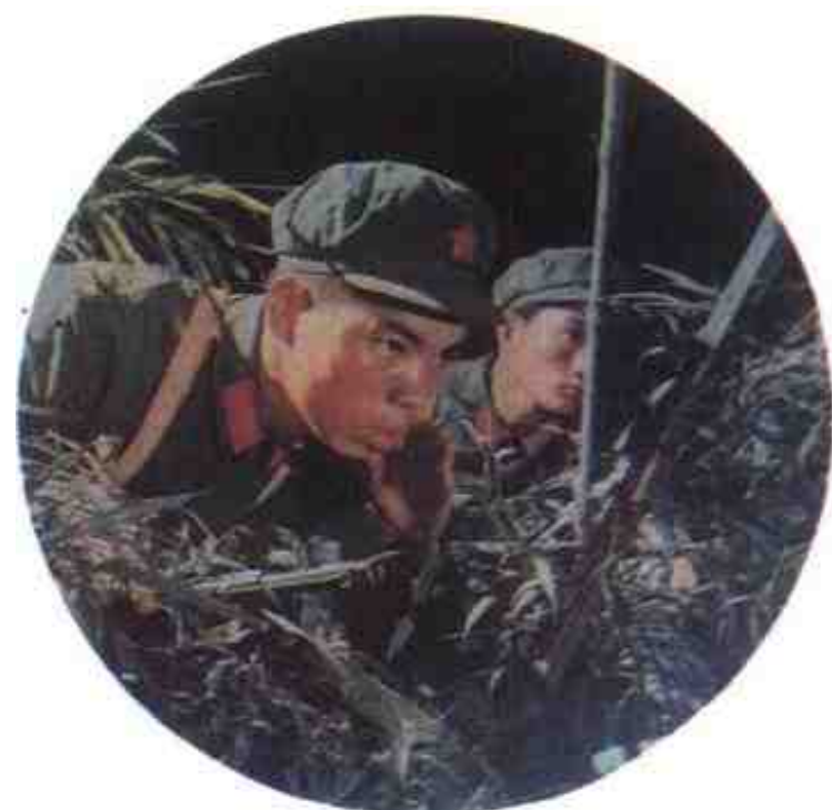
1976年，边防战士进行夜间潜伏训练。