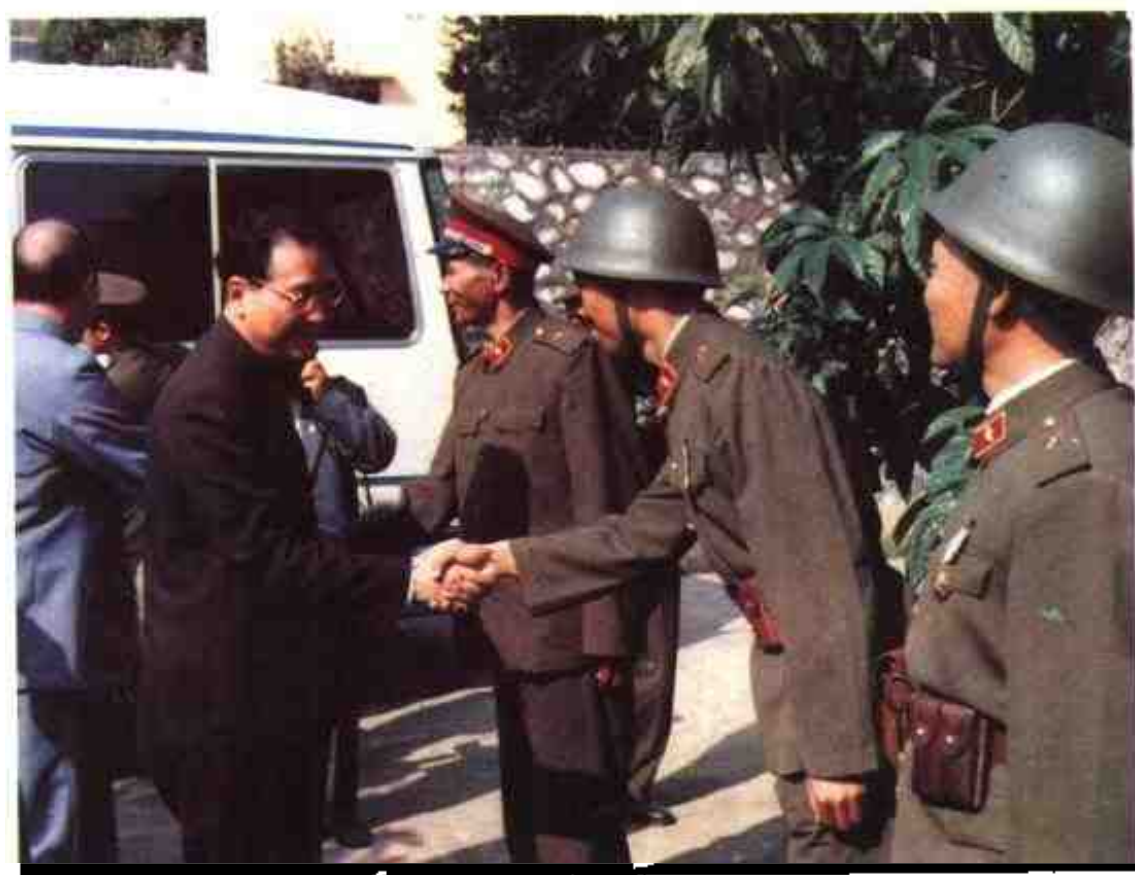
1986年11月22日，国务院副总理李鹏到法卡山看望指战员。