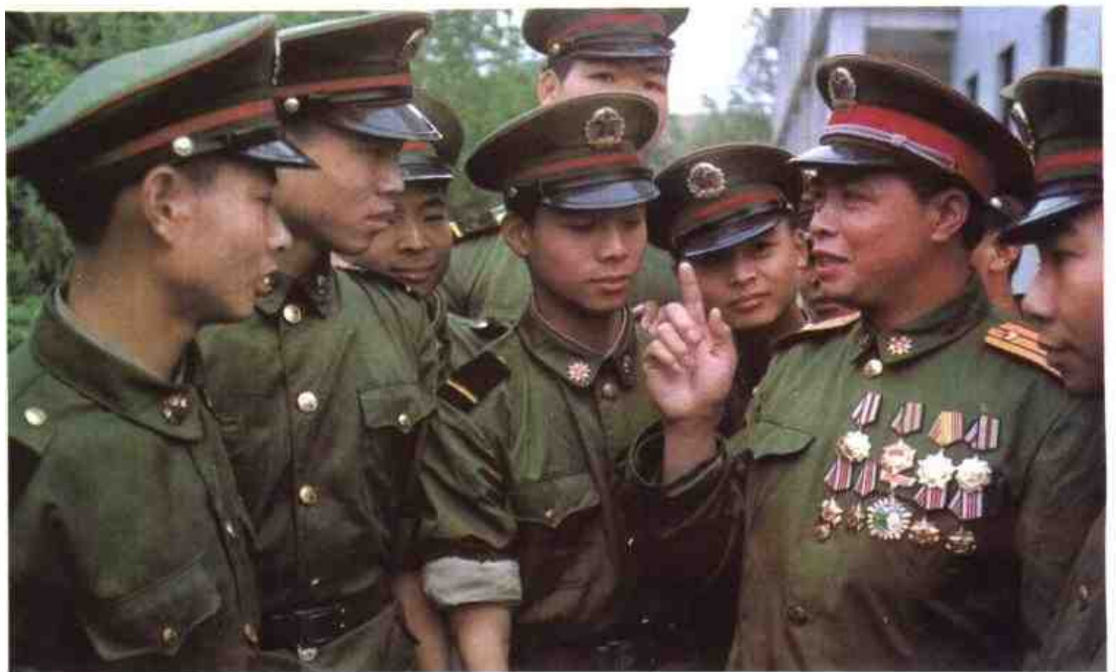
战斗英雄给 新兵讲传统。