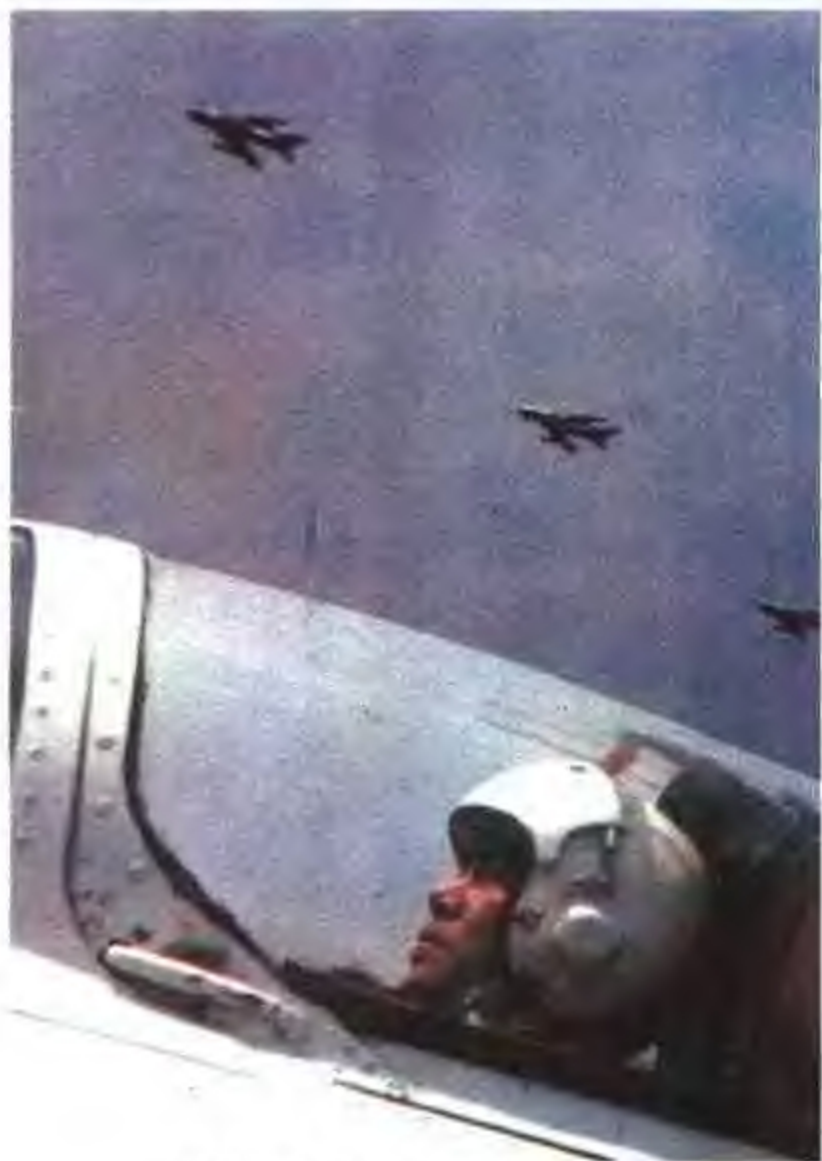
驻桂空军机组在巡航。