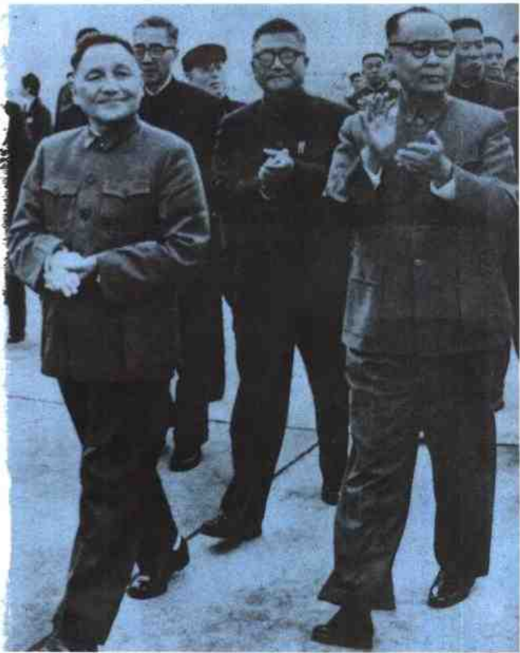
1973年10月，广西军区第一政委韦国清等党政军领导在桂林迎接国务院副总理邓小平到广西视察。