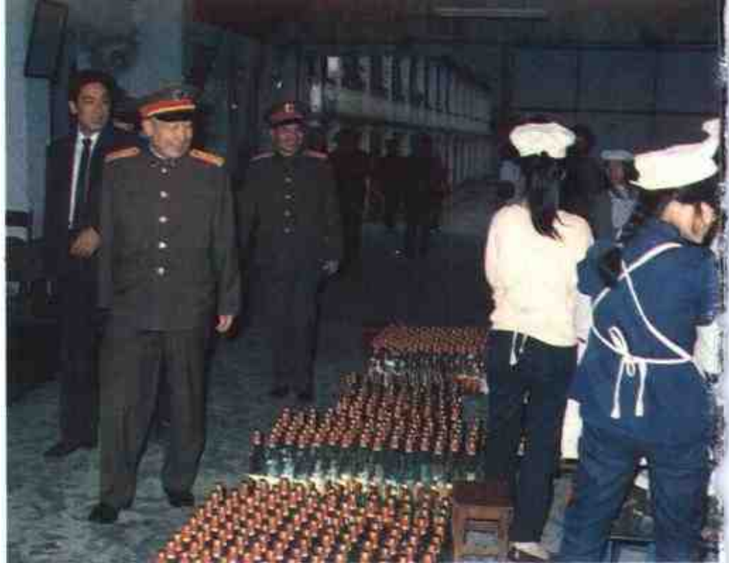
1992年6月，广州军区政委张仲先中将检查广西军区生产经营。