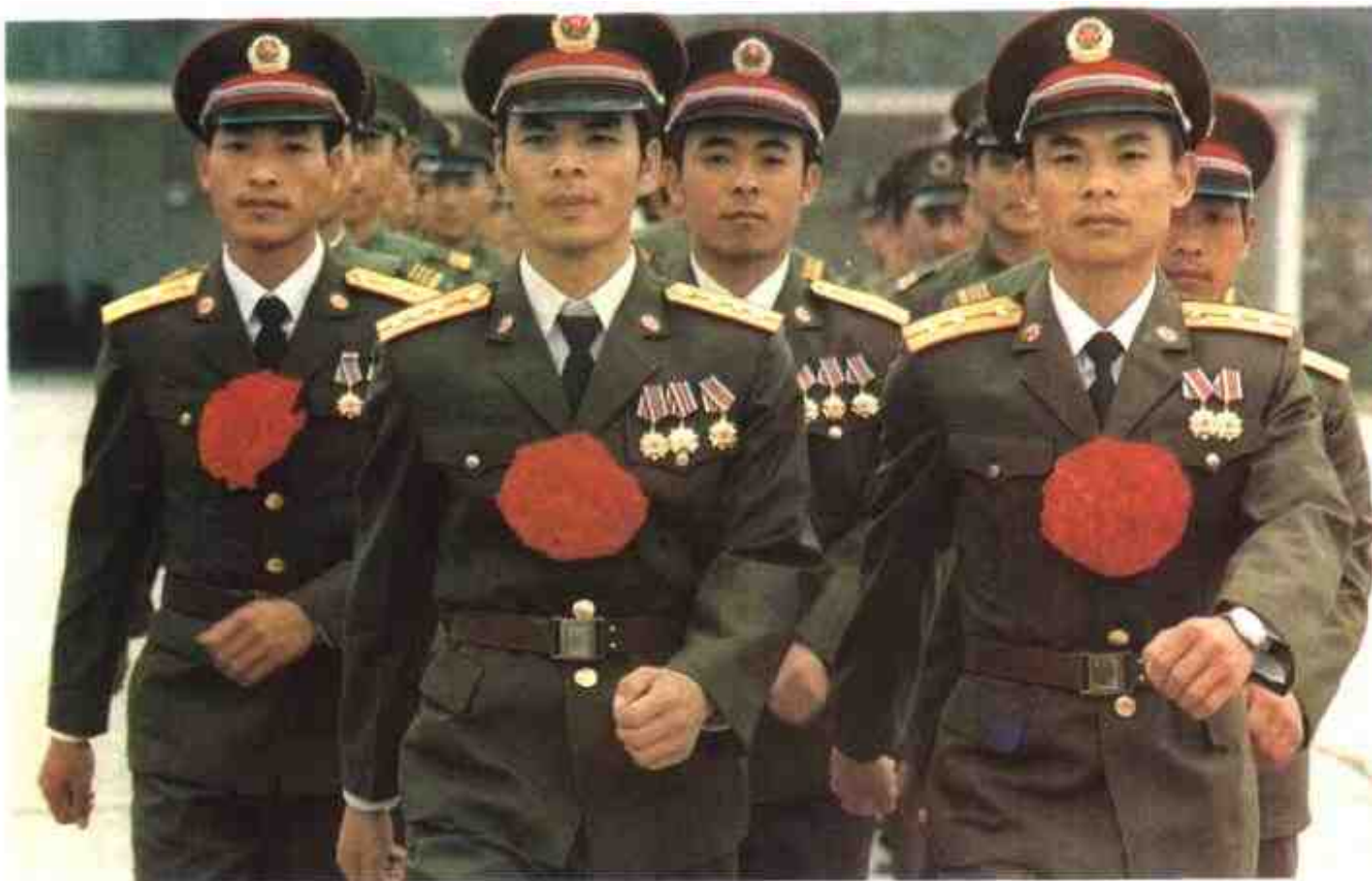
广西边防部队 “英雄侦察连”的功臣们。