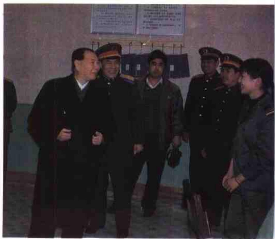
1991年1月，全国政协副主席杨成武上将视察军区通信连。