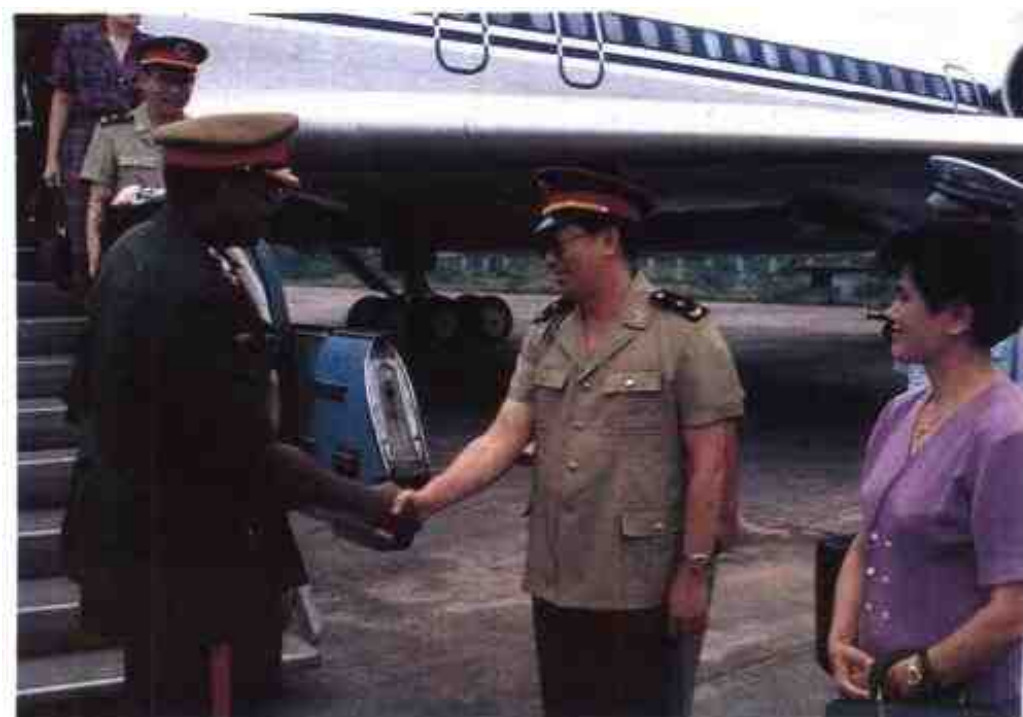
1993年9月19日,赞比亚陆军司令西姆贝叶中将访问桂林,广西军区政委熊自仁到机场迎送。