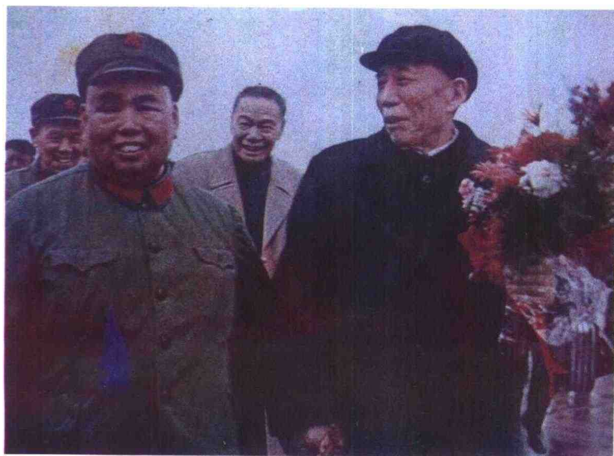
1979年3月，中央慰问团团长王震、副团长姬鹏飞在广州军区司令员许世友陪同下慰问边防部队。