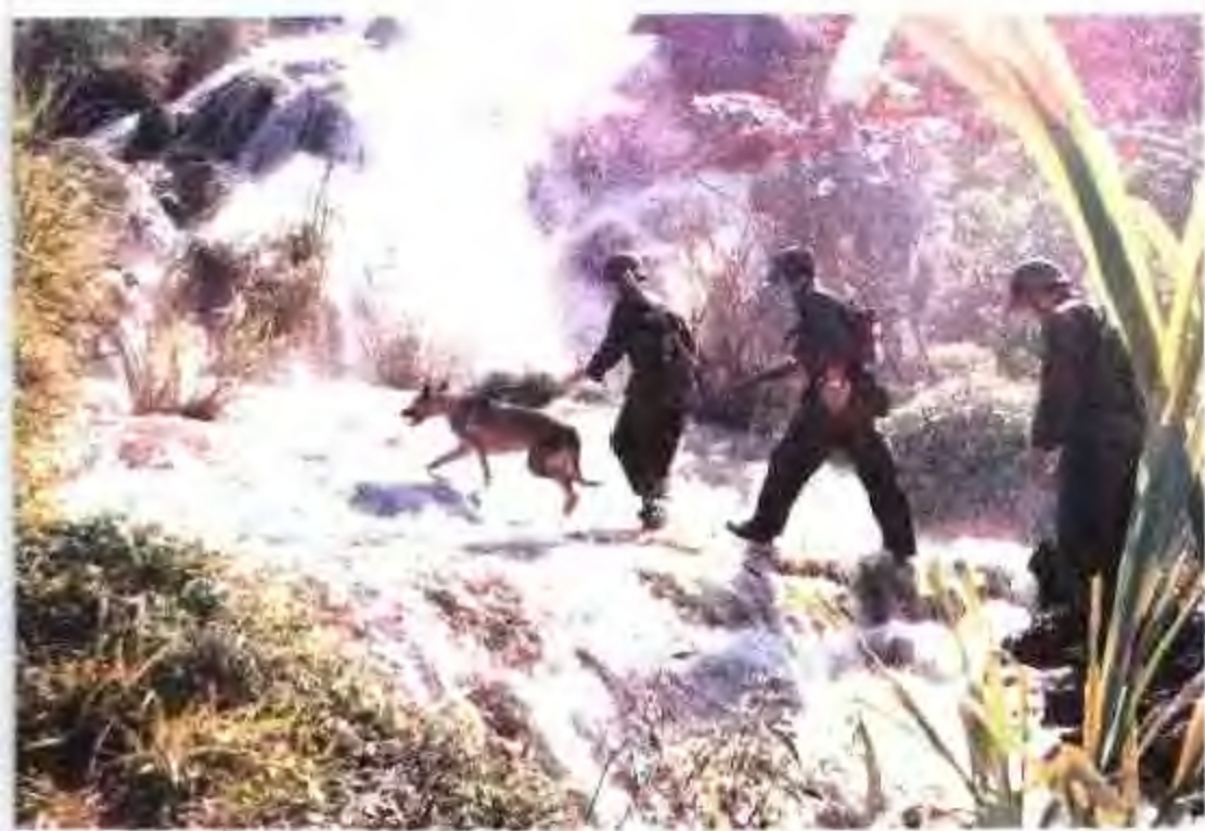
边防线上的巡逻兵。