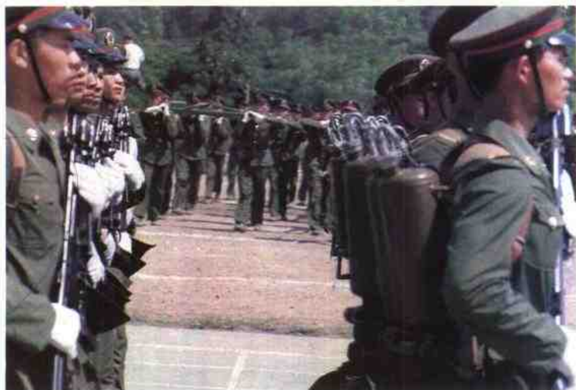
1989年，军区防化兵接受上级领导机关检阅。