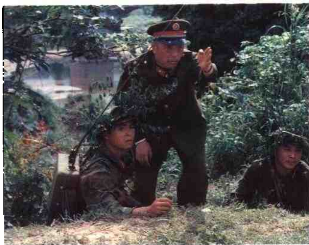
1988年,广西军区司令员李新良在指导边防干部战士进行军事演练。