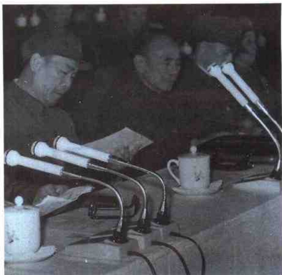
1973年11月22日，自治区、军区联合召开民兵、复退军人代表大会。图为自治区党委第一书记、军区政委刘重桂，自治区主席覃应机，军区司令员赵欣然等领导人在大会主席台。