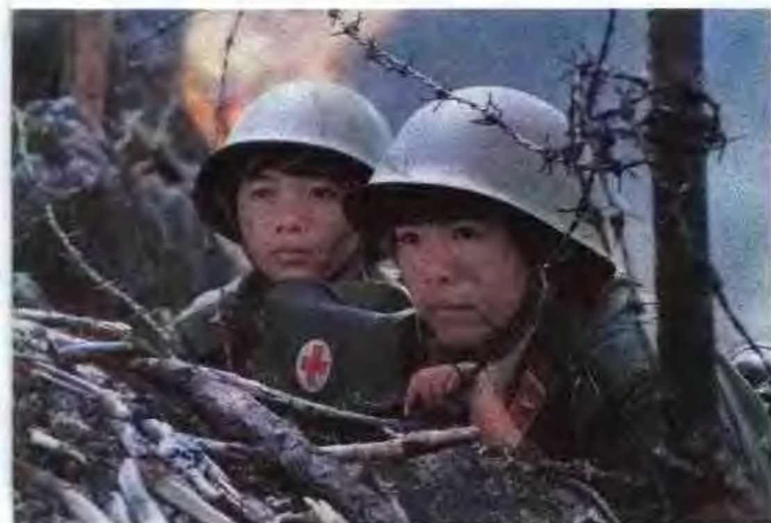
1986年,战斗演练中的卫生兵。