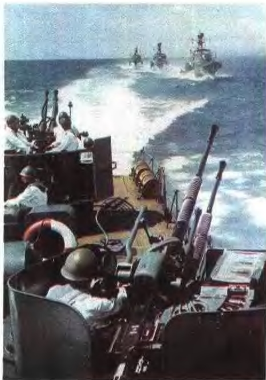
驻桂海军舰艇在巡航。