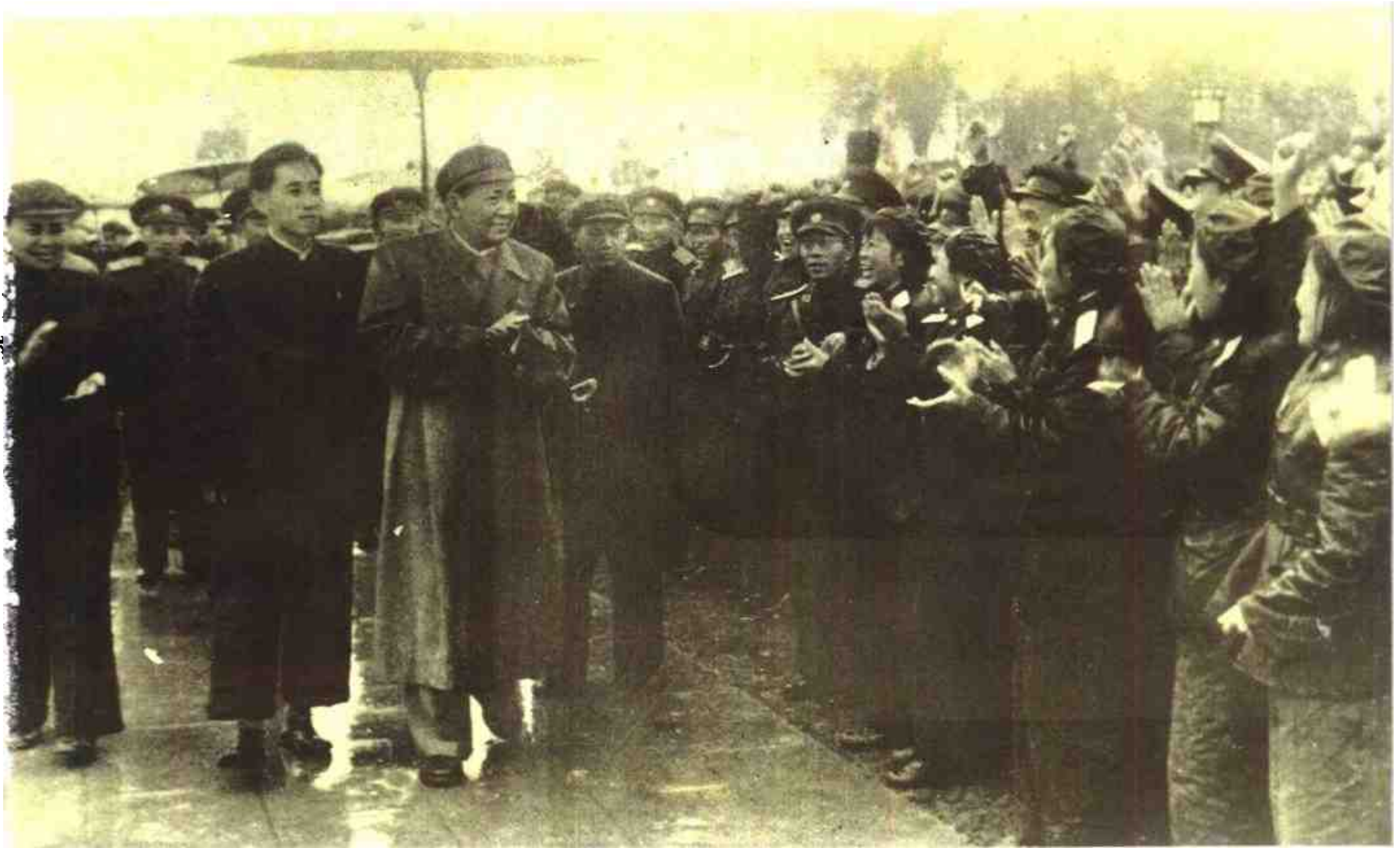
1958年1月22日，毛泽东主席、周恩来总理等中央领导在南宁接见广西军区及驻桂部队指战员和民兵。