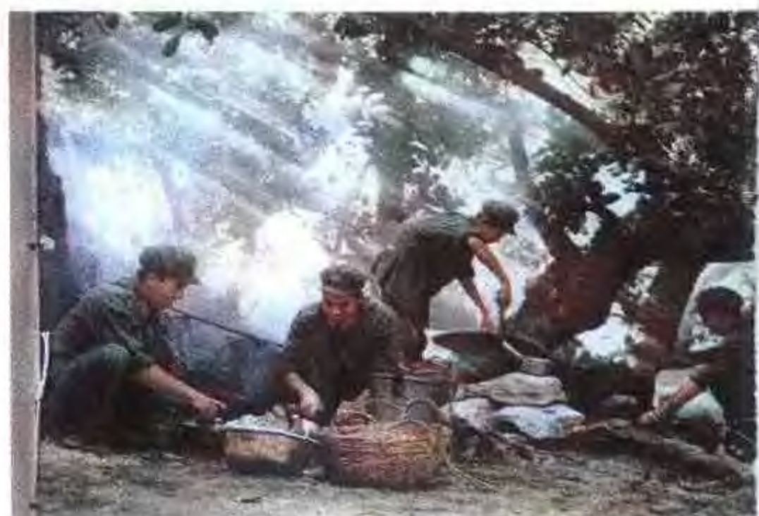
1977年,边防部队野营中的炊事兵。