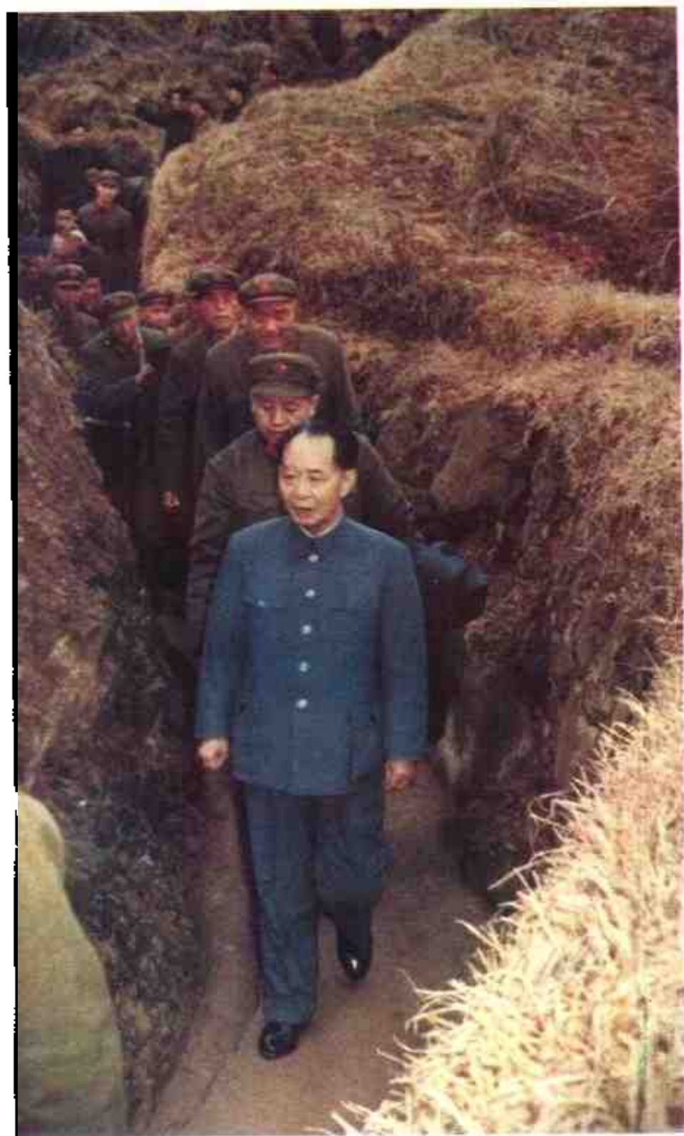
1984年1月31日，中共中央总书记胡耀邦在总政治部主任余秋里、广州军区司令员尤太忠等陪同下视察广西边防。