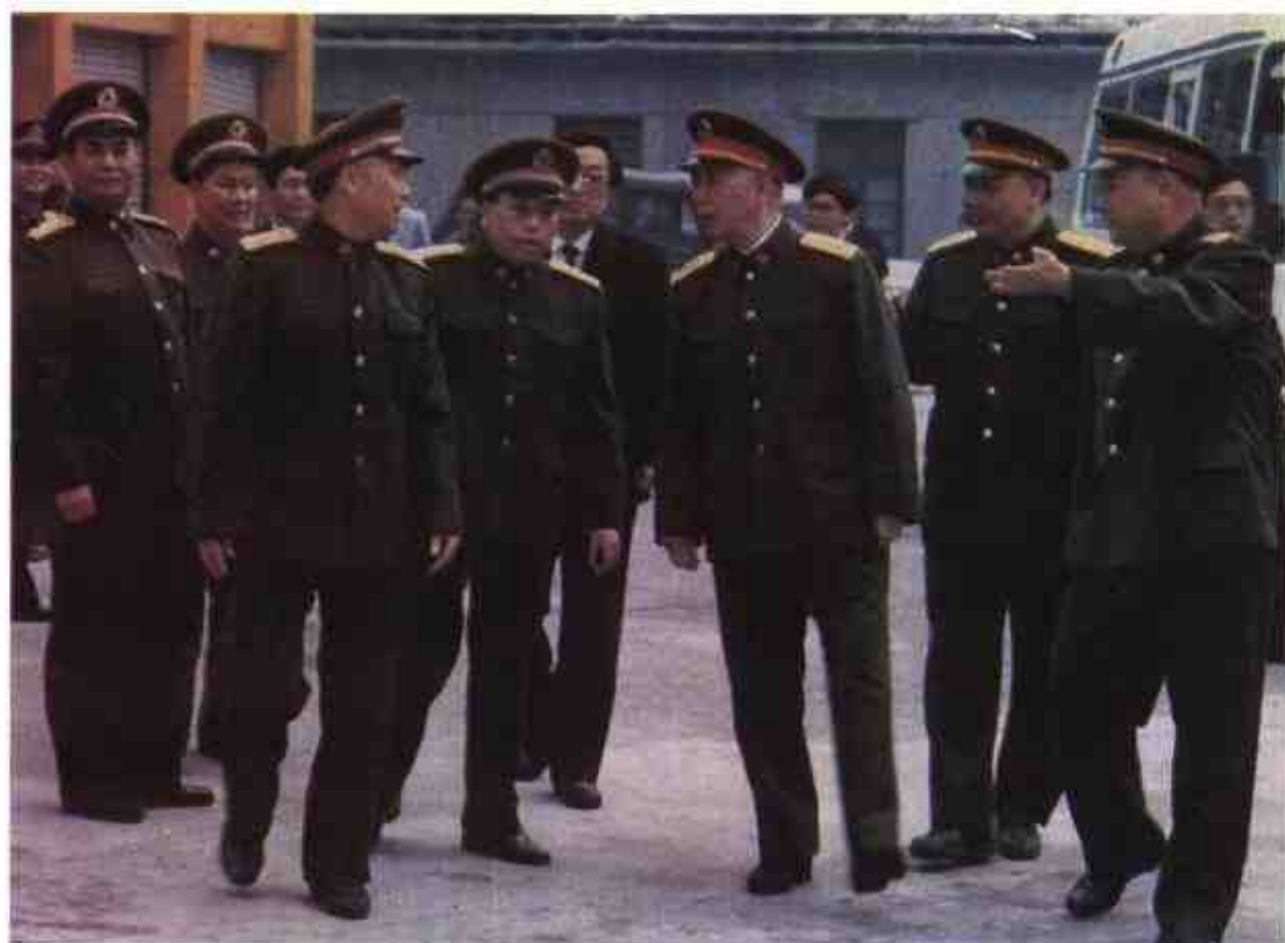
1992年12月，中共中央政治局常委中央军委副主席刘华清上将在广州军区司令员李希林、政委史玉孝、自治区党委副书记丁廷模等陪同下视察军区工作。