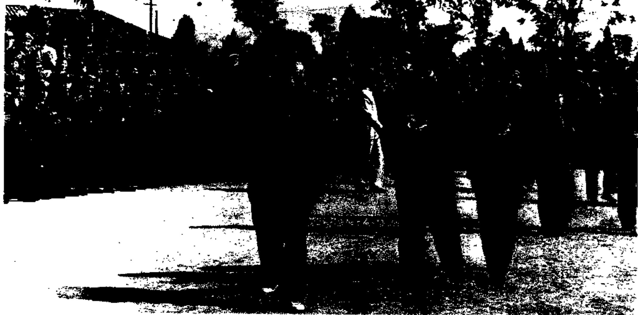
1963年，陈毅元帅在南宁接见广西军区及驻桂部队指战员。