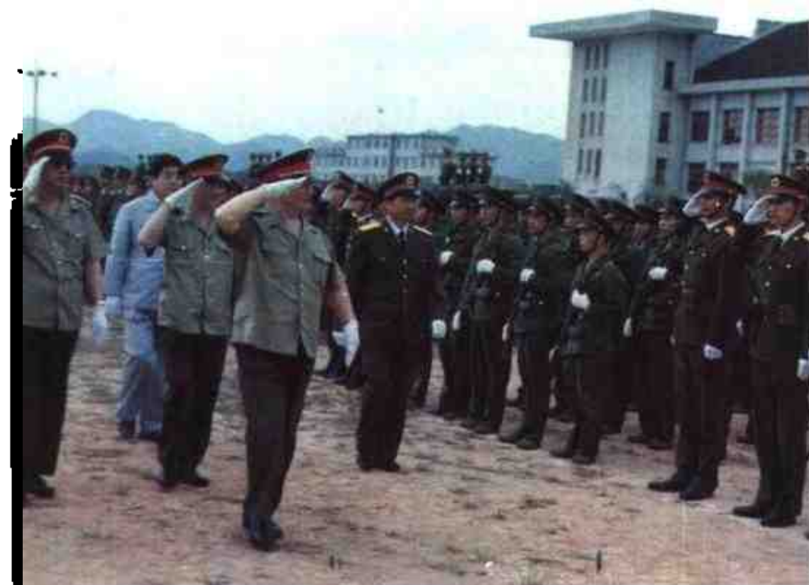
1990年3月，中央军委委员、总参谋长迟浩田上将，副总参谋长韩怀智中将在广州军区司令员张万年，自治区党委副书记刘明祖陪同下检阅广西军区部队。