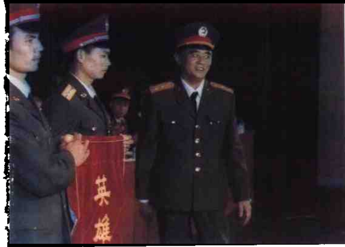
1988年11月7日,根据中央军委主席邓小平授予54261部队侦察连以“英雄侦察连”称号的命令,广州军区副司令员刘存智中将给侦察连授奖旗。