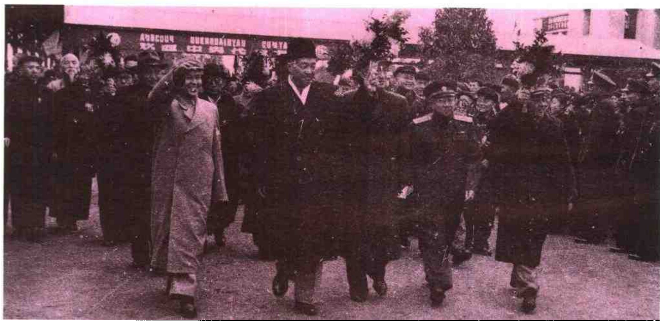
1958年3月，贺龙元帅在南宁接见广西军区及驻桂部队指战员。