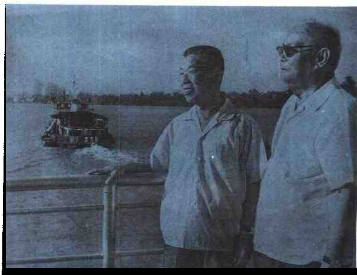
1975年9月，中央军委副主席叶剑英元帅在广西军区第一政委乔晓光陪同下视察广西。