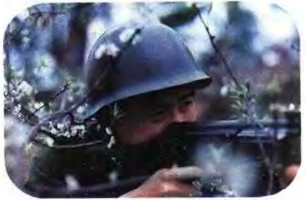
步枪手实弹射击训练。