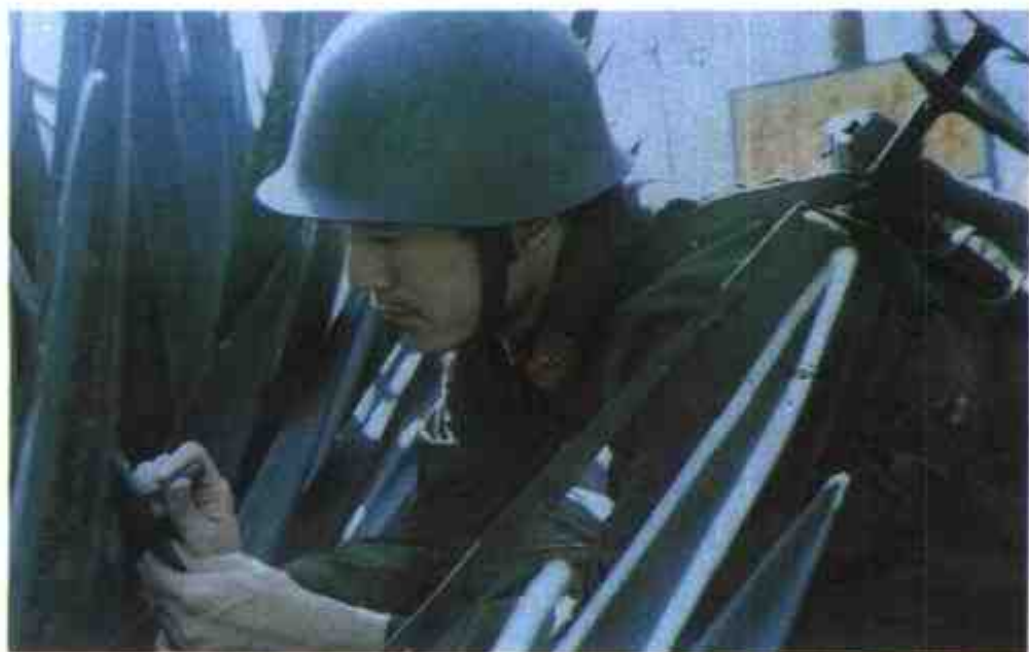
80年代初,边防部队兴起了在阵地、哨所周围的剑麻上刻写诗歌活动。图为54265部队剑麻诗林一角。