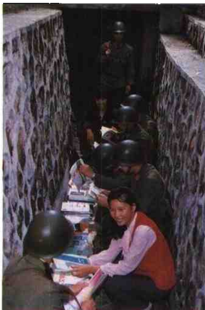
1981年,54256部队与驻地新华书店建立起阵地“流动图书馆”。