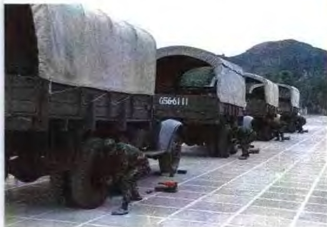
1990年,军区运输分队进行技术比武。