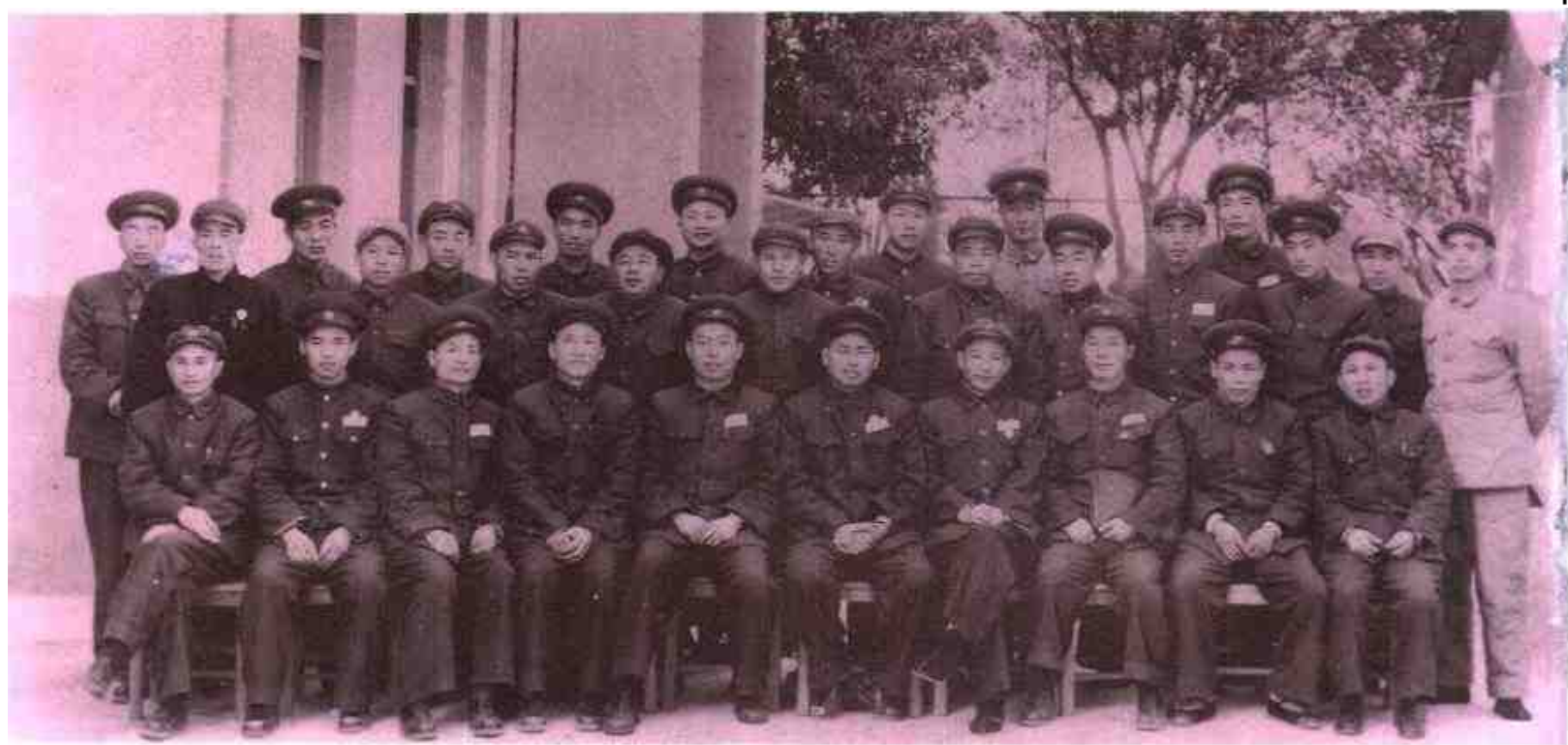
1951年2月，广西军区召开党委扩大会议，部署在1月底前消灭广西境内股匪的作战任务。图为与会人员合影。