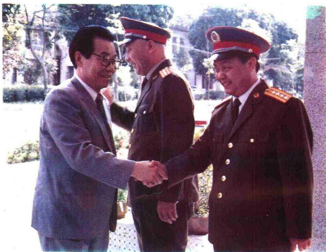
1993年3月，中共中央政治局常委、全国政协主席李瑞环视察军区工作。