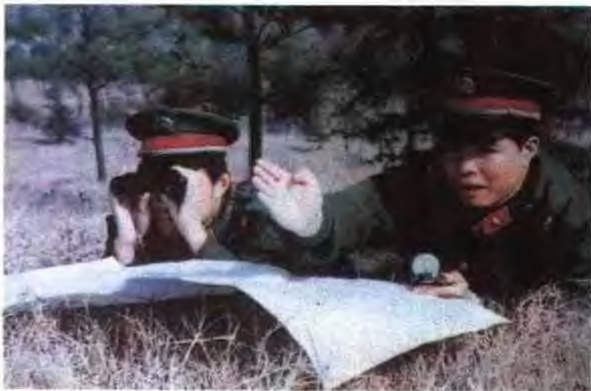
1987年，军区师团机关参谋演练基本功。