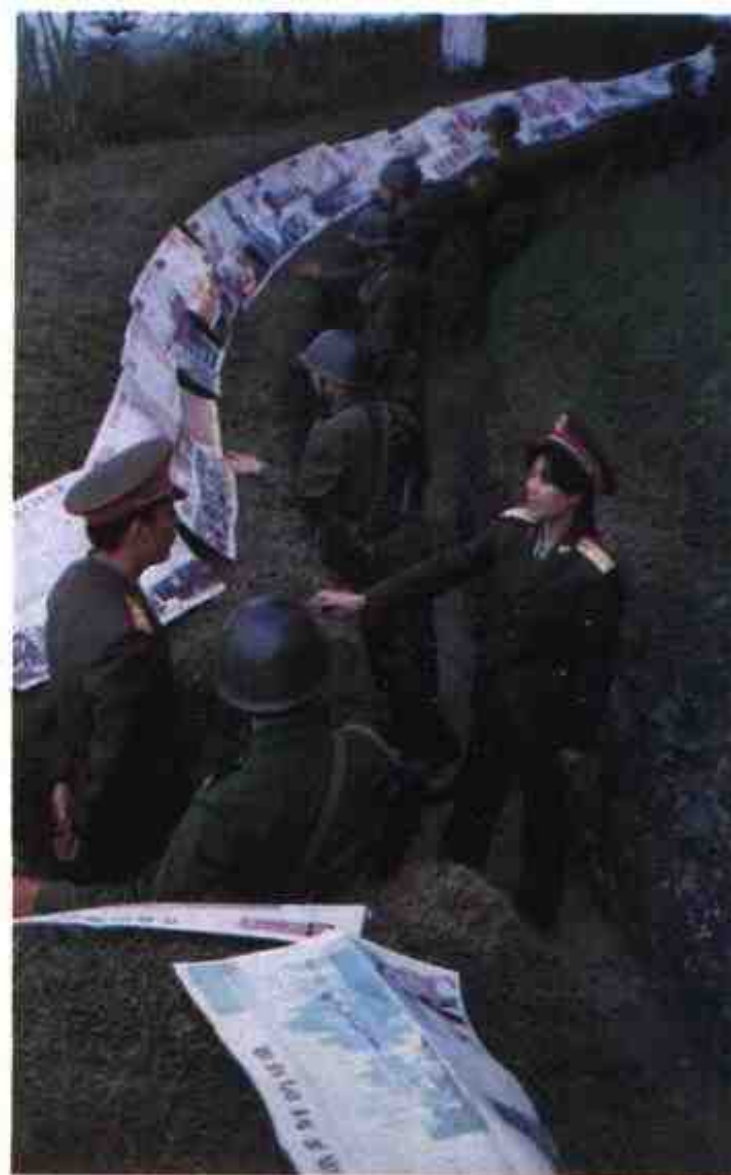
1991年,军区卫生部门到边防阵地进行防病、治病、计划生育宣传。