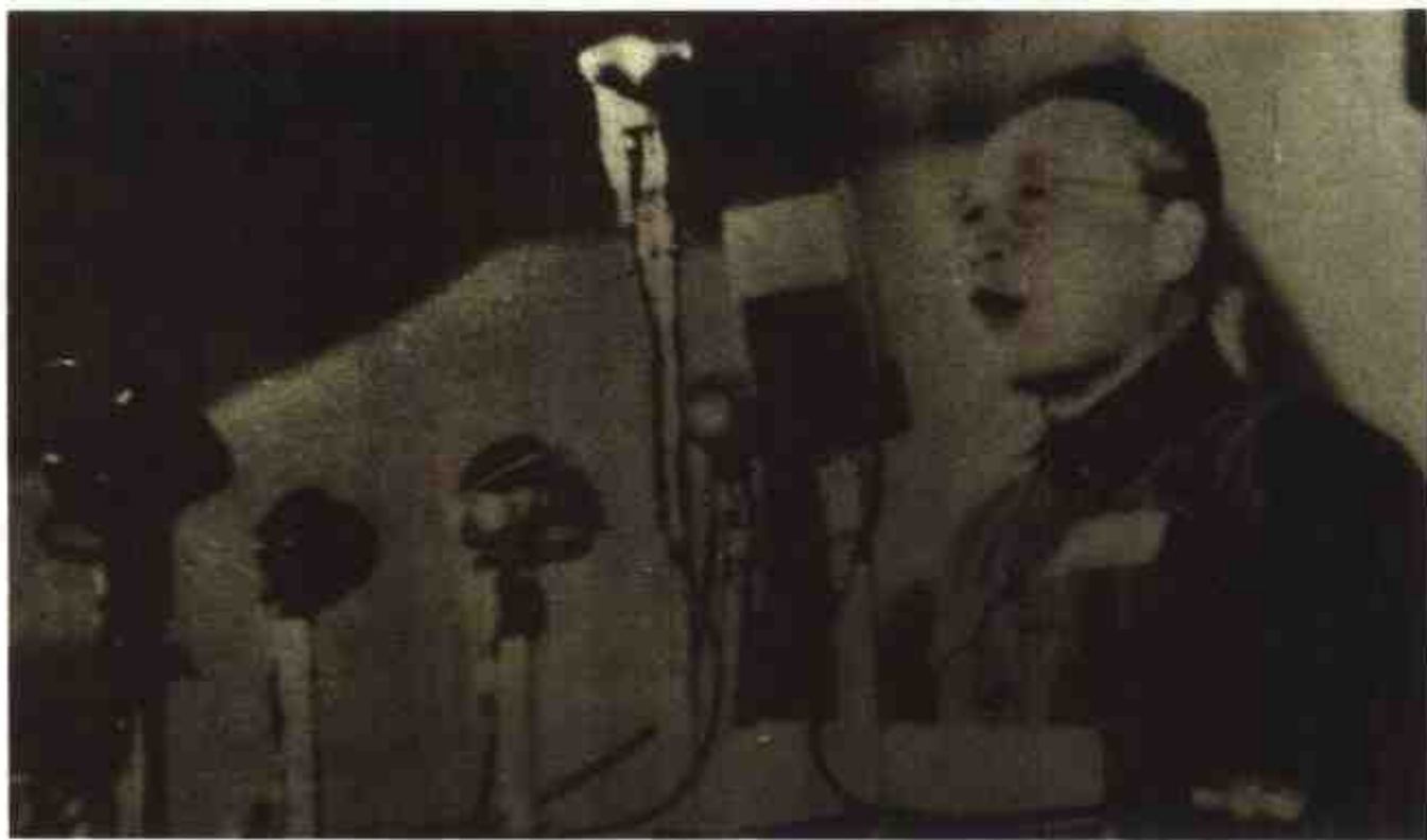
1950年底，广西军区司令员兼政治委员张云逸在军区工作会议上讲话。