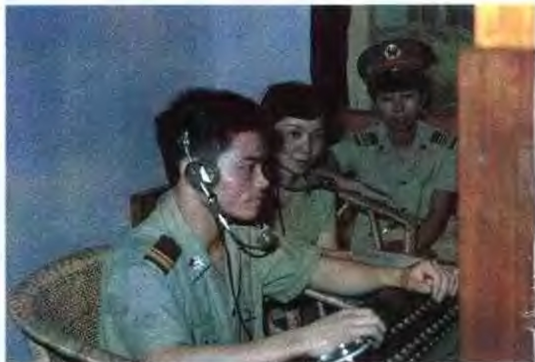
通信兵在进行技术考核。