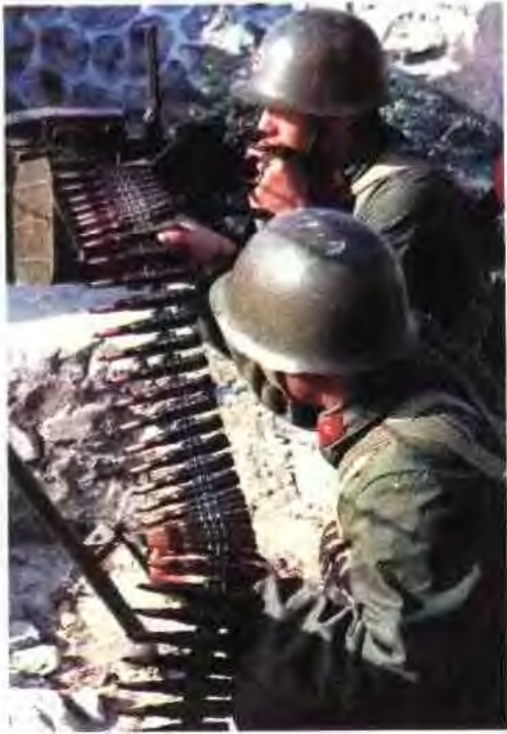
机枪手实弹射击训练。