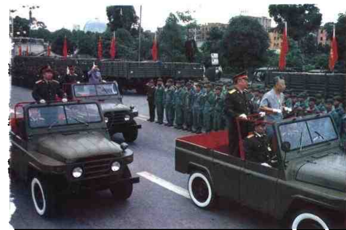
1992年6月15日,自治区党委书记赵富林、自治区主席成克杰、军区司令员文国庆、政委张国初检阅民兵预备役部队。