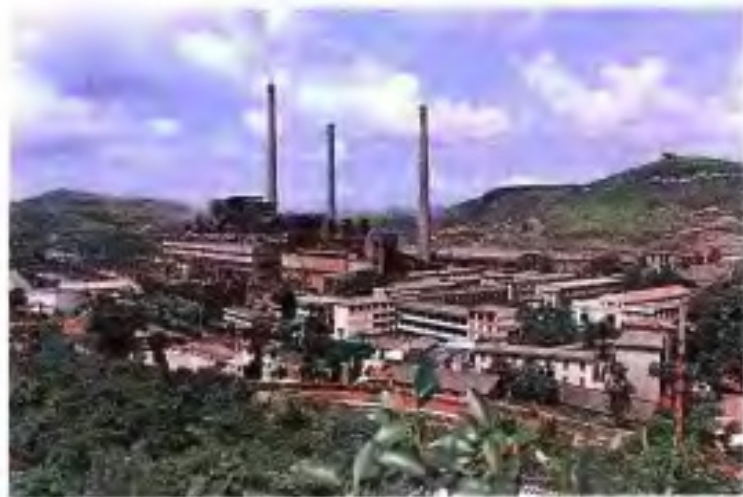
◀ 合山火电厂全貌。该厂于1967年开工，先后经3次扩建，至1986年共建成装机52.5万千瓦。