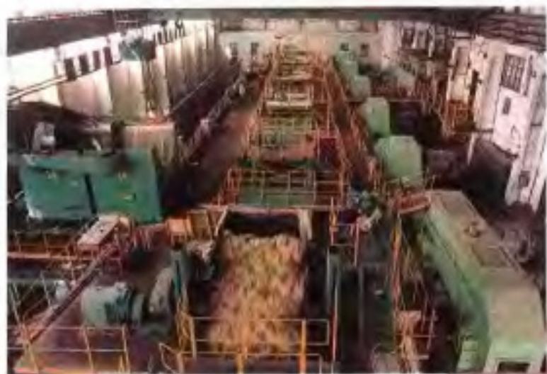
◀广西贵糖(集团)股份有限公司制糖厂压榨车间一景。该公司前身为宜县糖厂,于1954年开工,1956年投产,日榨甘蔗1500吨。改革开放后经过连续改造,至90年代,已成为日榨万吨的大厂。