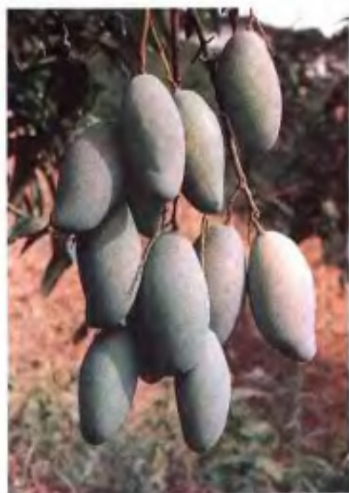
▶ 荔枝和龙眼在广东省保存甚多，品种，如妃子笑，以其独特的香气著称，近年龙眼类荔枝品种较多。