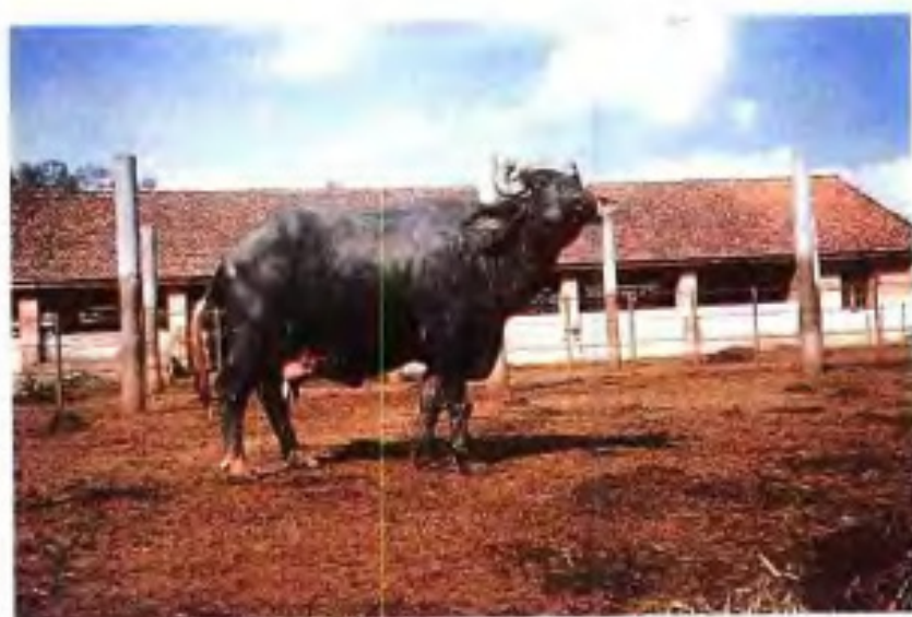
▲广西畜牧研究所饲养水牛。