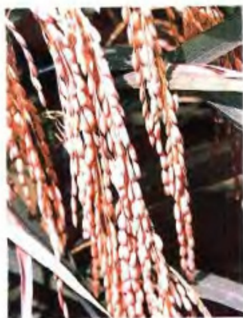
▲北流市种植的桂优63号品种。