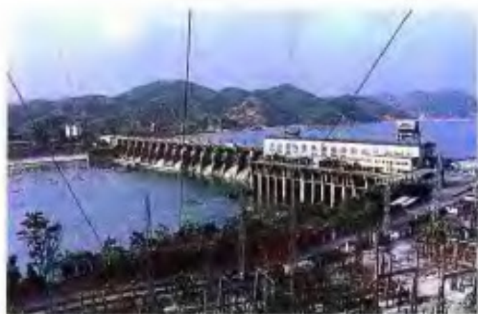
▲ 西湾水电站全貌。该电站于1958年开工，1964年1号机组投产，1979年4台机组全部建成，总装机23.44万千瓦。