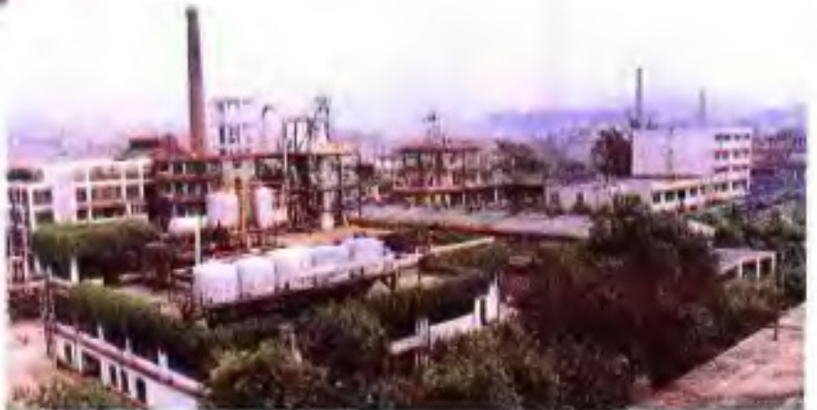
◀贺县纸浆厂。该厂“七五”计划期间进行前期工作，1991年9月开始建设，1994年建成，设计能力为5万吨。