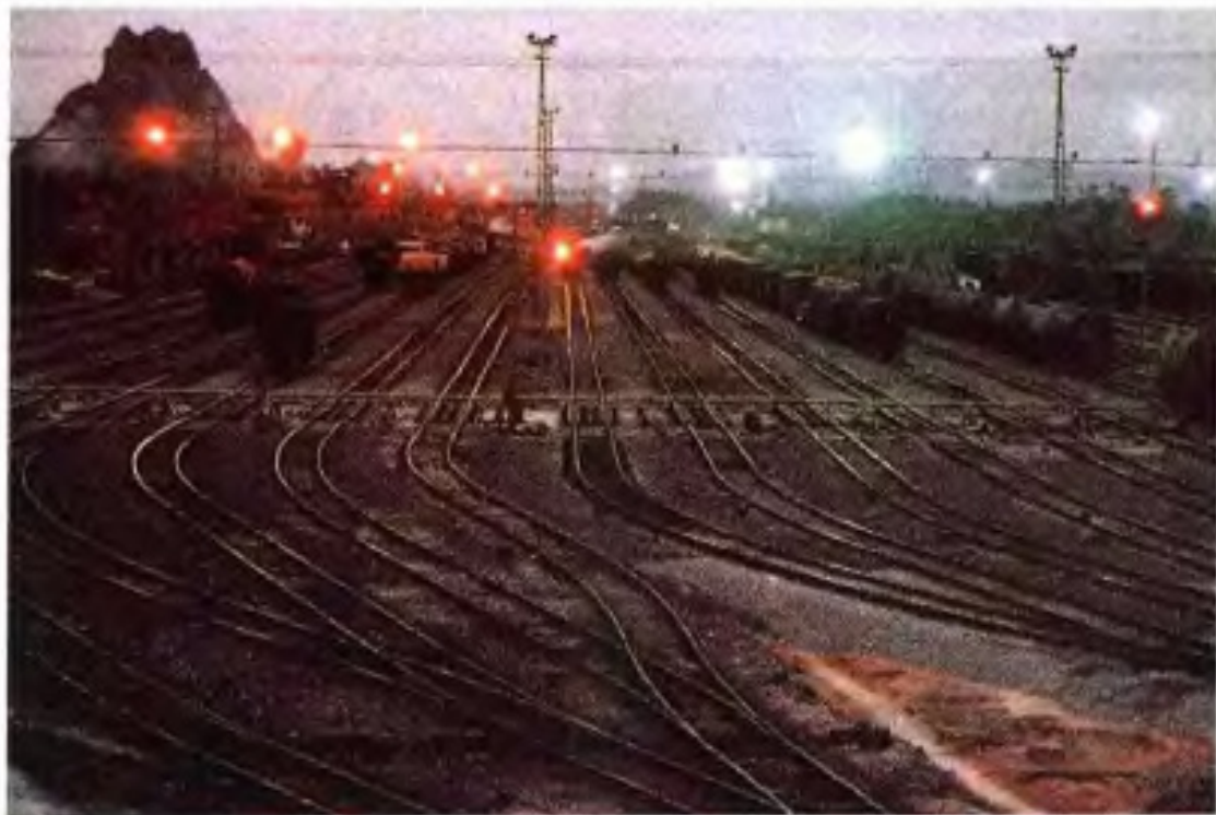
▲柳州铁路编组站扩建工程于1990年6月3日全部建成投产。使列车编解能力由原来每日4200辆增加到6200辆。