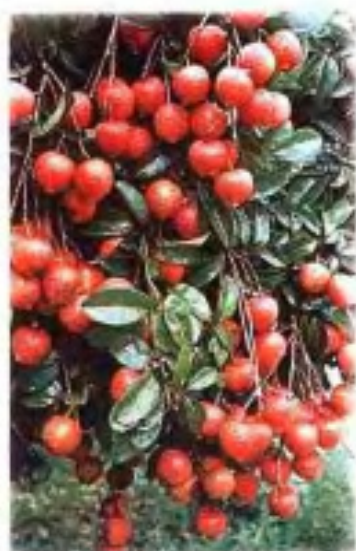
◀ 北的高原盛产的桂味荔枝