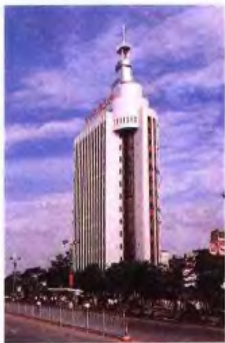
◀南宁电信大楼建筑面积16247平方米，高79.7米，1988年11月竣工，1991年8月投入使用。