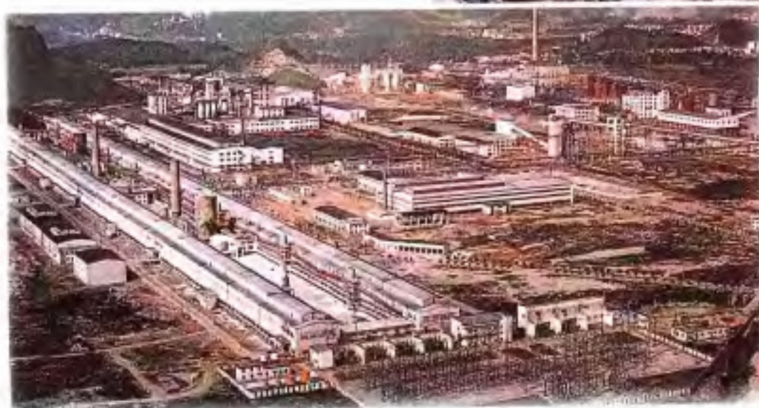
▶平果铝业公司厂区。该厂于80年代完成建设前期工作,引进法国技术。第一期工程年产氧化铝30万吨、电解铝10万吨,于1991年开工,1995年建成投产。