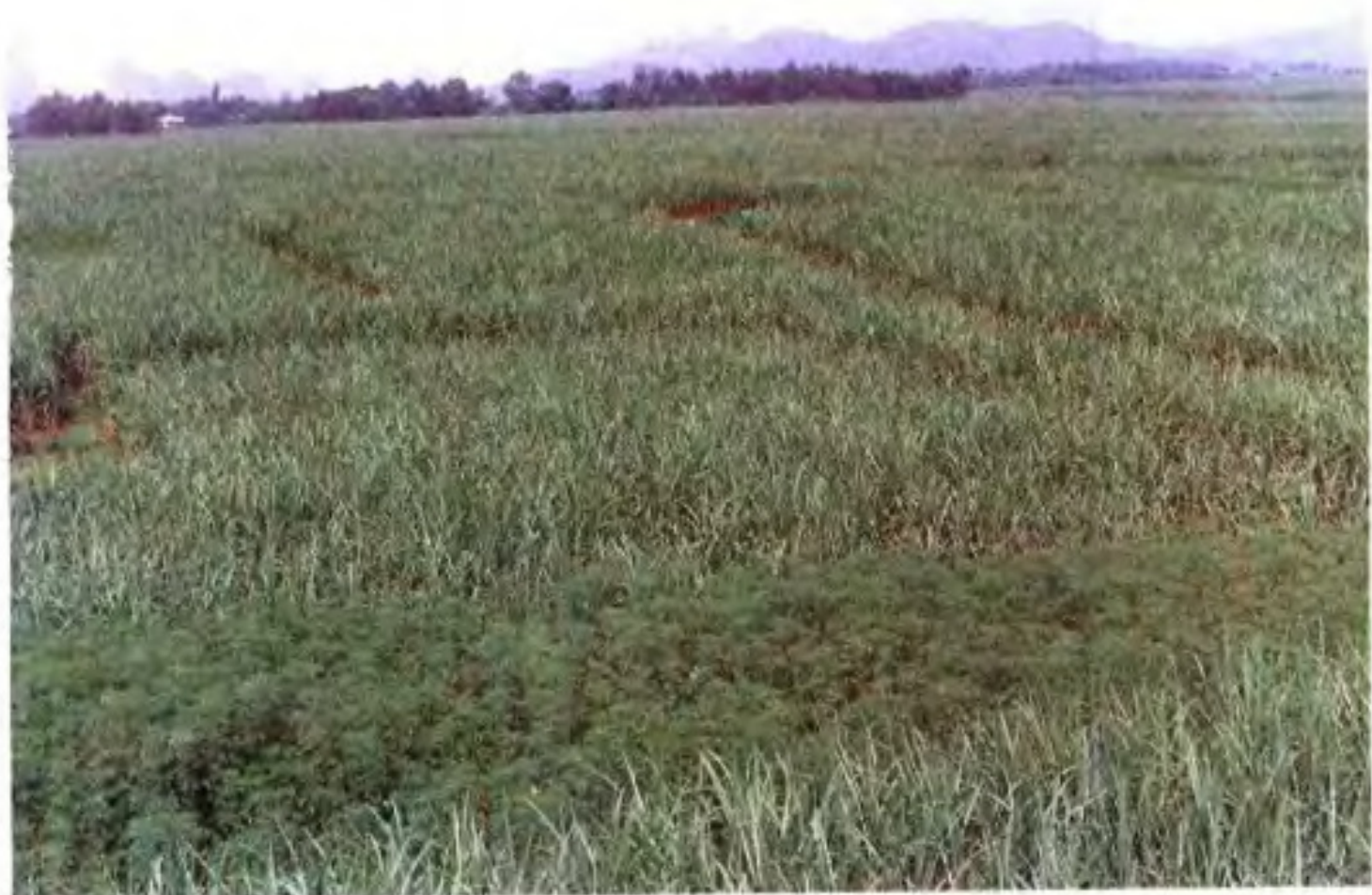
▲崇左县左州乡甘蔗林。崇左县是广西糖业生产基地之一，1990年甘蔗种植面积23.8万亩，人均产蔗2.76吨，名列全自治区之首。