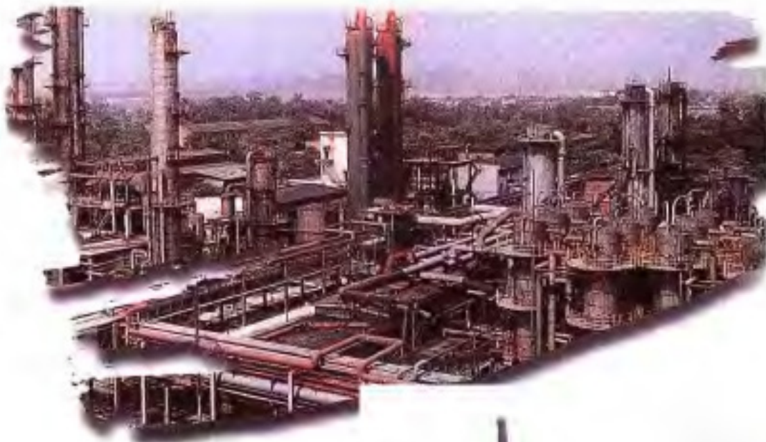
◀柳州化肥厂厂区一角。该厂于1967年建成，初期年生产能力为合成氨4.5万吨。经改造、扩建，现生产规模为年产合成氨18万吨、硝酸铵12.5万吨、尿素15万吨、纯碱、氯化铵、磷酸氢钙各4万吨。