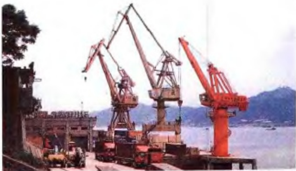
▶梧州西江码头是广西客货轮直通香港、澳门的内河港口。年吞吐能力700万吨。