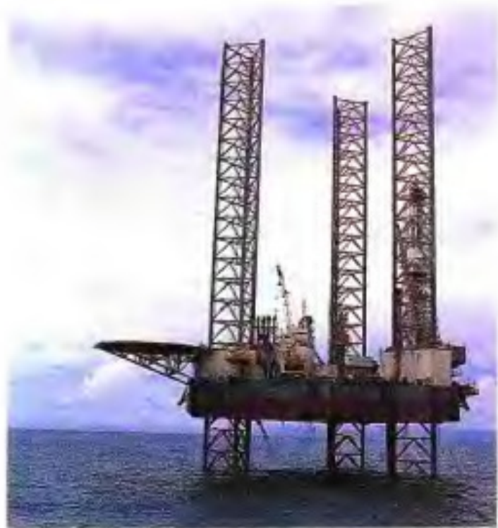
◀ 北部湾石油钻井平台。