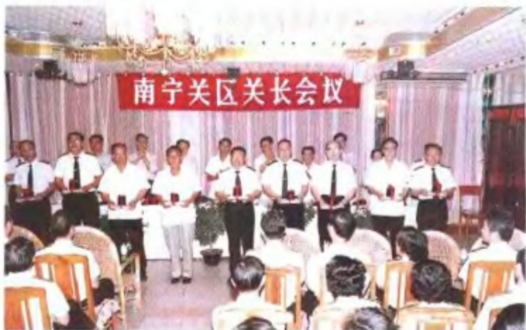
1988年，海关总署给35年海关关龄的关员授予荣誉纪念章和荣誉证书。