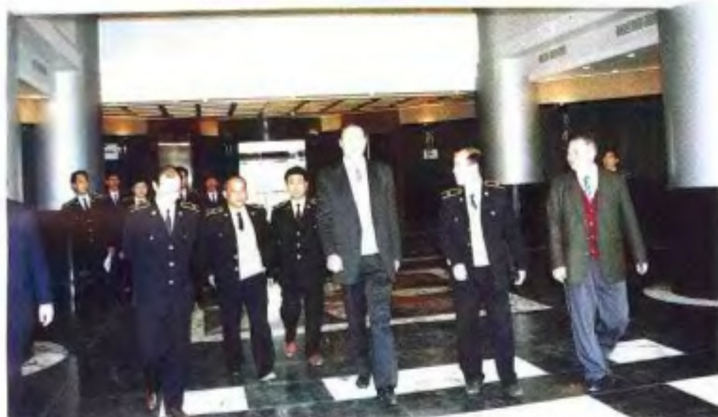
1995年 国家海关总署 钱冠林署长 视察 南宁海关。