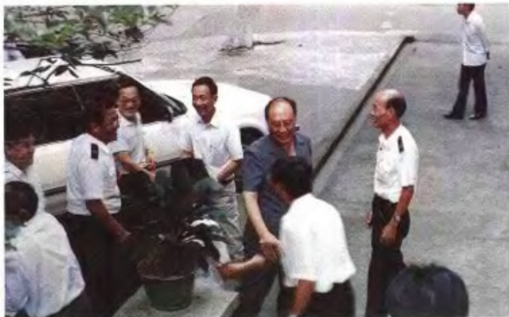
1990年 国家海关总署 航志署长 视察 南宁关区。