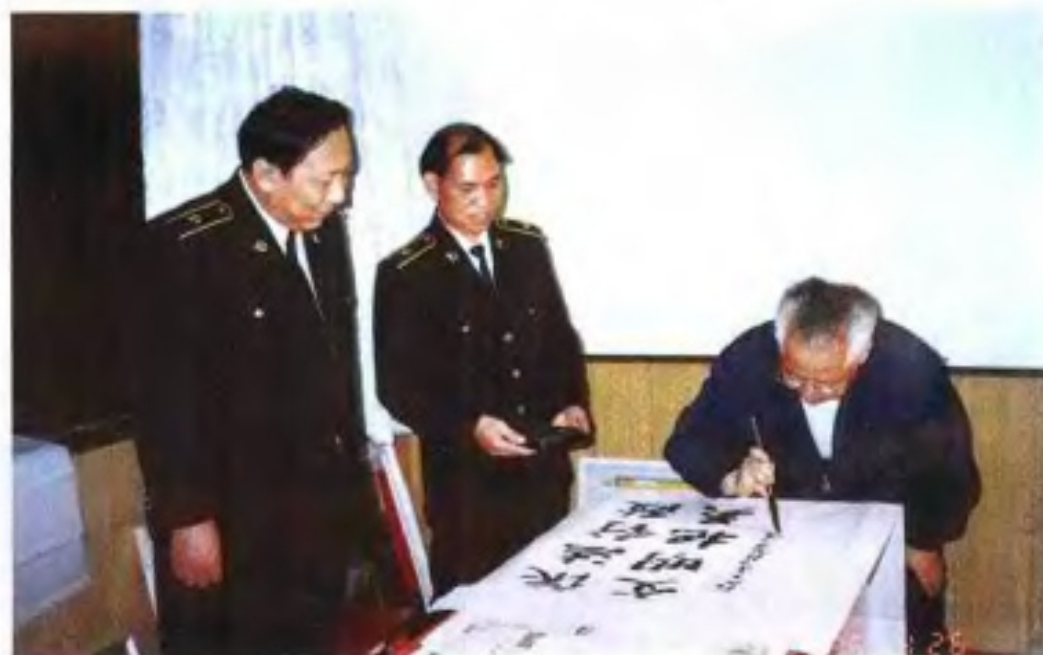
1998年，自治区 党委书记 林彪视察 南宁海关。