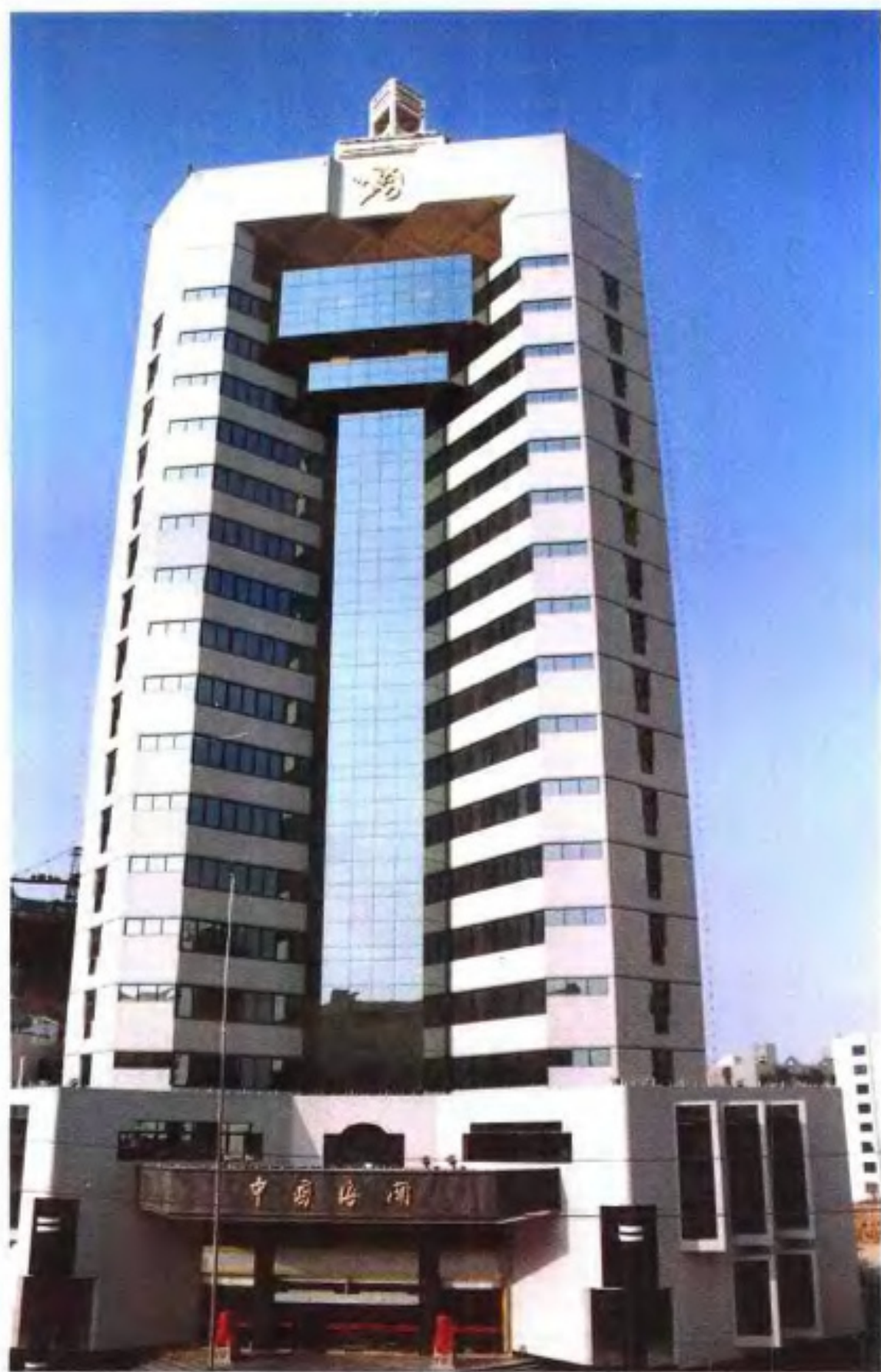
中华人民共和国南宁海关业务技术楼(1995年)。