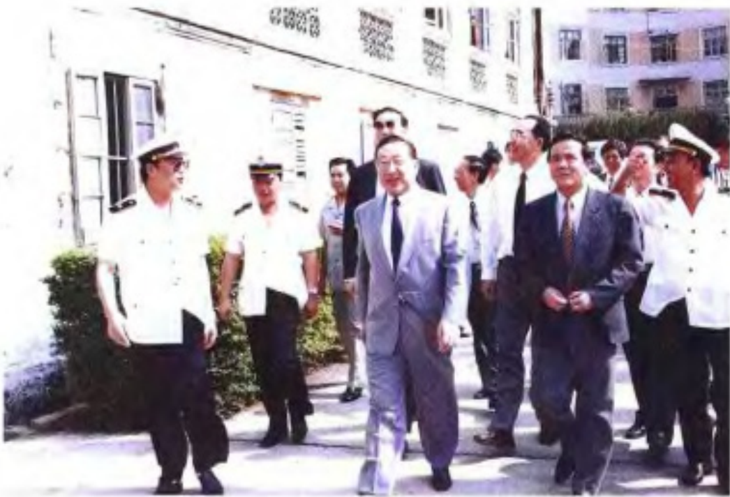
1993年10月李岚清副总理在自治区主席成克杰陪同下视察北海海关。