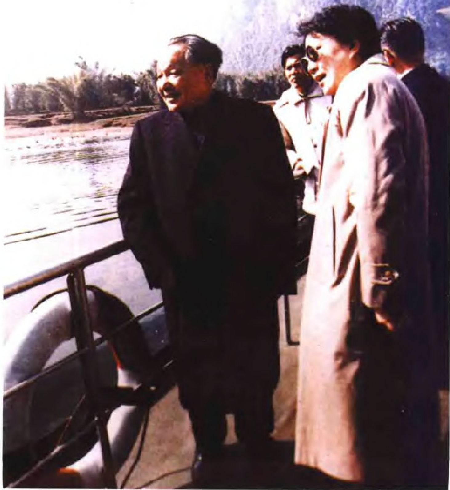
1986年1月，中共中央军委主席，中共中央顾问委员会主任邓小平在桂林视察。