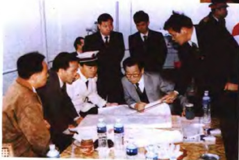
1993年4月，政协全国委员 会主席李瑞环视察钦州港。