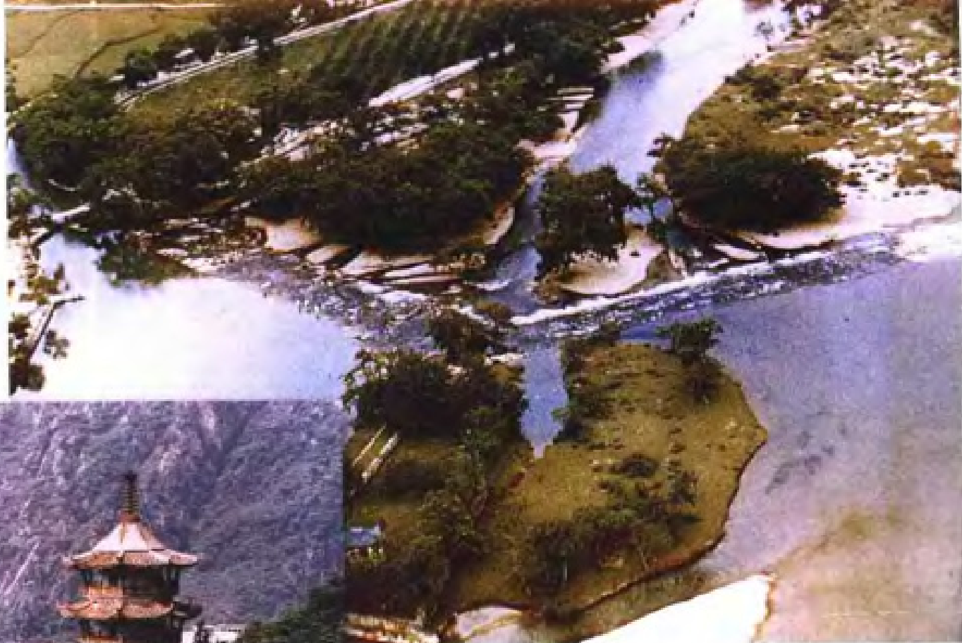
秦始皇时修建灵渠。图为灵渠的榨嘴。