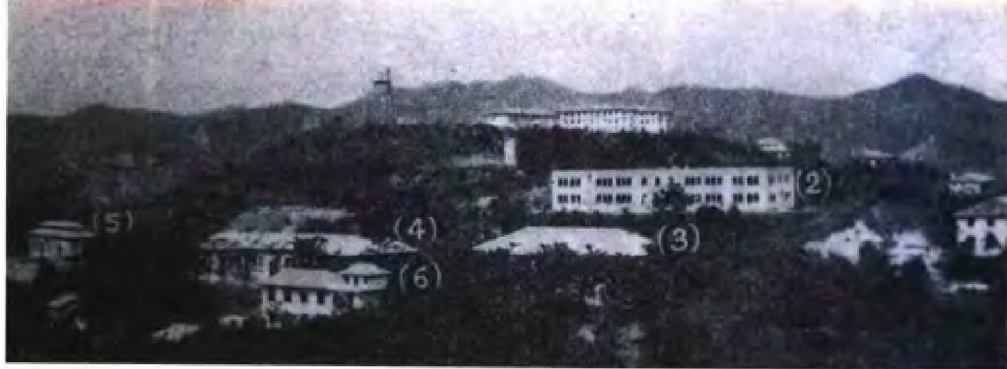
民国17年(1928年)，广西大学在梧州蝴蝶山开办。图为校园远景。