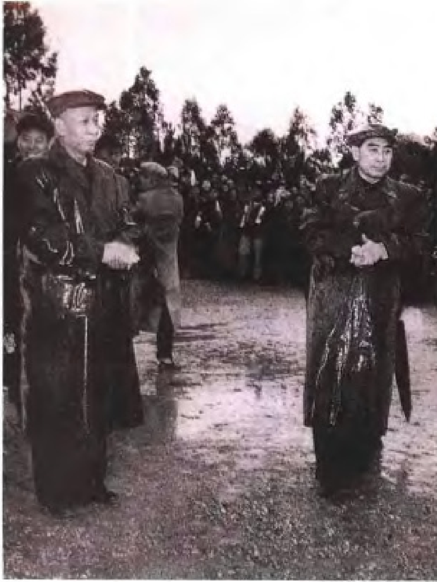
1958年1月22日，中共中央副主席刘少奇、国务院总理周恩来在南宁人民公园接见广西各族人民。