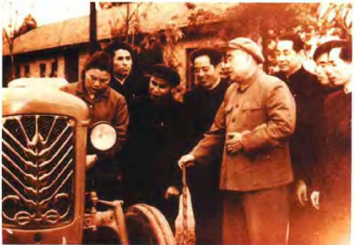
1964年3月，中共中央副主席朱德在柳州机械厂视察。