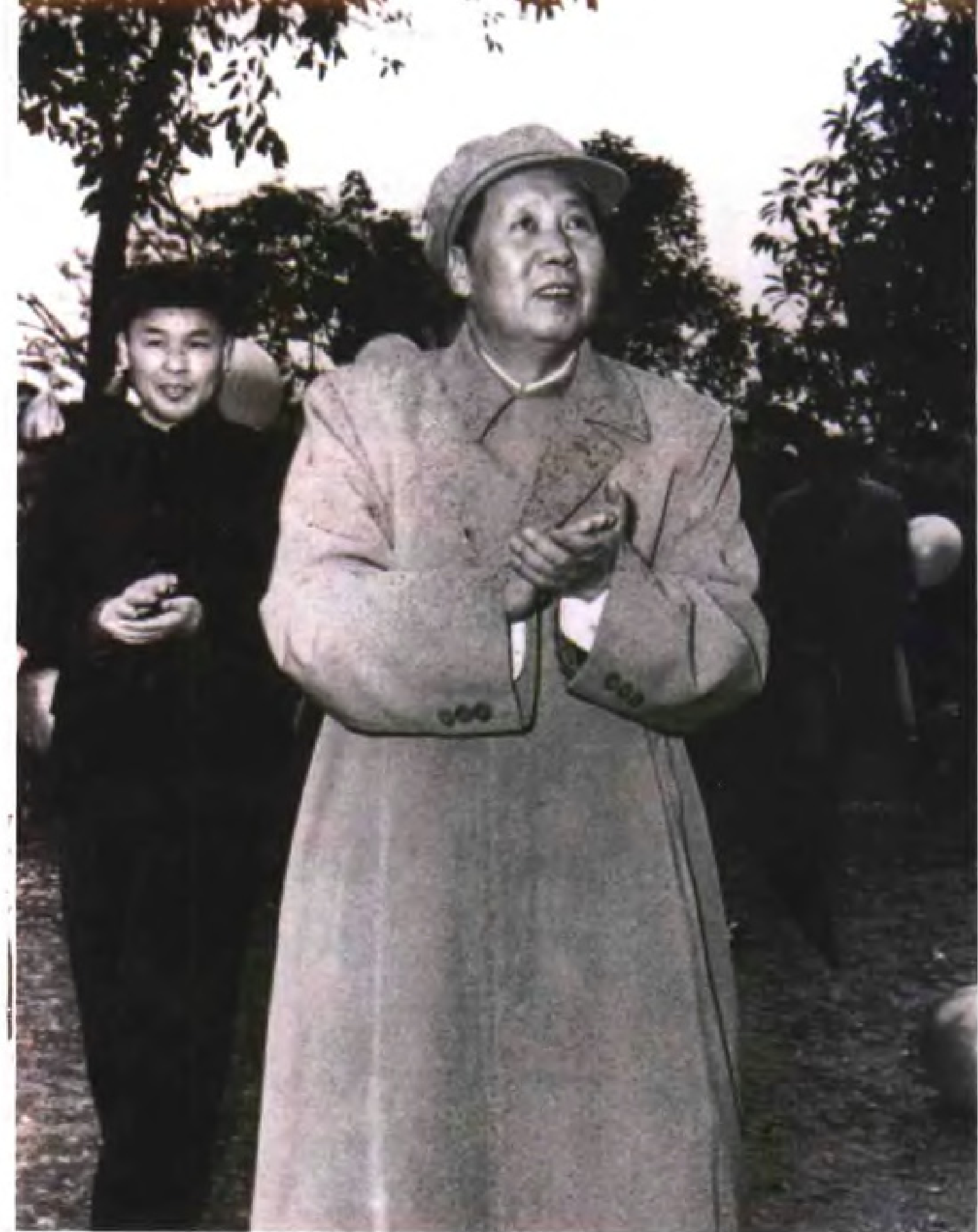
1958年1月22日，中共中央主席毛泽东在南宁人民公园接见广西各族人民。