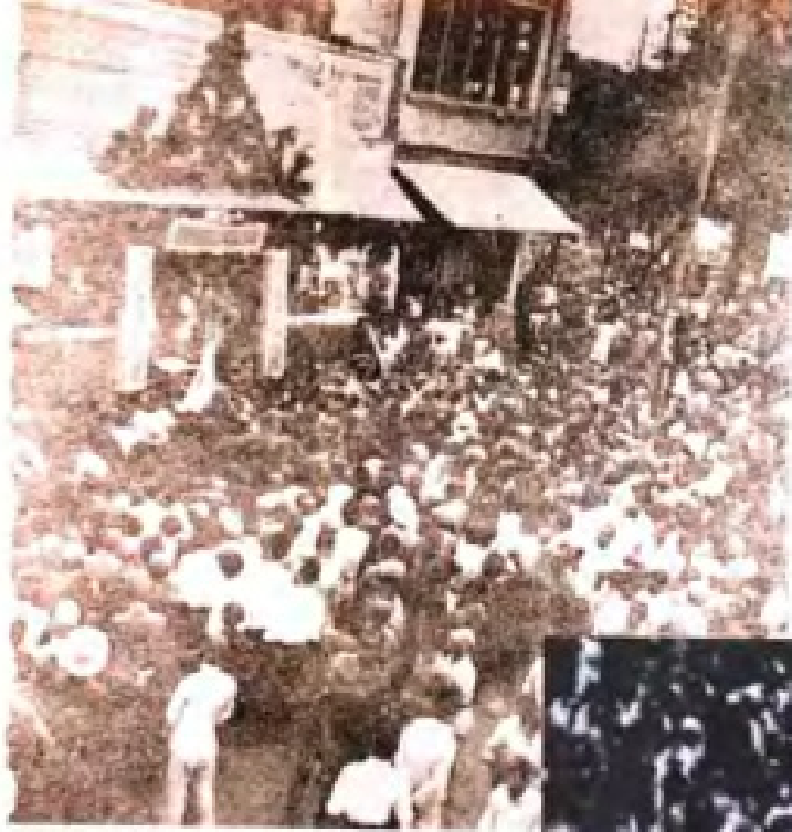
民国33年(1944年)6月,桂林举行万人献金游行,捐献得的钱物分送国共抗日前线。