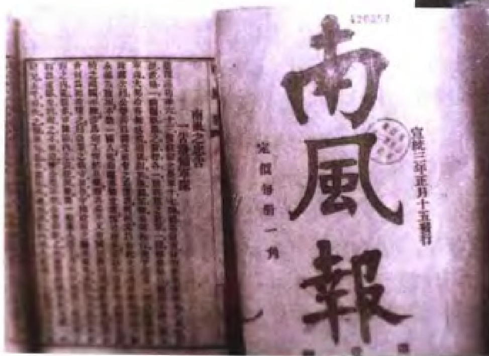
清宣统三年正月十五日(1911年2月13日),广西同盟会支部出版《南风报》宣传革命。