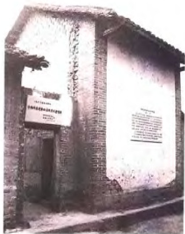
1936年11月7日，中共广西省代表大会在贵县三里罗村召开。图为大会会址。