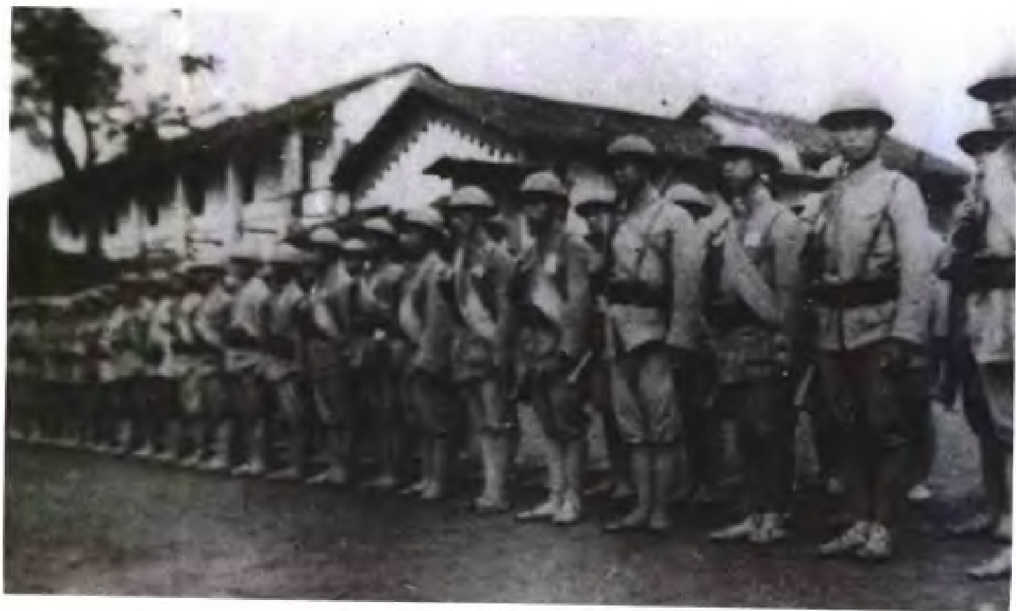
民国27年(1938年),广西当局组建第三届学生军。