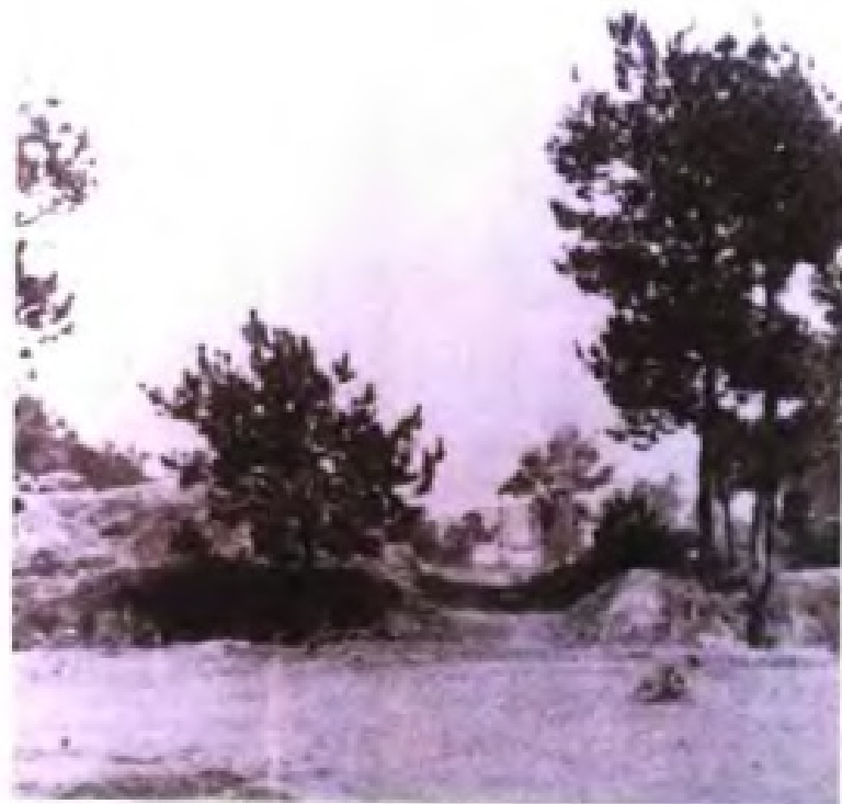
清道光三十年十二月初十日(1851年1月11日),洪秀全率太平军在桂平县金田村起义。图为金田起义营盘。