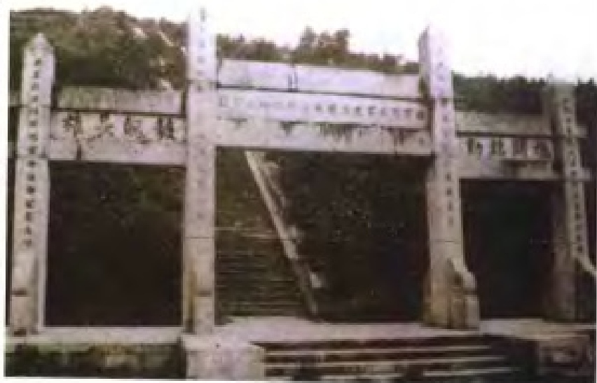
民国28年(1939年),日军入侵桂南,中国军民奋力抵抗。图为昆仑关战役纪念碑。