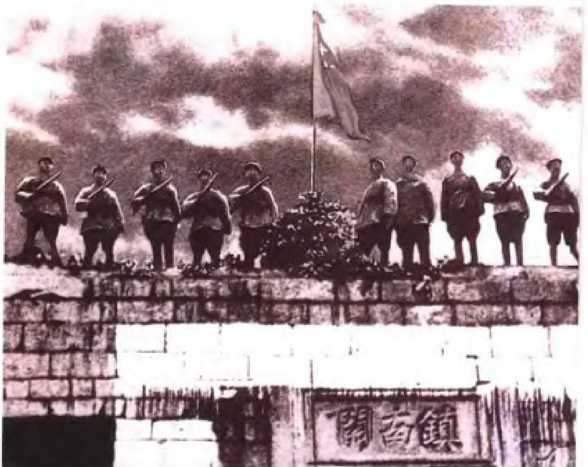
1949年12月11日,中国人民解放军占领中越边境要塞镇南关,宣告广西全境解放。