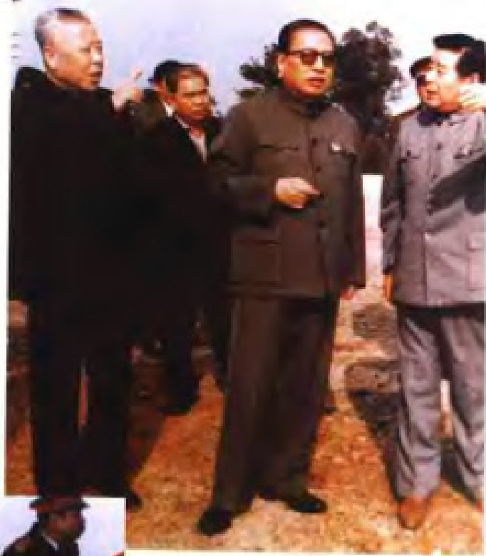
1994年6月，全国人大常 委会委员长乔石在广西视察。