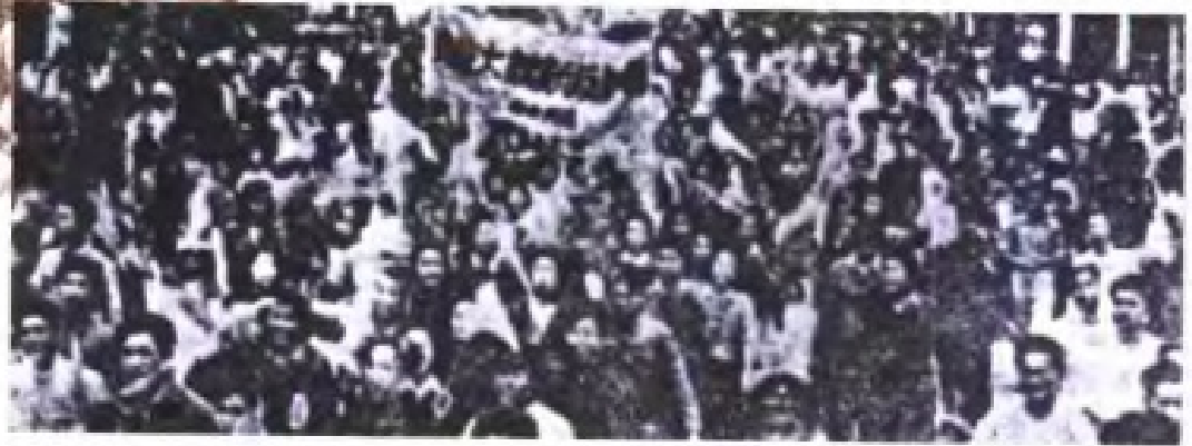
民国36年(1947年)6月4日,桂林女师、桂林中学等校举行反饥饿、反内战游行。