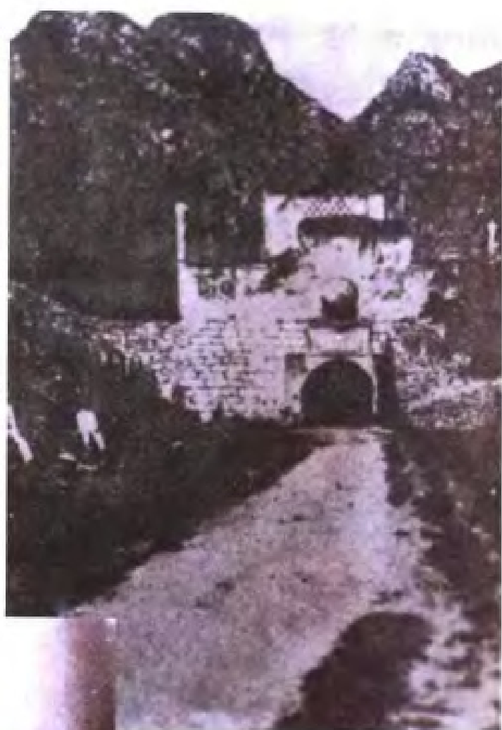
清光绪二十二年(1896年),苏元春督修的广西边境各隘口、炮台、军工路修筑工程竣工。图为位于凭祥的大连城。