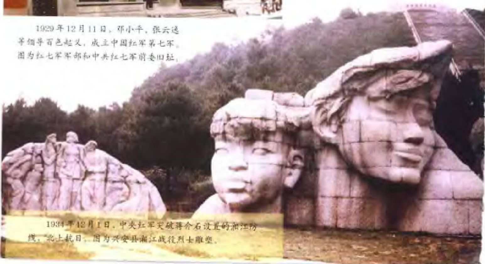
1934年12月1日，中央红军突破蒋介石设置的湘江防线，北上抗日。图为兴安县湘江战役烈士雕塑。