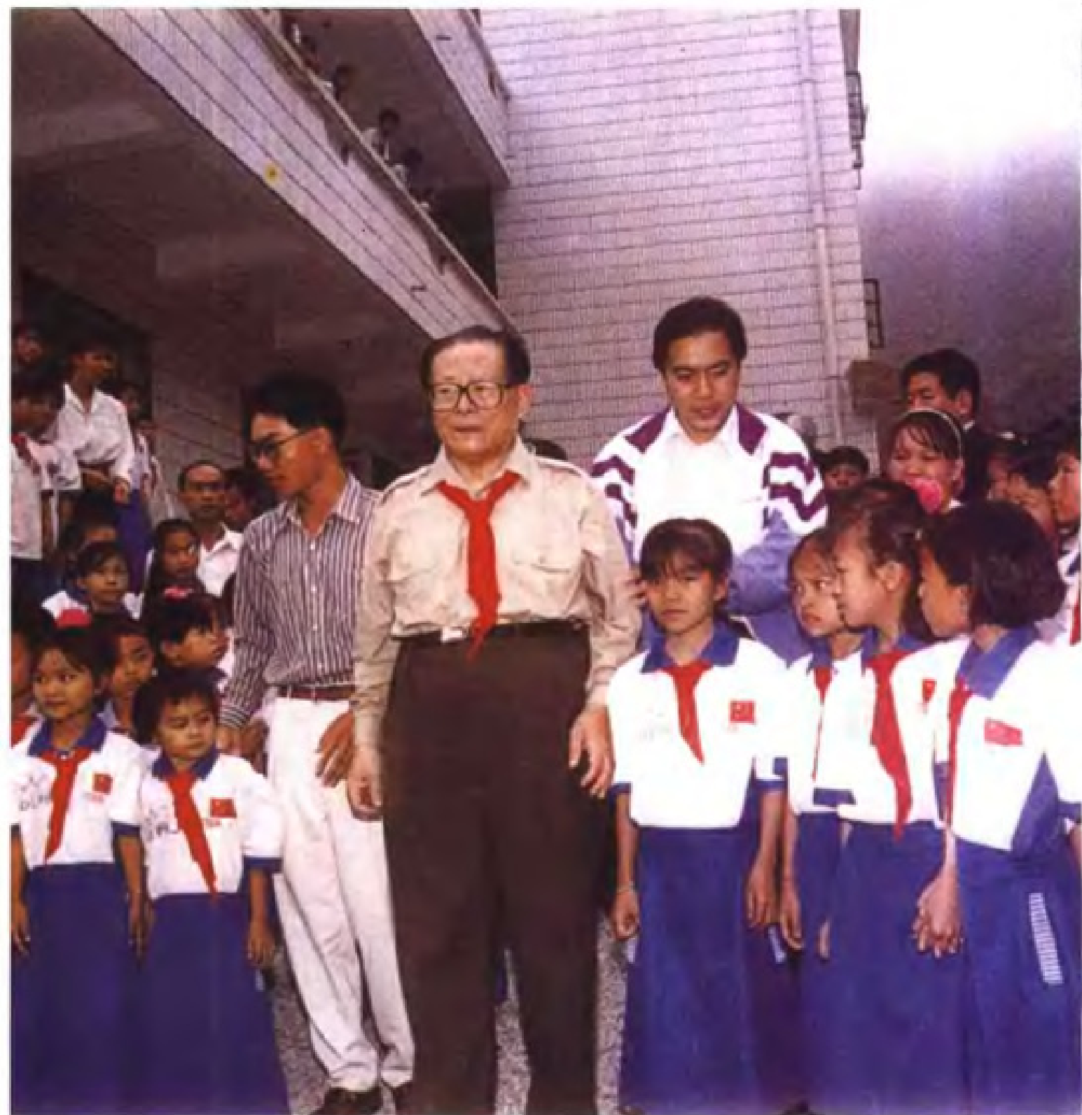
1990年11月和1996年10月，中共中央总书记江泽民先后两次视察广西。图为1996年10月二访田阳县永常村，和孩子们在一起。