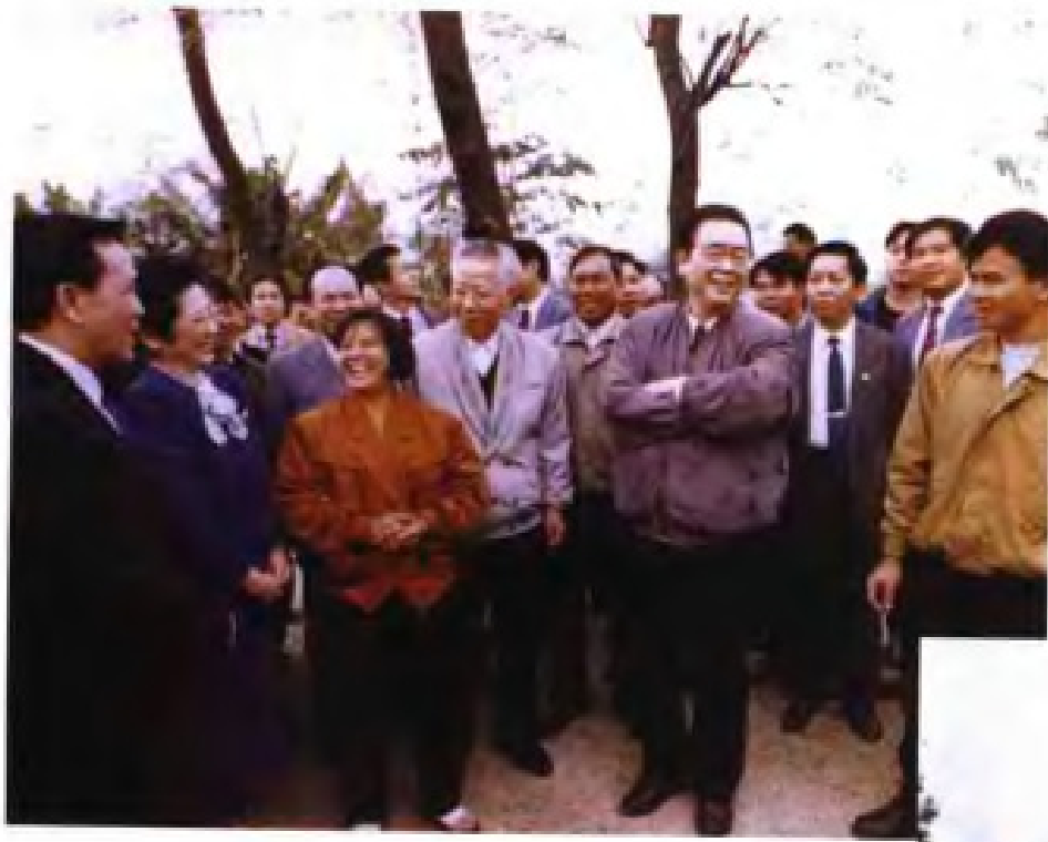
1992年12月，国务院 总理李鹏在南宁郊区视察。