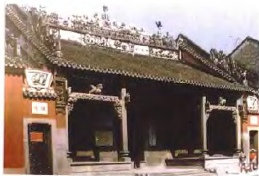
1929年12月11日，邓小平、张云逸等领导百色起义，成立中国红军第七军。图为红七军军部和中共红七军前委旧址。