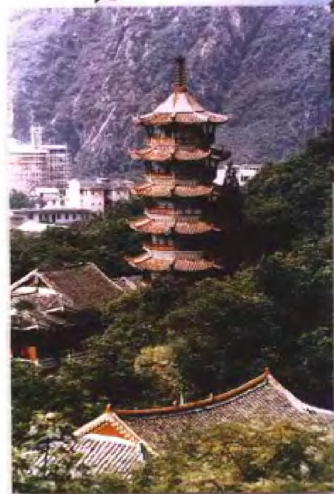
建于唐至德元年(公元756年)的金州湘山寺。