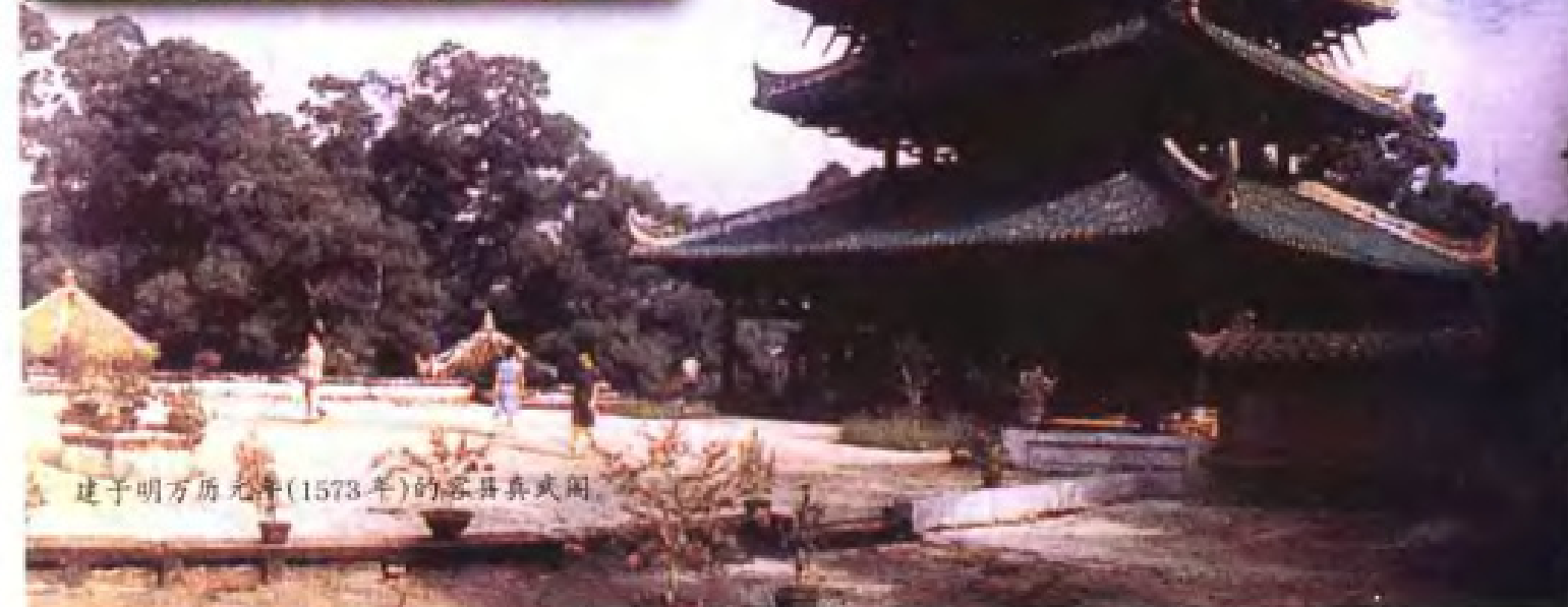
建于明万历元年(1573年)的容县真武阁。