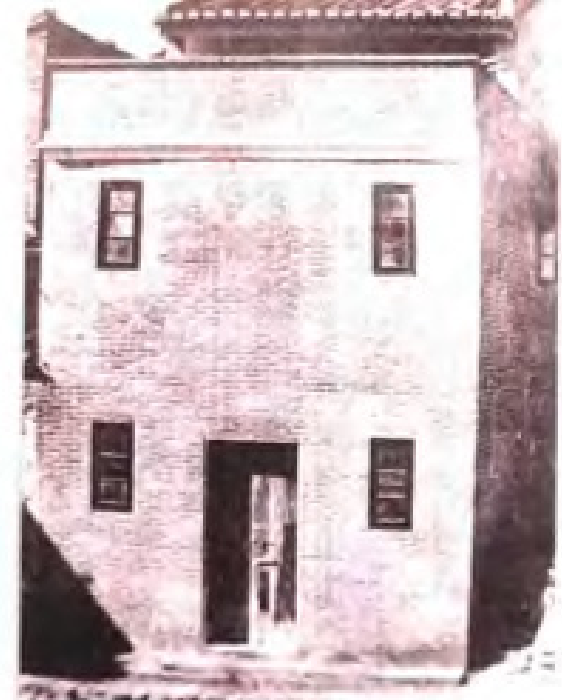
1925年10月，广西第一个中共支部梧州支部成立。图为梧州支部机关旧址。