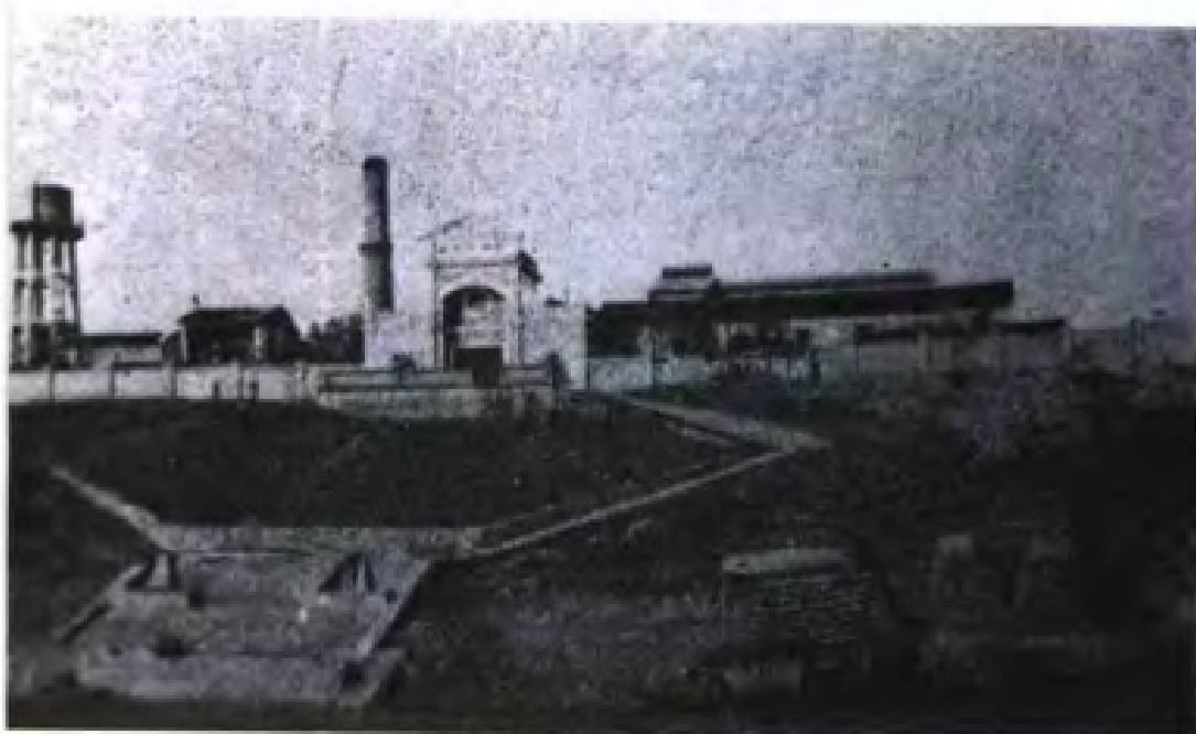
民国21年(1932年) 12月，两广省办硫酸厂 开工制酸。