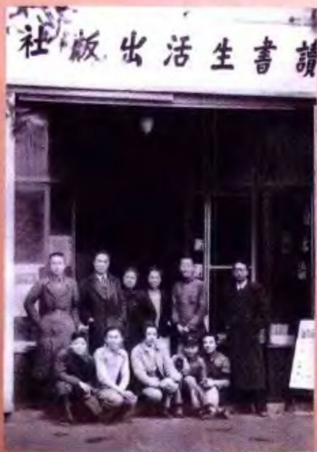
桂林中南路生活书店桂林分店（1938年）