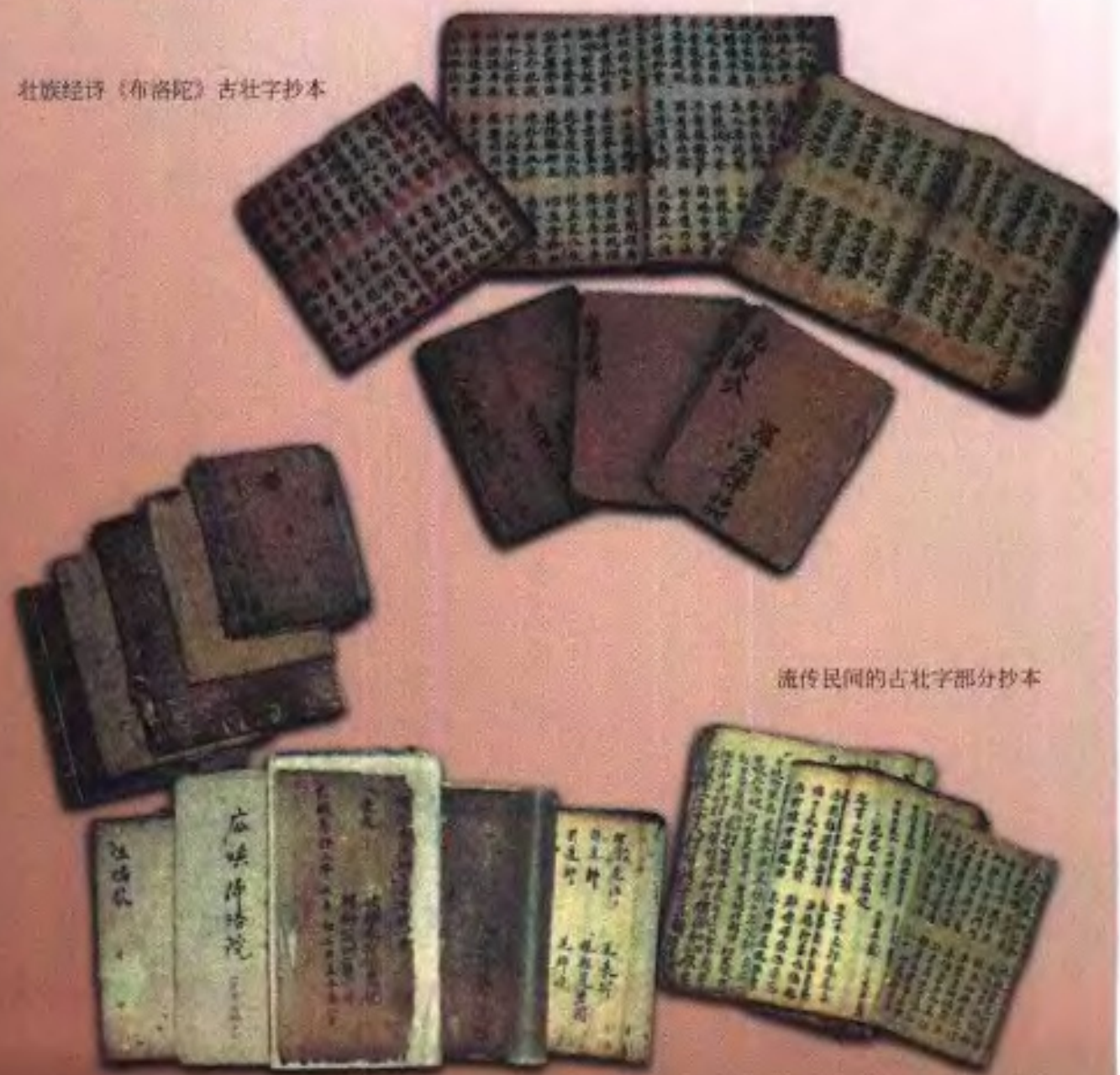
流传民间的古壮字部分抄本