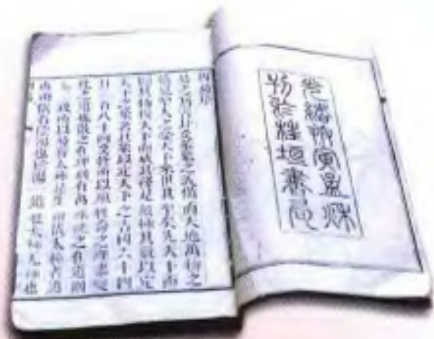
《周易》四卷，桂栢书局于 清光绪十六年（1890年）刻本。