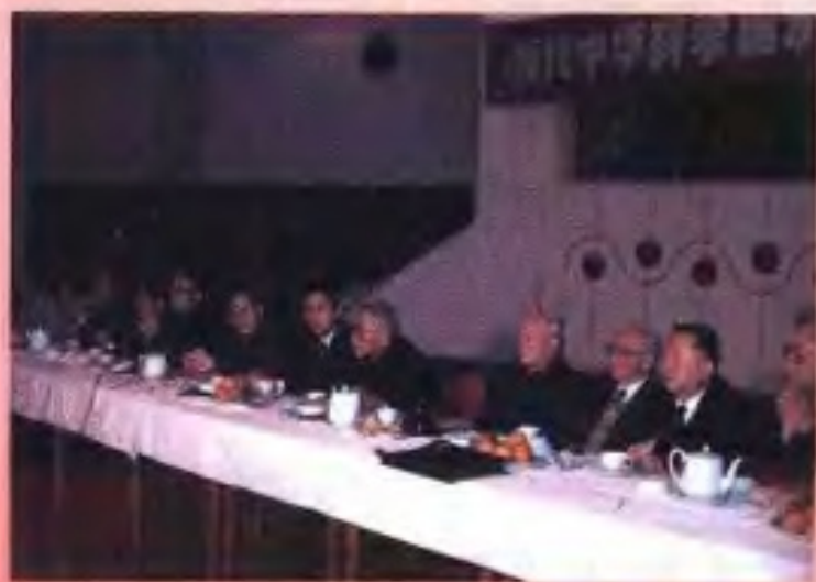
1993年7月，中国科学院院士钱三强（右四）、卢嘉锡（右五）、吴阶平（右二）、周光召（右七）、钱临照（右三）、王选（右一）和自治区副主席李振潜（右六）等出席广西科学技术出版社在北京举行的《当代中华科学英才丛书》首发式。