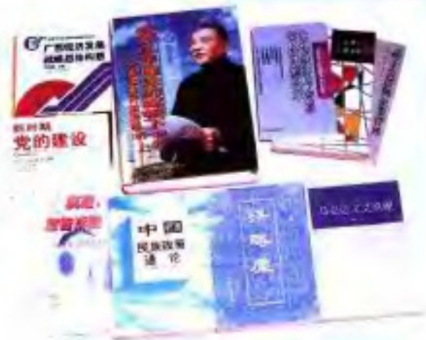
广西出版的部分政治理论类图书