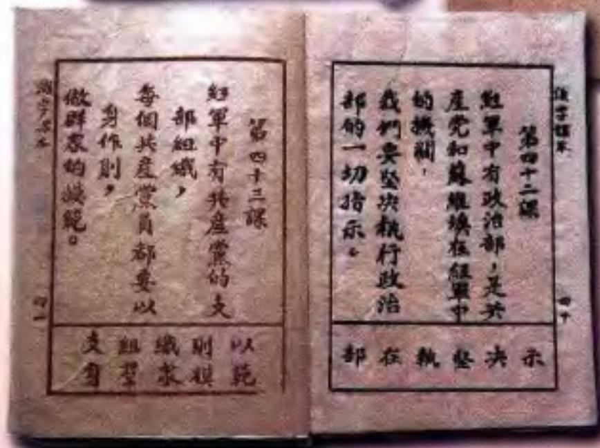
紅七軍 - 紅八軍的出版物