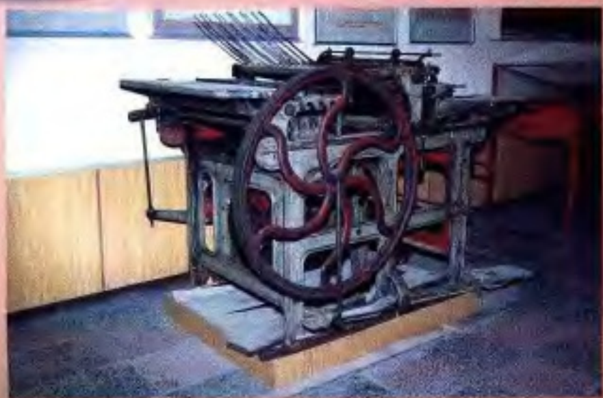
1930年紅八軍使用的印刷機