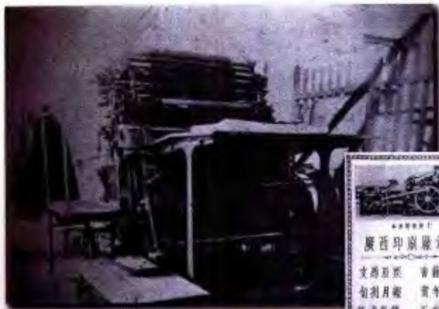
三十年代广西印刷厂使用的 的胶印机