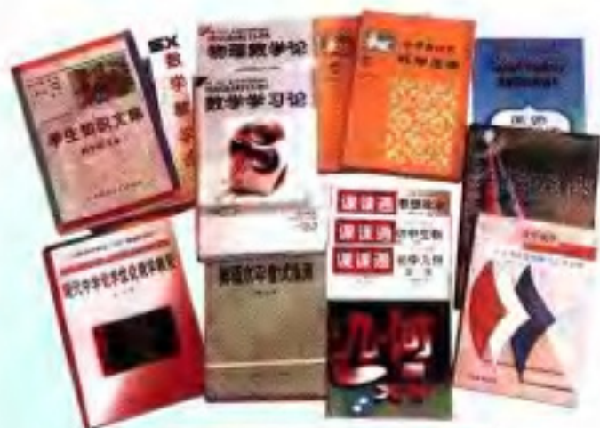
广西出版的部分文化教育类图书