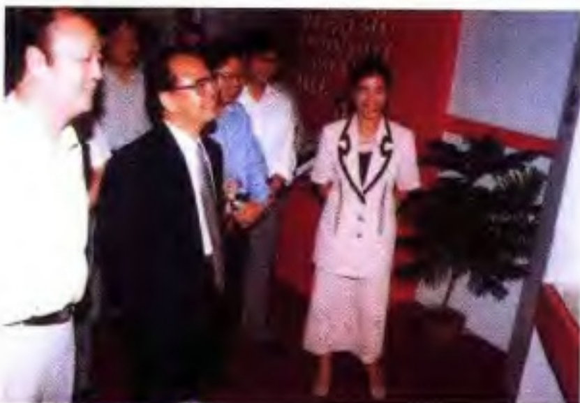
1997年10月，自治区党委书记曹伯纯（左二），自治区党委常委、宣传部部长潘琦（左三）参观广西出版成就展广西人民出版社展馆。