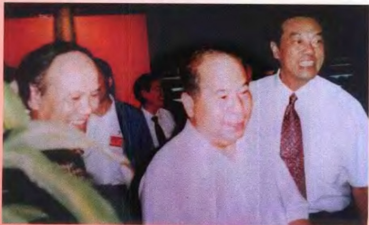
1998年7月，中共中央政治局委员、书记处书记、中纪委书记尉健行（左二）在自治区党委常委、自治区副主席袁正中（右一）陪同下参观中国出版成就展广西展厅。