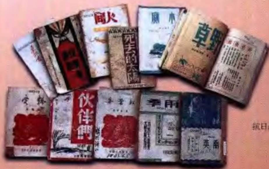
抗日战争时期广西出版的部分图书