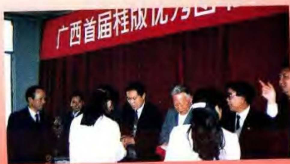
1991年11月，首届“桂版优秀图书奖”颁奖会上，自治区副主席李振潜（右四）、自治区人民政府顾问王祝光（右三）给获奖编辑颁奖。