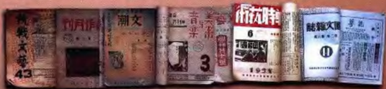
抗日战争时期广西出版的部分期刊