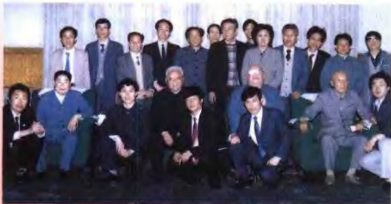
1989年4月26日，广西师范大学出版社在北京人民大会堂举办《当代青年群星谱》新闻发布会，中顾委常委杨得志（坐排左一）、刘澜涛（坐排左二）、江华（坐排左三）、吕正操（坐排右一），团中央书记处书记刘延东（后排右五）和自治区党委常委、自治区教育委员会主任侯德彭（右六）到会并与与会者合影。