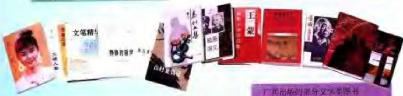
广西出版的部分文学类图书