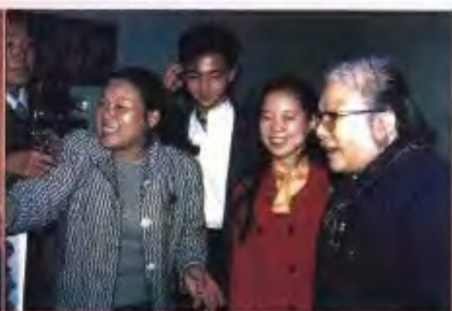
1989年11月，全国政协副主席康克清（右一）在北京中国美术馆参观授力出版社主办的“海峡两岸少年画家画展”。