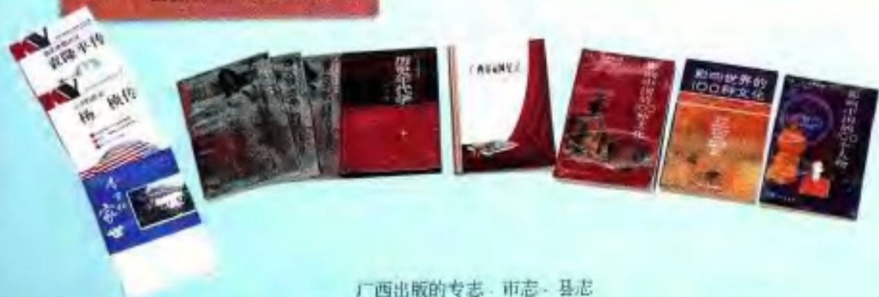
广西出版的专志·市志·县志