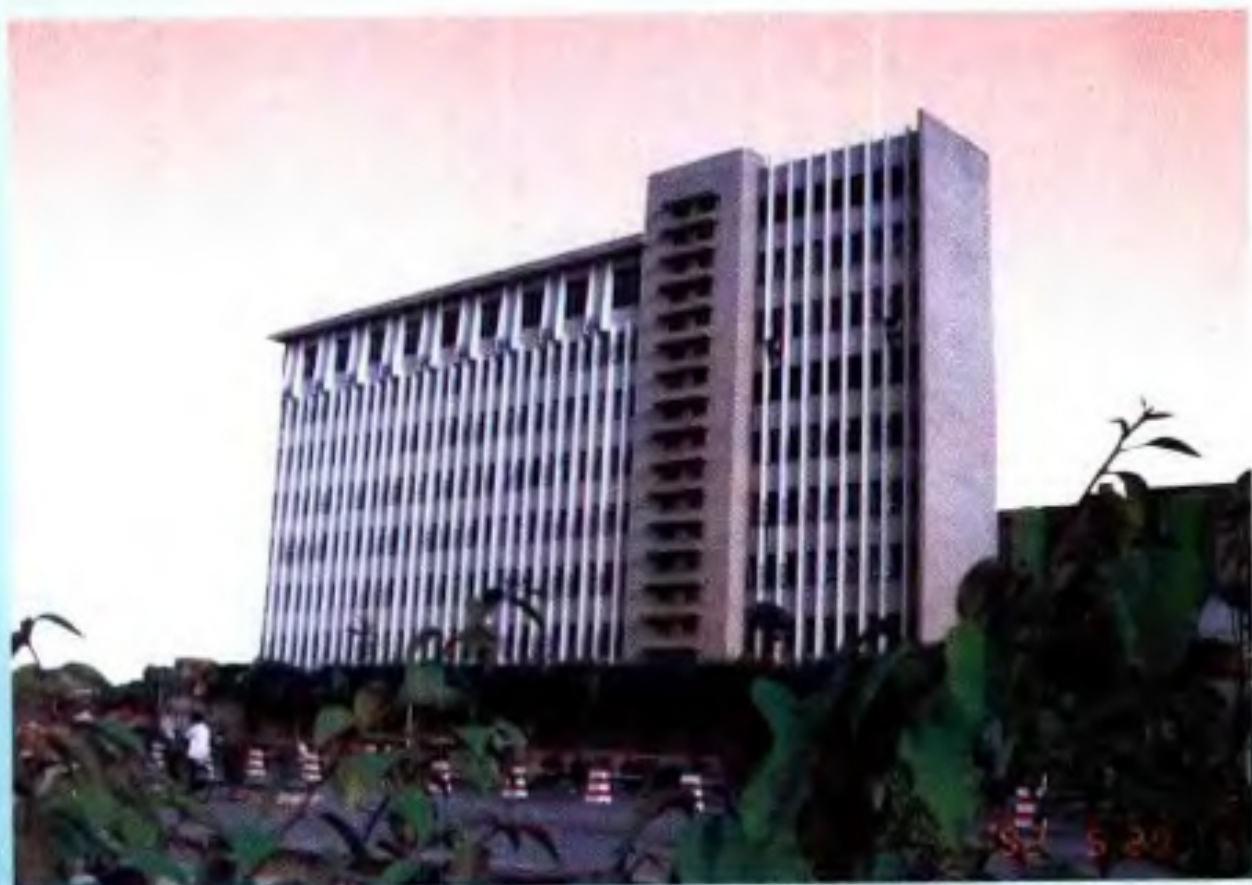
广西壮族自治区出版总社、新闻出版局、版权局大楼（南宁市民族大道68号）