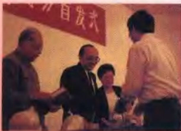
1990年9月13日，中顾委常委陈锡联（左一）、国家体委主任伍绍祖（左二）、副主任张彩珍（左三）出席广西民族出版社在北京举行的《中华民族传统体育志》首发式。