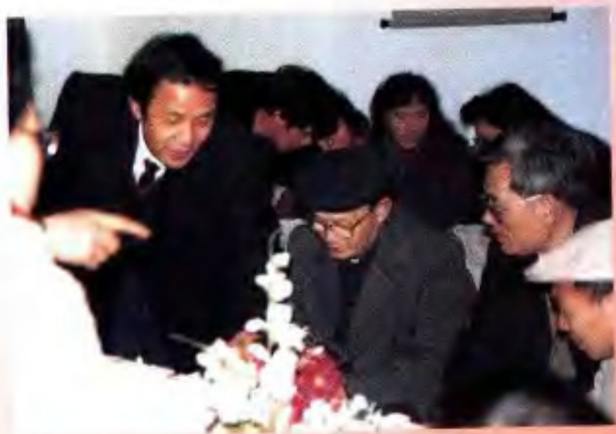
1991年1月31日，国家教育委员会副主任朱开轩（中）在自治区教育委员会主任李林（右二）和广西师范大学校长陈光旨（右一）的陪同下视察广西师范大学出版社。