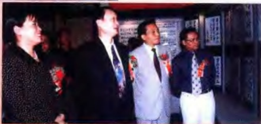
1997年10月，自治区党委副书记杨基常（左二）、自治区党委常委、宣传部部长潘琦（右一）和新闻出版署副署长桂晓风（右二）、中宣部出版局副局长张小影（左一）参观广西出版成就展。