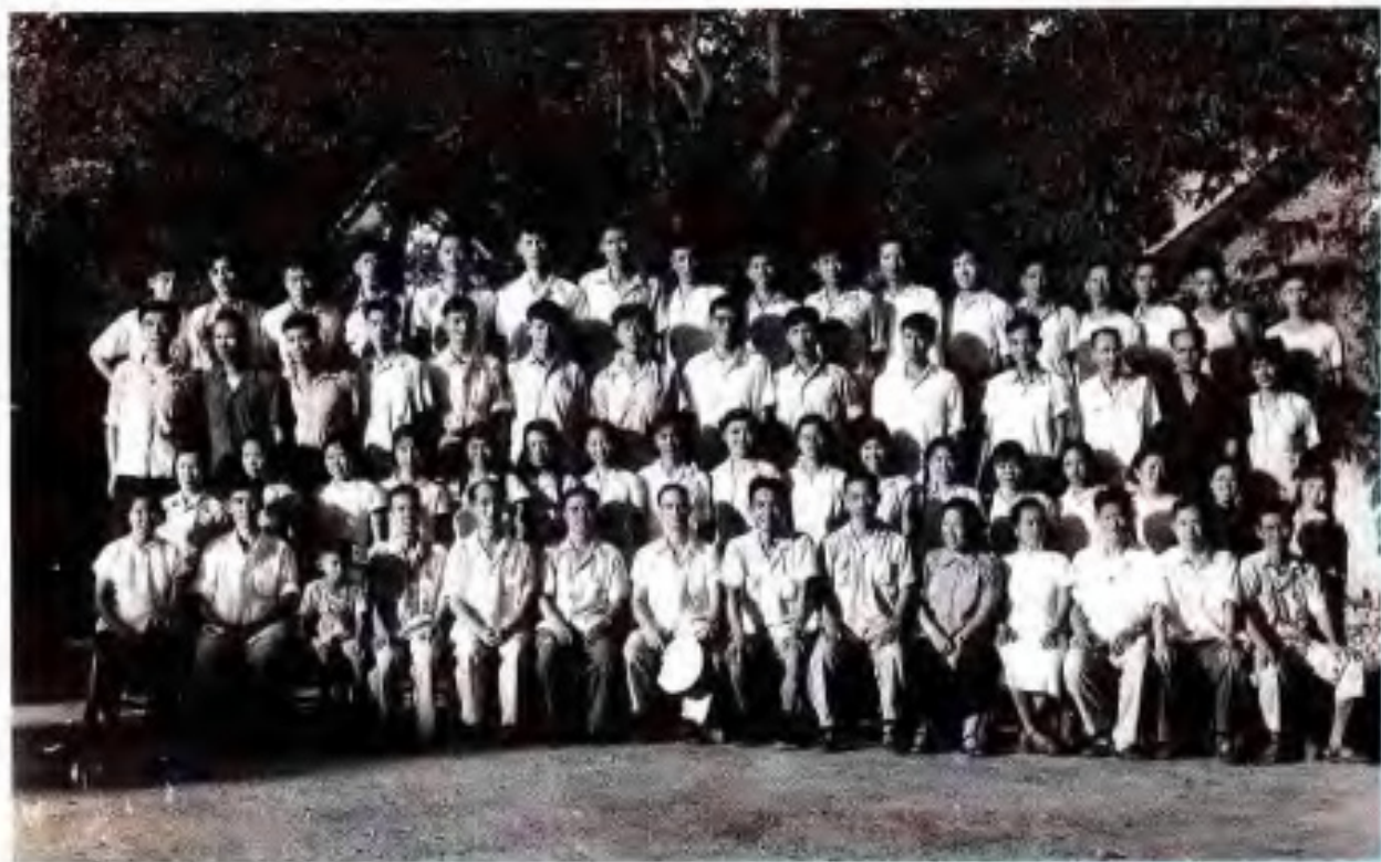
1962年9月18日，自治区党委宣传部、自治区文化局领导与广西人民出版社全体职工欢庆建社10周年，并合影纪念。