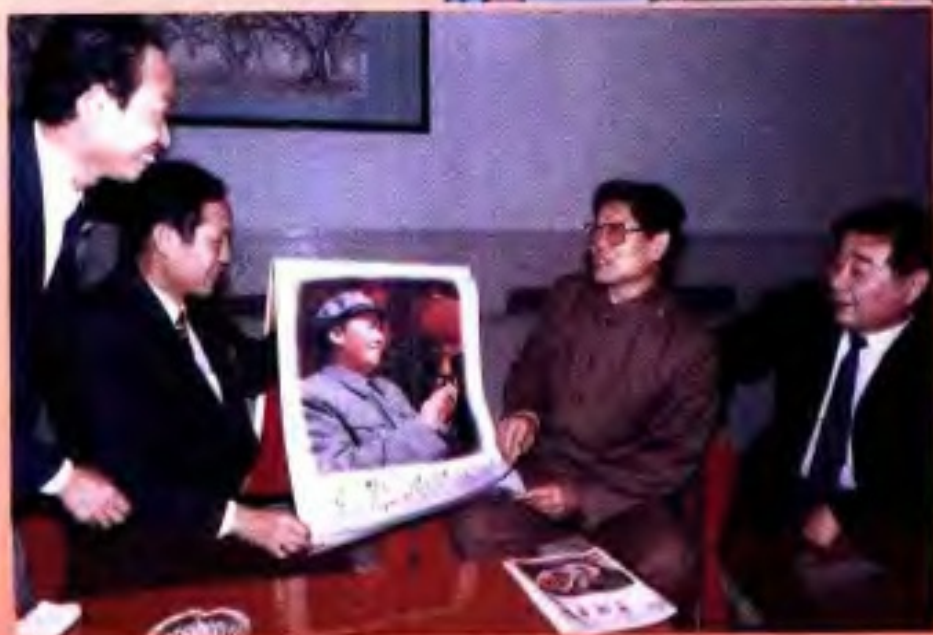
1991年11月，中共中央政治局委员、国务委员李铁映（右二）、自治区党委副书记刘明祖（右一）、自治区副主席李振潜（左二）观看广西美术出版社出版的挂历《祝你胜利》。