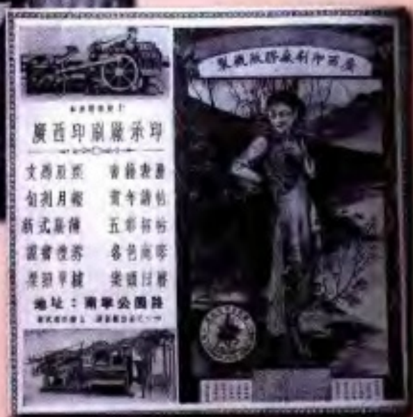
1936年广西印刷厂出版的 《广西一覽》广告插页