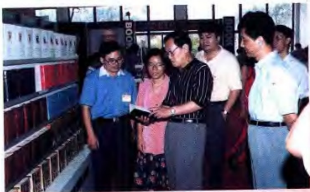
1997年10月，自治区副主席张文学（左三）在自治区新闻出版局局长阳建国（左四）、副局长夏永翔（右后一）、纪检组长李志鹏（右前一）陪同下参观广西出版成就展。