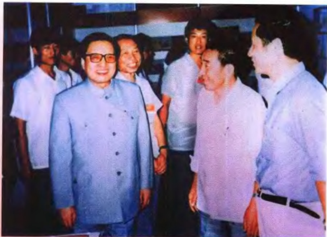
1988年8月，中共中央政治局常委、全国人大常委会委员长乔石（前左一）参观中国国际图书博览会广西展厅，右二为自治区新闻出版局副局长李文杰。