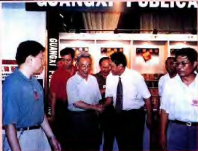
1996年7月，中共中央政治局委员、国务院副总理邹家华（左二）参观中国出版成就展广西展厅，自治区党委常委、自治区副主席袁正中（左三）迎接。