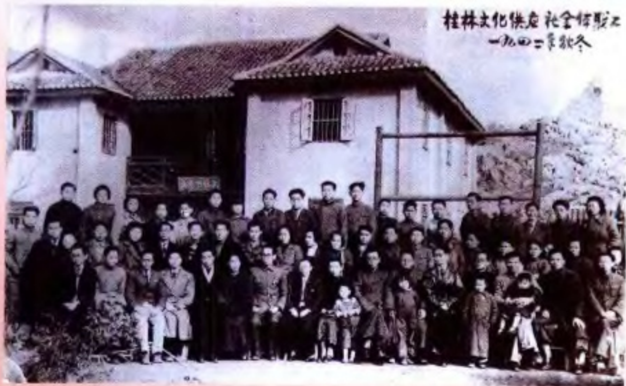
桂林丽君路桂林文化供应社股份有限公司（1942年）