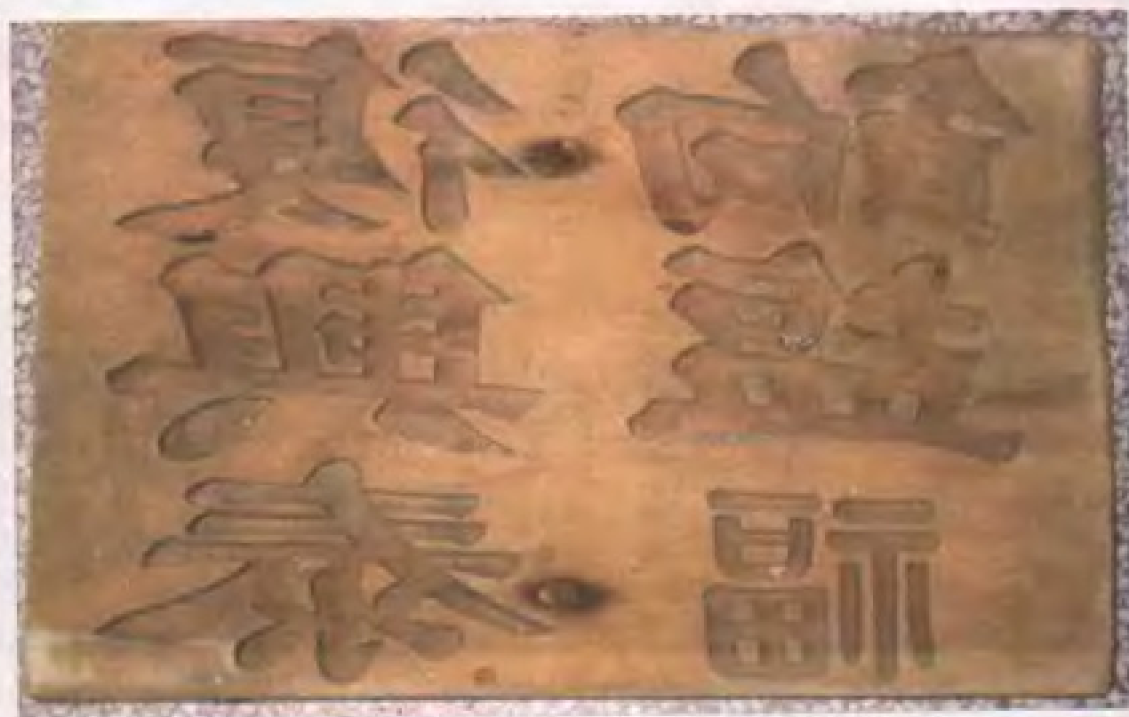
图为清末用于禁封盐仓用之印鉴。