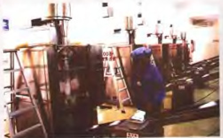
90年代中期，广东采用全自动生产线，使食盐包装进一步提高，工作效率也大大提高。图为工人操作生产线。