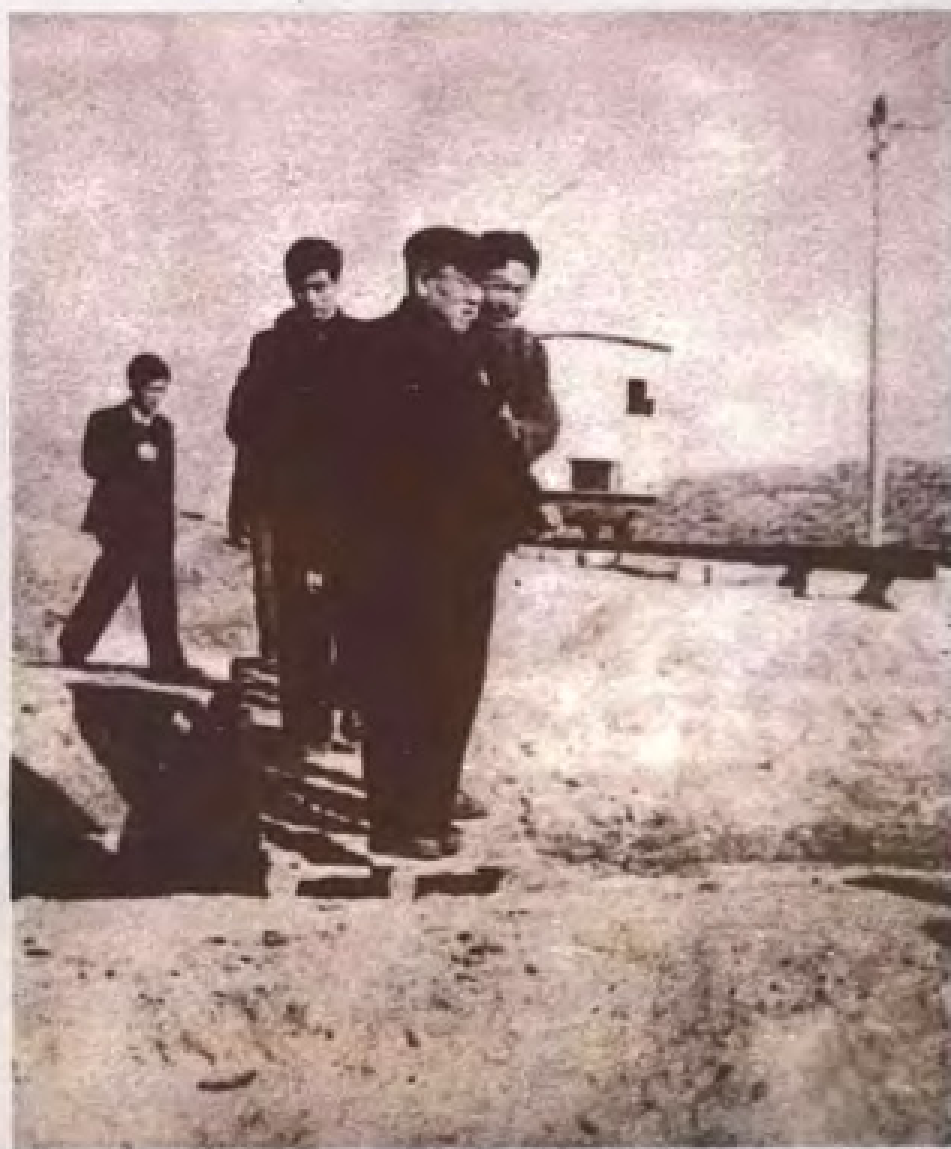
1962年2月，最高人民法院院长谢觉哉（前）在莺歌海盐场视察海盐场建设工地。并在归途中吟诗称赞莺歌海：“莺歌如海旧名扬，又是盐场基建忙。一路椰荫途艇静，天涯海角好家乡。”