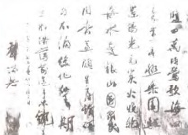
1962年7月，全国人大常委会副委员长郭沫若视察莺歌海盐场，并挥笔题诗。