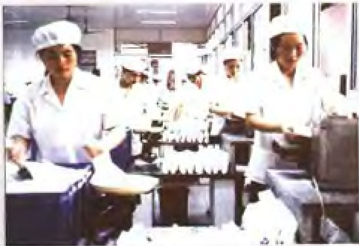
90年代以前，广东食盐都是手工包装。图为包装车间。