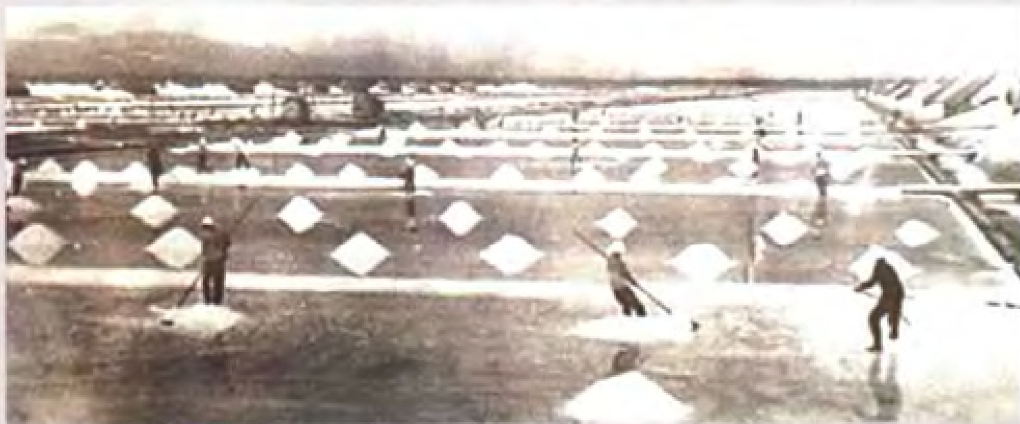
莺歌海盐场原盐喜获丰收。

1951年，两广盐区通过开展反封建斗争运动，盐民阶级觉悟提高，纷纷自觉保产保税。图为潮汕河西盐场盐民自动锄开过去设在盐田输卤沟下埋藏私盐的机关。