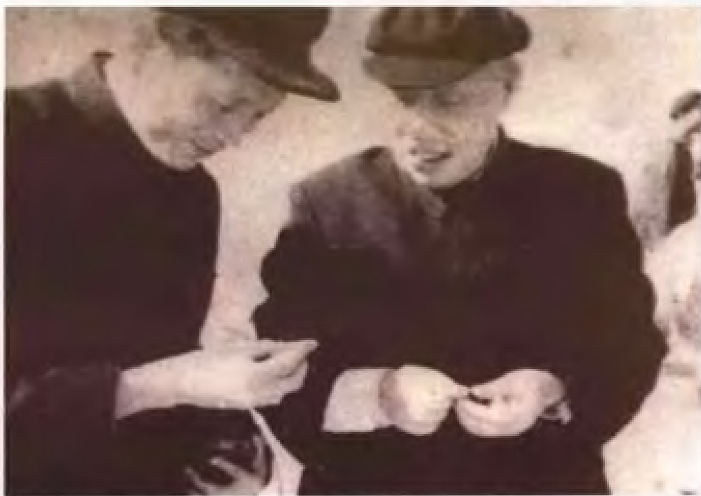
1962年2月，国家副主席董必武（右一）到莺歌海盐场视察。图为原两广盐务管理局局长何世庸向董必武介绍原盐生产情况。