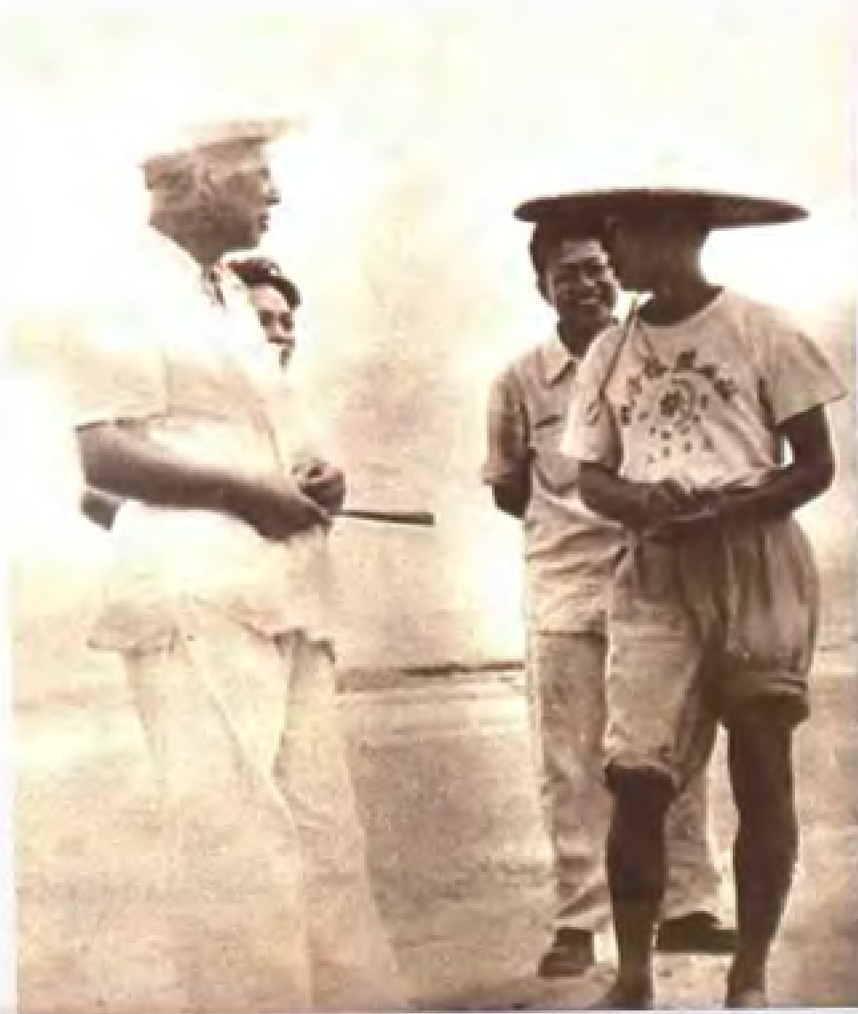
广东省省长陈郁十分关心广东盐业生产，在1958年至1961年间，多次到盐场了解原盐和盐化工的生产情况，并深入现场与老工人交谈。