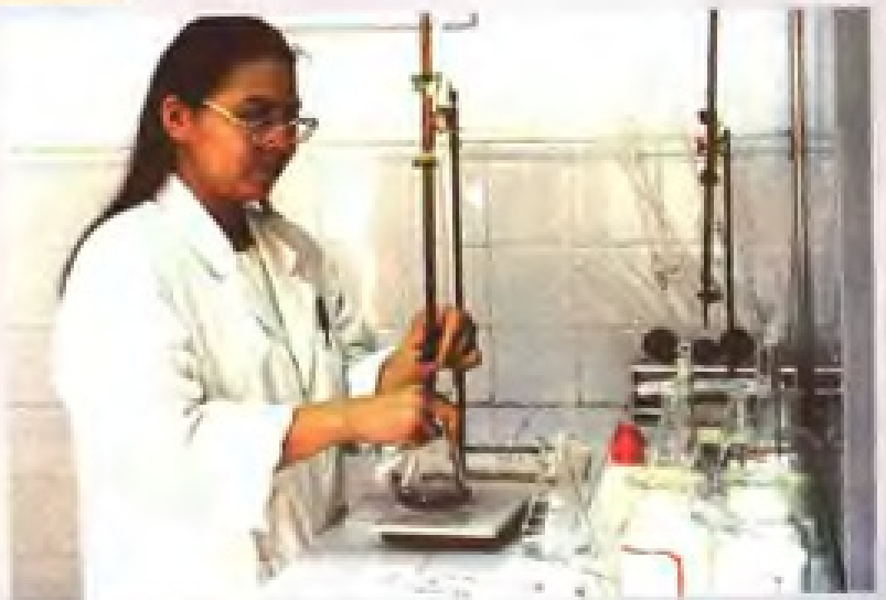
化验员对出厂食盐进行检测。