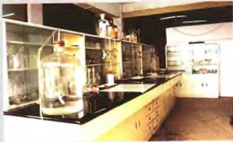
为保障人民身体健康，食盐从生产——加工——销售都必须经过严格的检验。因此各盐业公司都配备化验室。图为化验室一角。