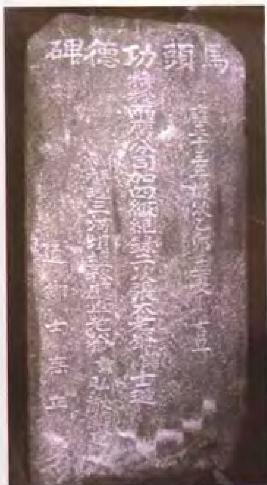
图为清朝雍正十三年（1735年），在大埔县三河坝发现为表彰建码头有功而立的码头功德碑（右图为碑文）。