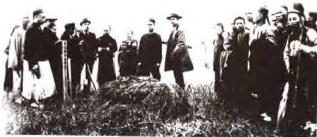
1898年6月9日，清政府被迫与英国签订不平等条约《展拓香港界址专条》：租借“新界”给英国，租期99年。次年，英国强迫清政府签订《香港英新租界合同》，拟定“新界”界址走向。图为中英官员在标定粤港边界。