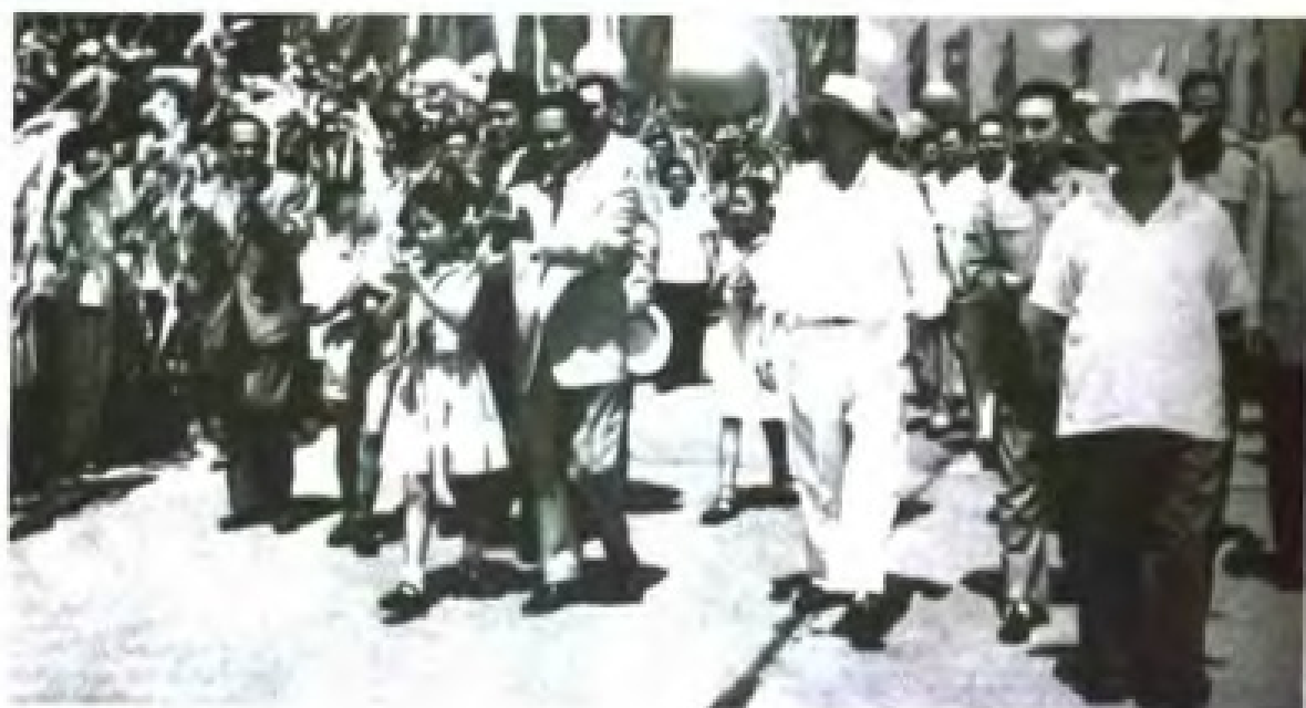
1958年11月，在周恩来总理的陪同下，朝鲜首相金日成访问广东。图为广州数十万群众欢迎金日成首相。