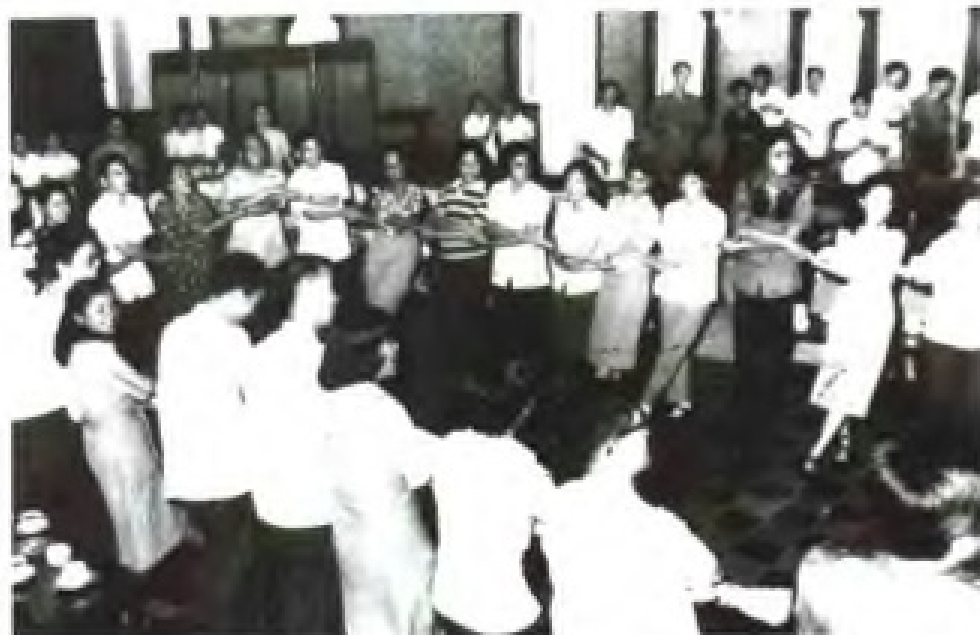
1978年6月20日，为庆祝中 菲建交3周年，菲律宾大学无伴 奏合唱团来穗演出。