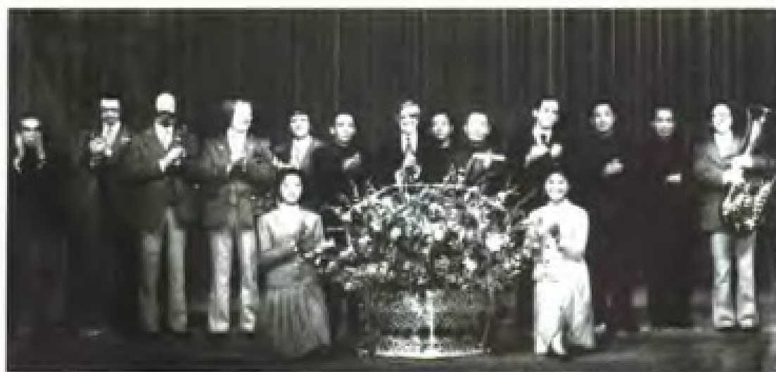
加拿大铜管乐团 演员演出结束后合影 留念。