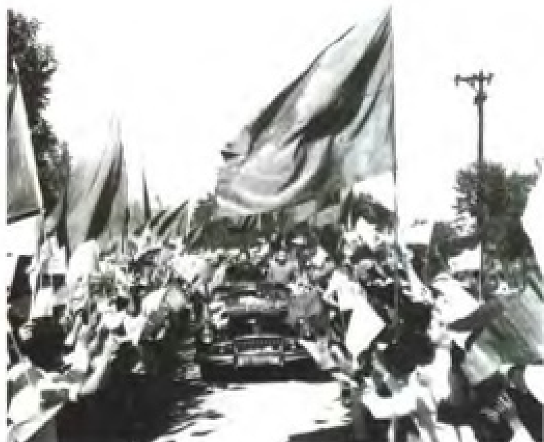
1958年11月27日，广州二十多万人夹道欢迎前来访问的朝鲜首相金日成。车中右起为周恩来总理，金日成首相，陈郁省长。