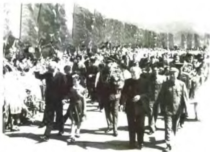
1964年11月，阿富汗国王查希尔（左一）由国家副主席董必武（右二）陪同访问广东。