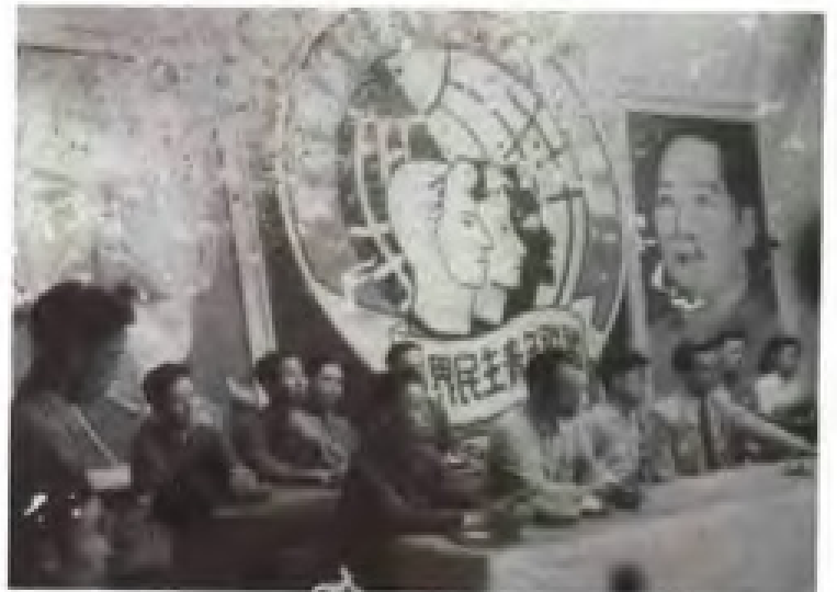
1950年10月10日苏联经济学家包德列夫到南方大学访问。