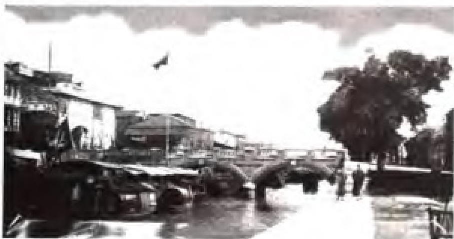
第二次鸦片战争后，英法依据不平等条约强租广州沙面。图为1865年的沙面租界。