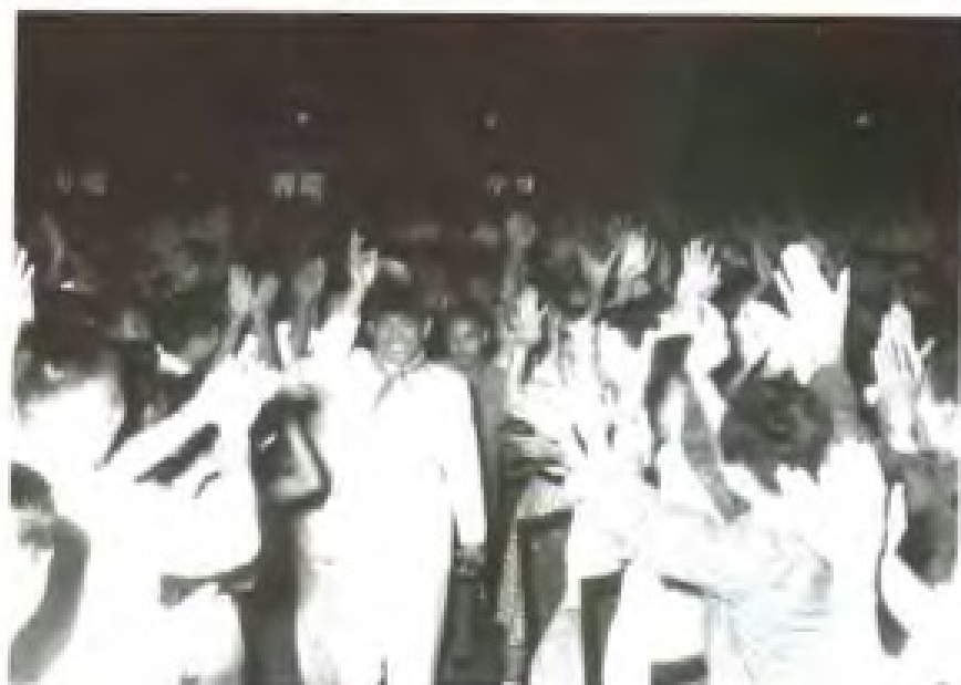
1956年，印尼总统苏加诺在陈毅外长陪同下访粤。