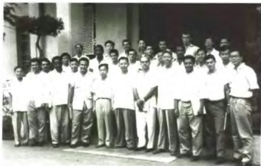
1966年在粵的古巴水利實習生全體成員合照留念。