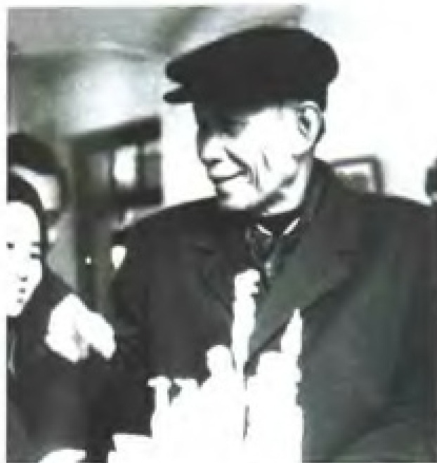
1975年1月22日，柬埔寨民族团结政府首相宾努在肇庆工艺厂参观。