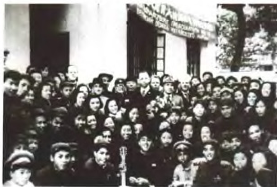
1952年，苏联演员在广东和广州青年朋友合影。