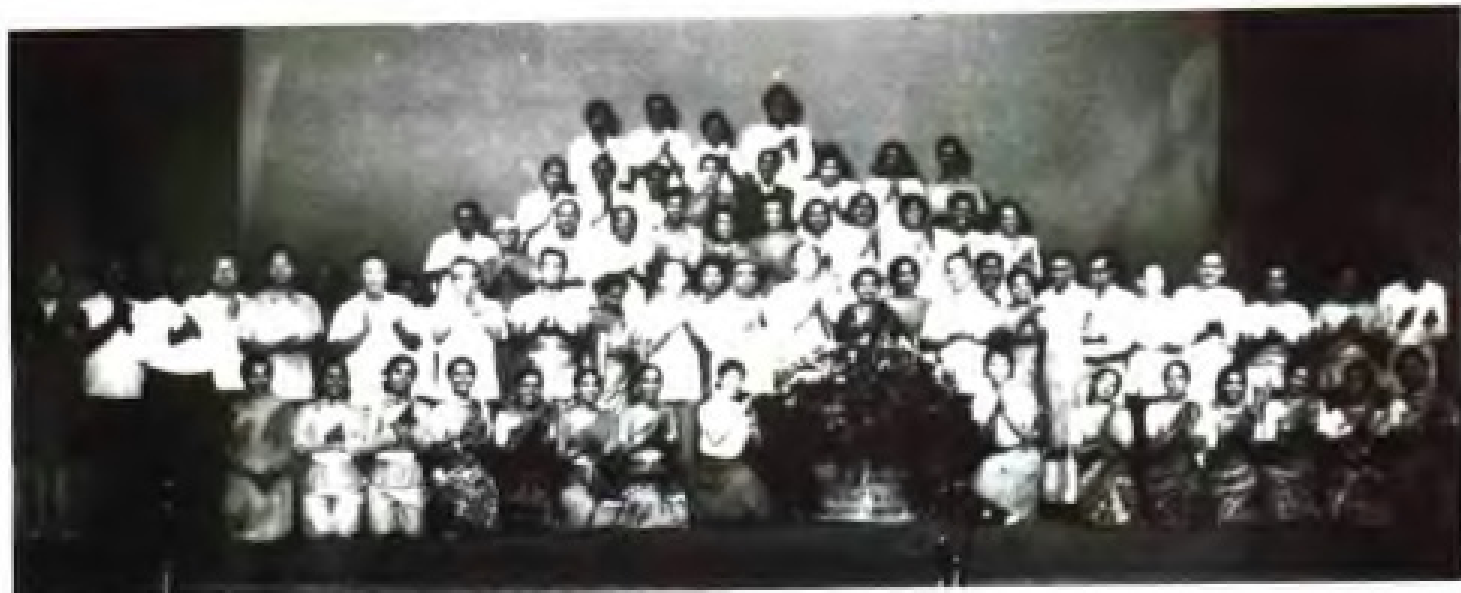
1977年8月1日，孟加拉国文化代表团在广州演出。