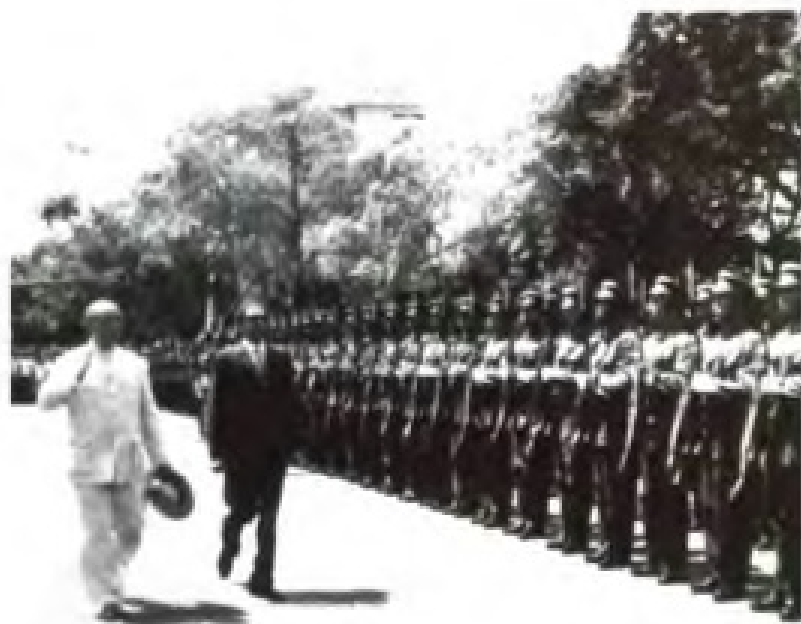
1962年，尼泊尔国王马亨德拉（右）在国家副主席董必武（左）陪同下访问广东。图为宾主检阅陆军仪仗队。