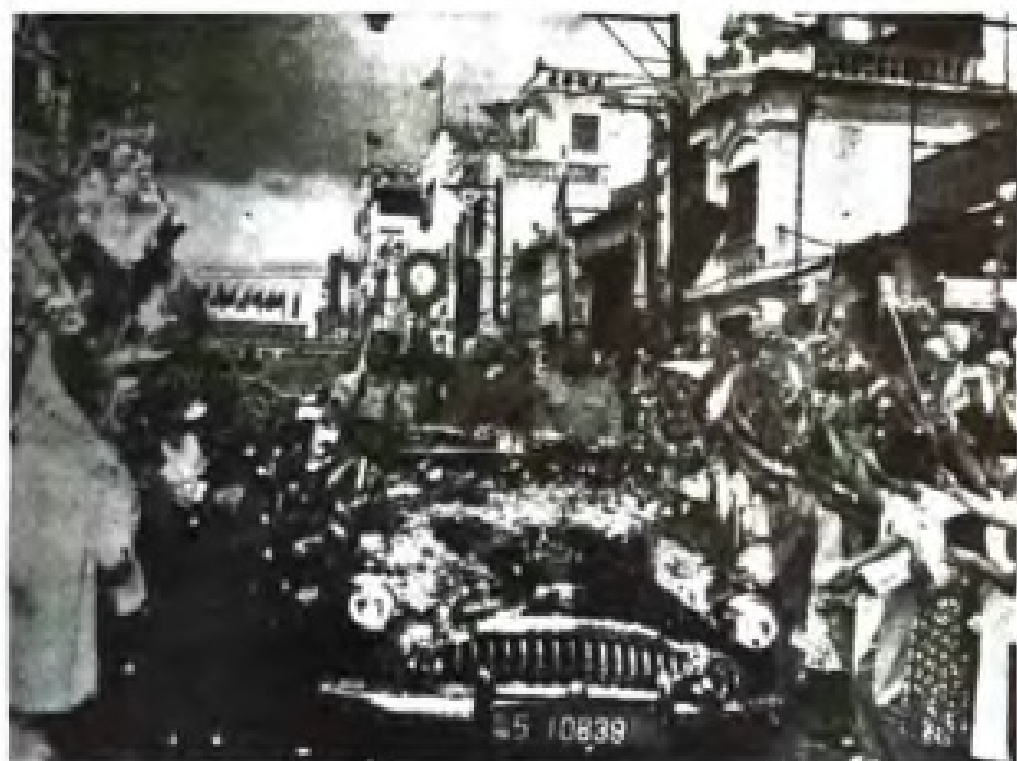
1963年9月21日，艾地率领的印度尼西亚共产党代表团，由中共中央副主席周恩来和中共中央书记处书记罗瑞卿陪同，从北京到达广州，受到中共中央中南局、广东省、广州市负责人及省市各界一千多人热烈欢迎。