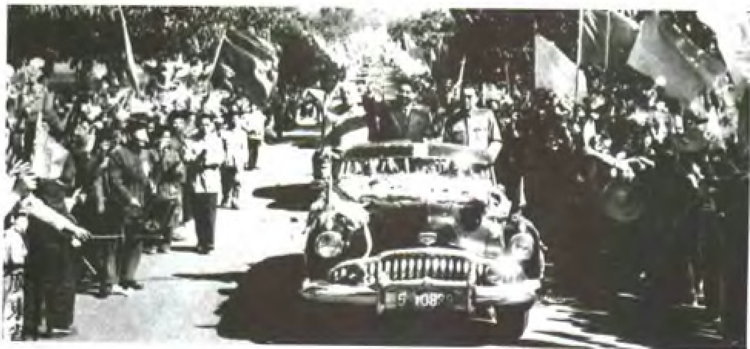
1957年4月28日，苏联最高苏维埃主席团主席伏罗希洛夫在彭真副委员长和陶铸省长的陪同下到广州访问，受到市民的热烈欢迎。