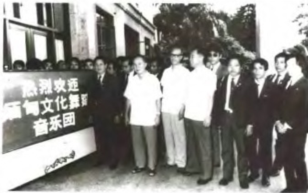
欢迎缅甸文化舞蹈音乐团到访，宾主合影留念。