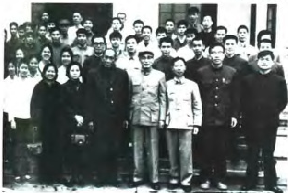
1975年1月22日，柬埔寨民族团结政府首相宾努和夫人访粤。图为广东省省长王守道会见宾努首相一行。