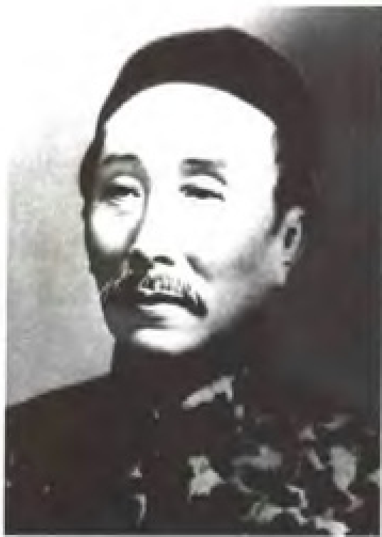
1922年6月23日，外交家、法学家，广东省省长伍廷芳因陈炯明叛变，悲愤得疾，不治逝世。