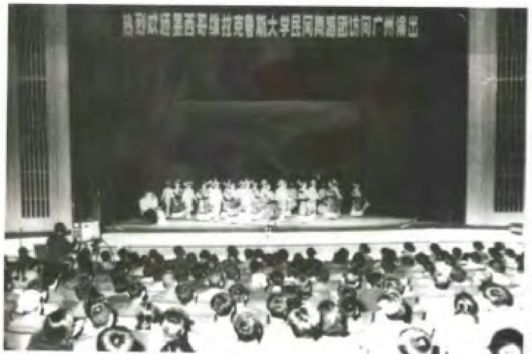
1978年12月24日，墨西哥维拉克鲁斯大学民间舞蹈团访问广州。