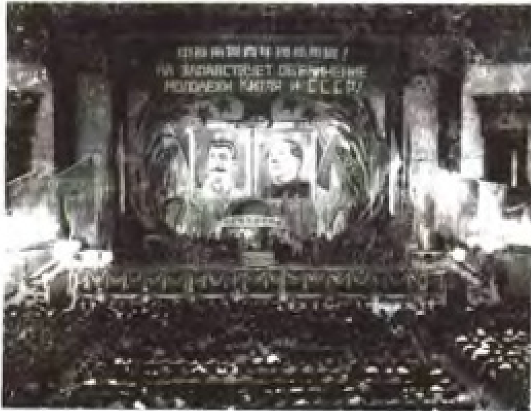
1950年5月12-15日，苏联青年代表团抵穗参观访问，图为欢迎大会会场。