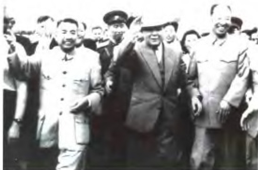
1957年4月，苏联最高苏维埃主席伏罗希洛夫（前排右二）在彭真副委员长（前排右一），陶铸省长（前左一）等领导的陪同下访问广东。