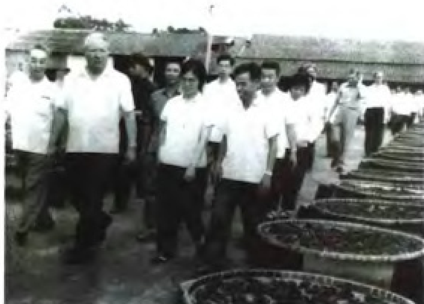
1974年6月1日，英国前首相，保守党领袖希思访粤。图（上，右）为客人在广州罗岗公社参观。