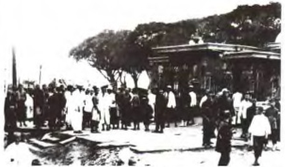
1924年6月30日，广州沙面英法殖民者以范鸿泰事件为借口，制订侮辱广州人民出入沙面的“新警律”。7月15日，沙面3000多洋务工人举行抗议罢工，迫使英法租界当局取消“新警律”，8月17日罢工胜利结束。图为罢职场面。