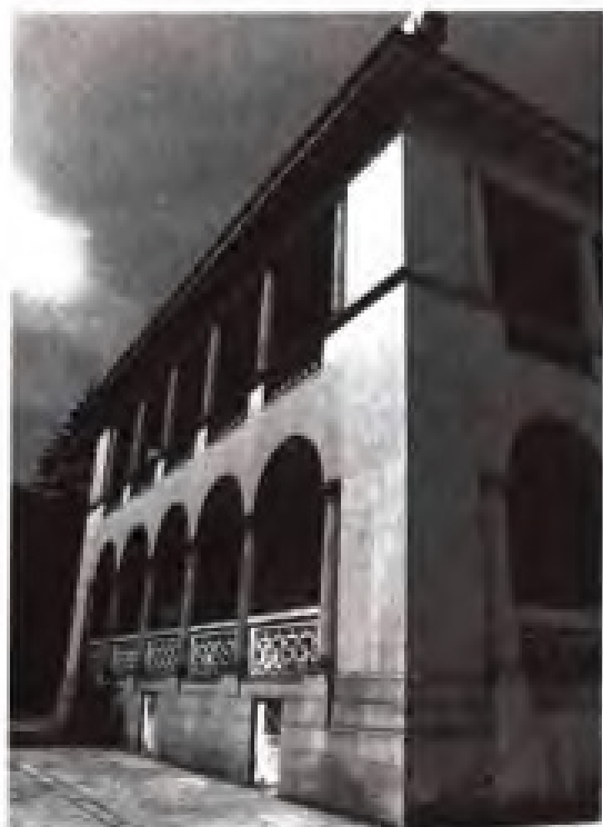
1860年，美国在汕头设立领事署，由德记洋行商人巴力斯兼任领事。