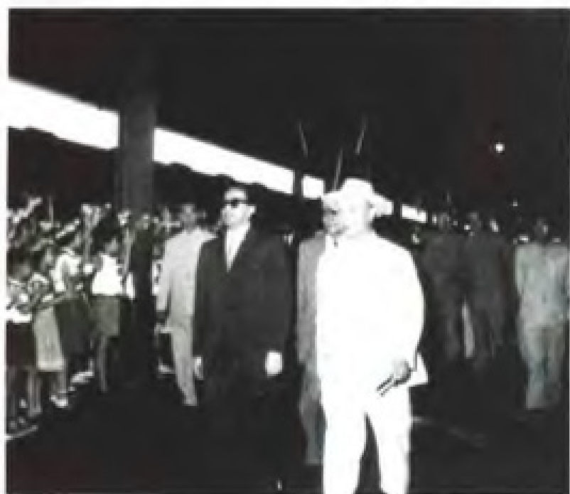
1962年，尼泊尔国王马亨德拉（左）访问广东。陈毅副总理兼外长到车站迎接。