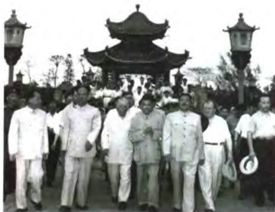
1957年4月，苏联最高苏维埃主席伏罗希洛夫一行访粤。图为彭真副委员长（前排左二）、贺龙副总理（前排左五）和陶铸省长（前排左四）陪同伏罗希洛夫参观广州起义烈士陵园。