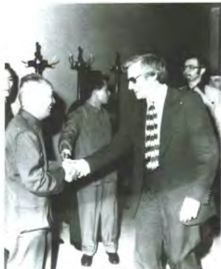
1977年3月23日，加拿大铜管乐团（五重奏）来粤演出。