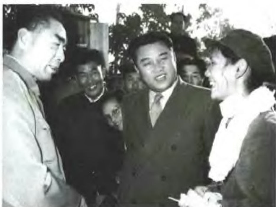
1958年11月，朝鲜首相金日成（中）在周恩来总理（左）陪同下参观广州市上游钢铁厂。