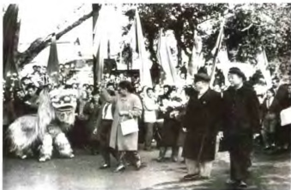
1962年12月，锡兰总理班达拉奈克夫人（左）访问广东。