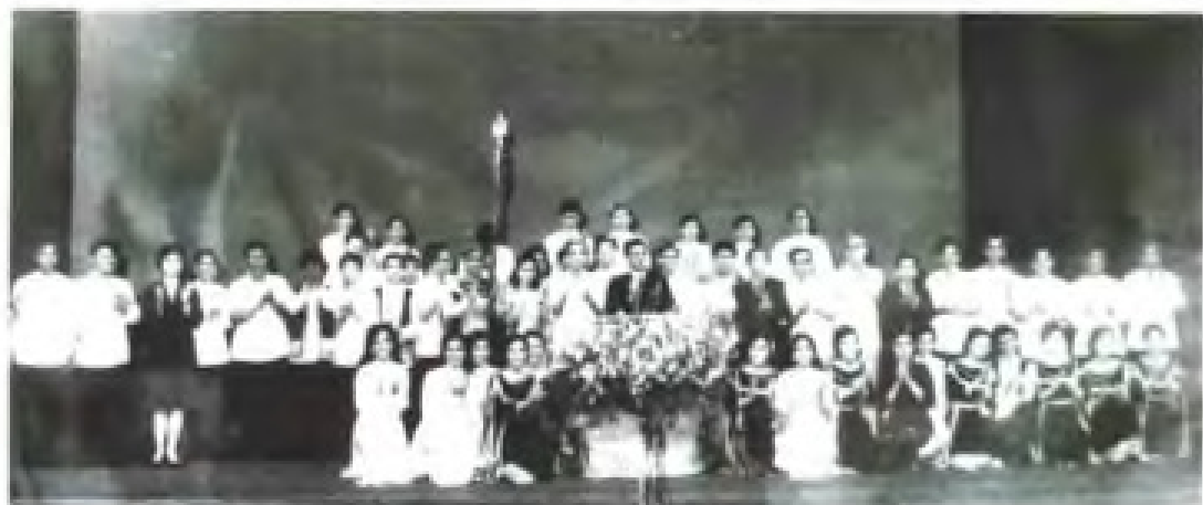
1977年7月5日，越南民族乐团来穗演出。