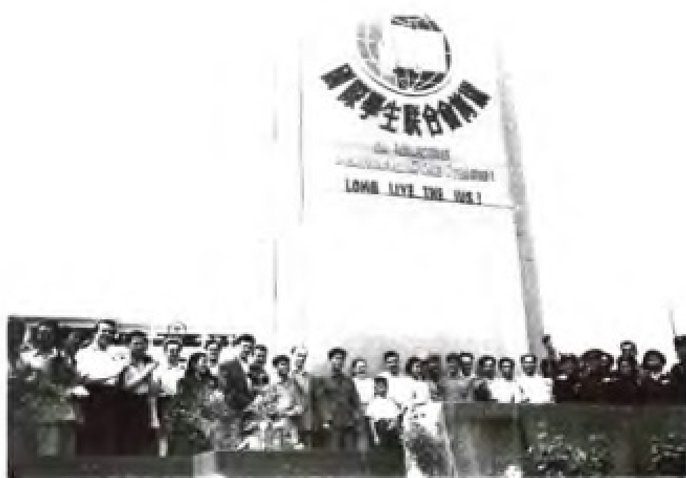
1951年5月13-16日，国际学生联合会参观访问团在广州参观访问。